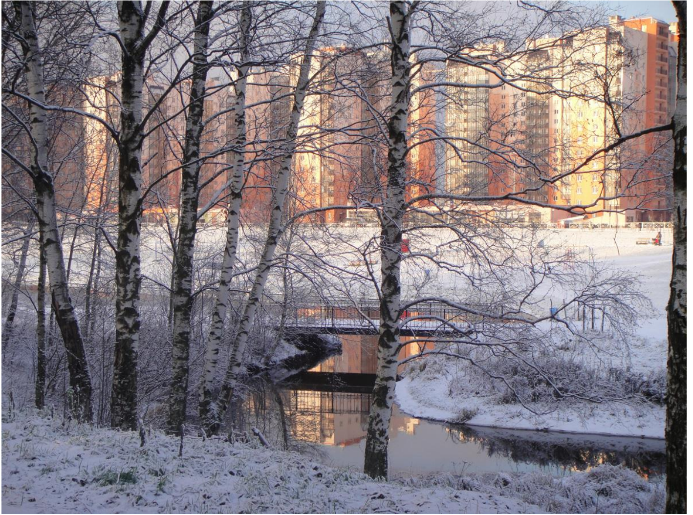
ВО ДВОРЕ - ДЕЙСТВУЮЩИЙ ДЕТСКИЙ САД С НАЧАЛЬНОЙ ШКОЛОЙ