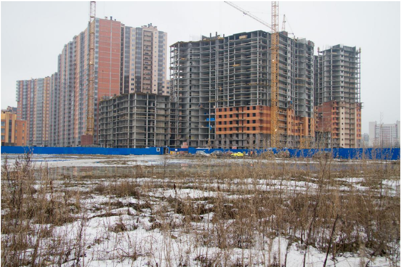
Вид со стороны Областной ул., секции 6-4, 35-34, 30-26, 25-22, 16-17, 18-19