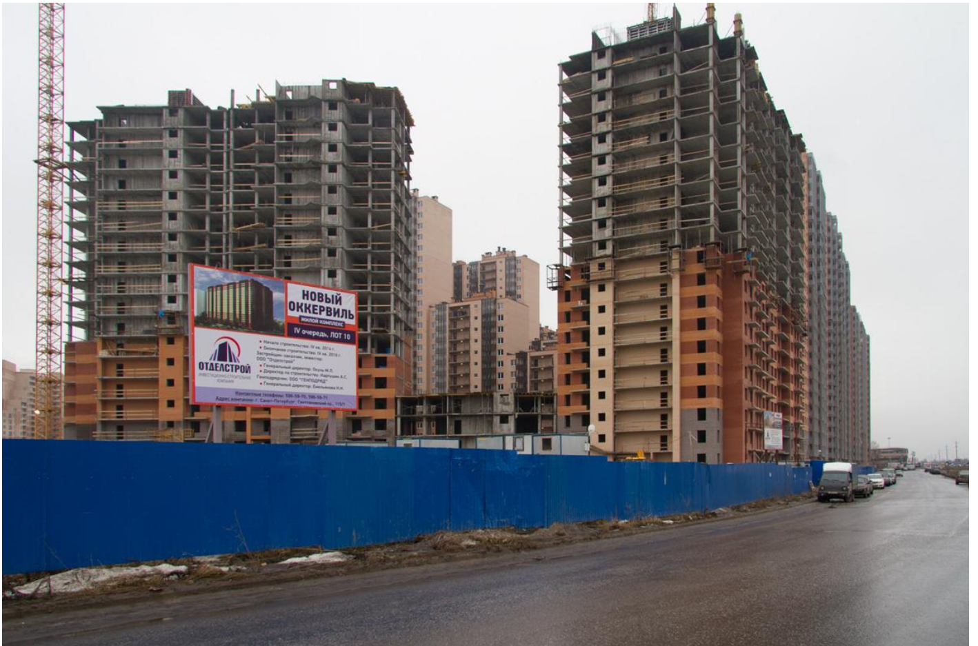
Вид со стороны Областной ул., секции 24-12