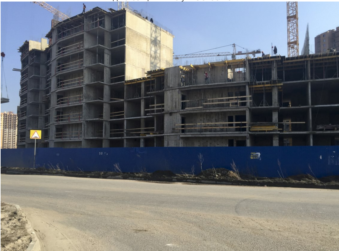
Вид на секции 7-6 с Областной ул.