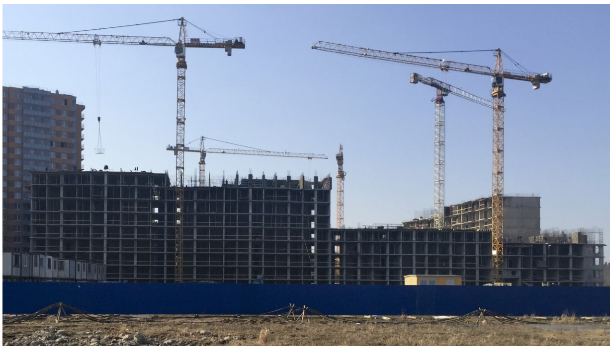
Вид на секции 11-7 со стороны Областной ул.