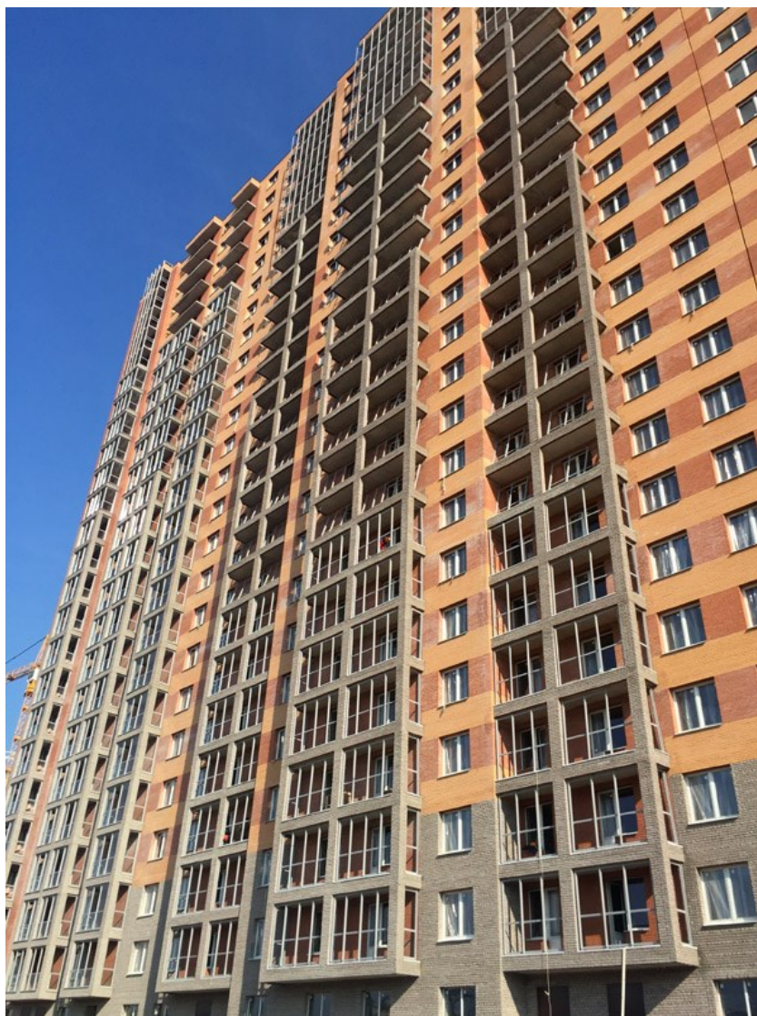
Вид со стороны Областной ул., секции 15-17 29.03.2016 ПУСКИ 1, 2, 3 (СДАНЫ)