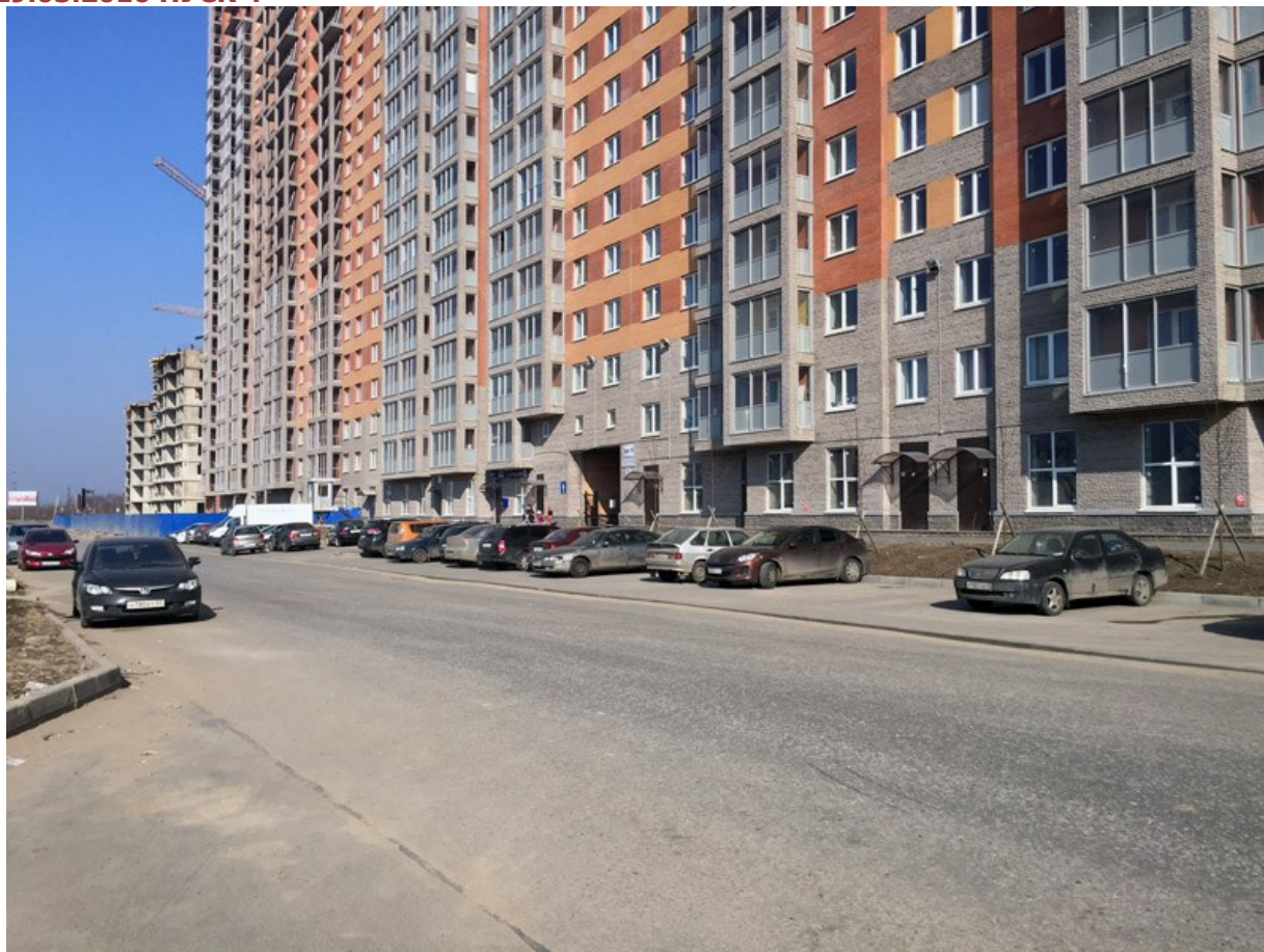
Вид со стороны Областной улицы, секции 15-19