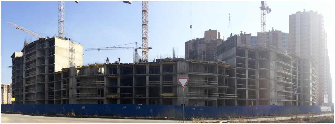
Вид на секции 8-1 (слева направо) со стороны Областной ул.