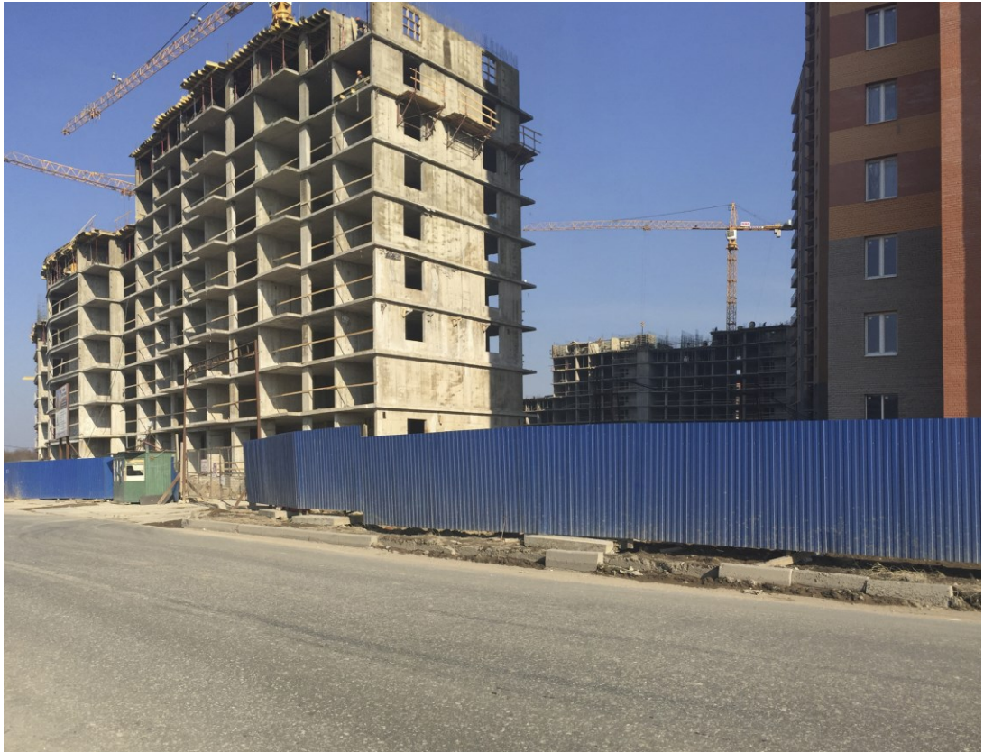
Вид на секции 1-2 с ул. Областная