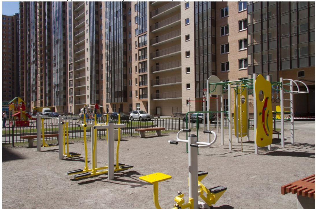
Благоустройство двора в 3-м пуске 3 очереди