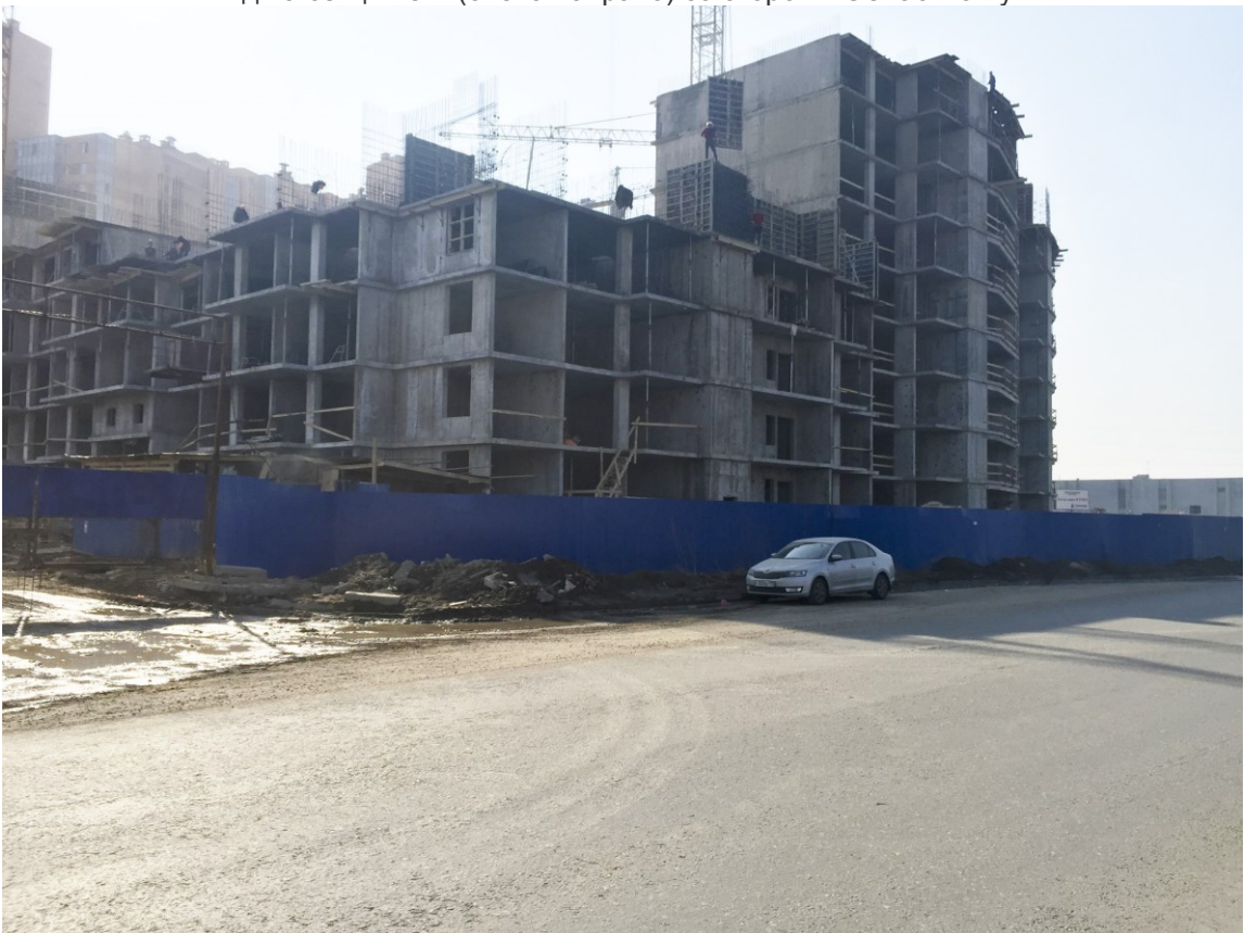
Вид на секции 9-7 со стороны Областной ул.