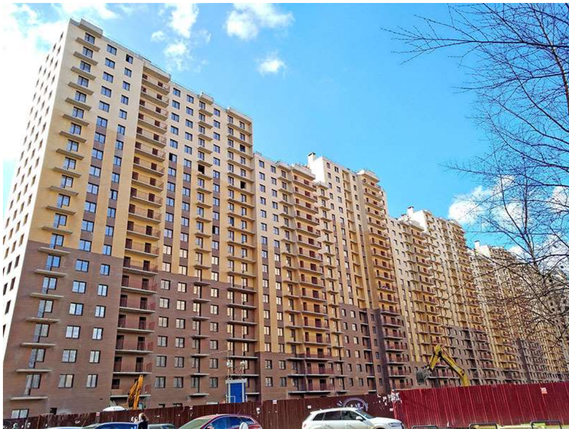
Вид на секции 1-9 со стороны Ленинградской ул.