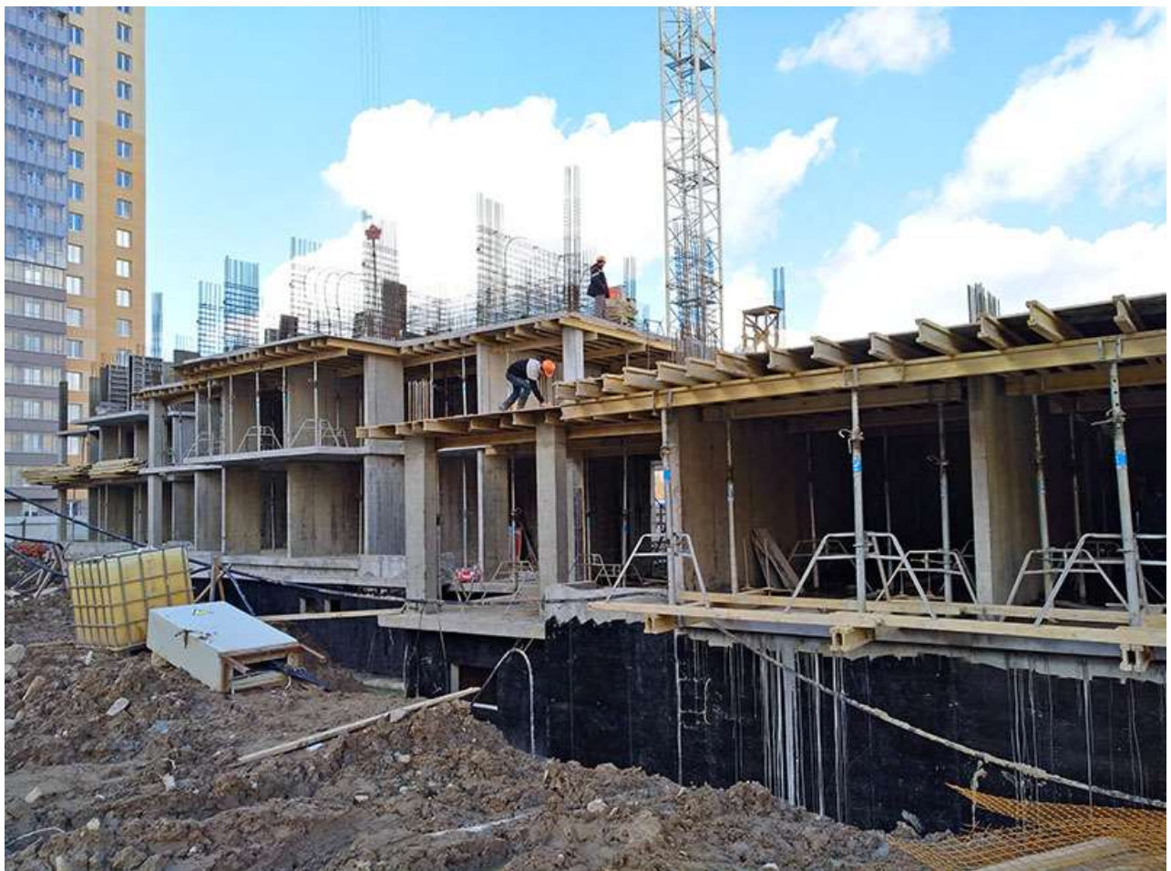
Вид на корпус 1 секции 1-2 со стороны Берёзовой ул.