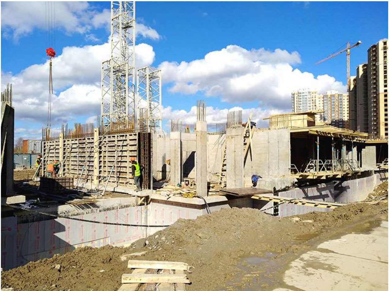
Вид на корпус 1 секции 3-5 со стороны Берёзовой ул.