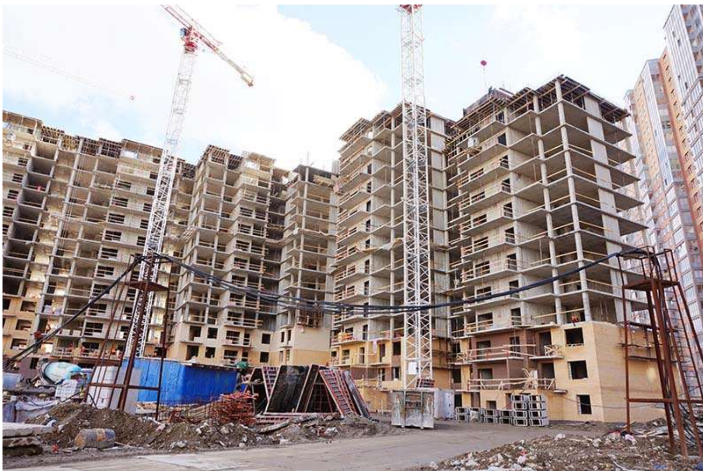
Вид на корпус 6 секции 17-15 со стороны Каштановой ал.