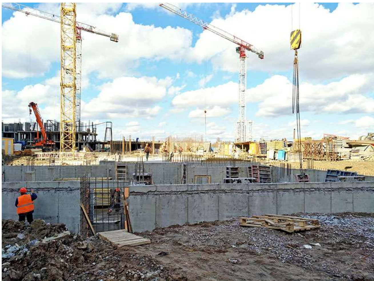
Вид на корпус 3 со стороны Берёзовой ул.