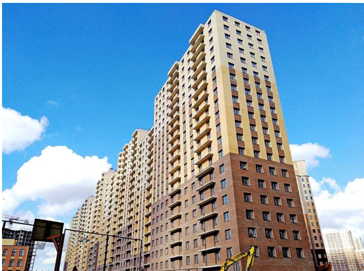
Вид на секции 9-1 со стороны Ленинградской ул.