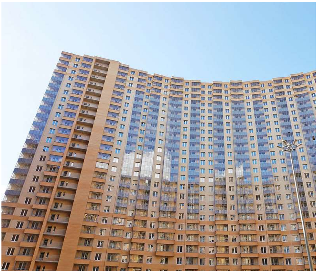
Вид на секции 1-4 со двора