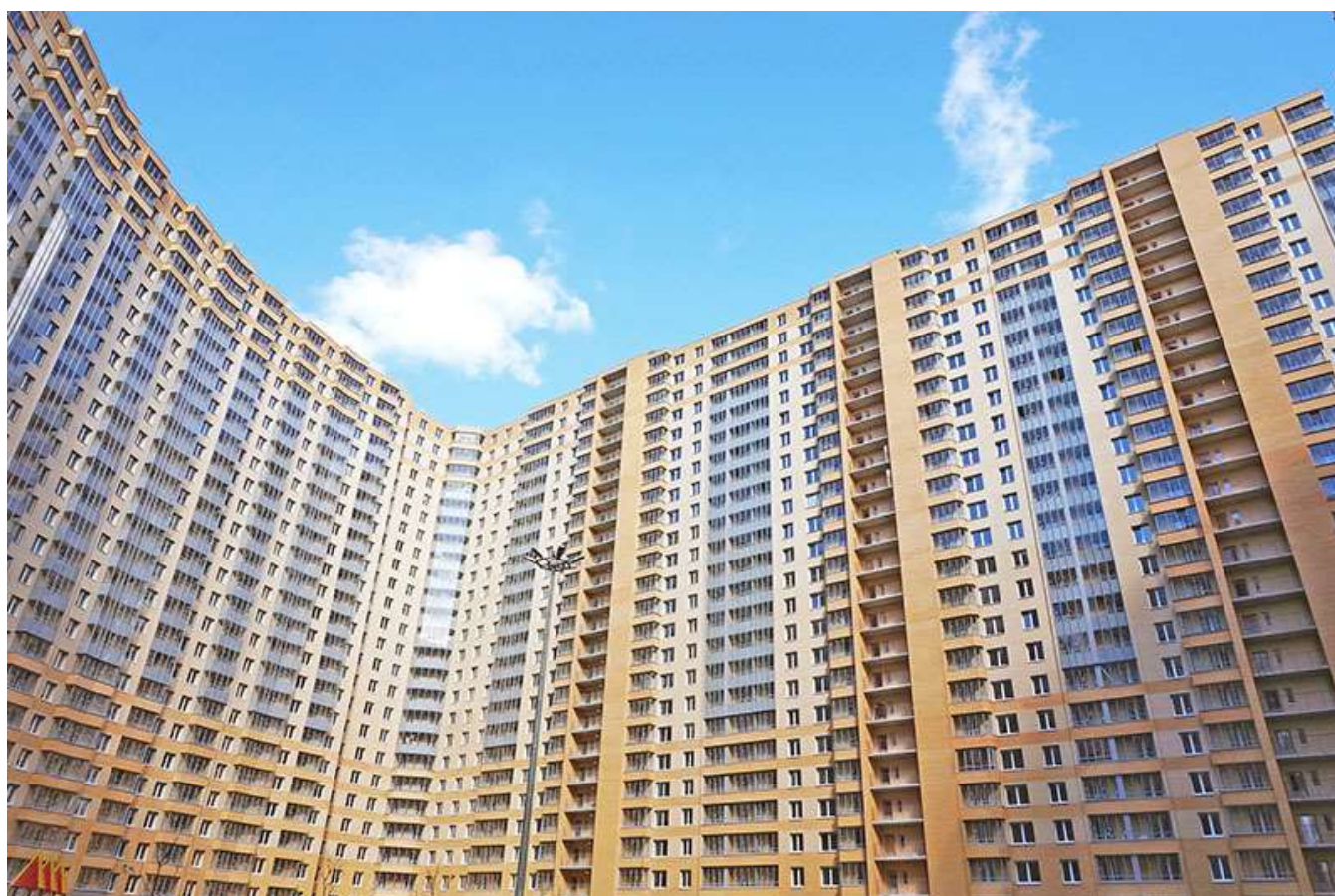
Вид на секции 3-9 со двора