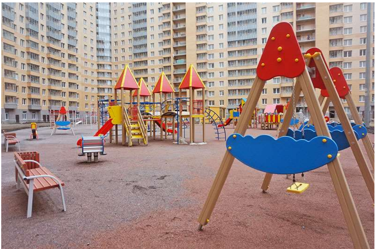
Вид на двор