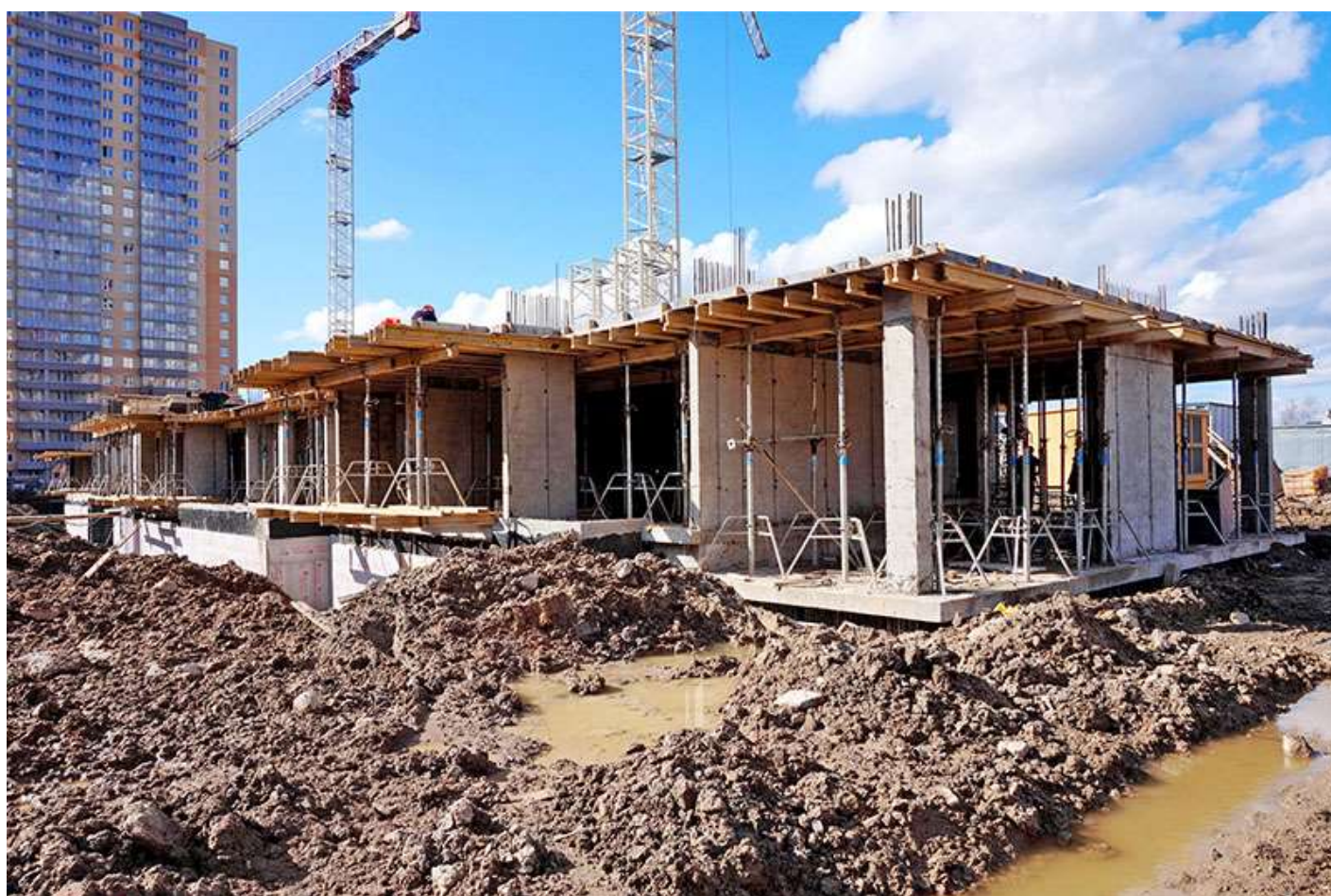
Вид на корпус 1 секции 1-6 со стороны Каштановой ал.