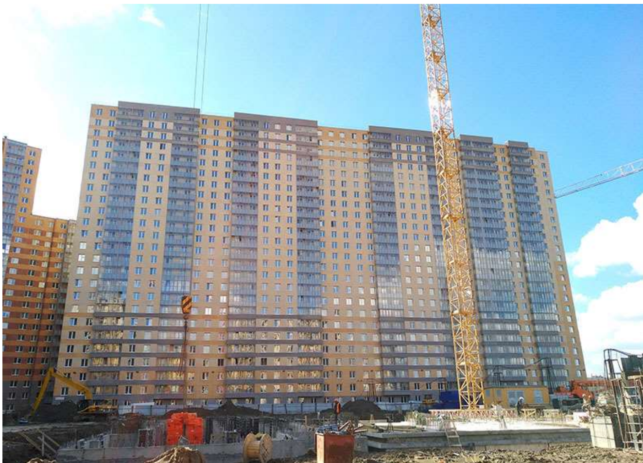
Вид на секции 11-8 с Областной ул.