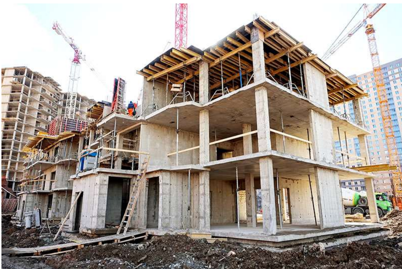
Вид на корпус 5 со стороны Областной ул.