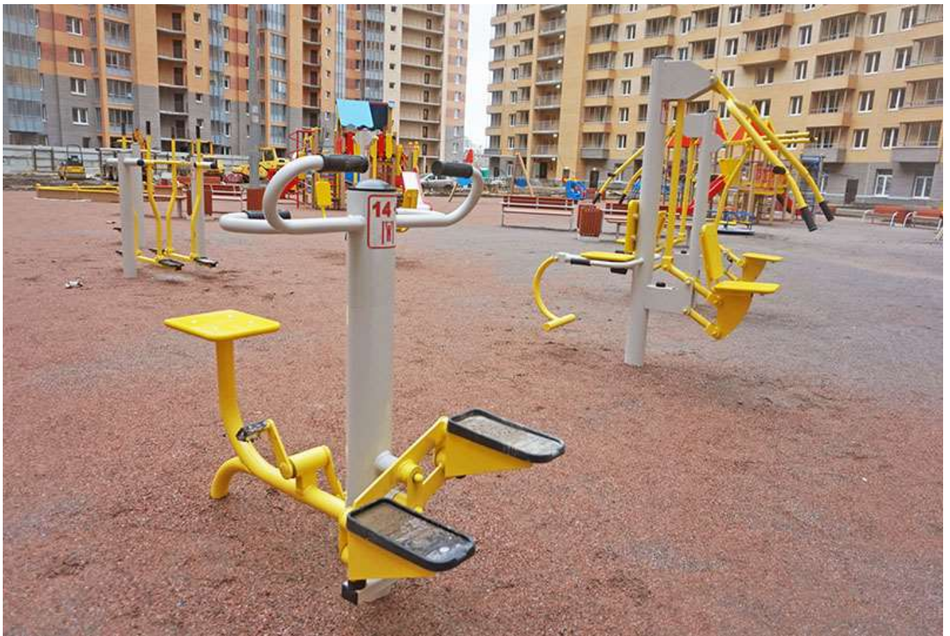
Вид на двор