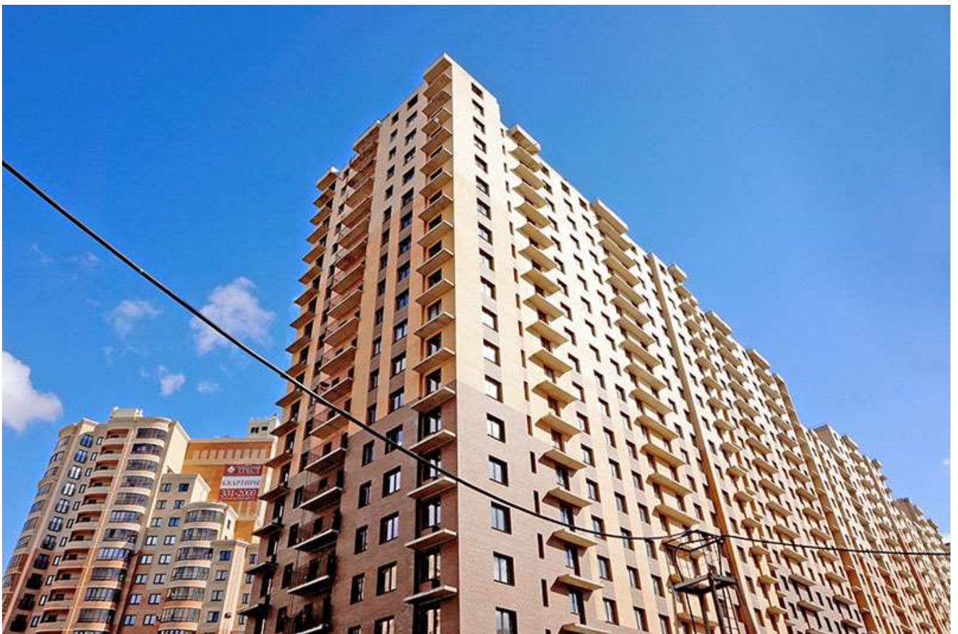
Вид на секции 9-5 со стороны Областной ул.