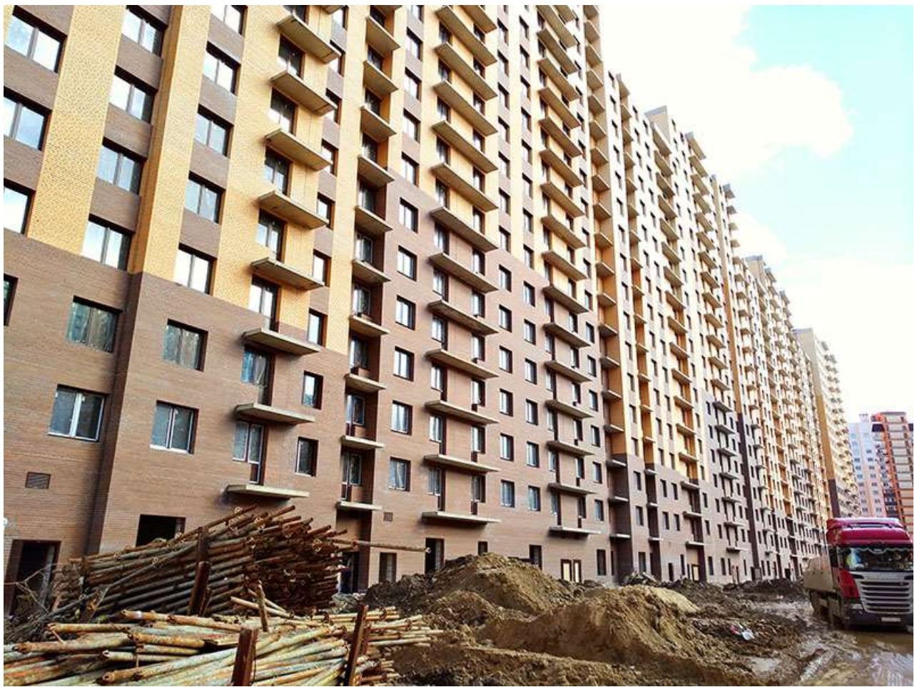
Вид на секции 5-1 со стороны Берёзовой ул.