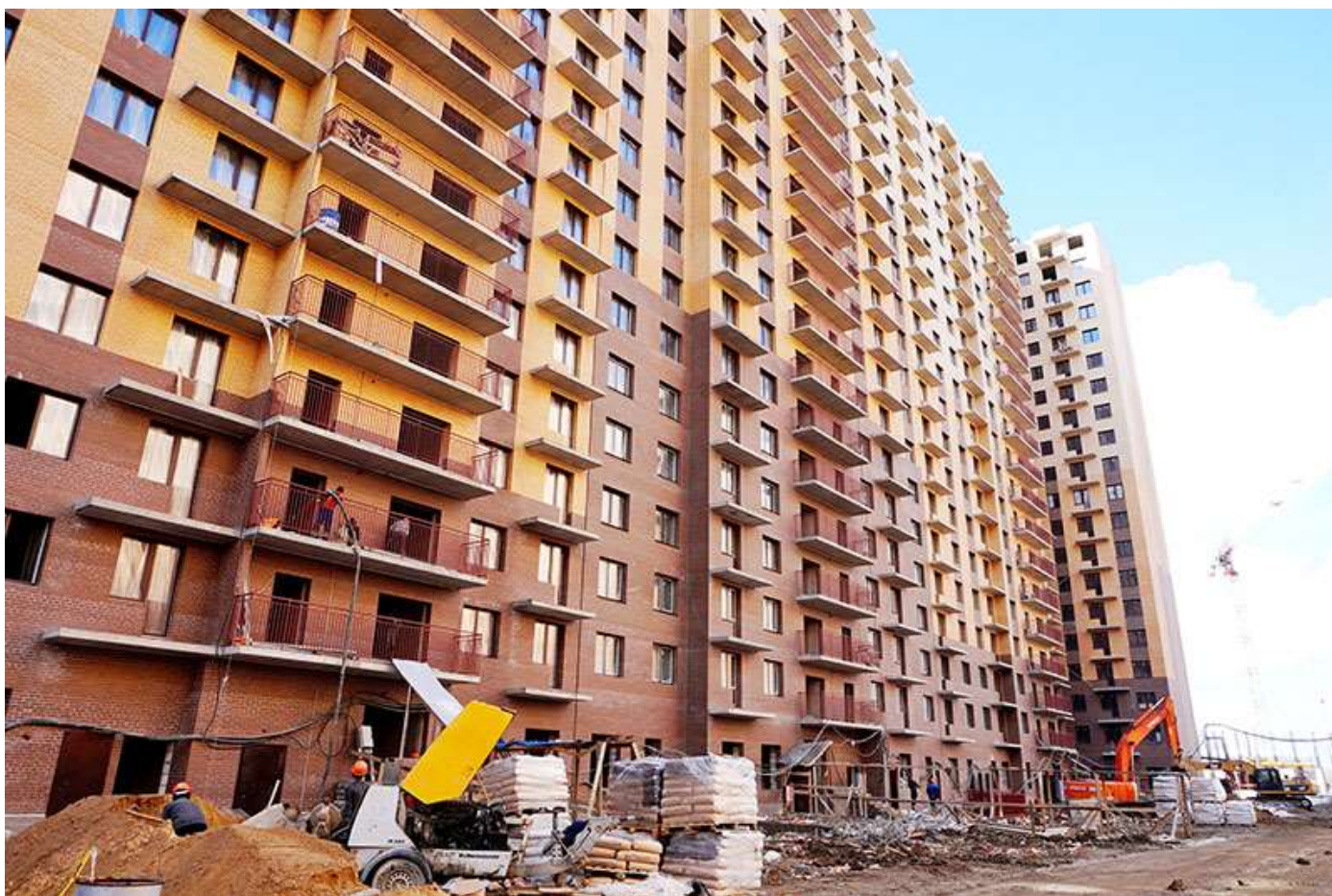
Вид на секции 7-9 со стороны Каштановой ал.