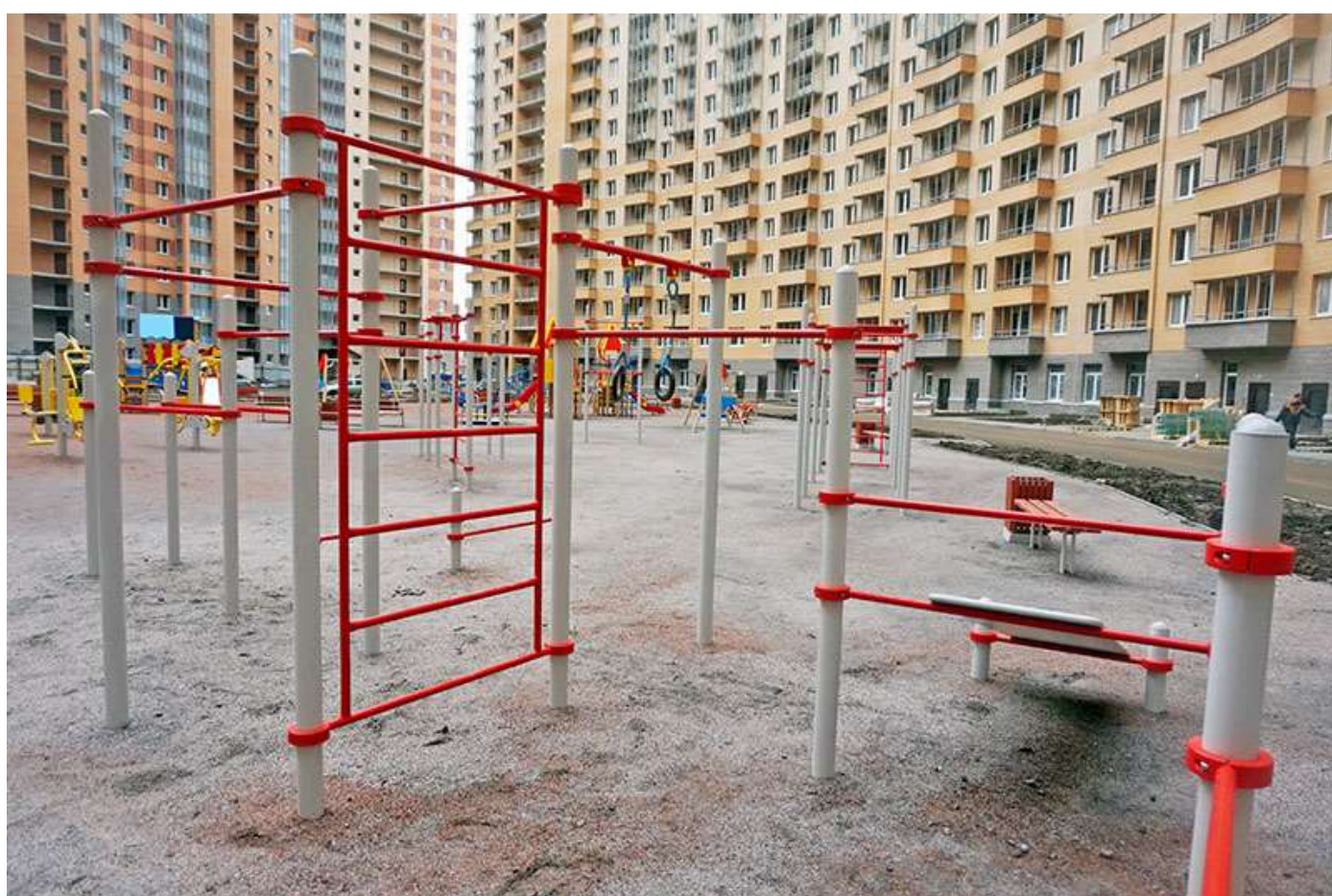
Вид на двор