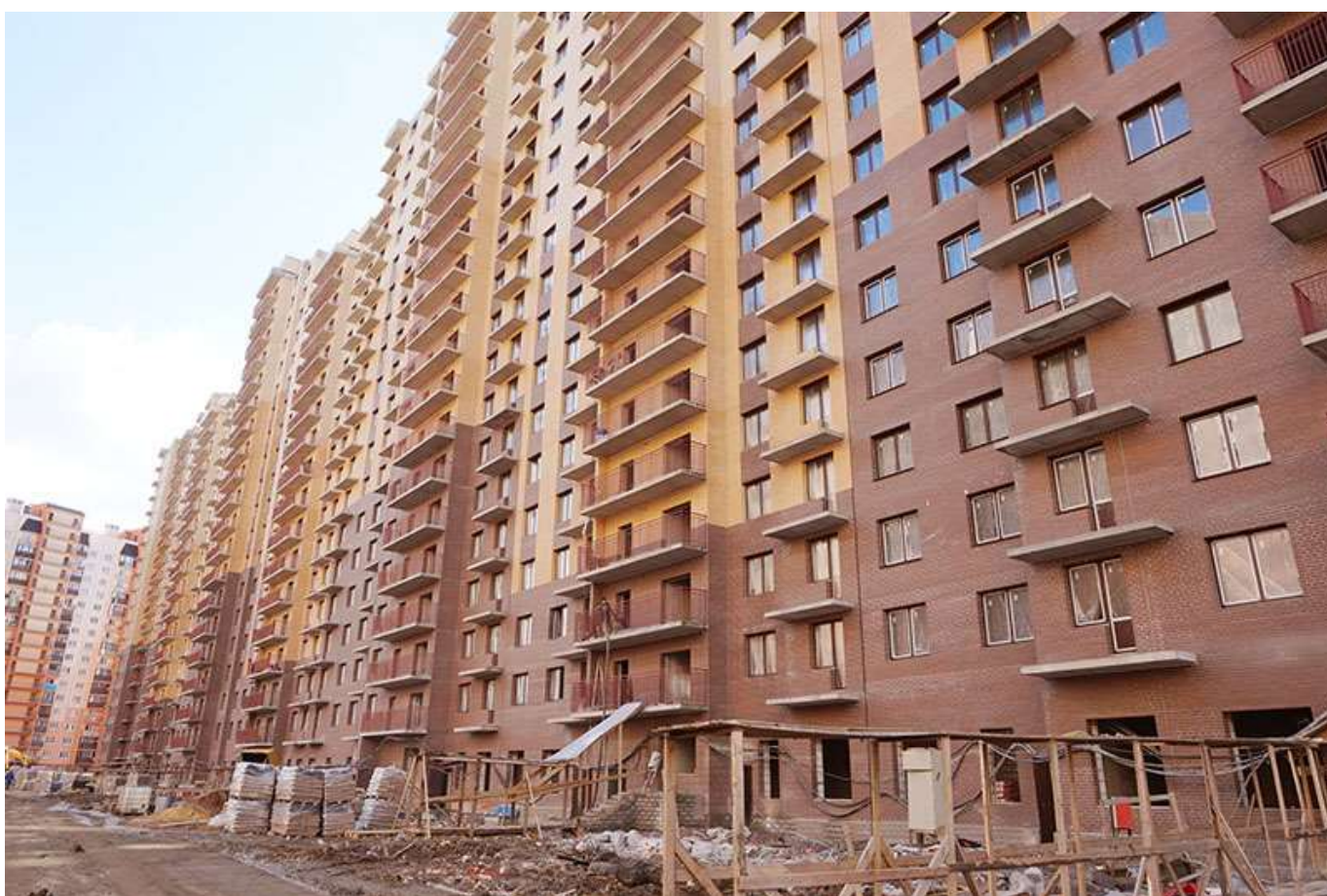
Вид на секции 1-6 со стороны Каштановой ал.