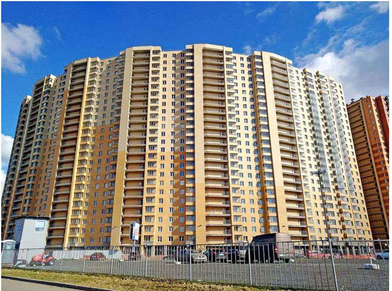
Вид на секции 7-1 с Областной ул.