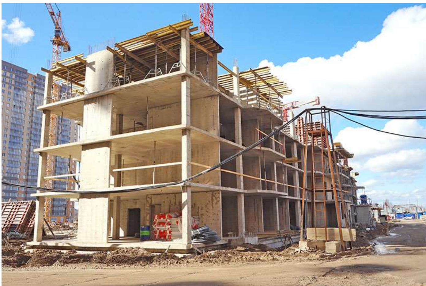
Вид на корпус 5 со стороны Каштановой ал.