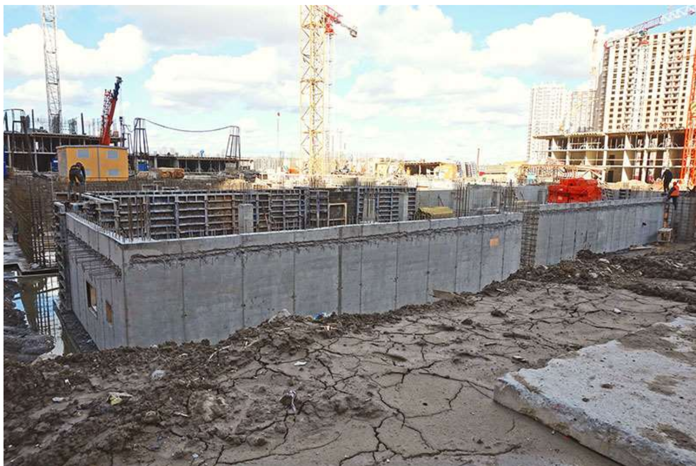
Вид на корпус 3 со стороны Берёзовой ул.