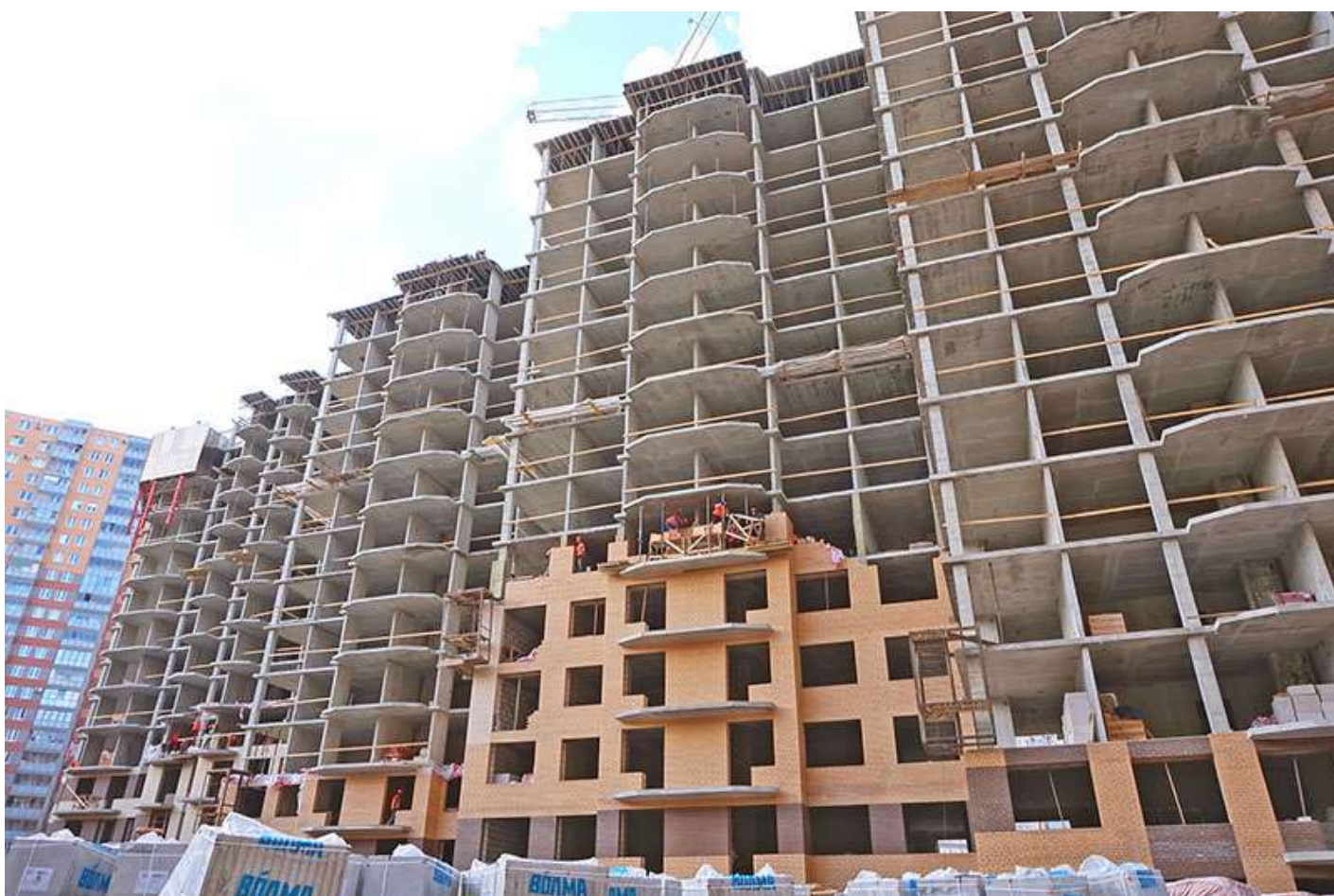
Вид на корпус 6 секции 17-20 со стороны Каштановой ал.