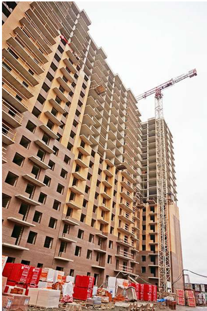
Вид на секции 8-9 со стороны Каштановой ал.