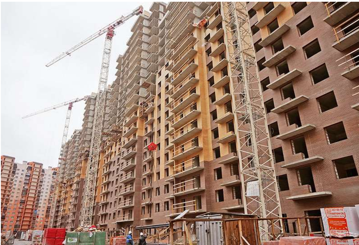
Вид на секции 1-5 со стороны Каштановой ал.