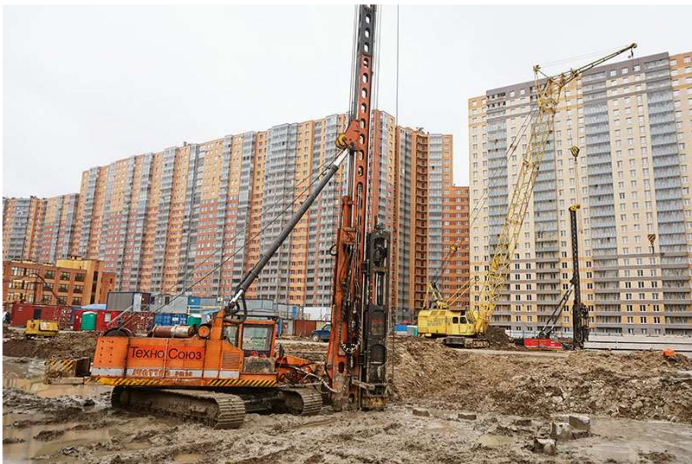
Вид на корпуса 5, 3 со стороны Каштановой ал.