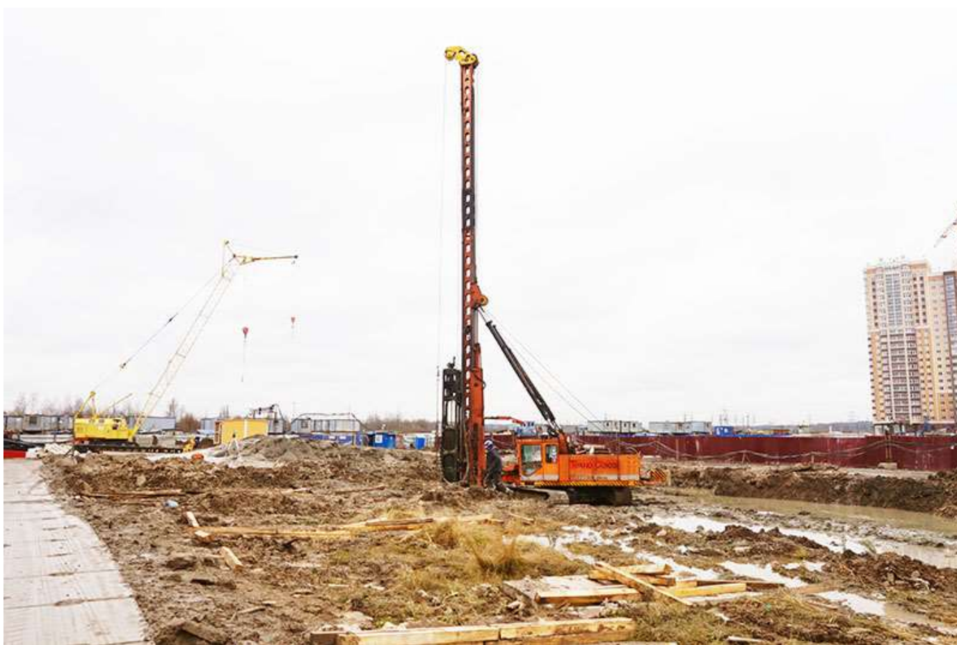
Вид на корпус 5 со стороны Каштановой ал.