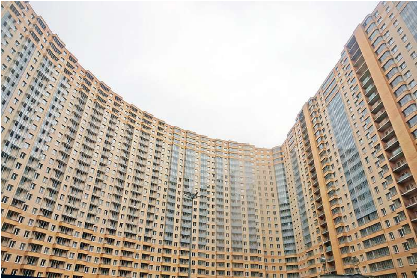
Вид на секции 6-10 со двора