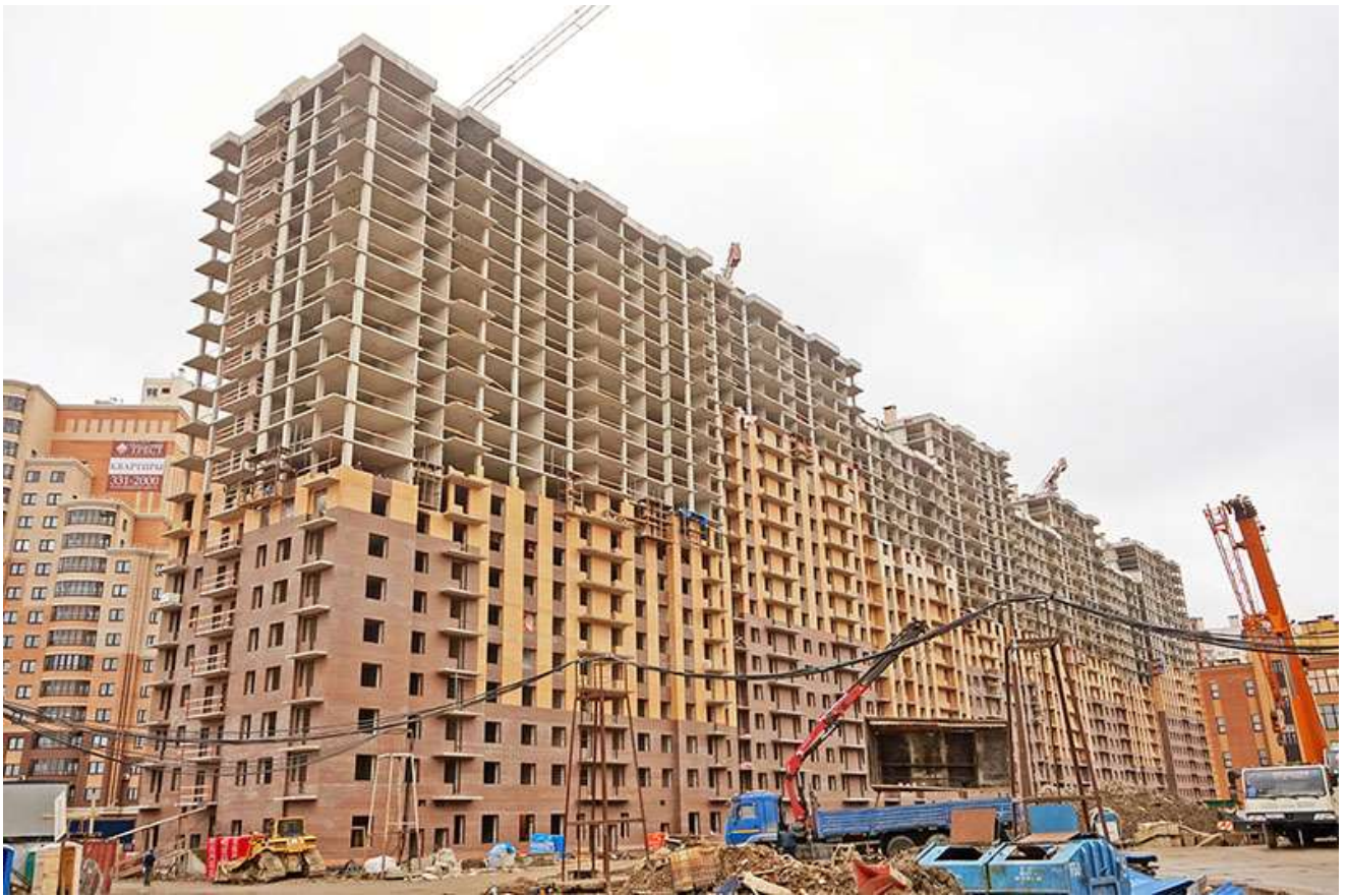
Вид на секции 9-1 со стороны Областной ул.