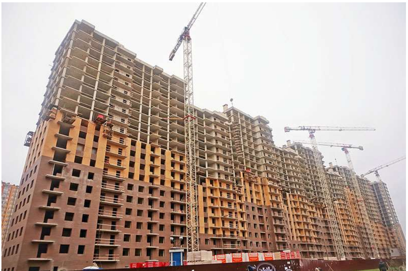
Вид на секции 1-9 со стороны Ленинградской ул.