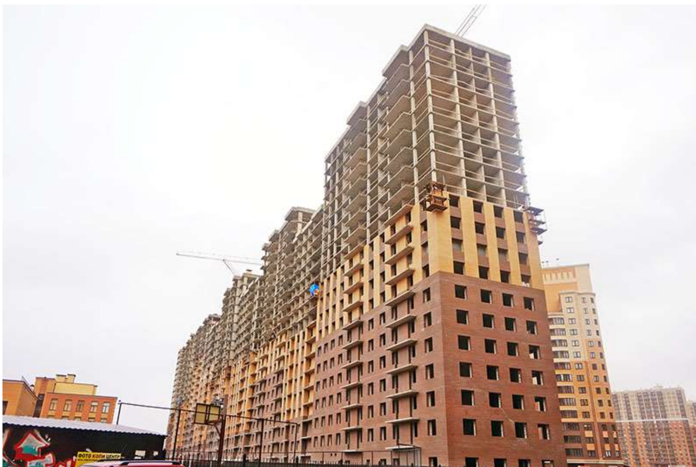
Вид на секции 9-1 со стороны Ленинградской ул.