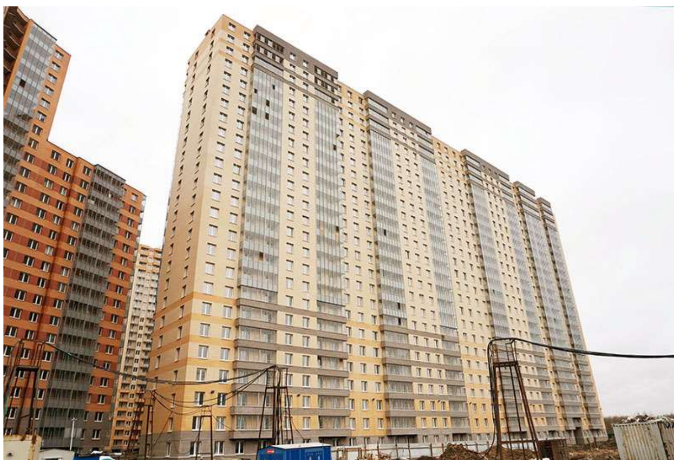
Вид на секции 11-10 со стороны Берёзовой ул.