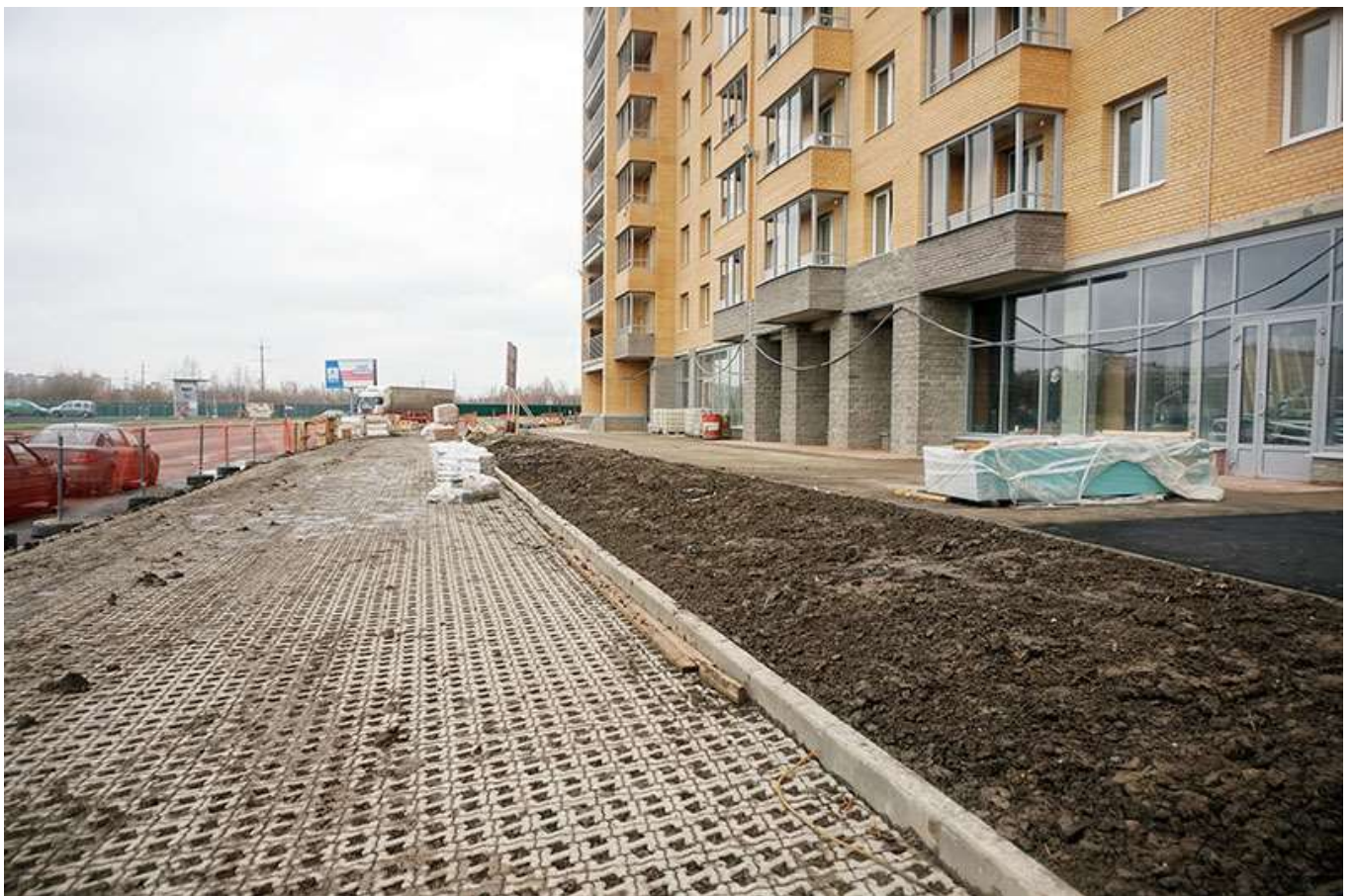
Вид на секции 1-2 с Областной ул.