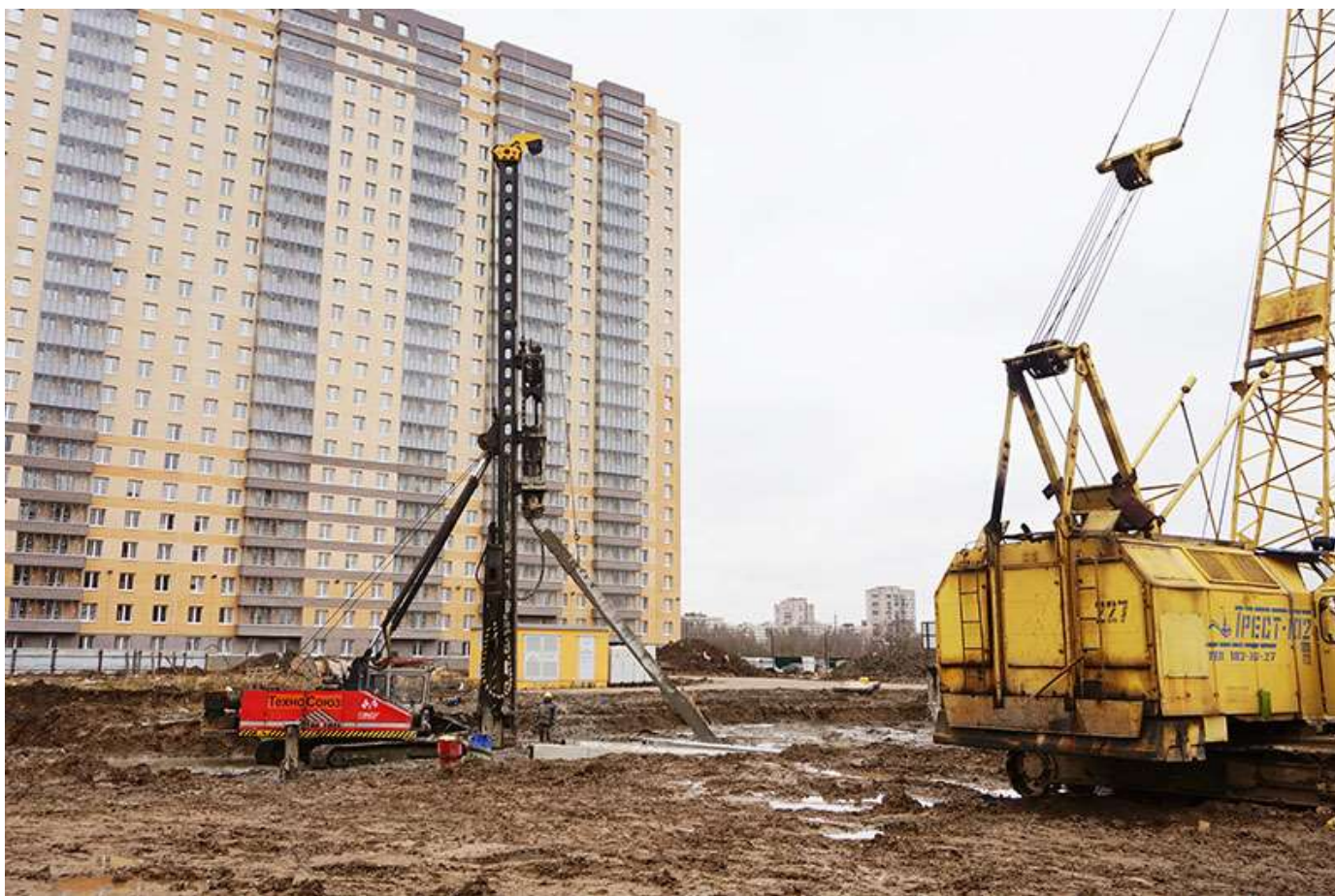
Вид на корпус 2 со стороны Каштановой ал.