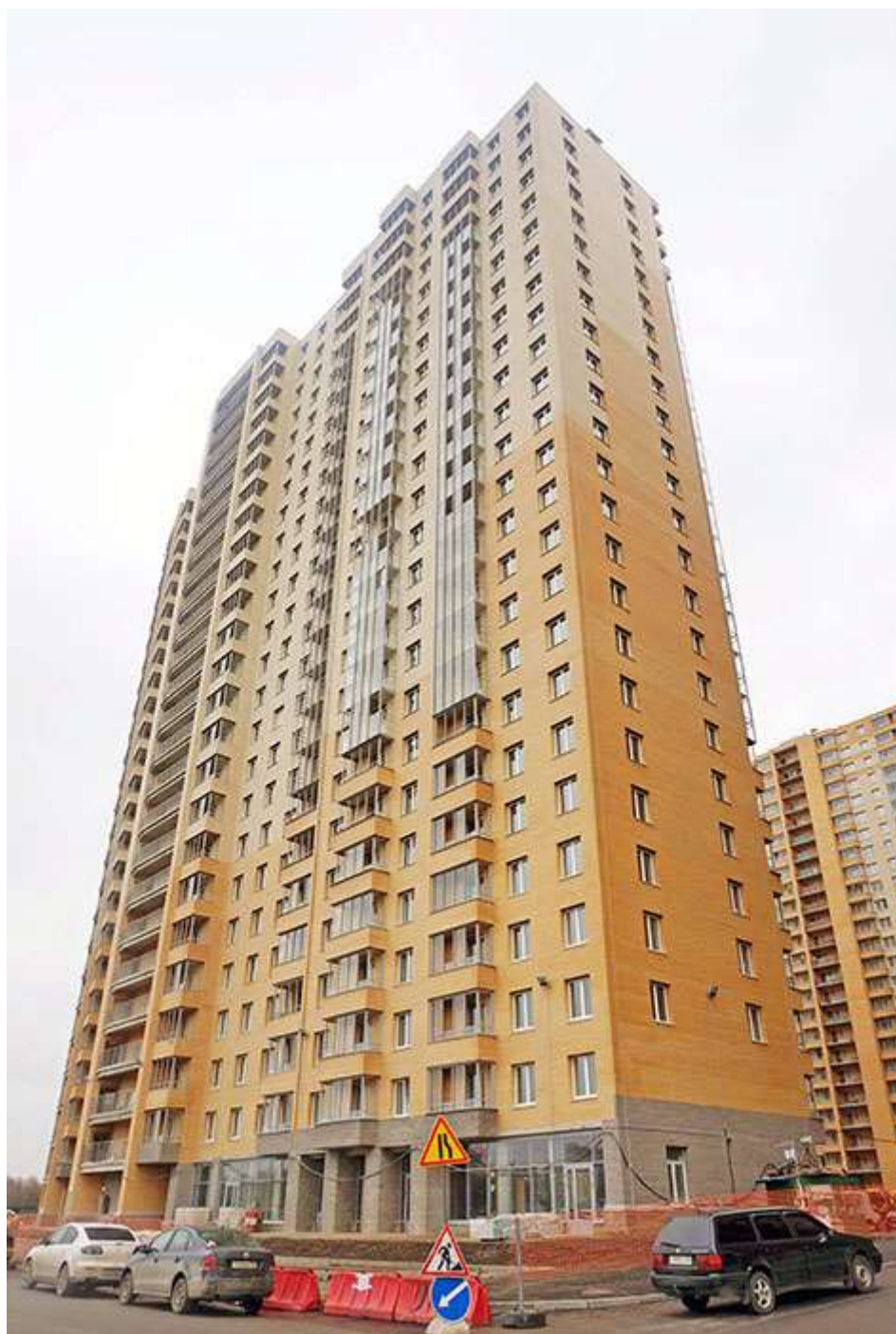
Вид на секции 2-1 со Областной ул.