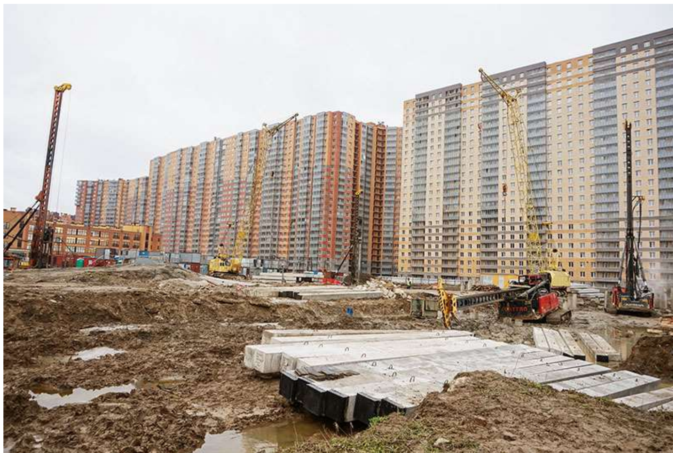
Вид со стороны Областной ул.