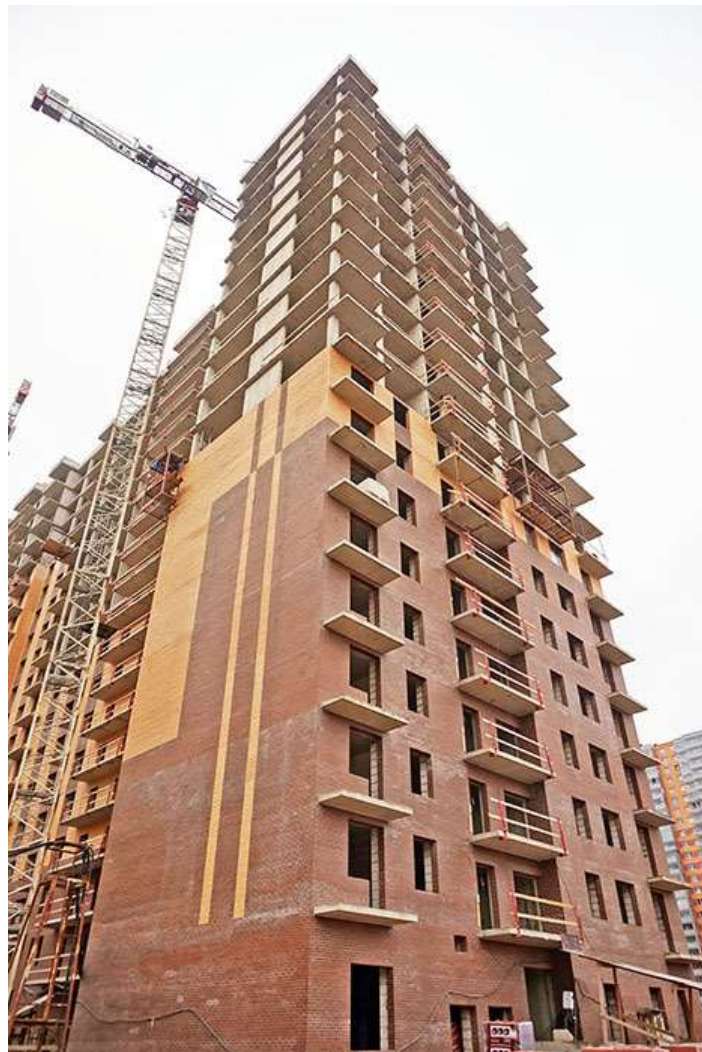
Вид на секцию 8-9 со стороны Областной ул.