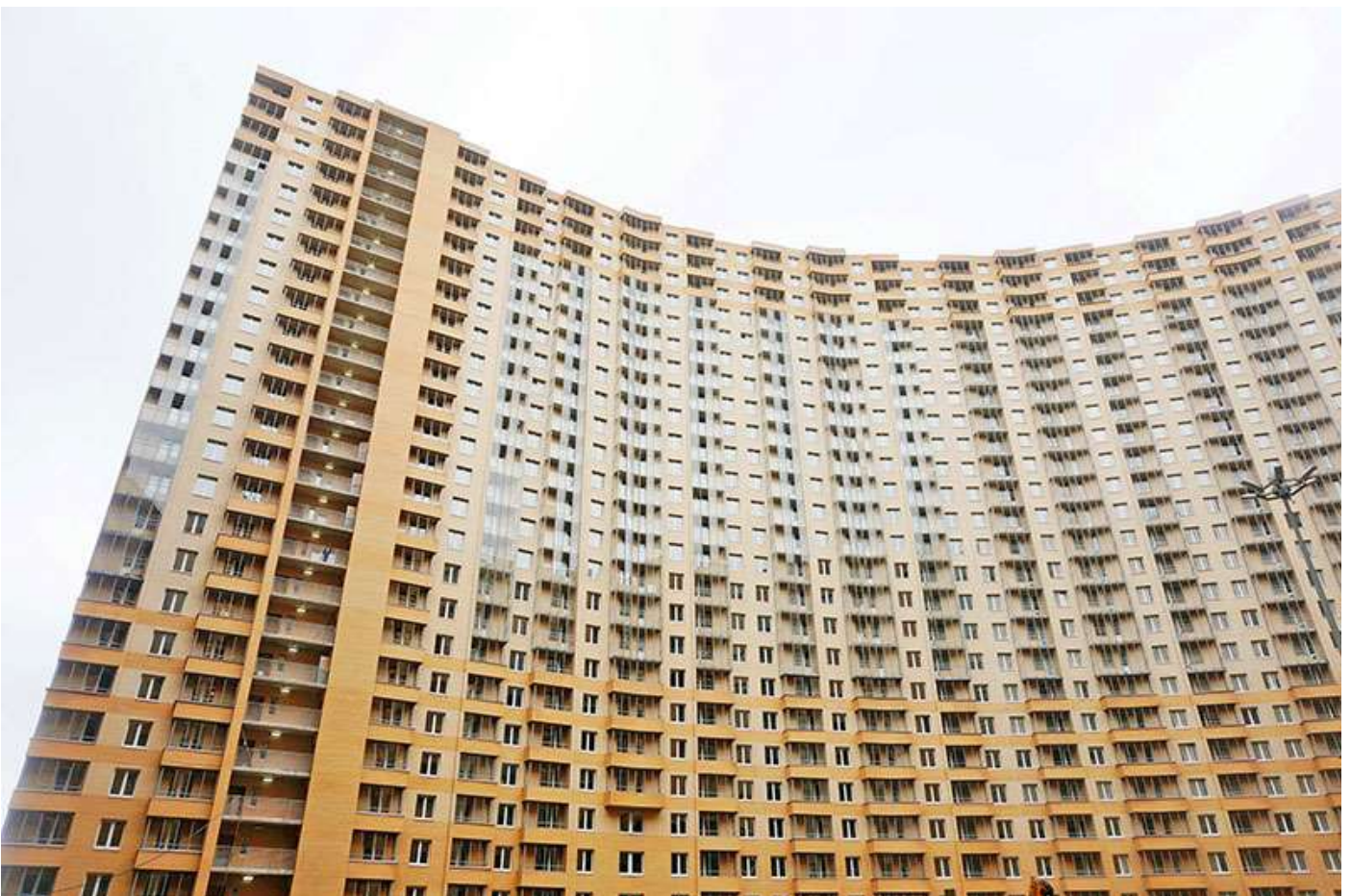
Вид на секции 1-5 со двора