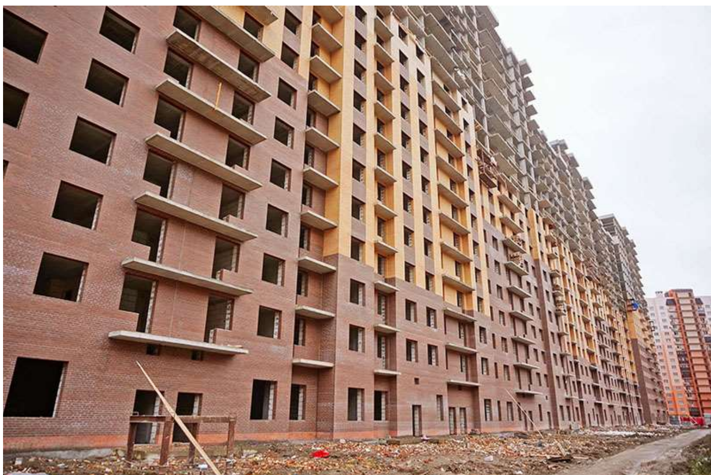
Вид на секции 6-1 со стороны Берёзовой ул.