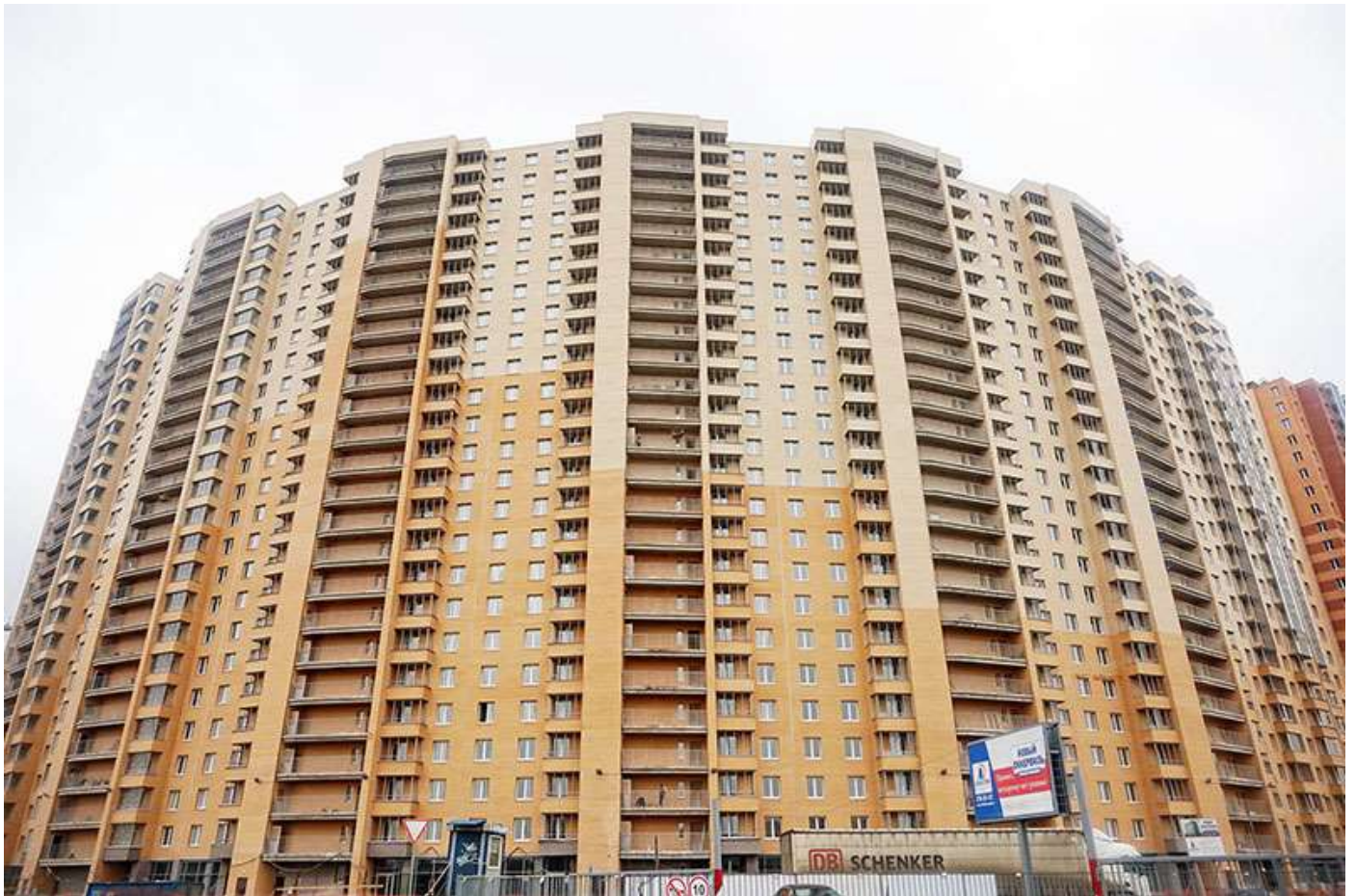
Вид на секции 7-1 с Областной ул.