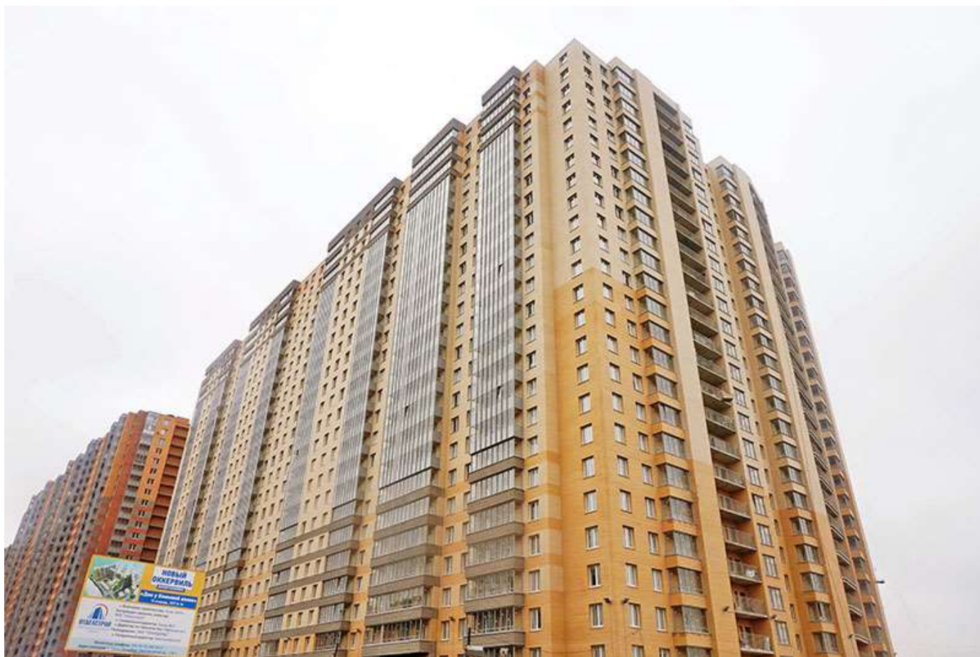
Вид на секции 11-8 со стороны Областной ул.