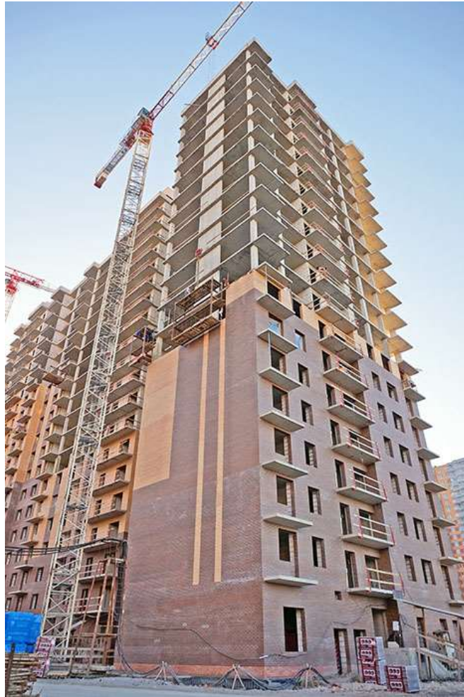
Вид на секцию 8-9 со стороны Областной ул.