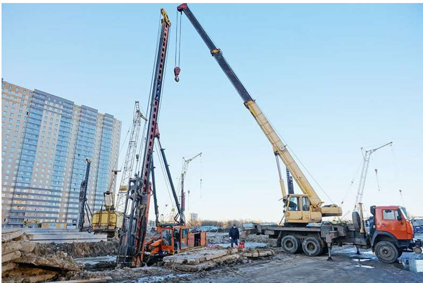
Вид на корпус 5 со стороны Каштановой ал.