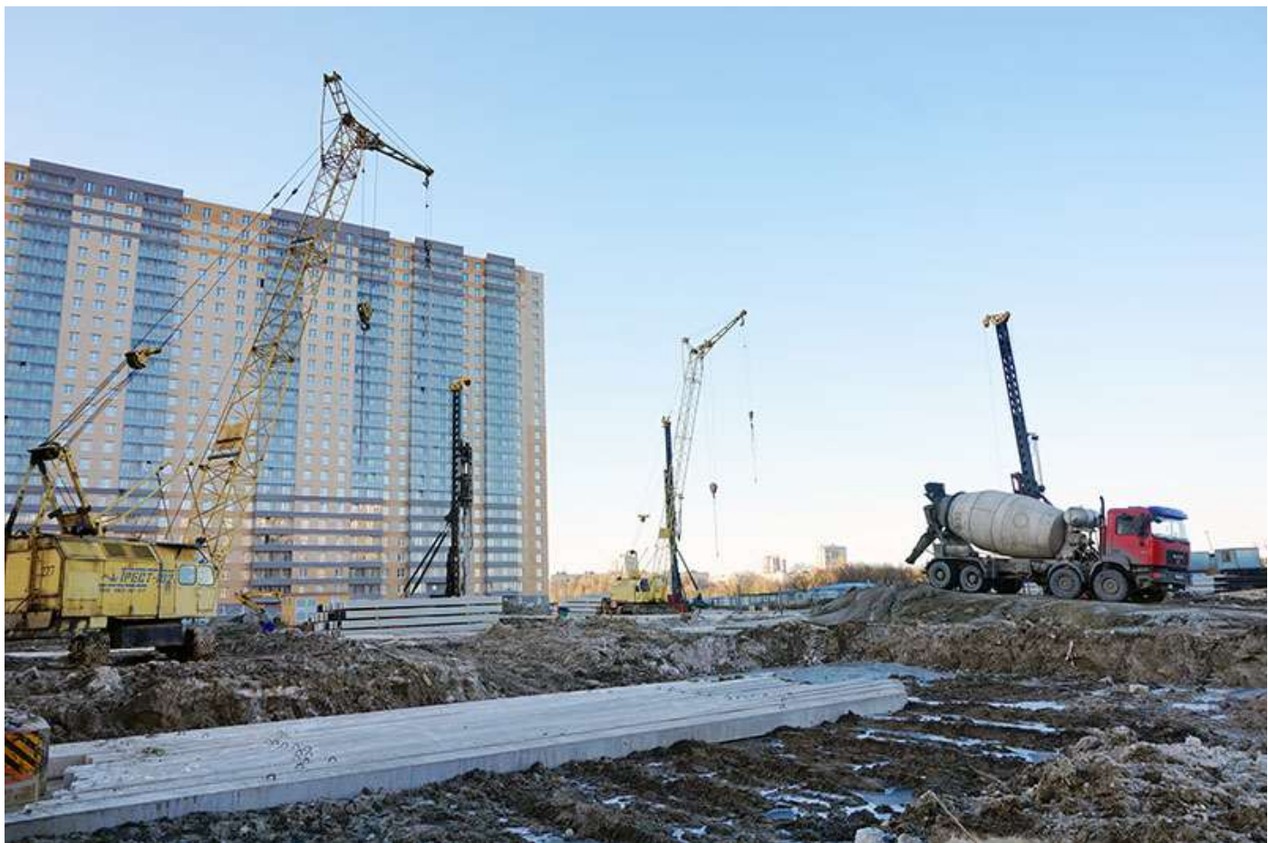
Вид на корпуса 2, 3 и 1 со стороны Каштановой ал.