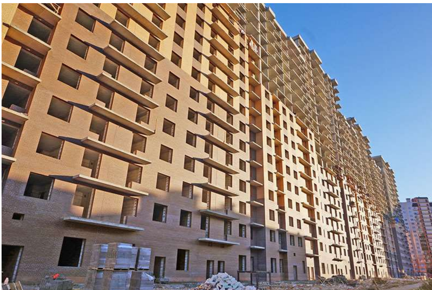
Вид на секции 6-1 со стороны Берёзовой ул.