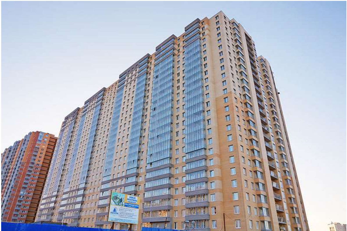
Вид на секции 11-8 со стороны Областной ул.