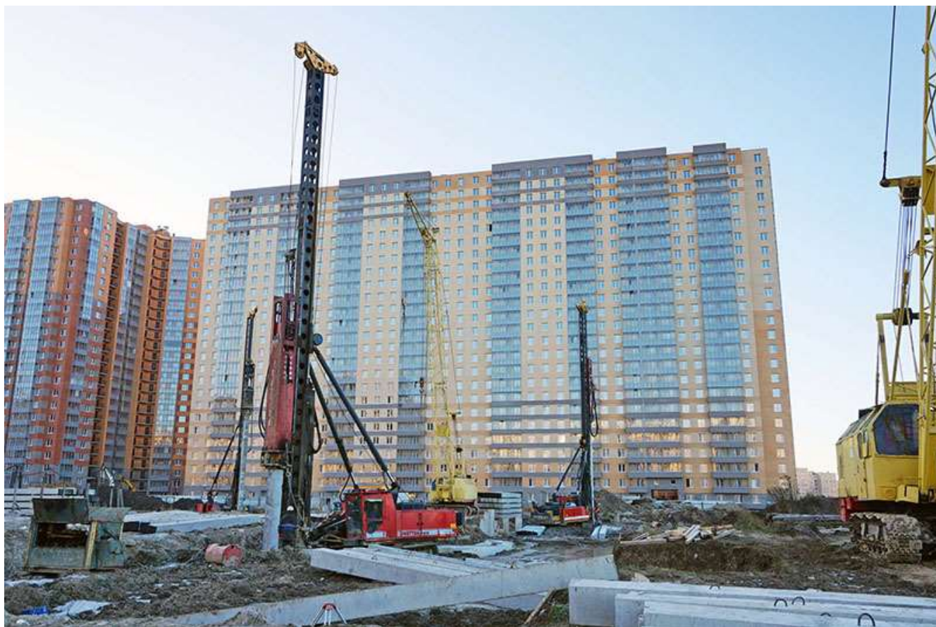
Вид на корпуса 1, 3 со стороны Областной ул.