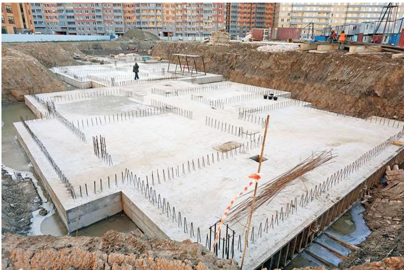
Вид на корпус 6 со стороны Каштановой ал.