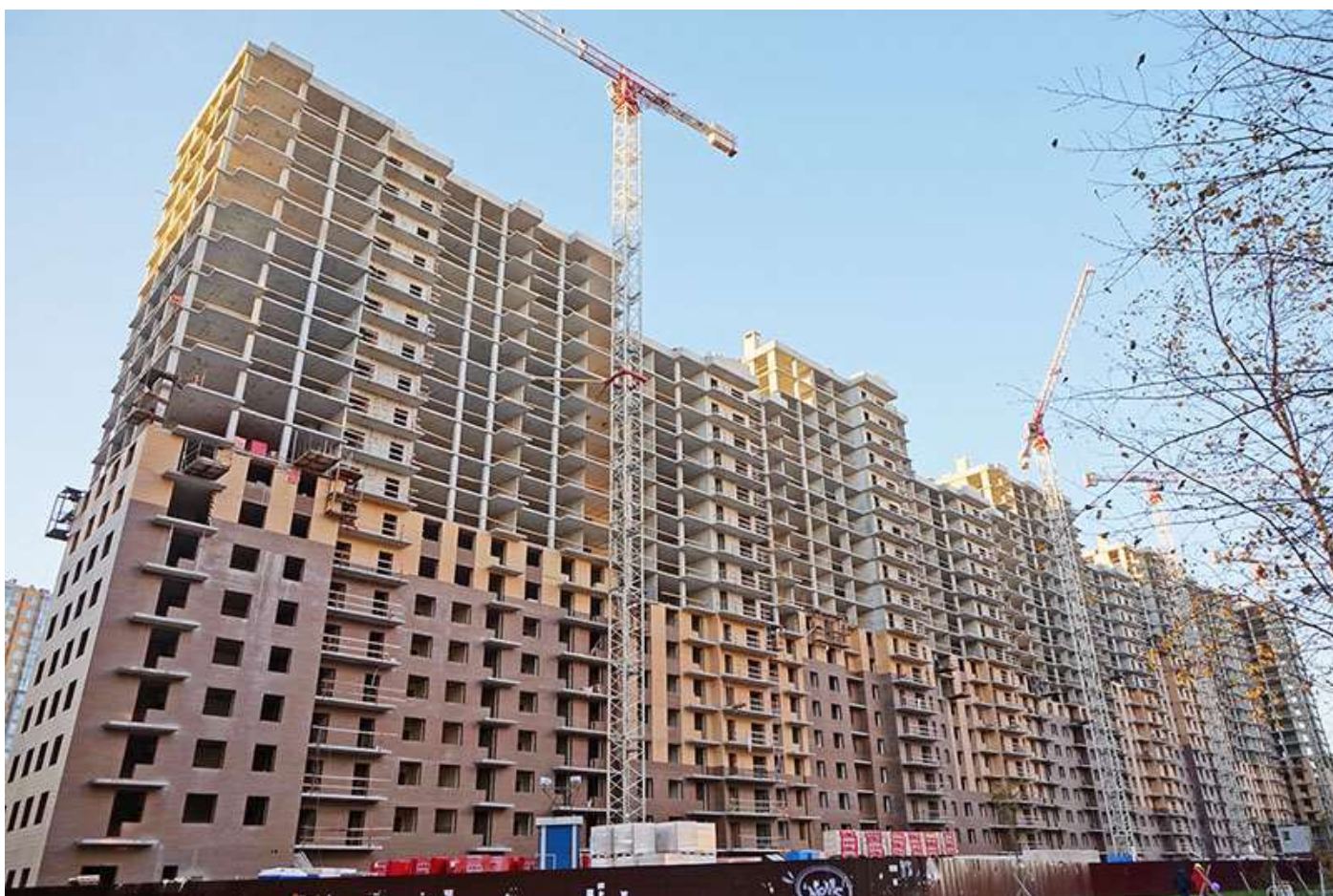
Вид на секции 1-9 со стороны Ленинградской ул.