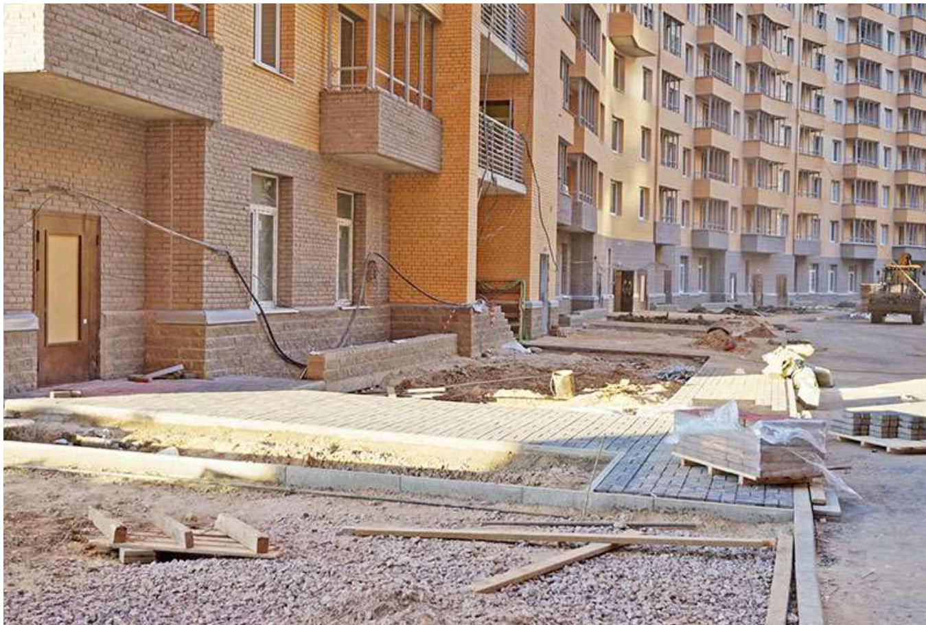
Вид на двор