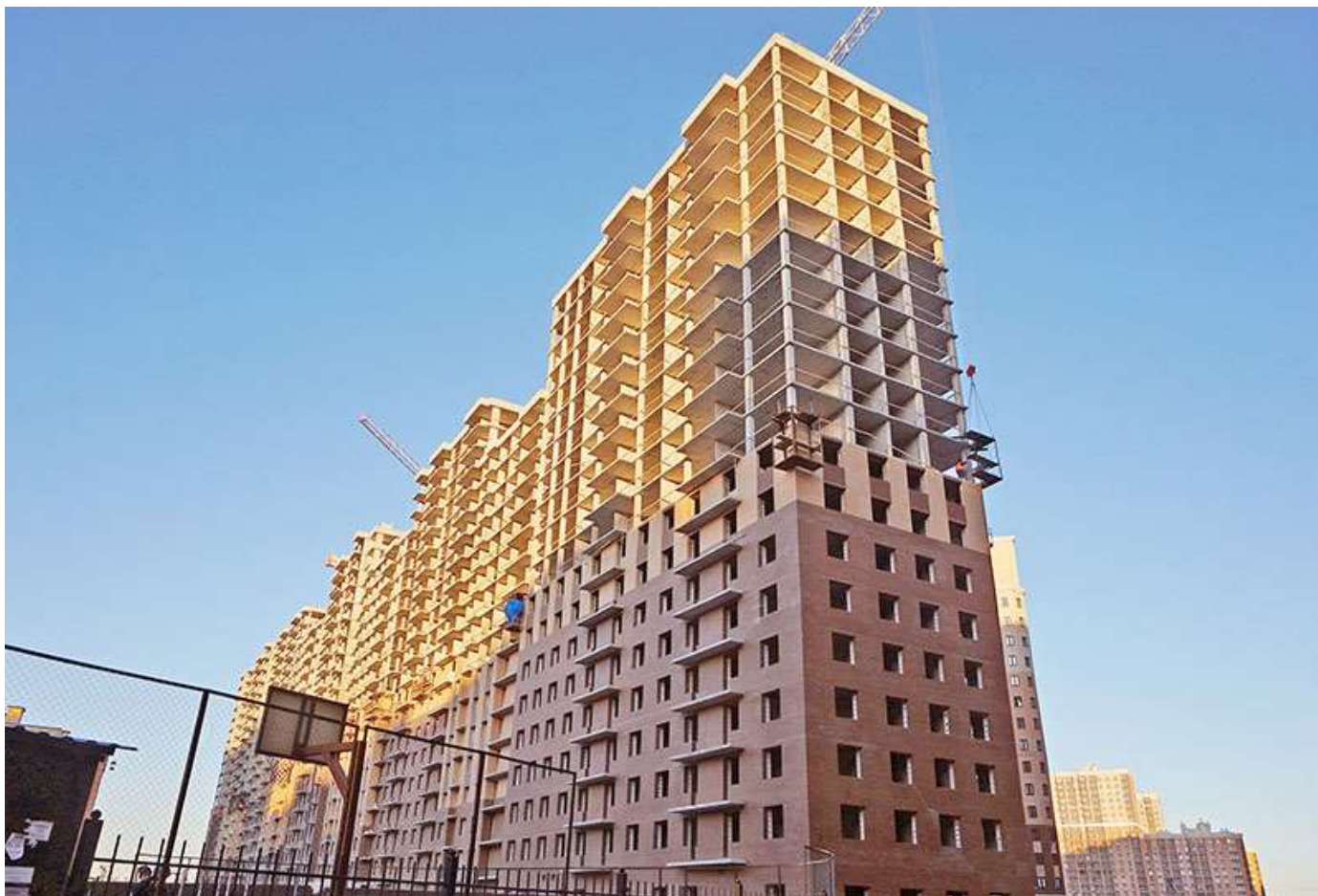
Вид на секции 9-1 со стороны Ленинградской ул.