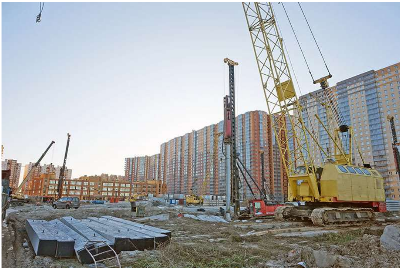
Вид со стороны Областной ул.