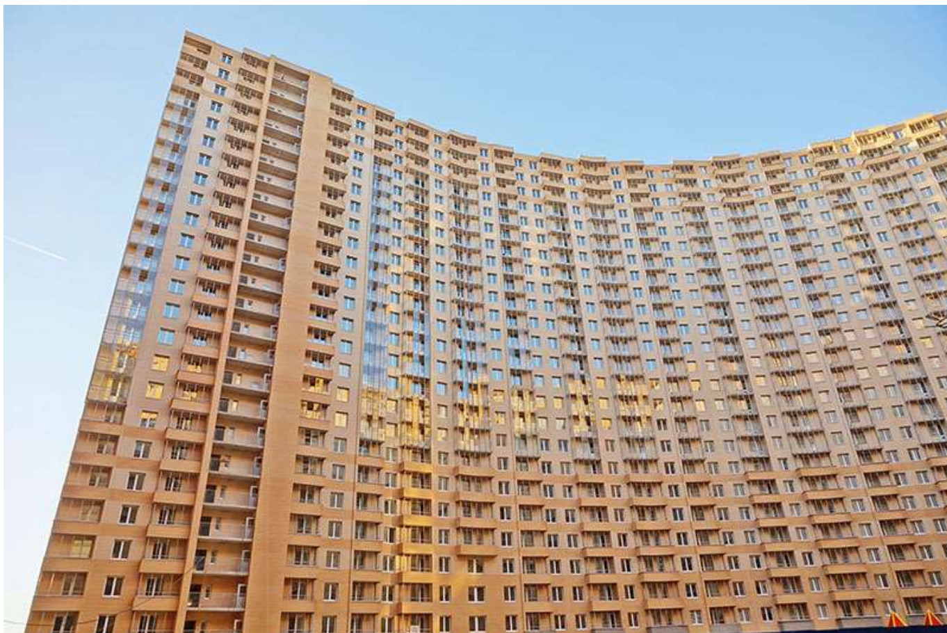
Вид на секции 1-5 со двора