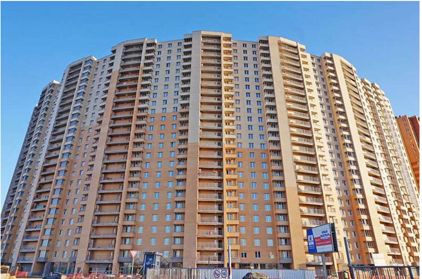
Вид на секции 7-1 с Областной ул.