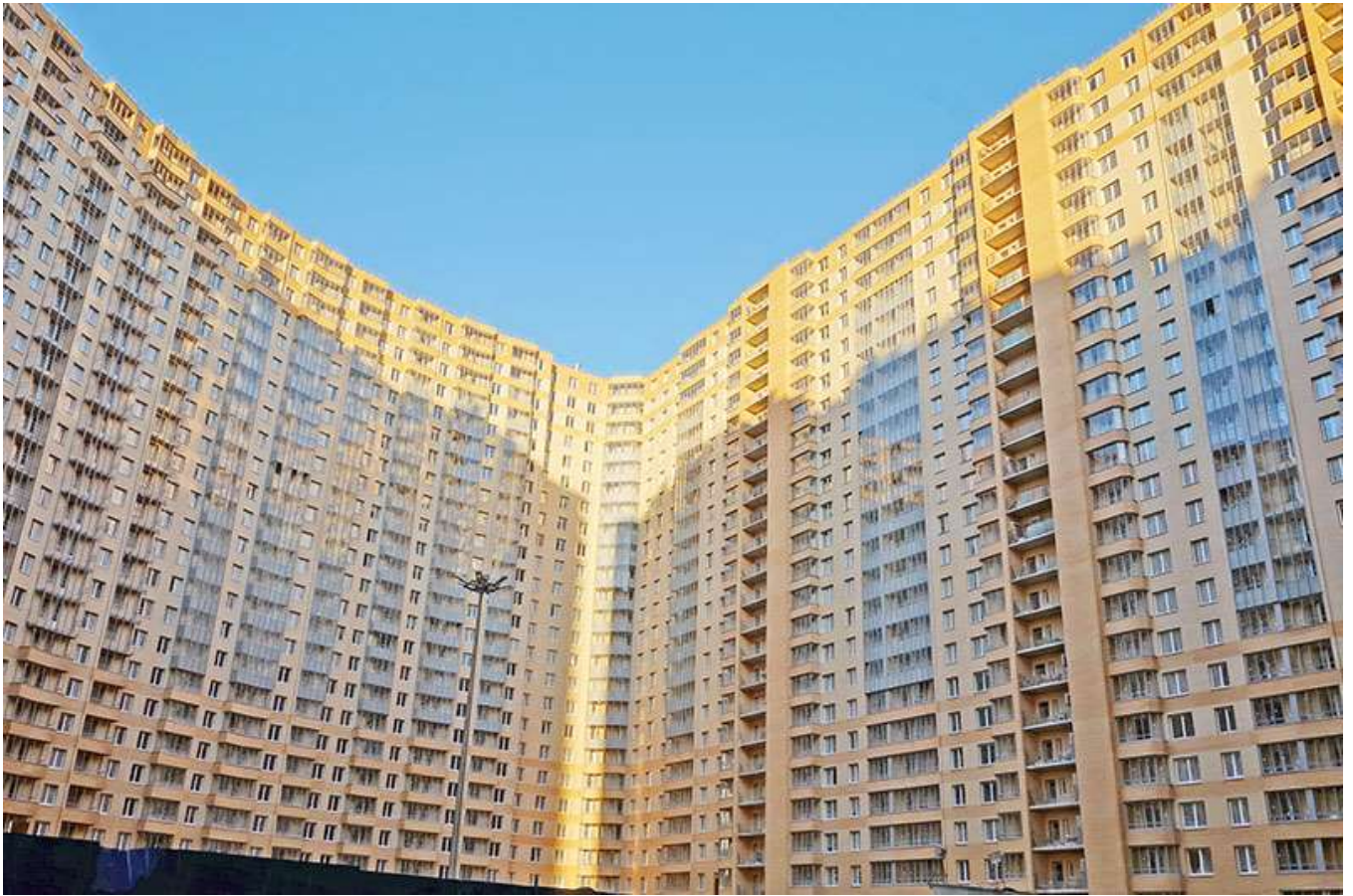
Вид на секции 6-10 со двора