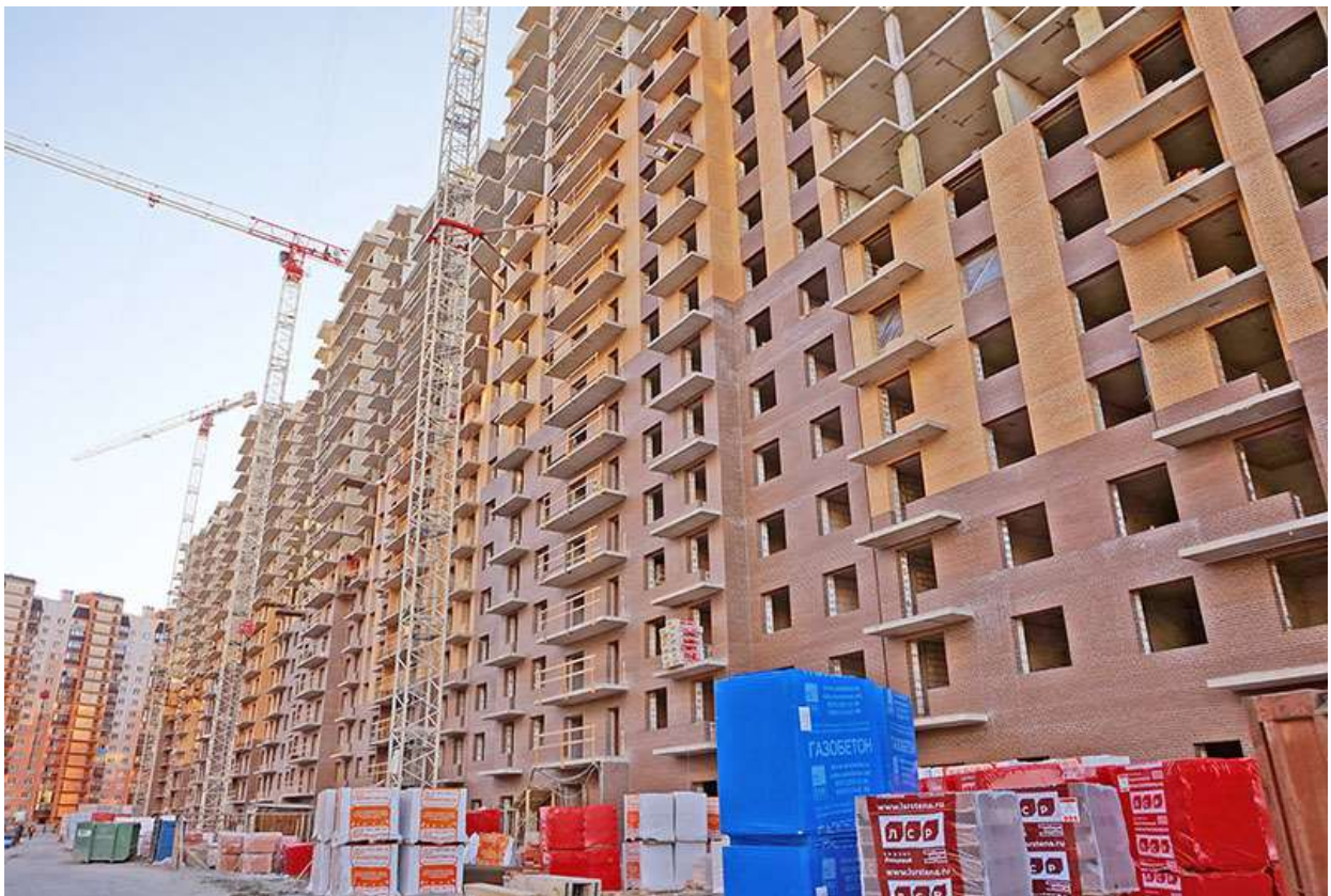
Вид на секции 1-7 со стороны Каштановой ал.