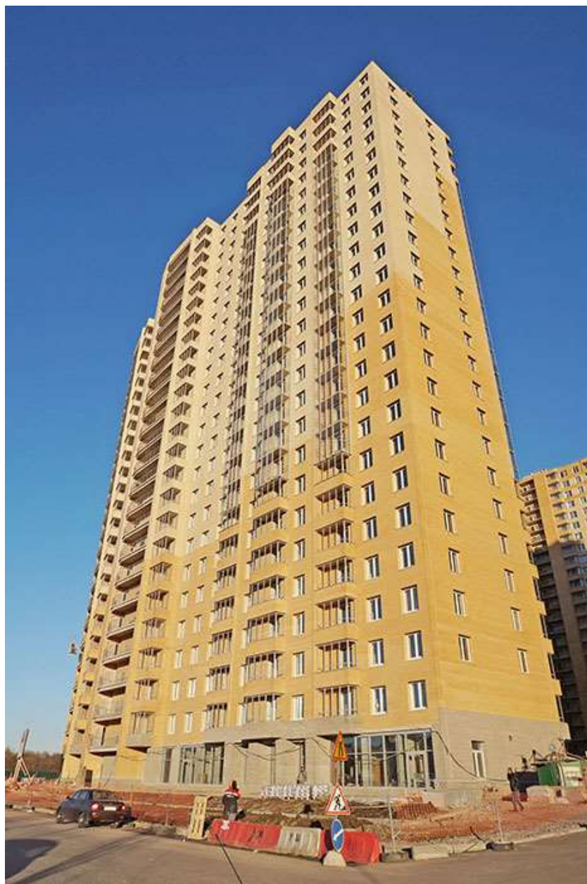
Вид на секции 2-1 со Областной ул.