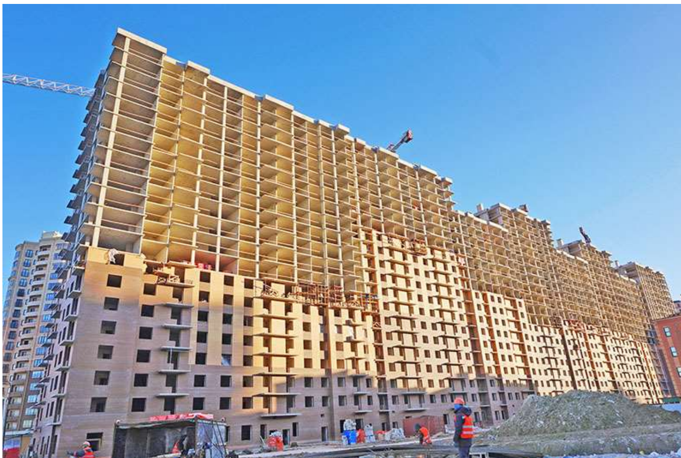
Вид на секции 9-1 со стороны Областной ул.