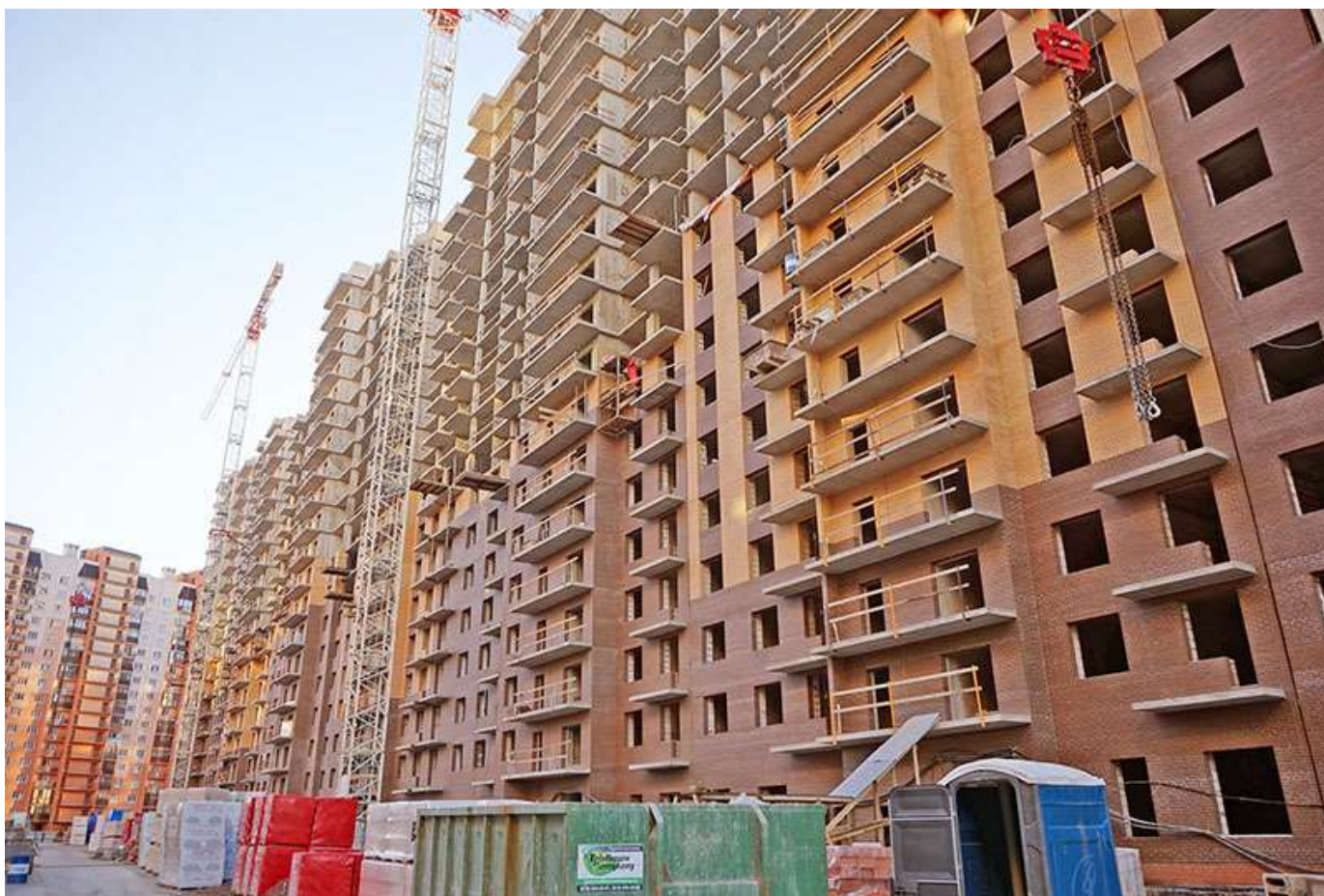
Вид на секции 1-4 со стороны Каштановой ал.