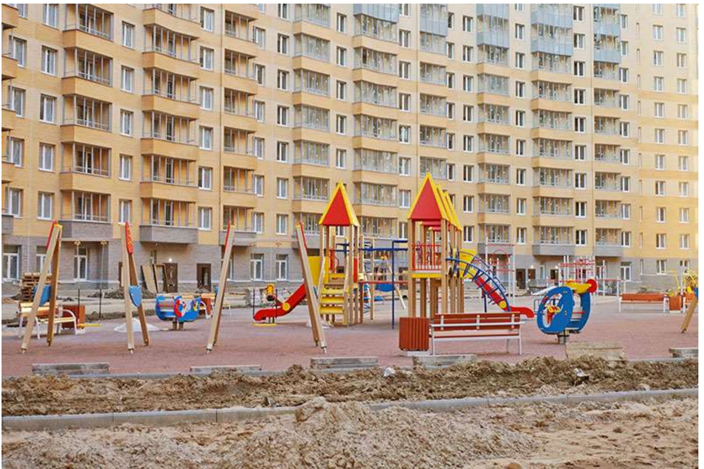
Вид на двор