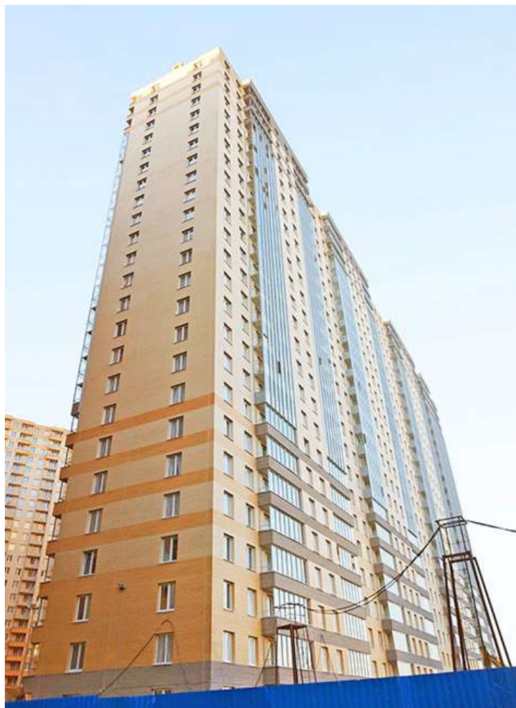
Вид на секции 11-10 со стороны Берёзовой ул.