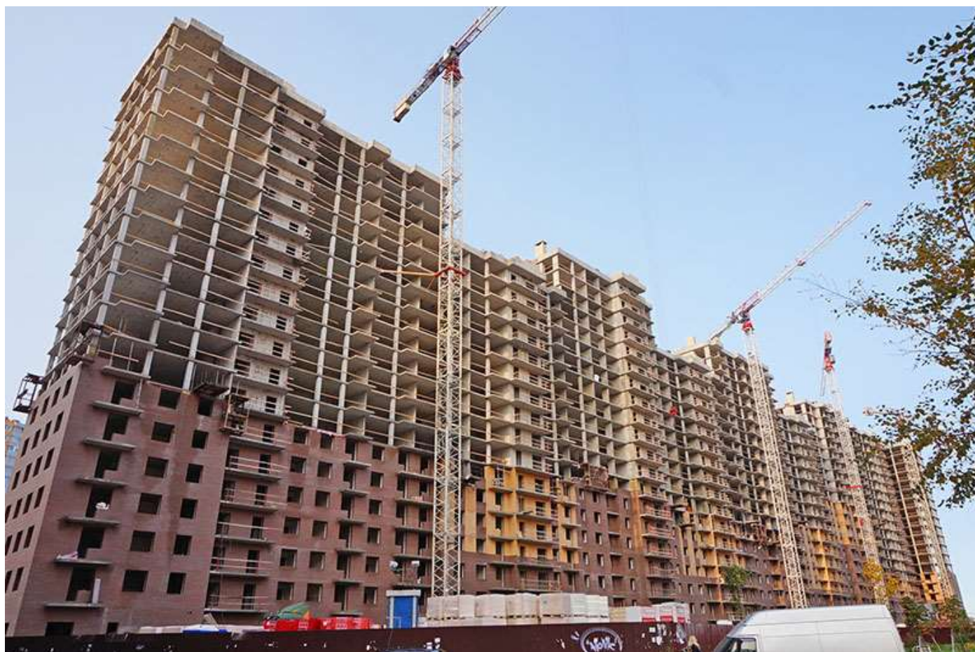
Вид на секции 1-9 со стороны Ленинградской ул.