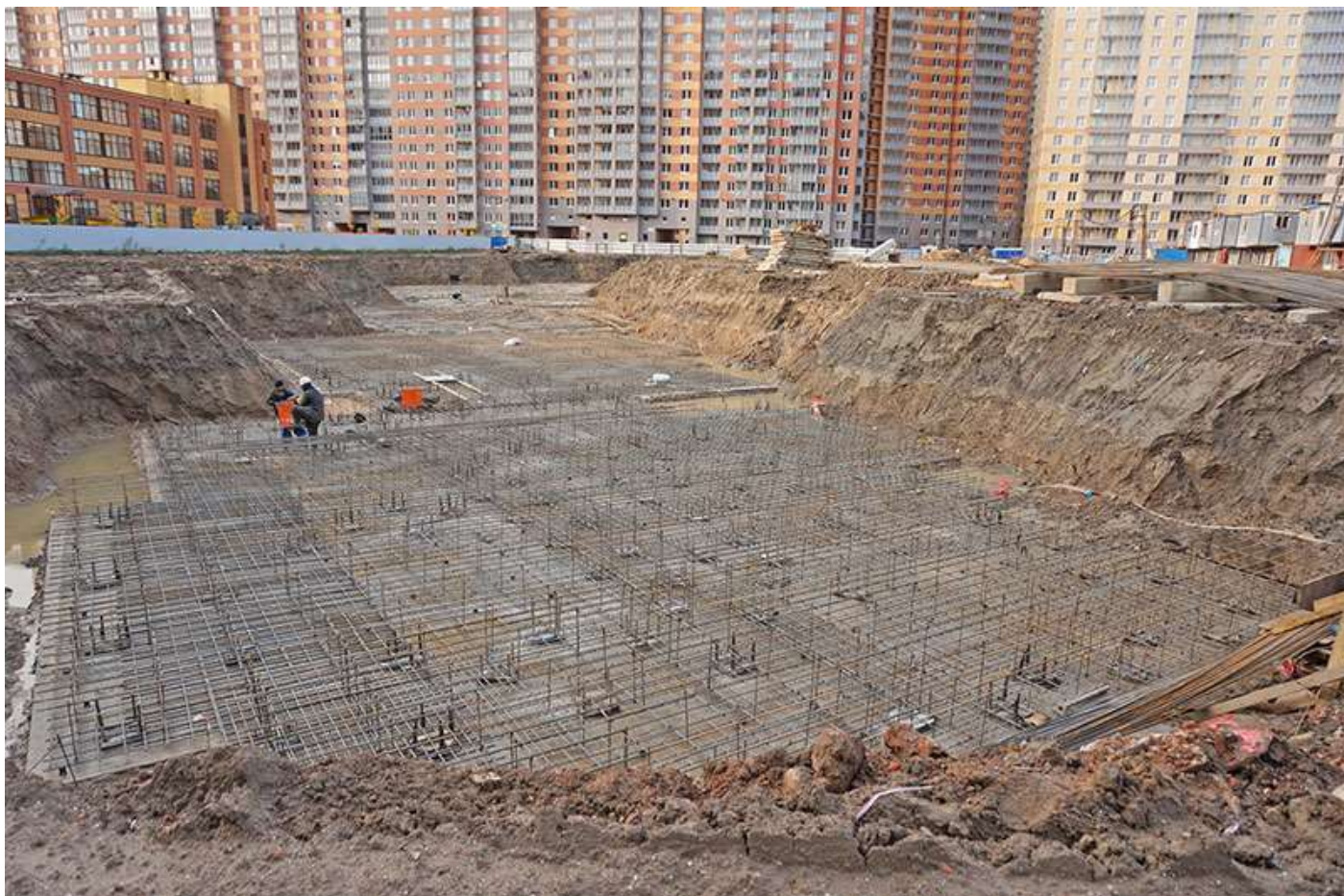
Вид на корпус 6 со стороны Каштановой ал.