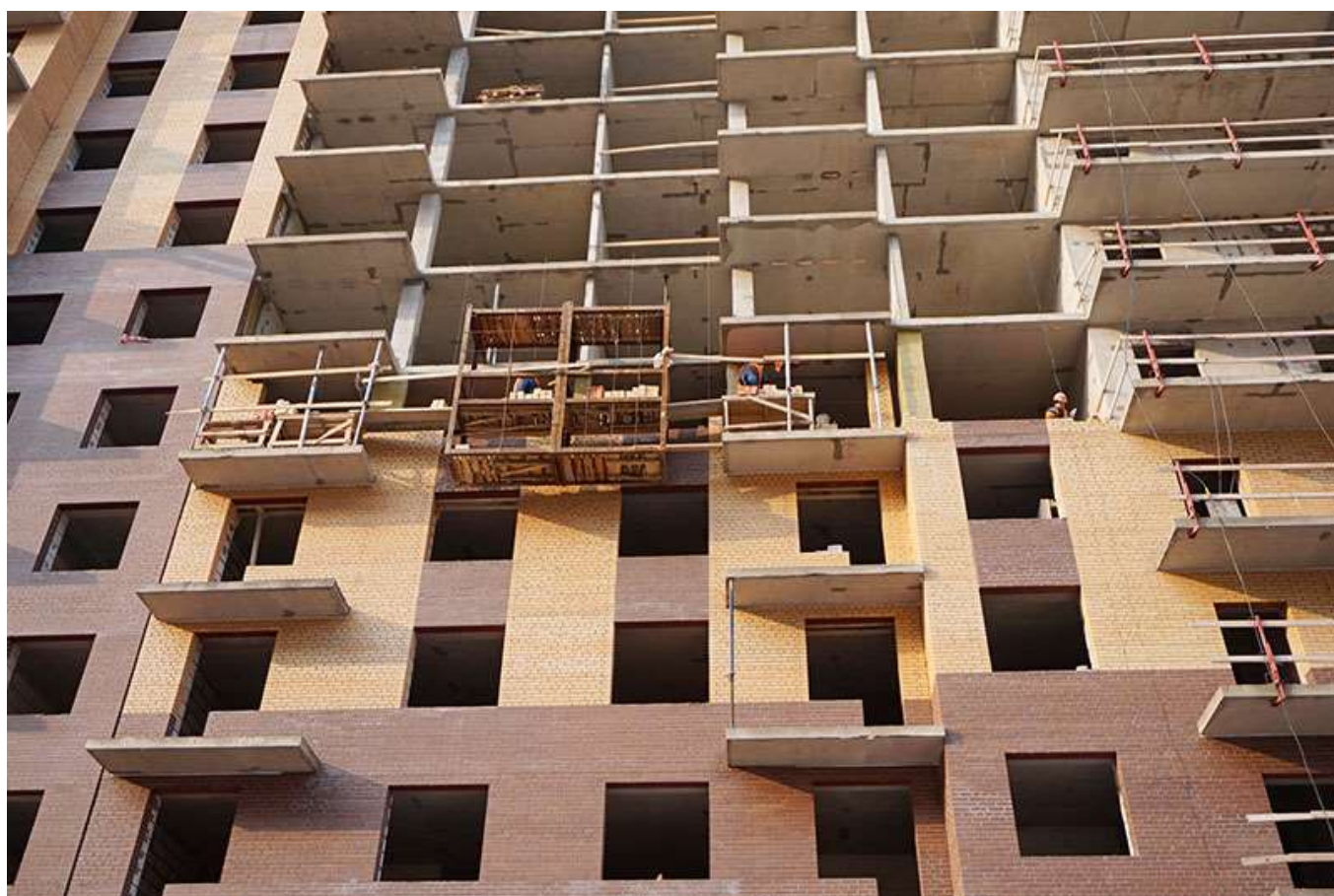
Вид на секцию 8 со стороны Каштановой ал.