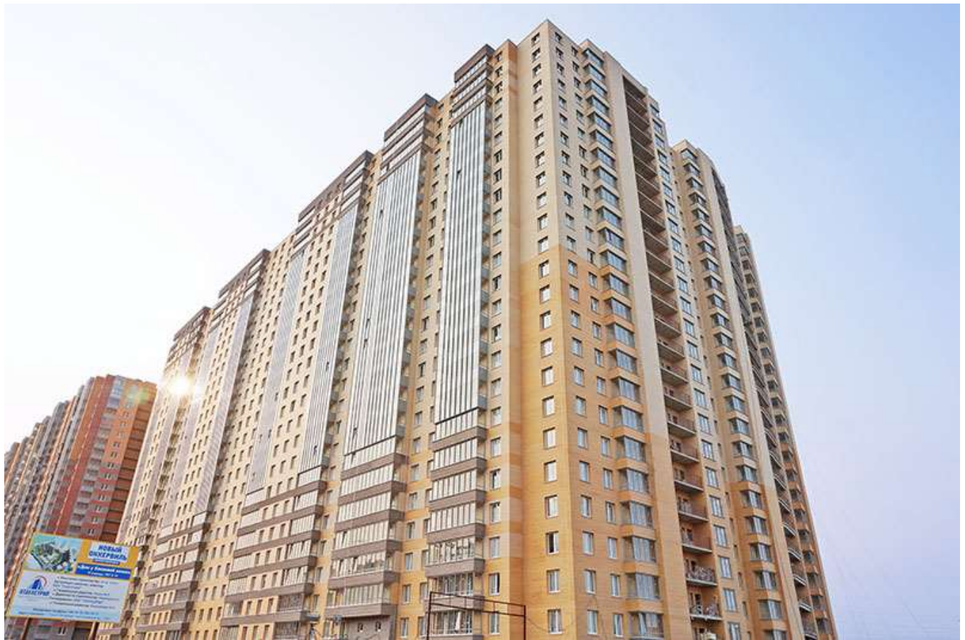
Вид на секции 11-8 со стороны Областной ул.