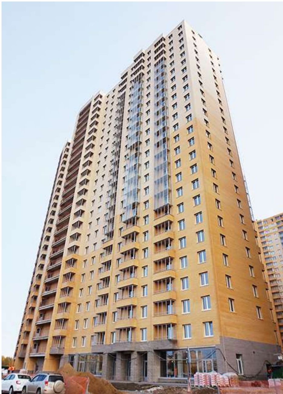
Вид на секции 2-1 со Областной ул.