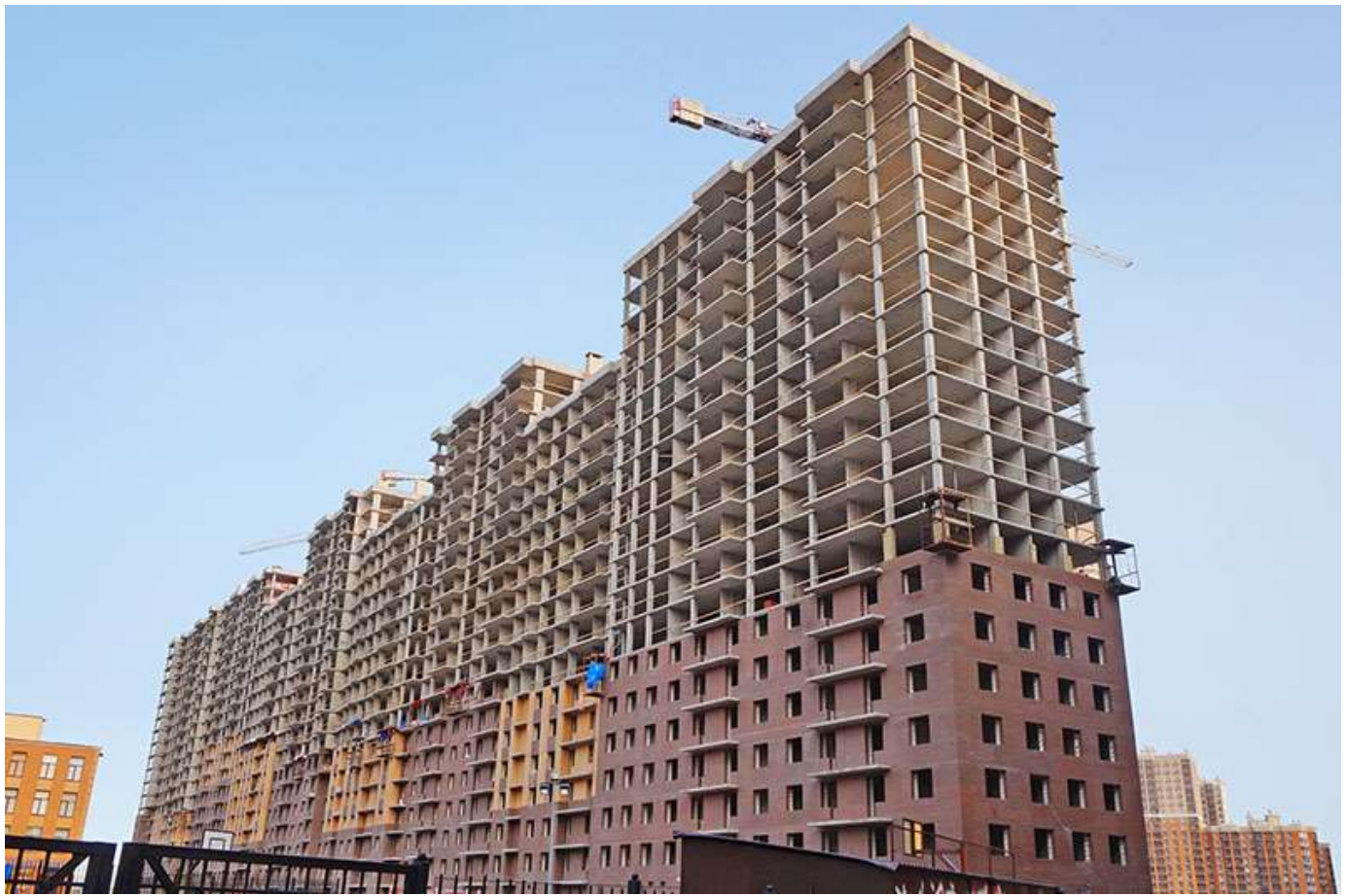
Вид на секции 9-1 со стороны Ленинградской ул.