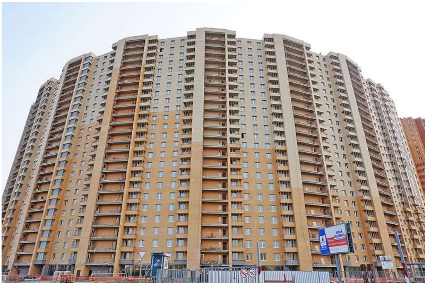
Вид на секции 7-1 с Областной ул.