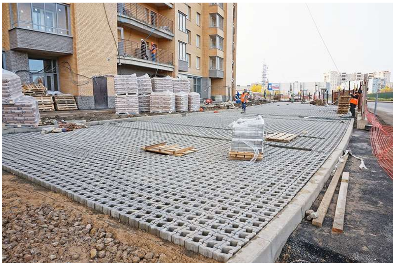
Вид на секции 6-5 с Областной ул.