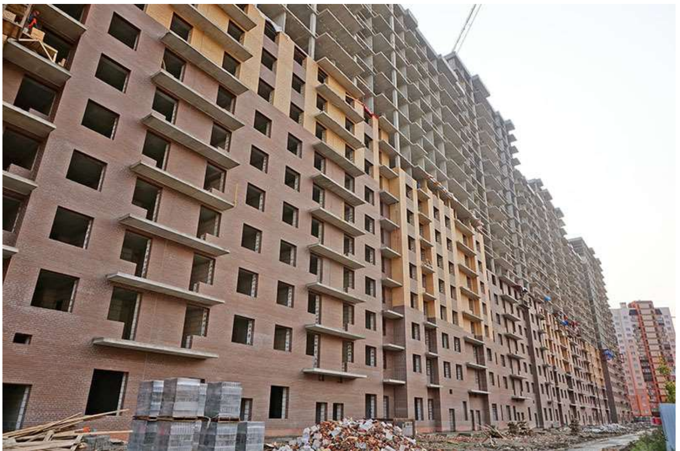
Вид на секции 6-1 со стороны Берёзовой ул.