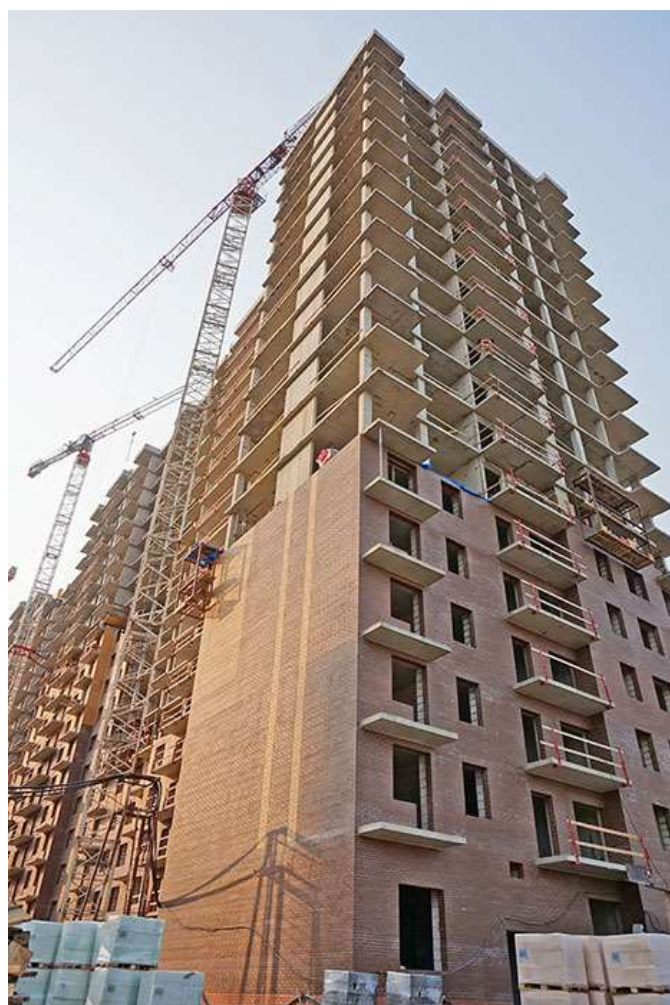
Вид на секцию 9 со стороны Областной ул.