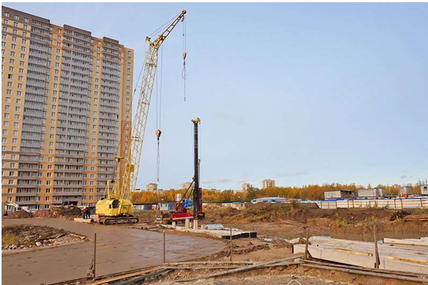
Вид на корпус 1 со стороны Областной ул.