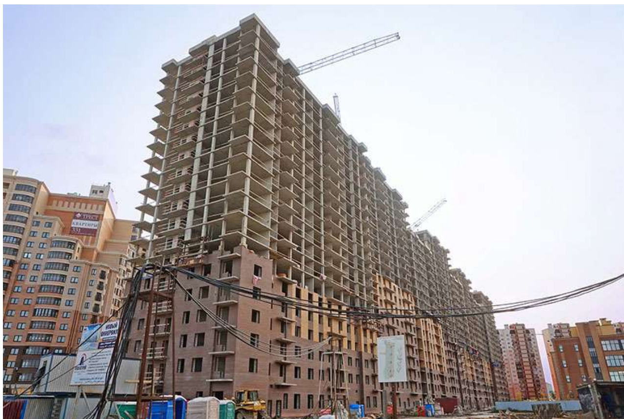
Вид на секции 9-1 со стороны Областной ул.