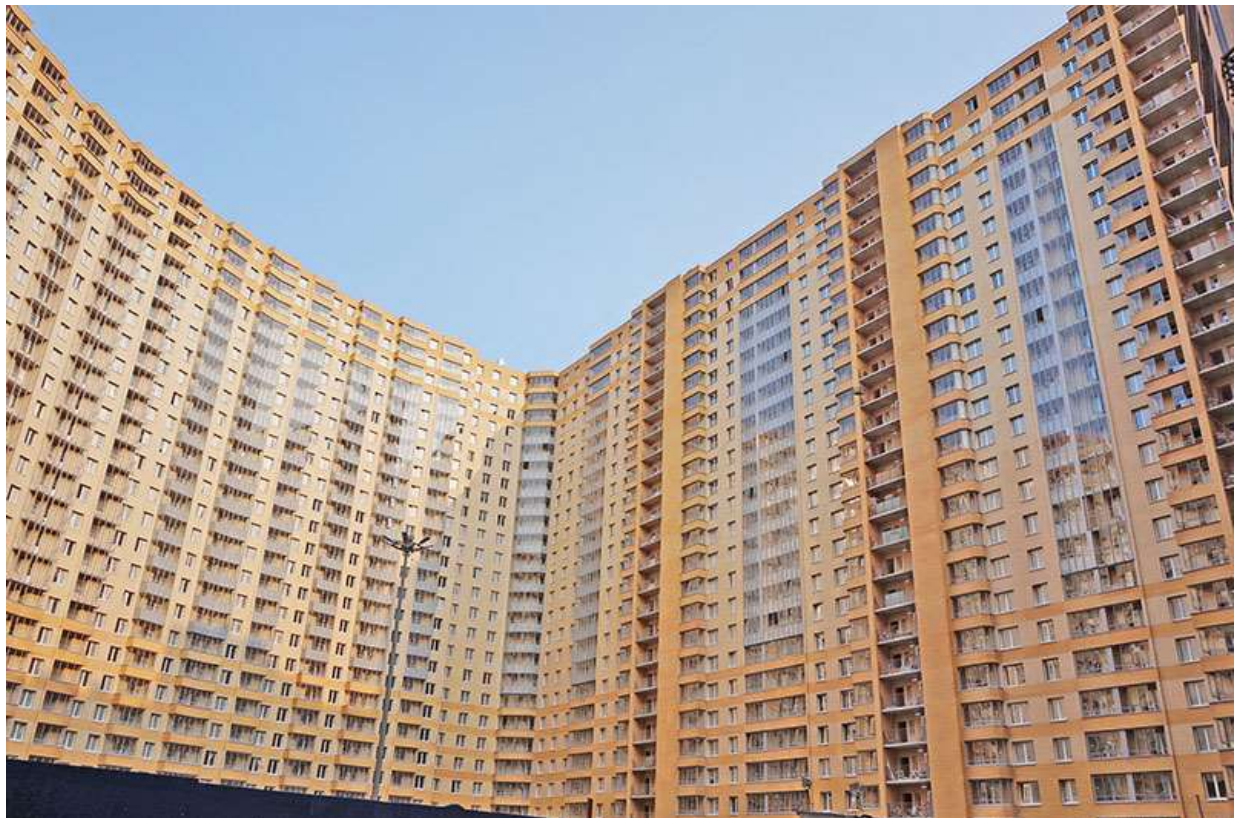
Вид на секции 6-10 со двора