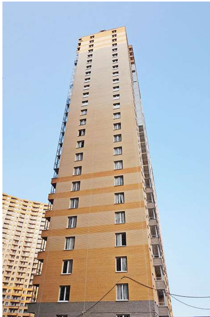
Вид на секции 11-10 со стороны Берёзовой ул.