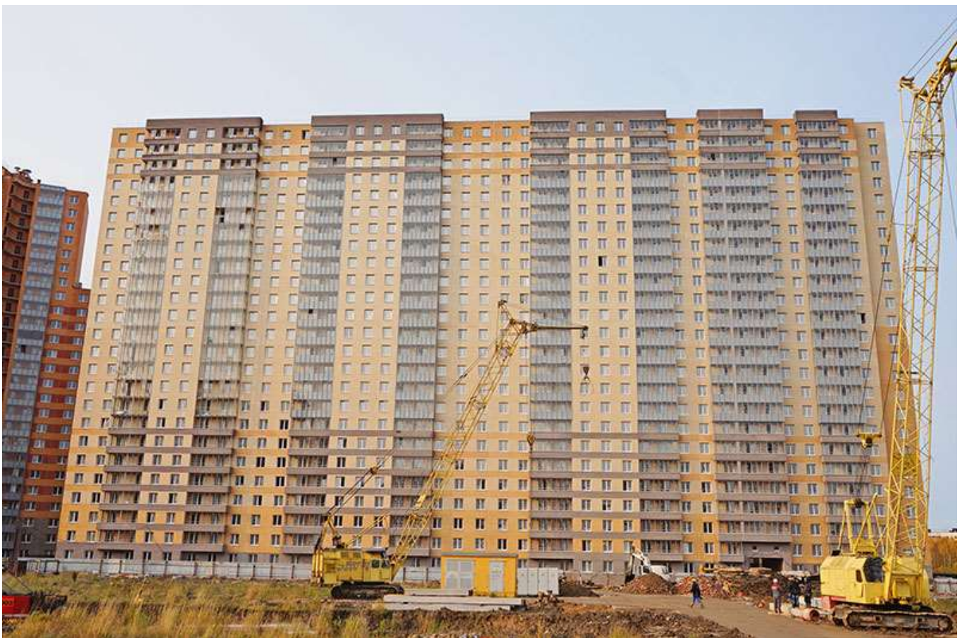
Вид на секции 11-8 со стороны Берёзовой ул.