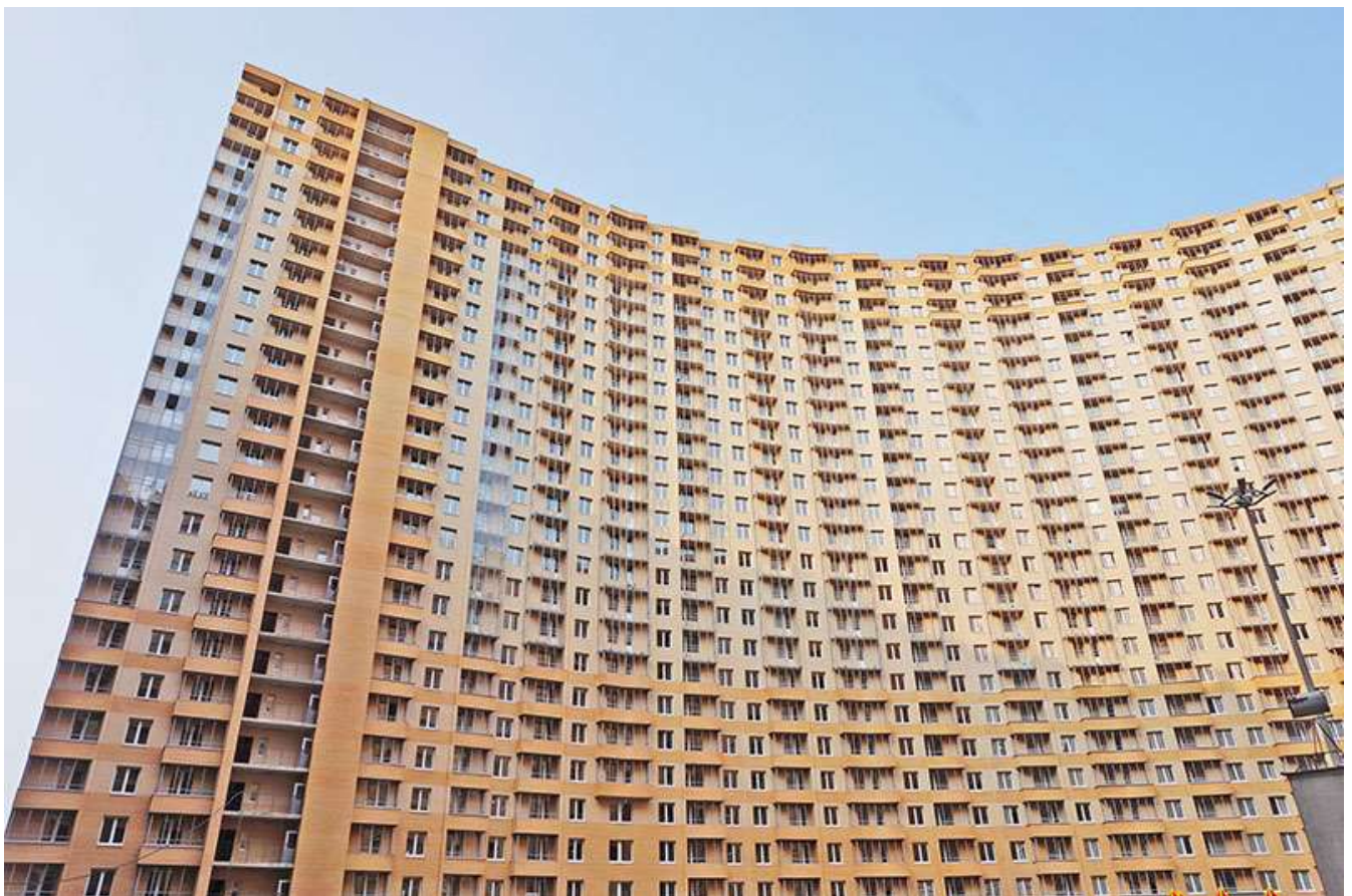
Вид на секции 1-5 со двора