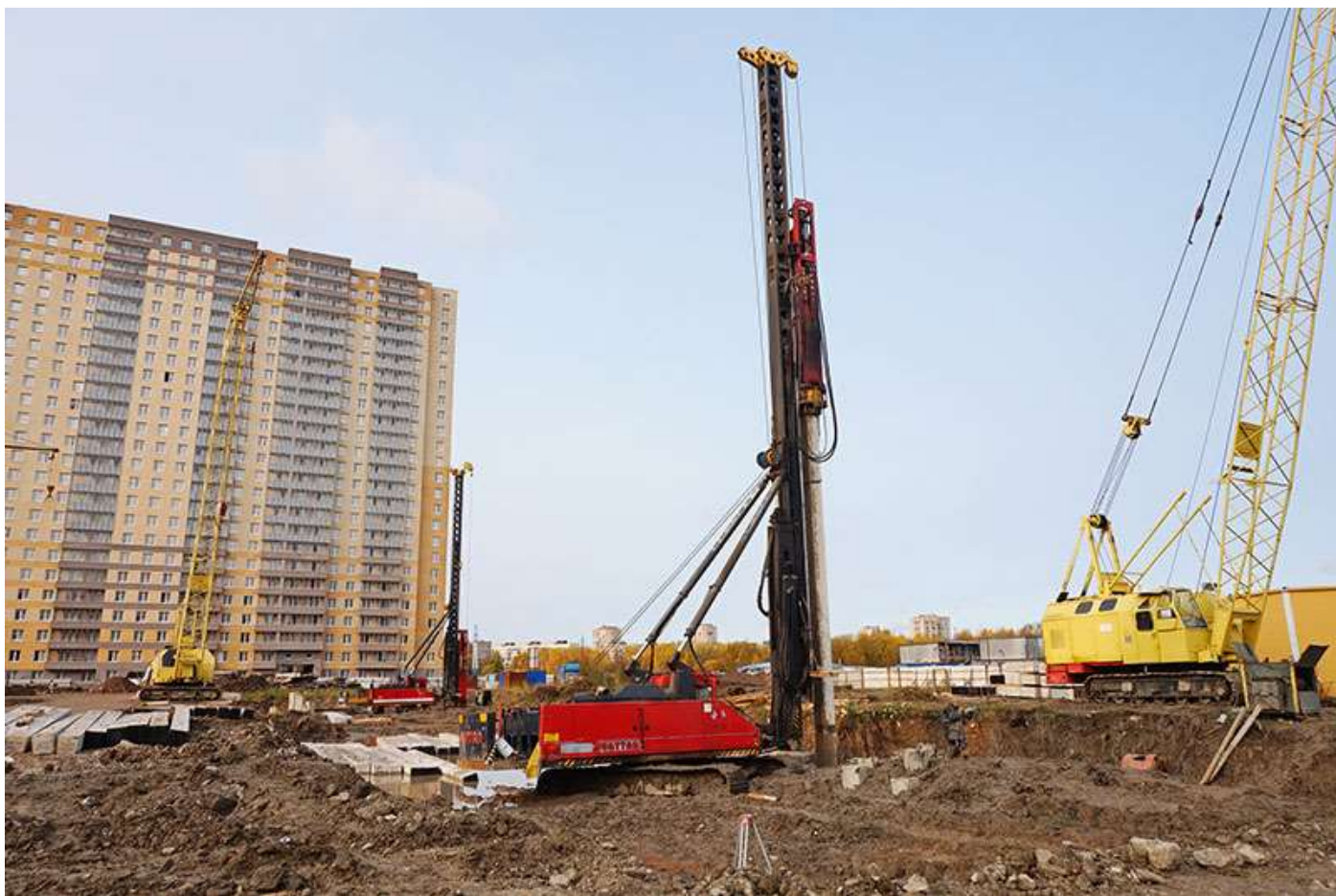
Вид на корпус 1 со стороны Областной ул.