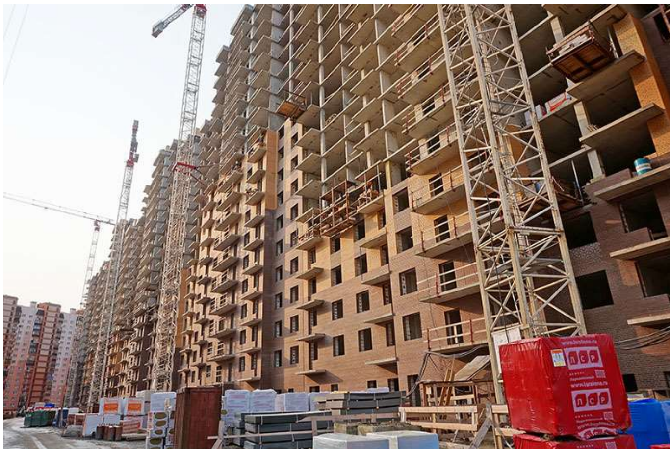
Вид на секции 2-7 со стороны Каштановой ал.