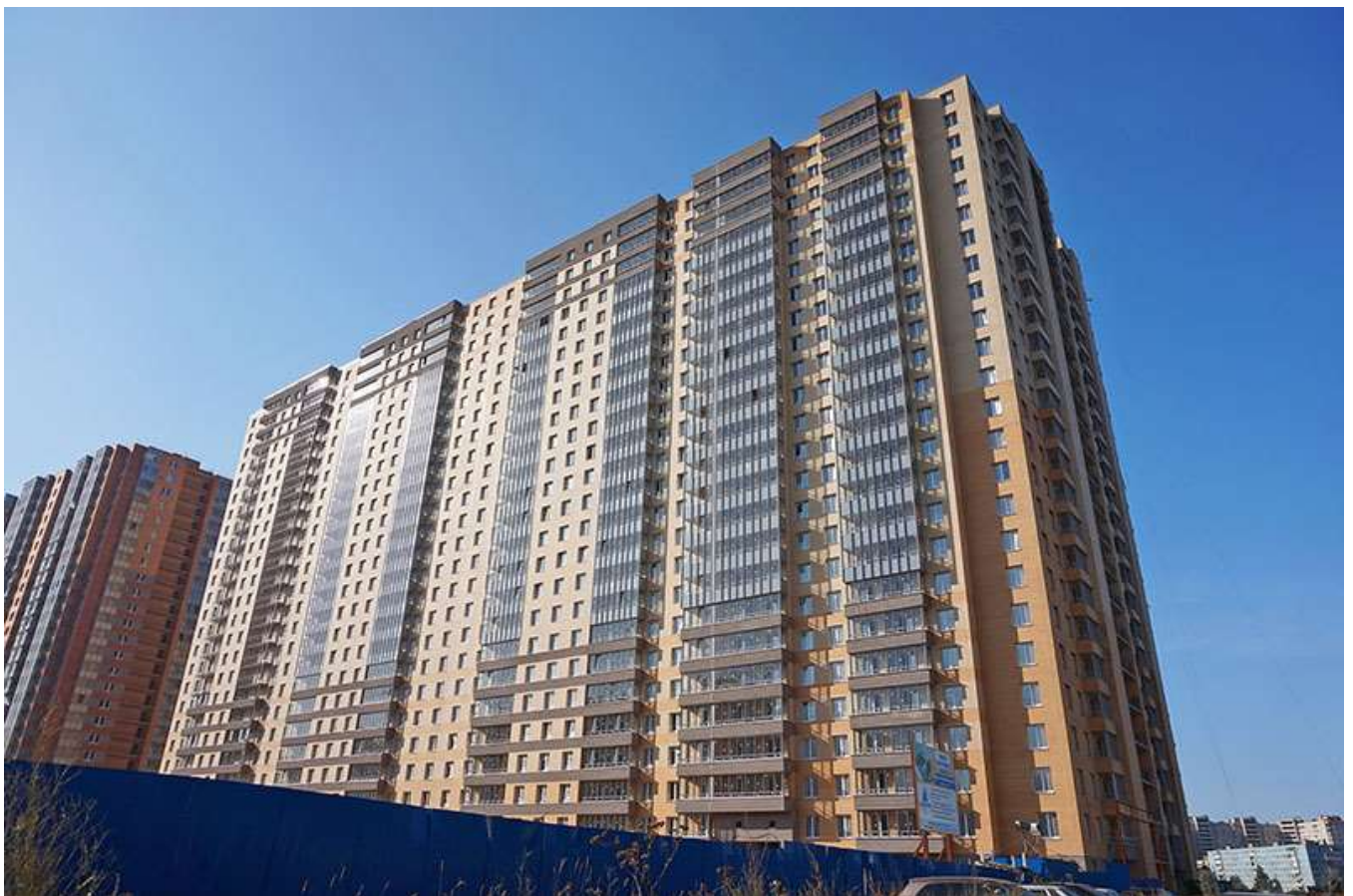
Вид на секции 11-8 со стороны Областной ул.