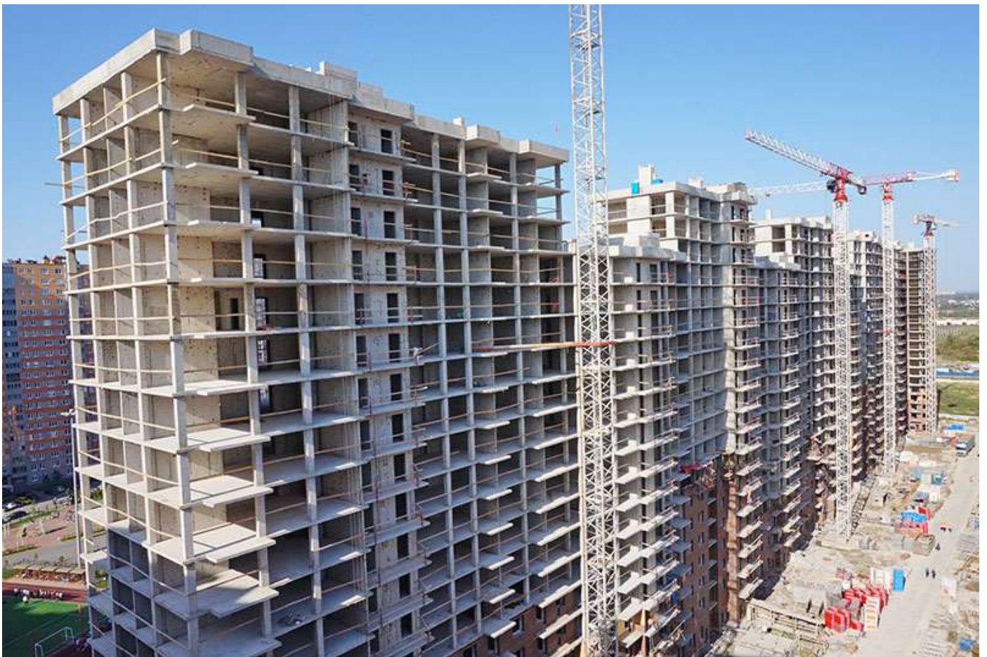
Вид на секции 1-9 со стороны Ленинградской ул.