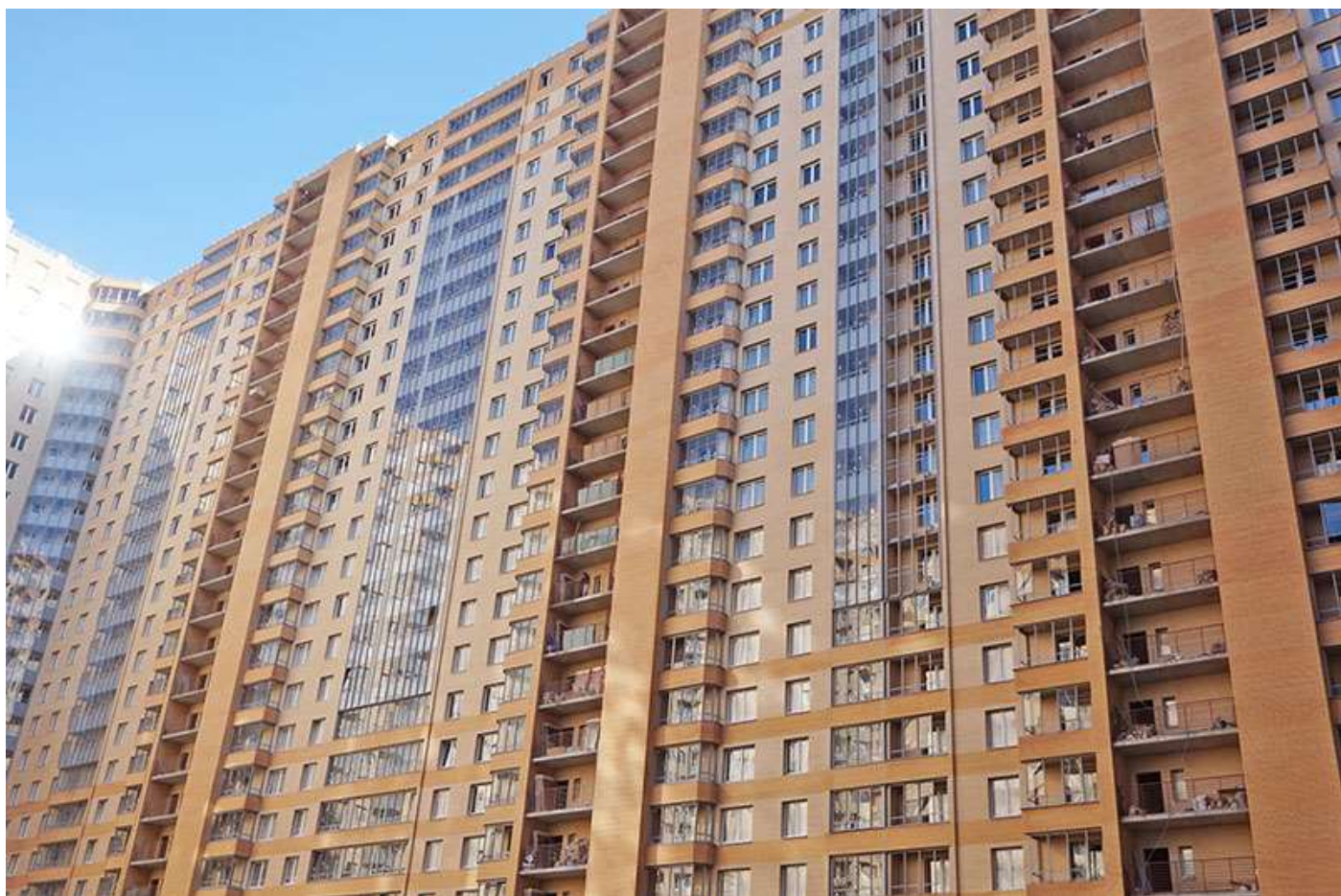
Вид на секции 8-11 со двора