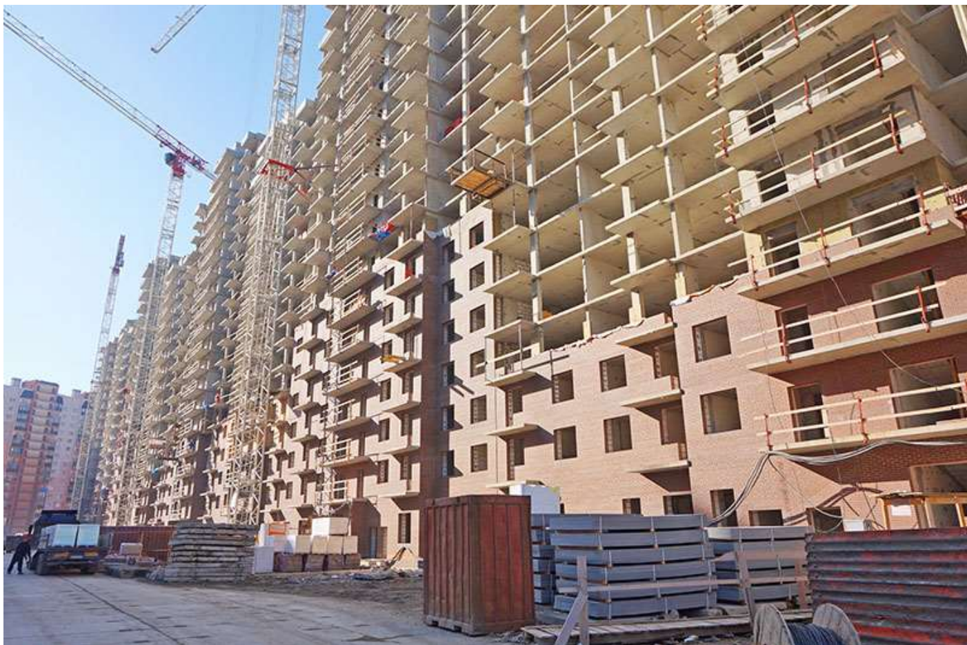
Вид на секции 2-7 со стороны Каштановой ал.