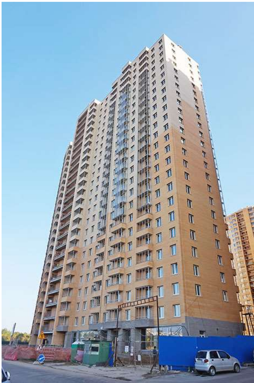
Вид на секции 2-1 со Областной ул.