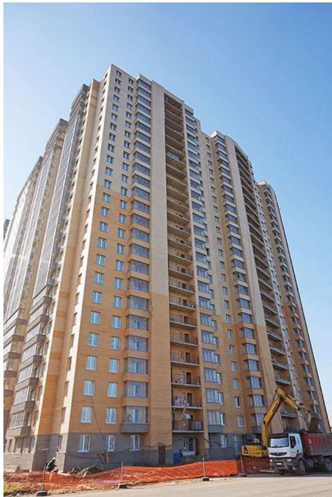
Вид на секции 8-7 со стороны Областной ул.