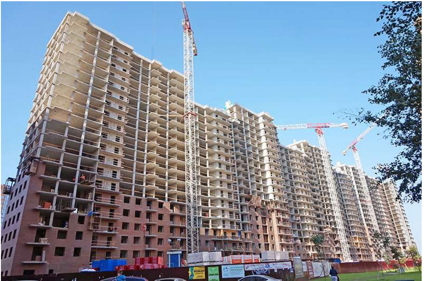
Вид на секции 1-9 со стороны Ленинградской ул.