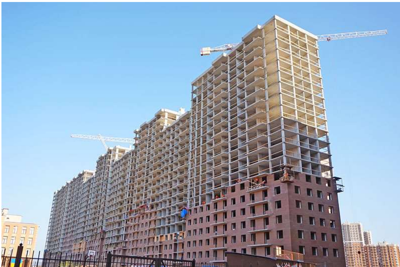
Вид на секции 9-1 со стороны Ленинградской ул.