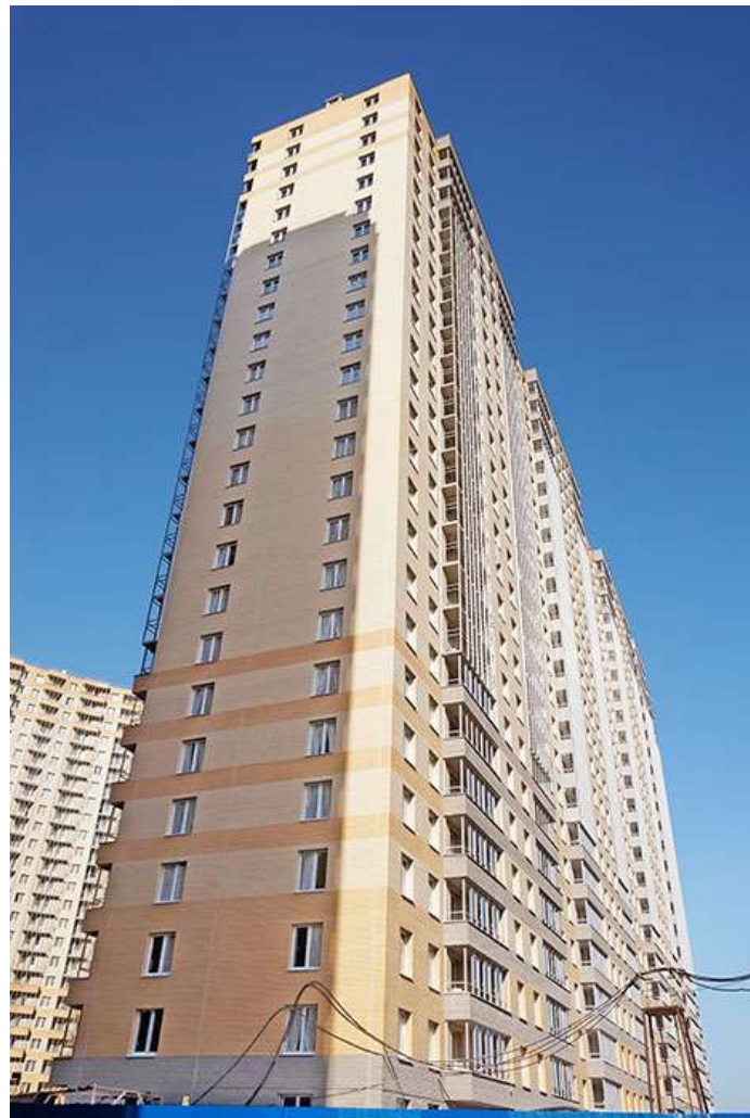
Вид на секции 11-10 со стороны Берёзовой ул.