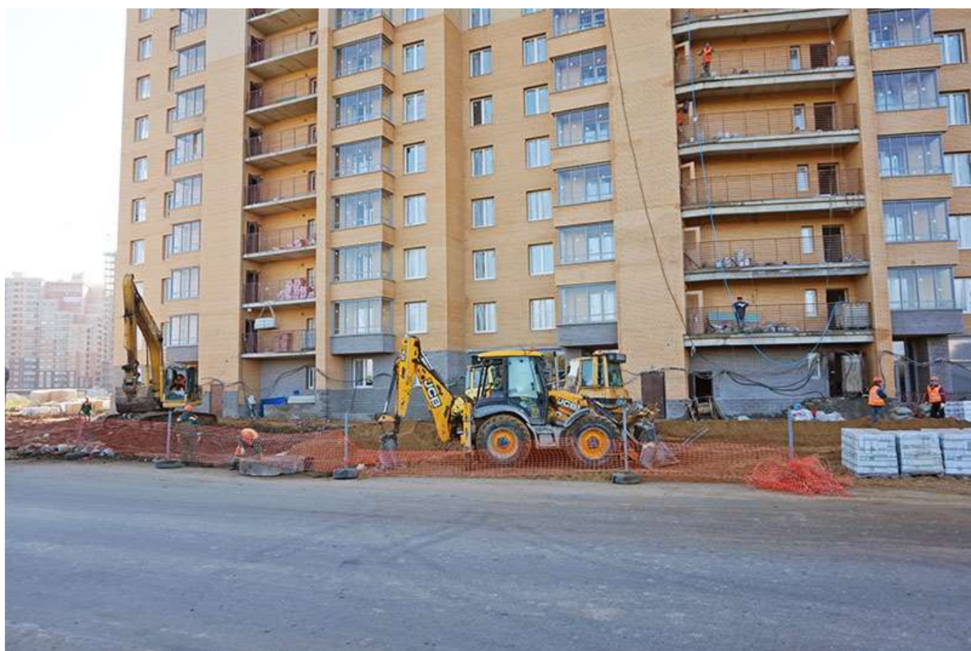
Вид на секции 8-7 с Областной ул.