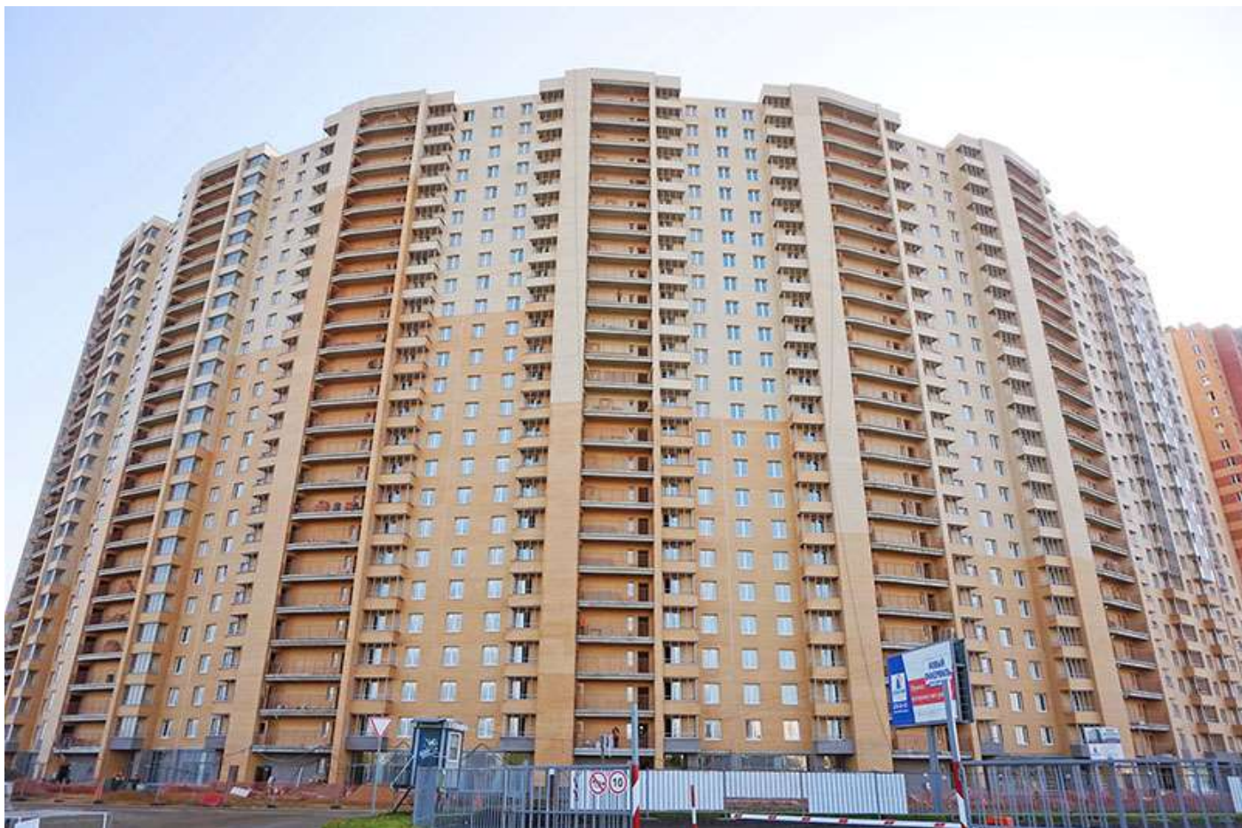
Вид на секции 7-1 с Областной ул.