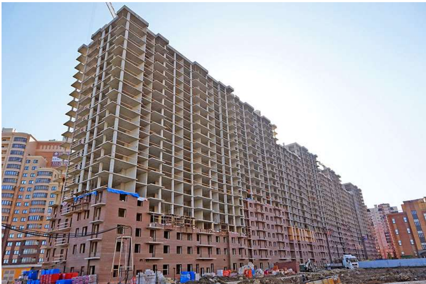
Вид на секции 9-1 со стороны Областной ул.