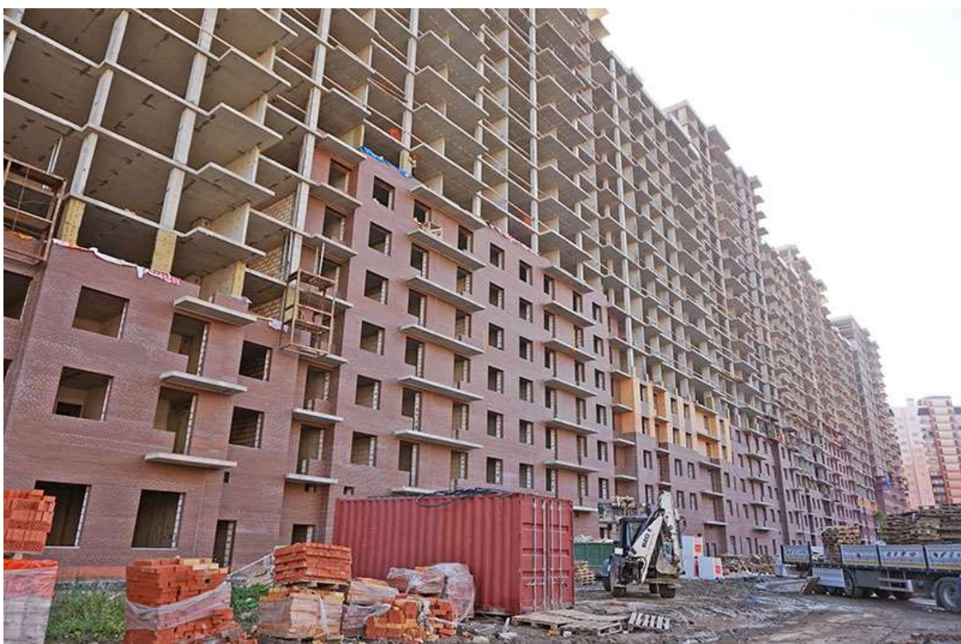
Вид на секции 6-1 со стороны Берёзовой ул.