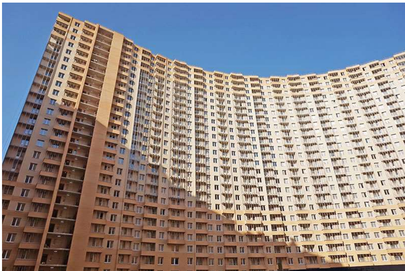
Вид на секции 1-5 со двора