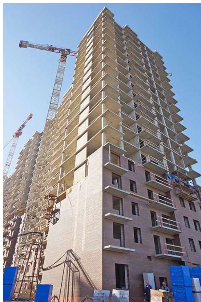
Вид на секцию 9 со стороны Областной ул.