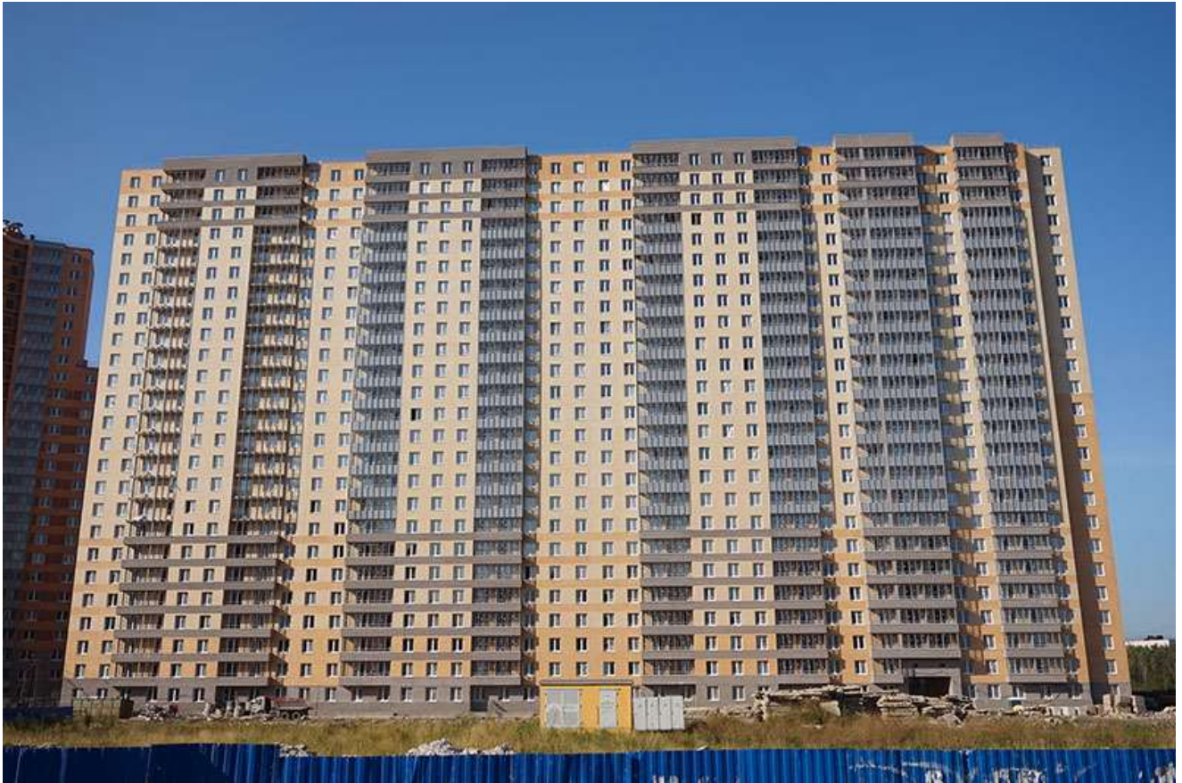
Вид на секции 11-8 со стороны Берёзовой ул.