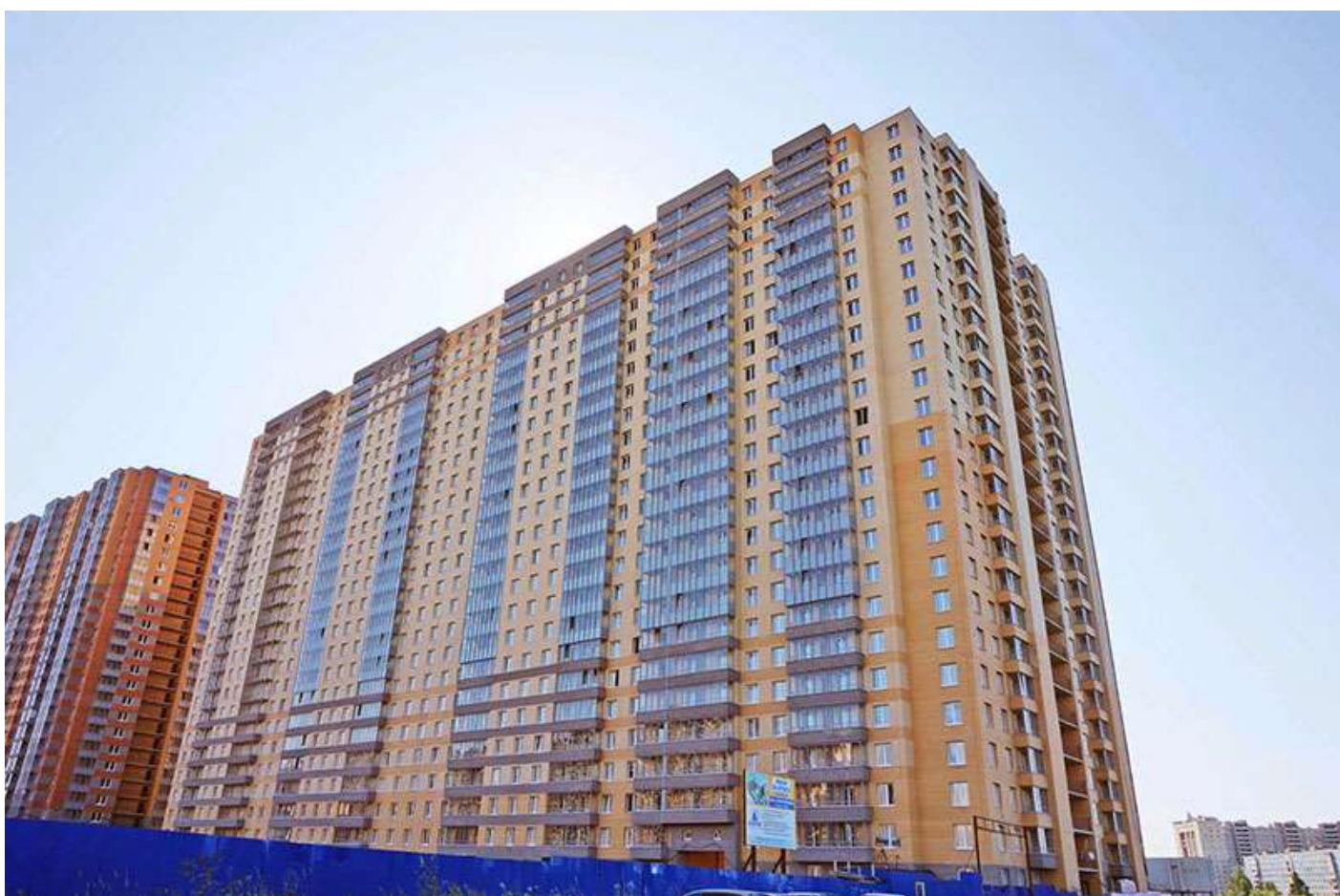
Вид на секции 11-7 со стороны Областной ул.