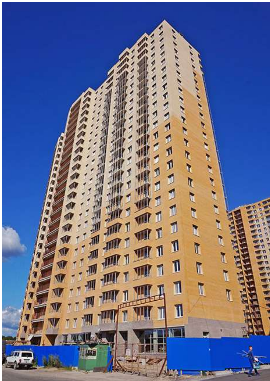
Вид на секции 2-1 со Областной ул.