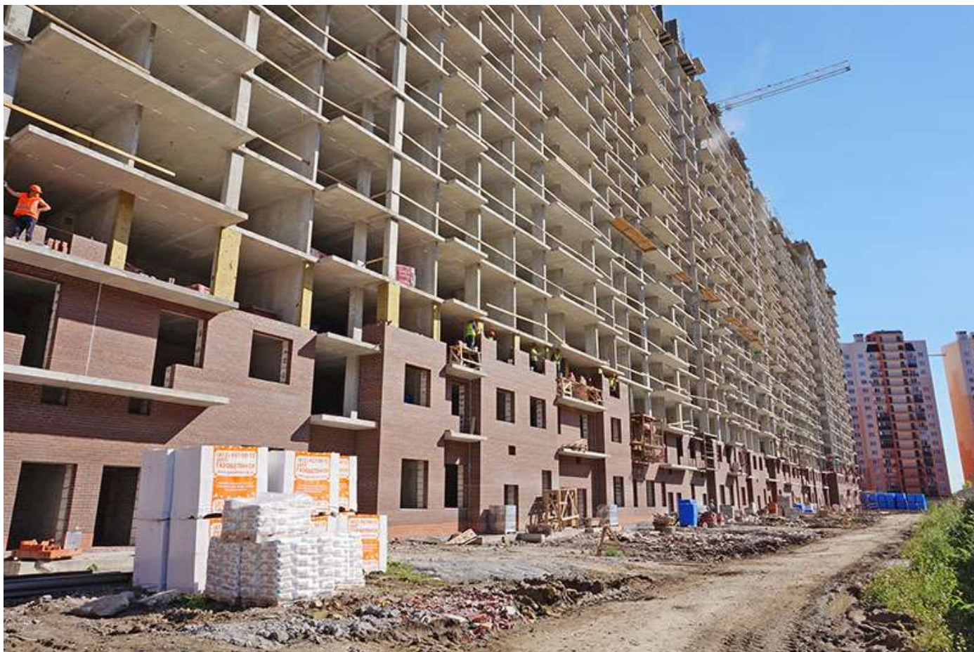
Вид на секции 6-1 со стороны Берёзовой ул.