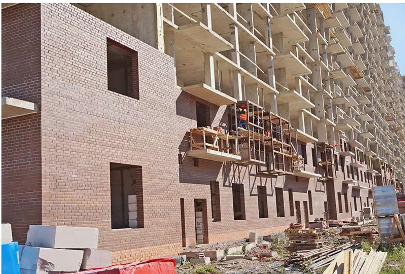
Вид на секции 9-8 со стороны Берёзовой ул.