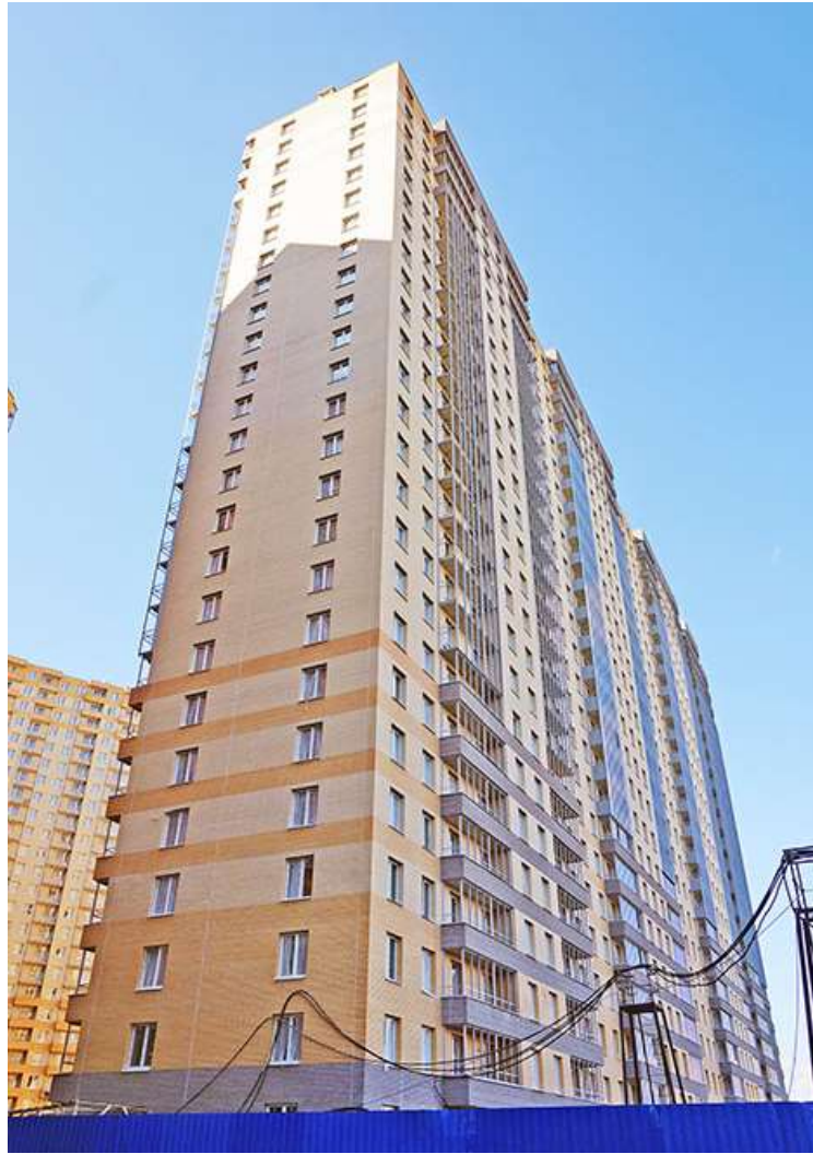
Вид на секции 11-9 со стороны Берёзовой ул.