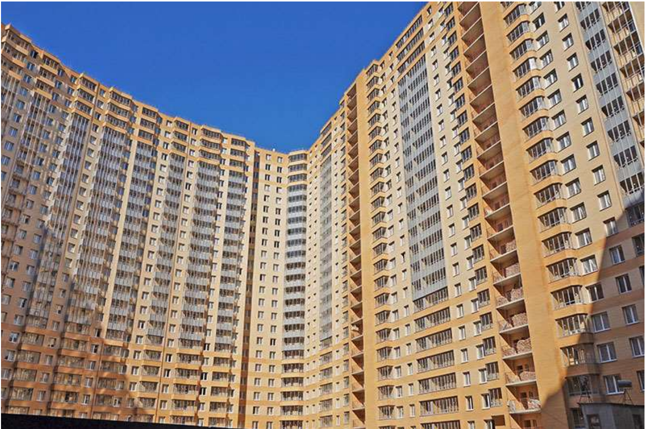
Вид на секции 5-10 со двора