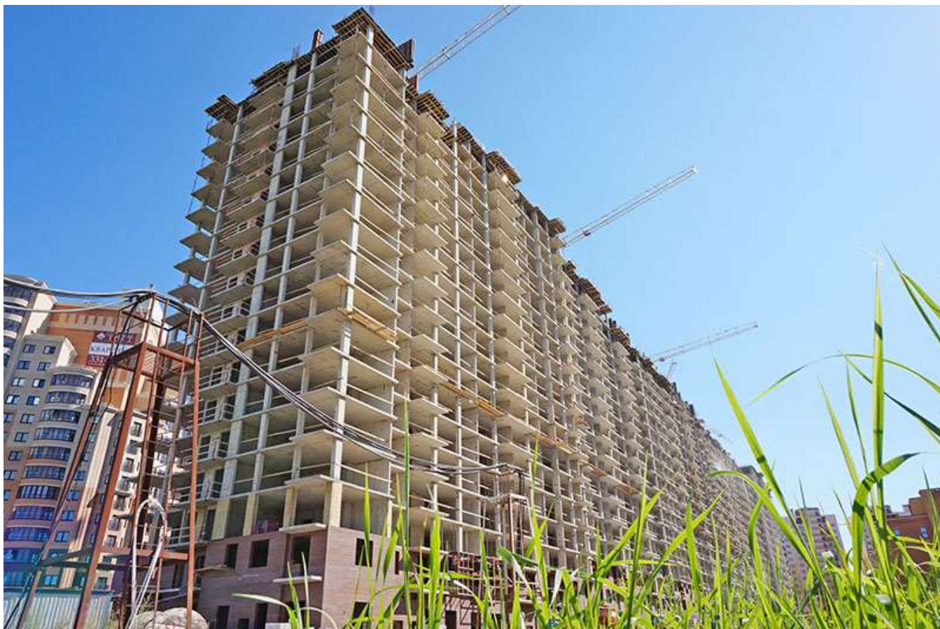
Вид на секции 9-1 со стороны Областной ул.