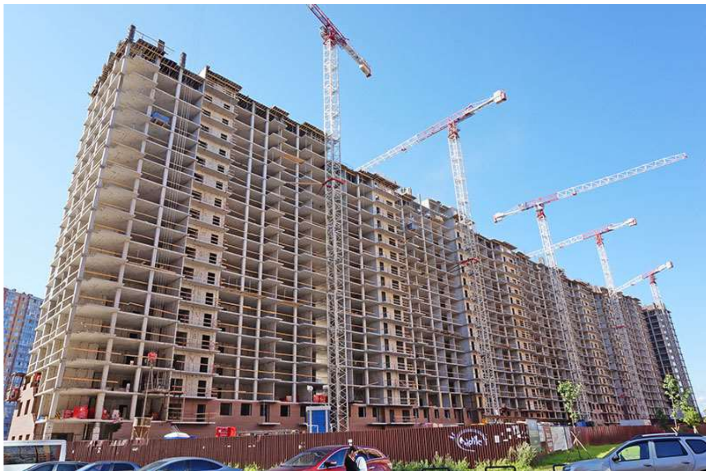
Вид на секции 1-9 со стороны Ленинградской ул.