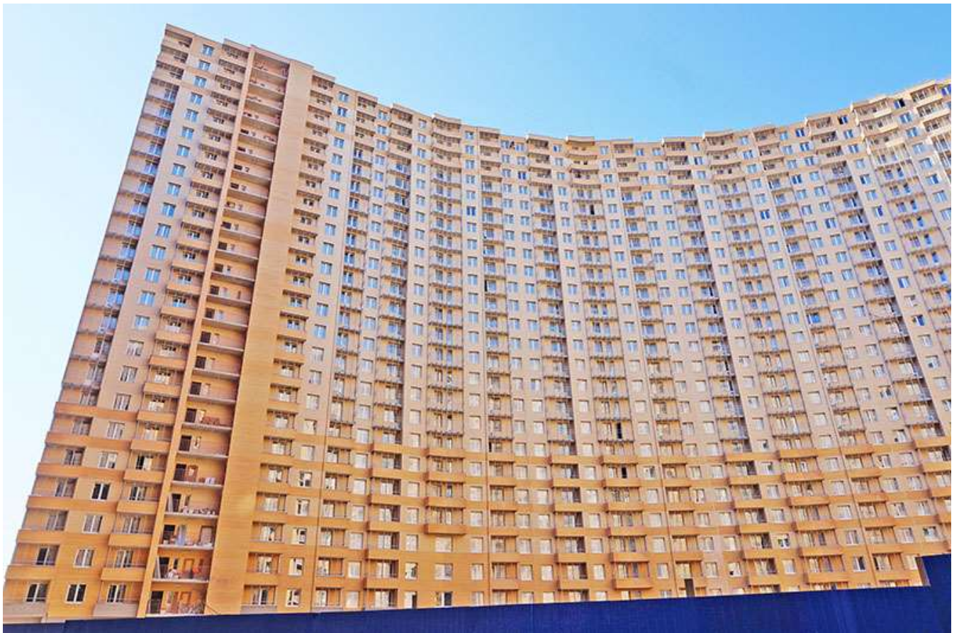
Вид на секции 1-5 со двора