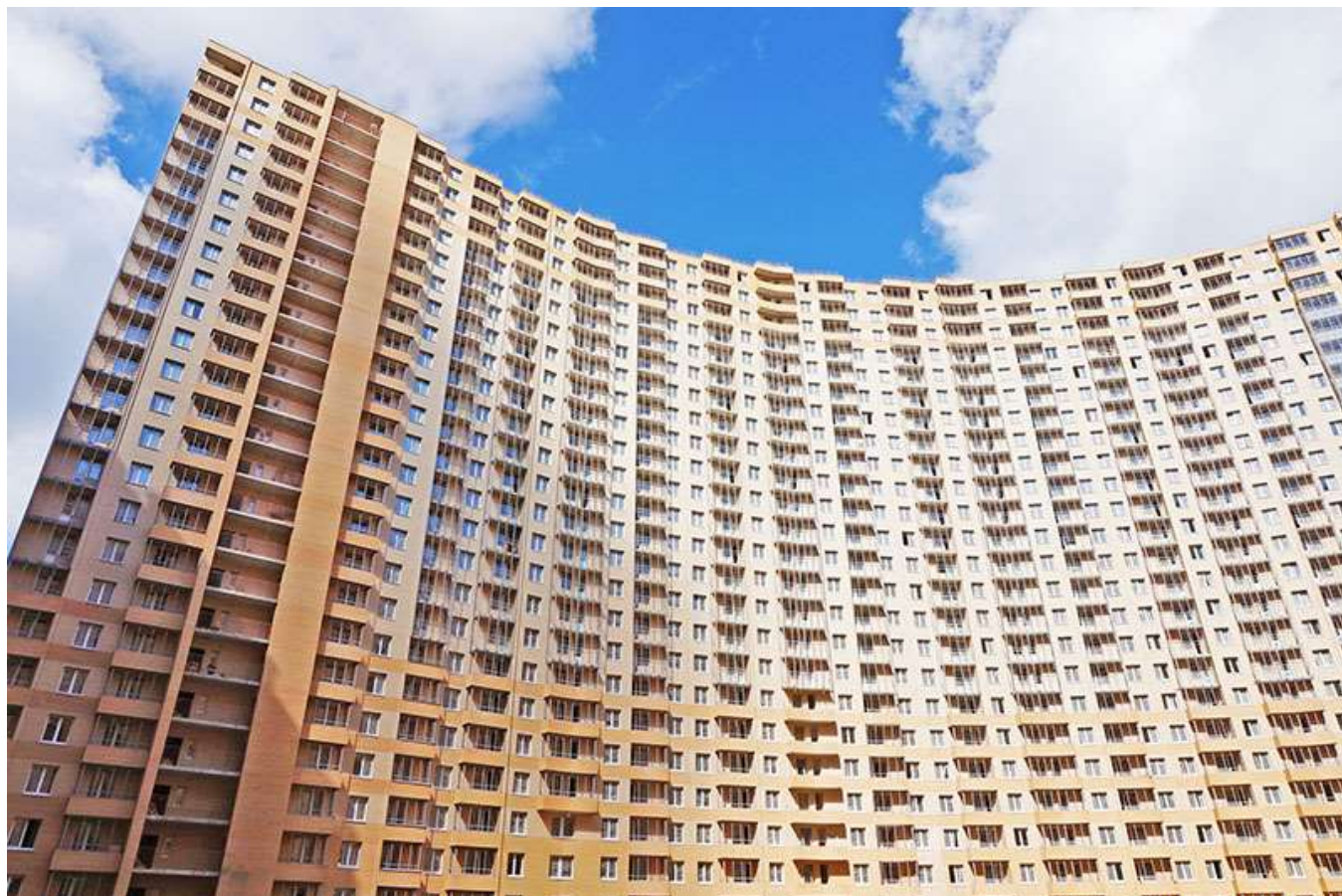
Вид на секции 1-5 со двора