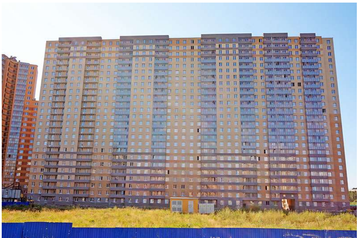
Вид на секции 11-8 со стороны Берёзовой ул.