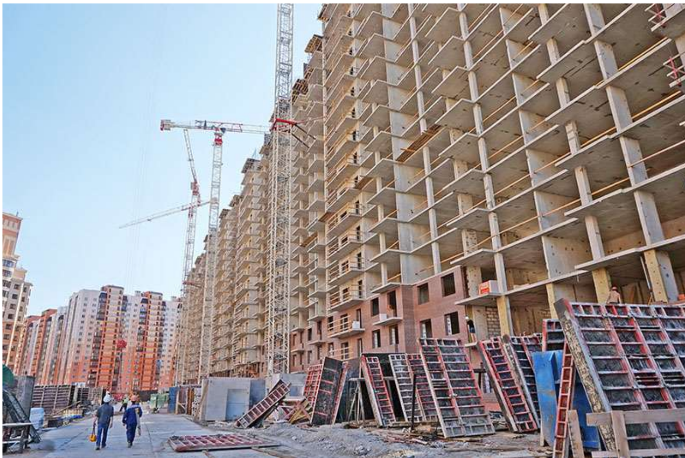
Вид на секции 2-7 со стороны Каштановой ал.