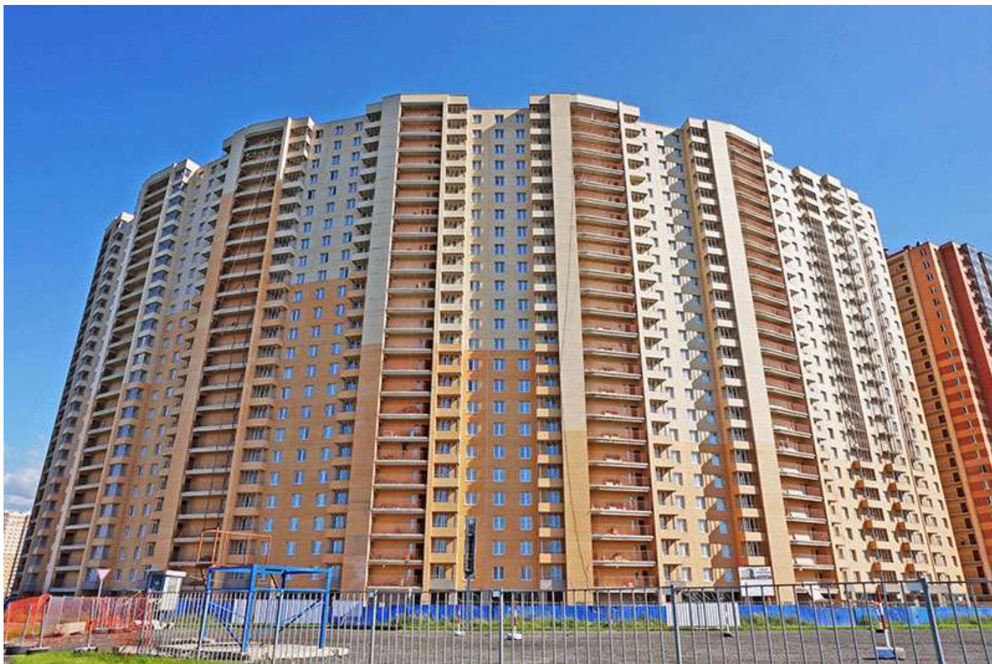
Вид на секции 7-1 с Областной ул.