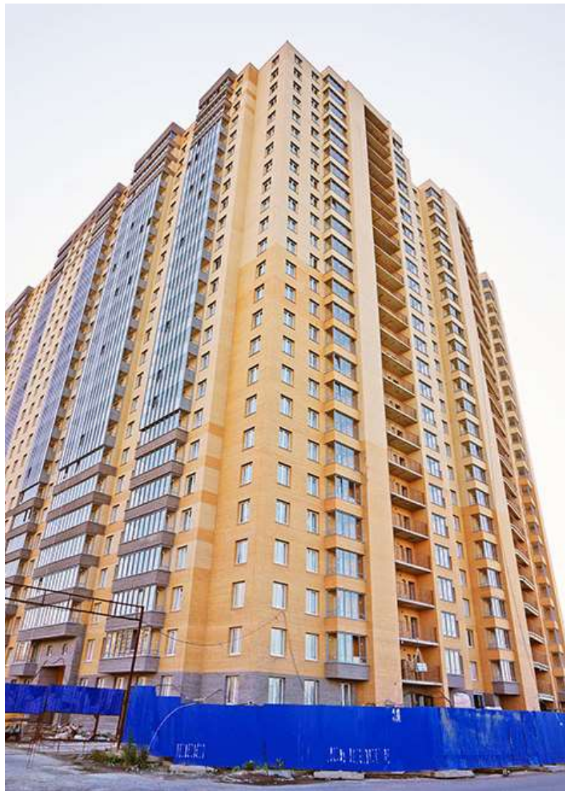
Вид на секции 11-8 со стороны Областной ул.