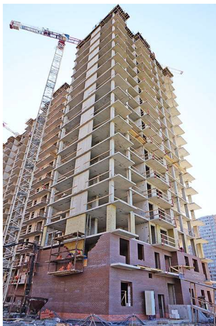
Вид на секцию 1 со стороны Областной ул.