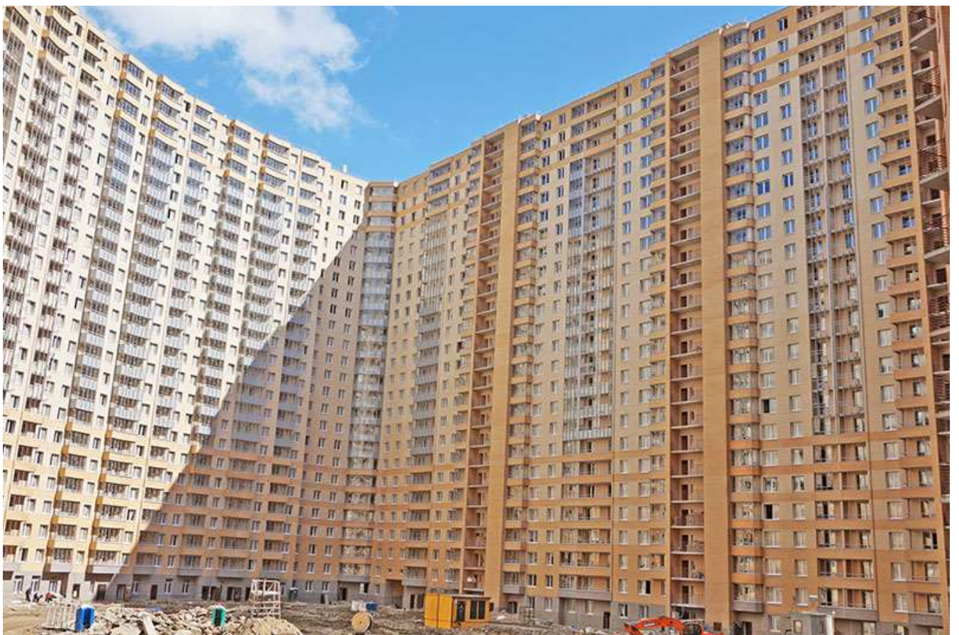
Вид на секции 5-10 со двора