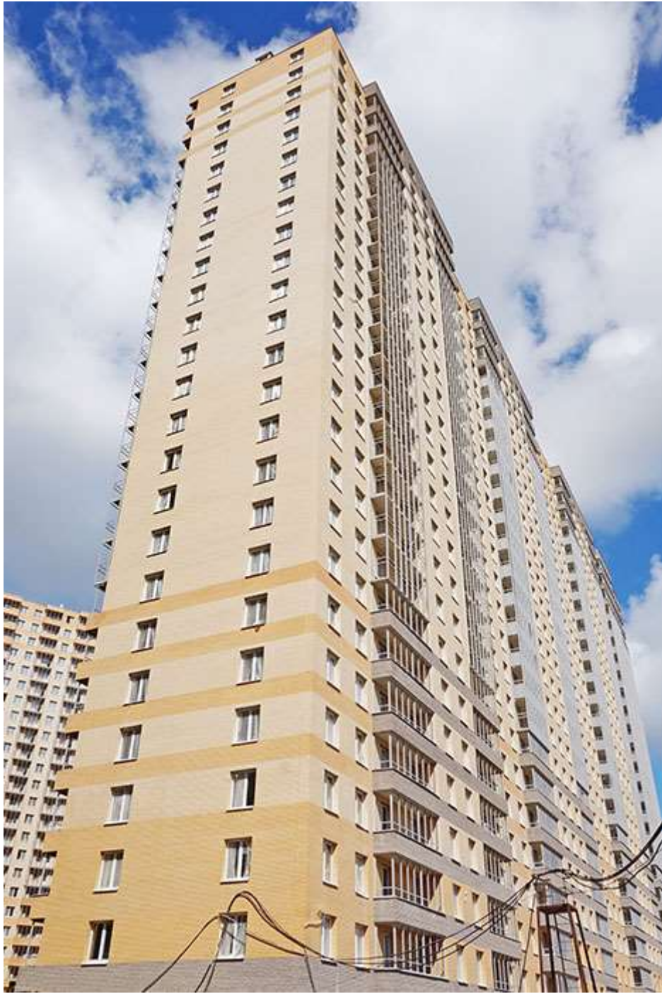
Вид на секции 11-9 со стороны Берёзовой ул.