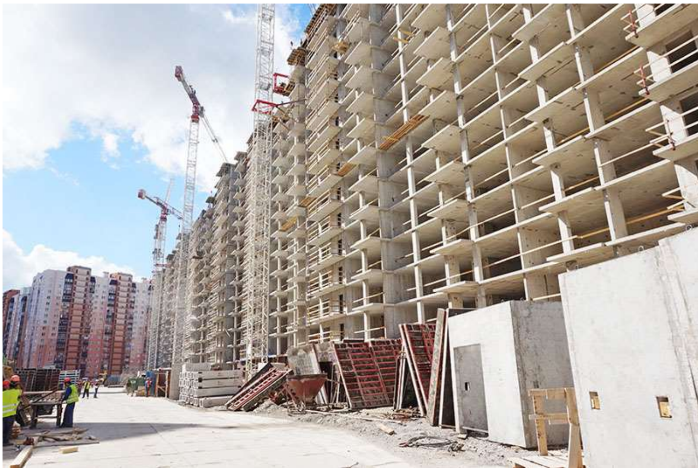
Вид на секции 2-7 со стороны Каштановой ал.