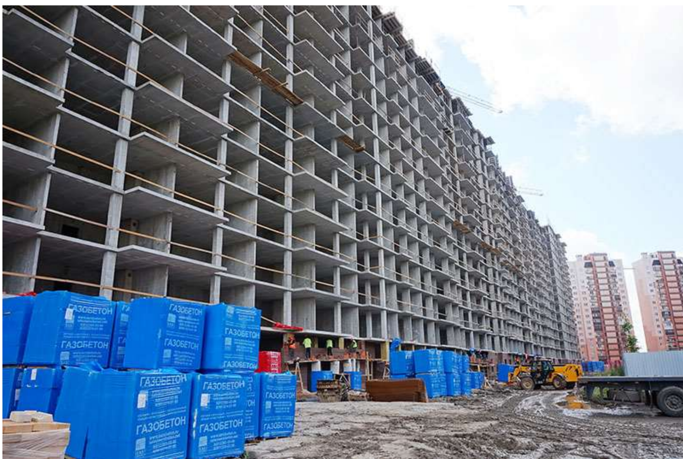
Вид на секции 7-1 со стороны Берёзовой ул.