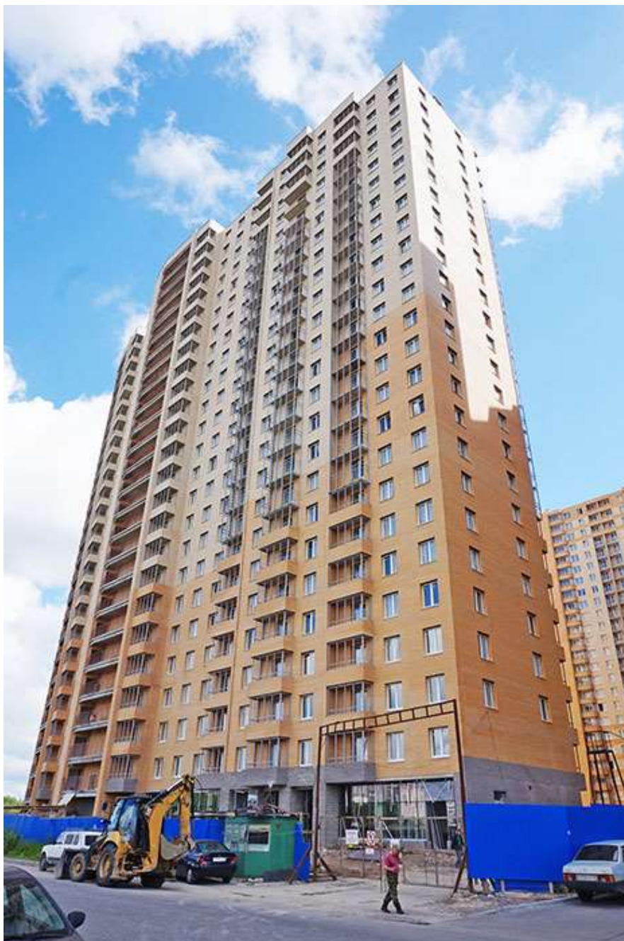
Вид на секции 2-1 со Областной ул.