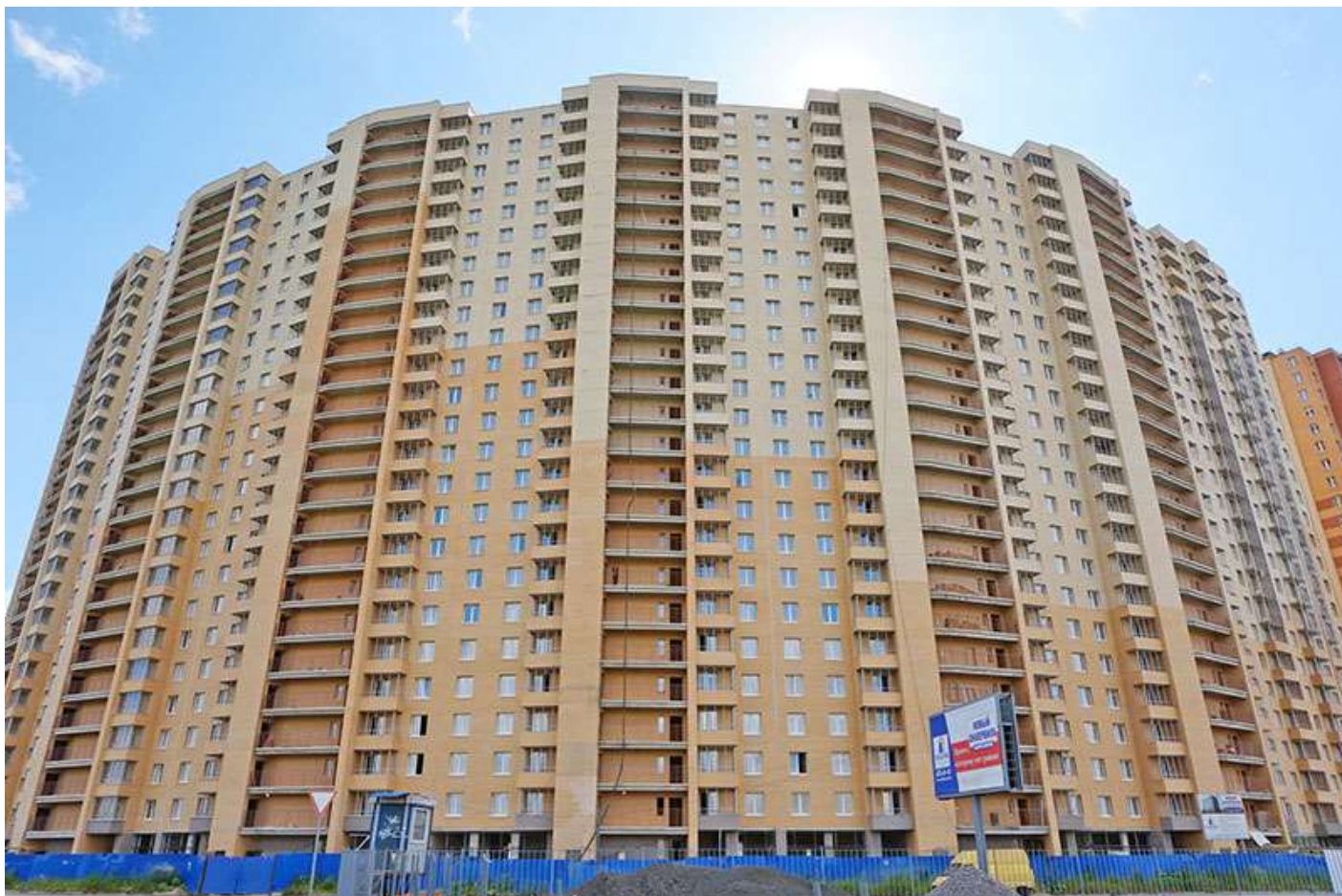
Вид на секции 7-1 с Областной ул.