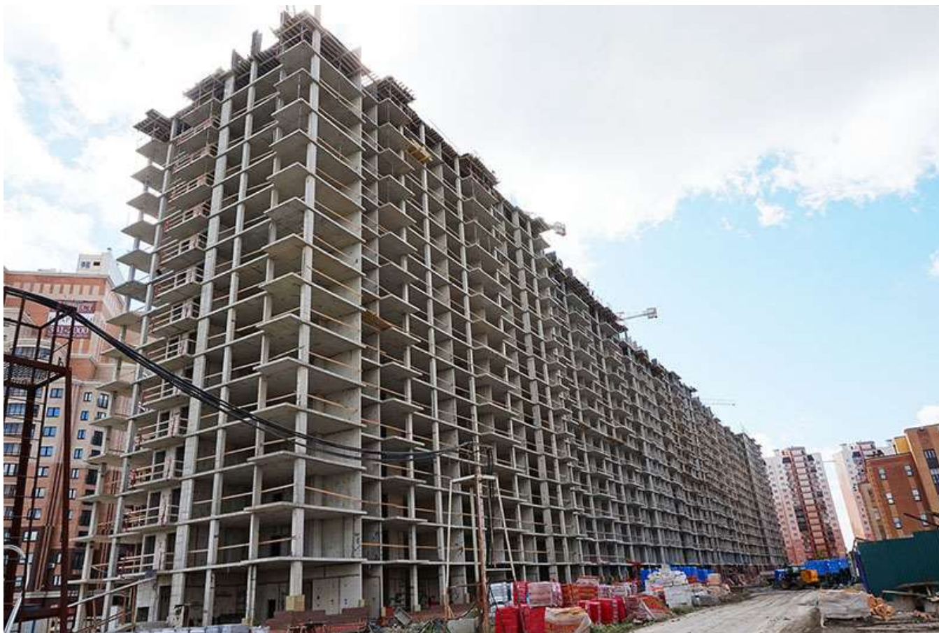
Вид на секции 9-1 со стороны Областной ул.