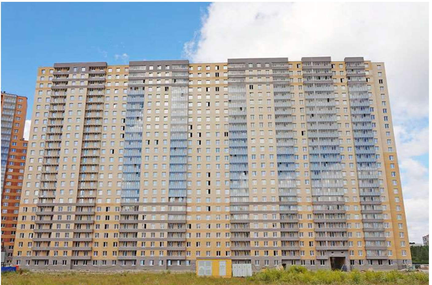
Вид на секции 11-8 со стороны Берёзовой ул.