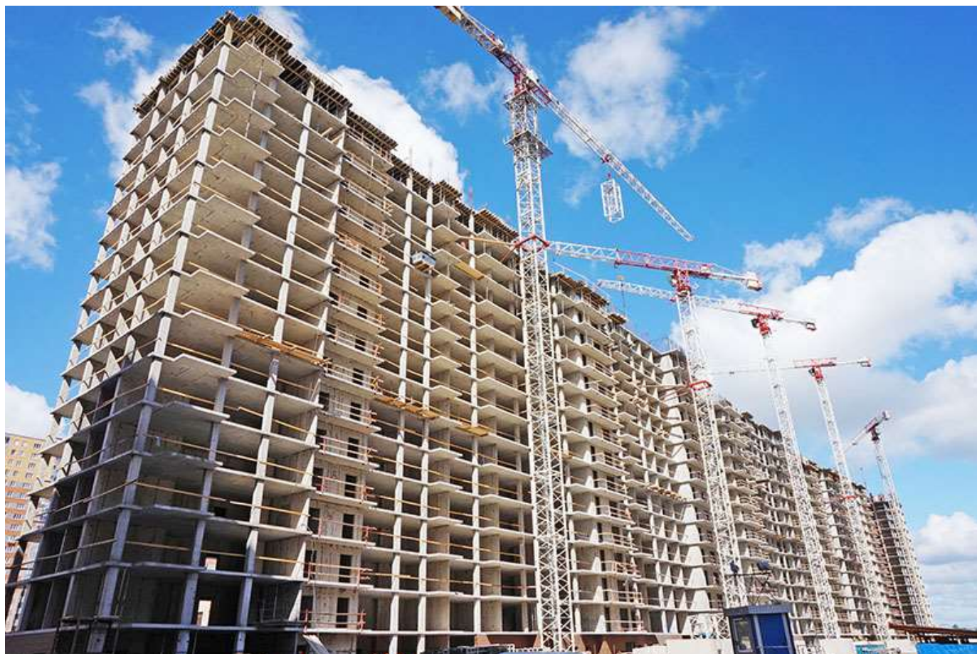
Вид на секции 1-9 со стороны Ленинградской ул.