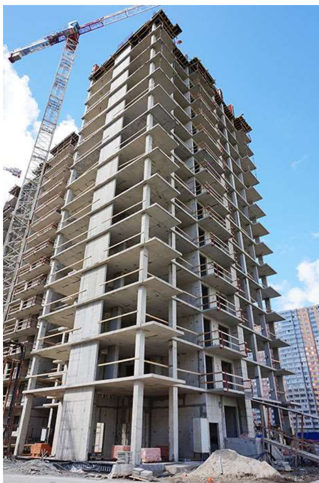
Вид на секцию 1 со стороны Областной ул.