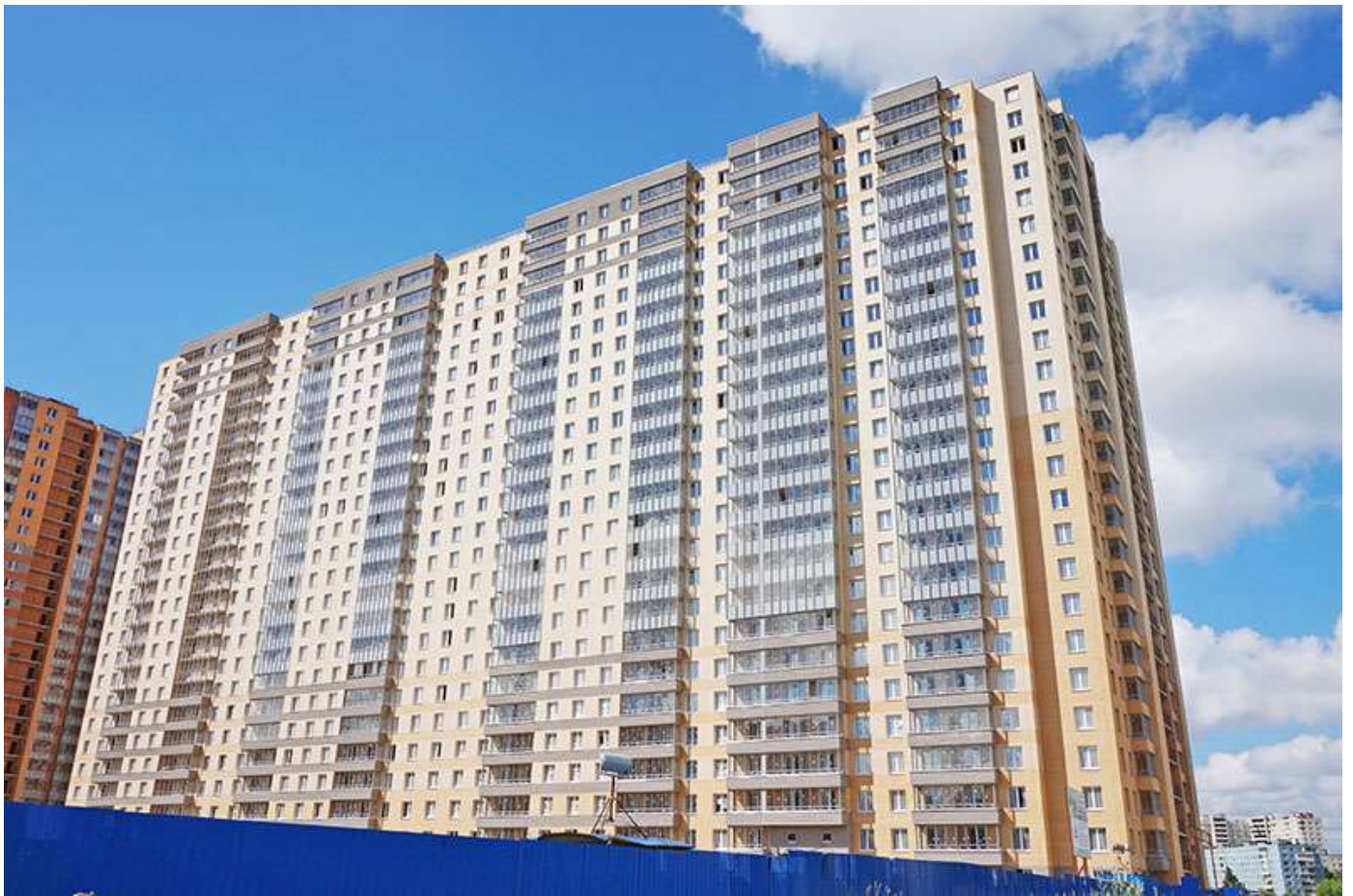
Вид на секции 11-8 со стороны Областной ул.