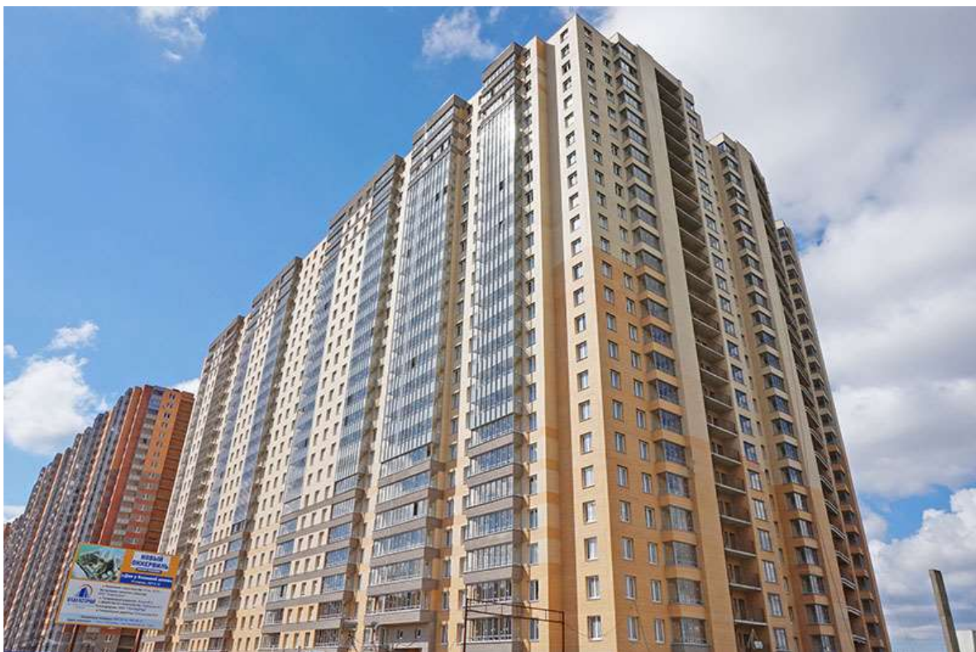
Вид на секции 11-7 со стороны Областной ул.