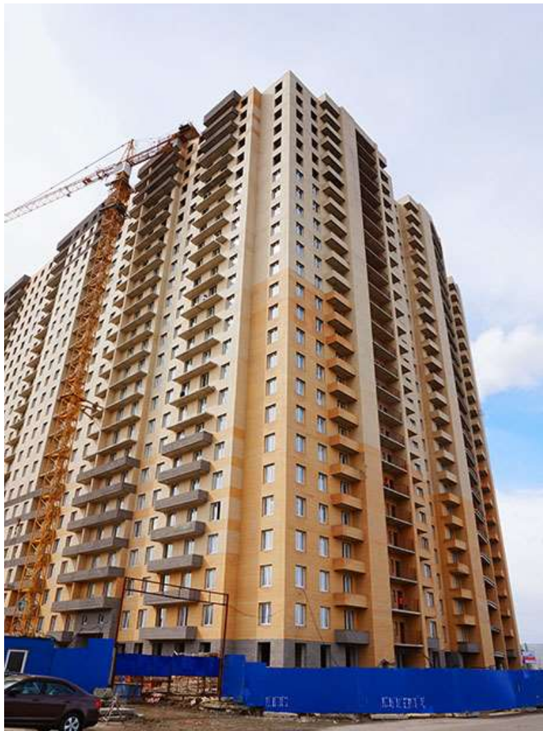
Вид на секции 9-6 с Областной ул.