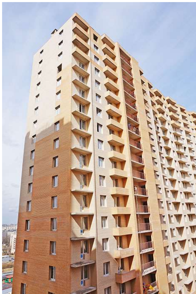
Вид на секции 1-2 со двора