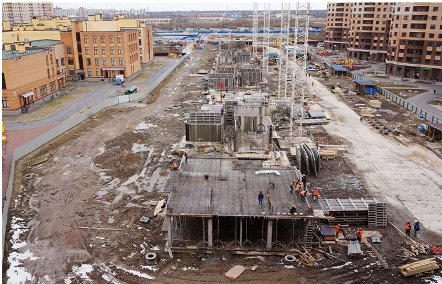
Вид со стороны Ленинградской ул.