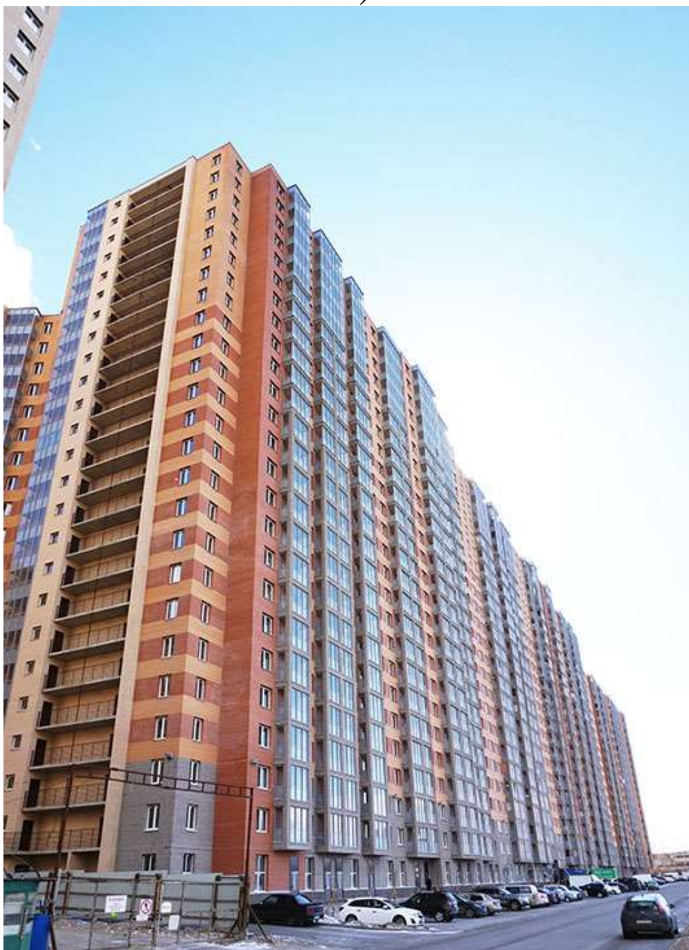
Вид со стороны Областной улицы, секции 20-15