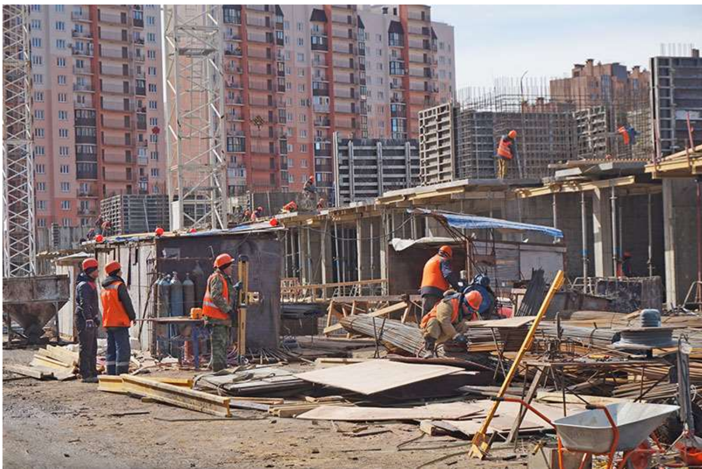
Вид на секции 2-4 со стороны Каштановой ал.