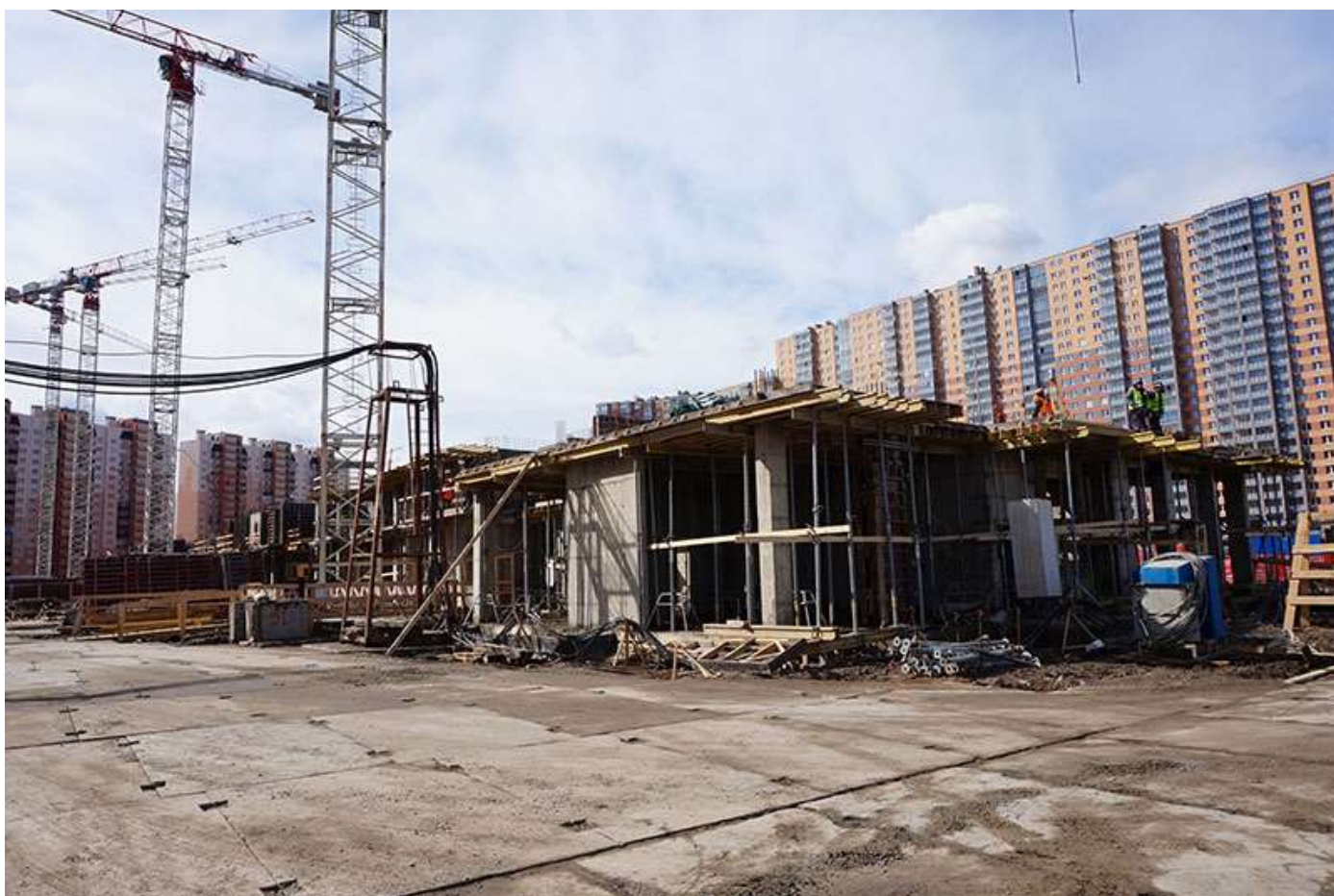
Вид на секции 8-9 со стороны Областной ул.