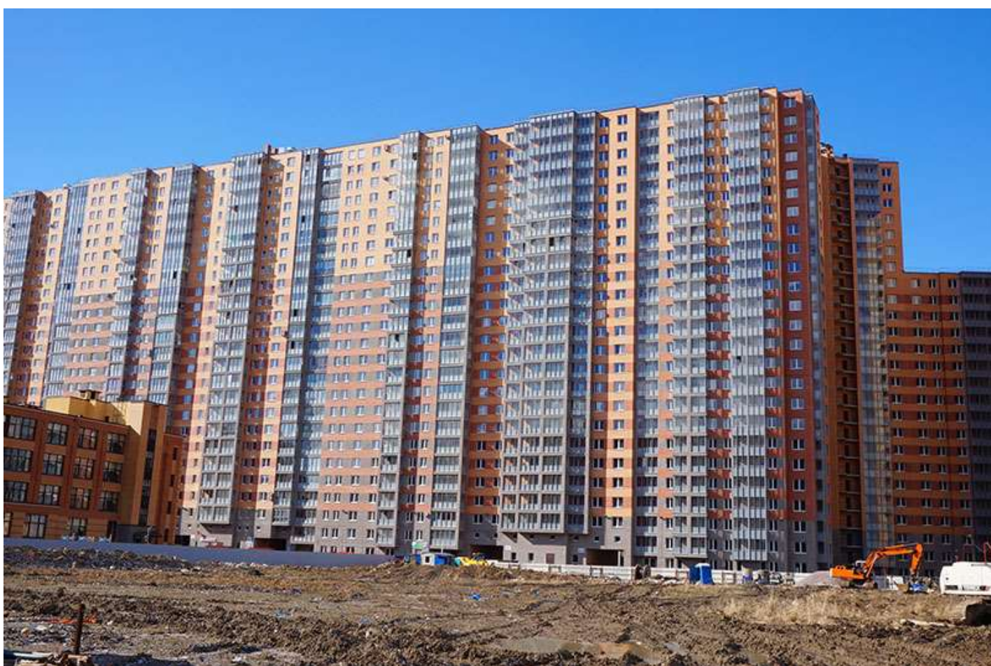
Вид с Областной улицы, секции 25-22