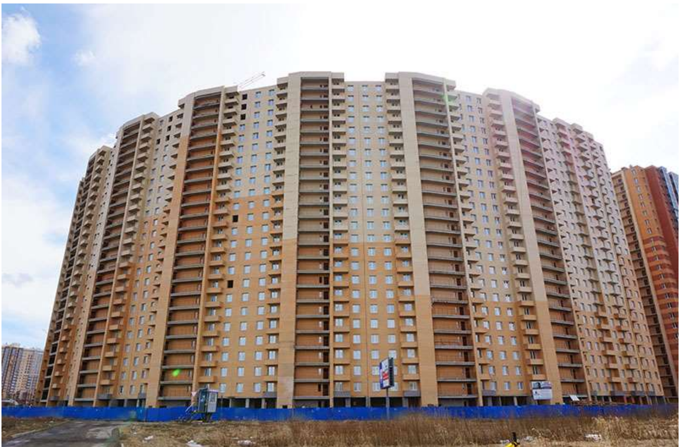
Вид на секции 7-1 с Областной ул.