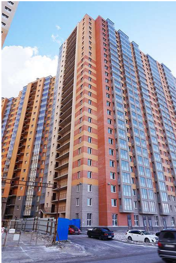
Вид со стороны Областной улицы, секции 22-19