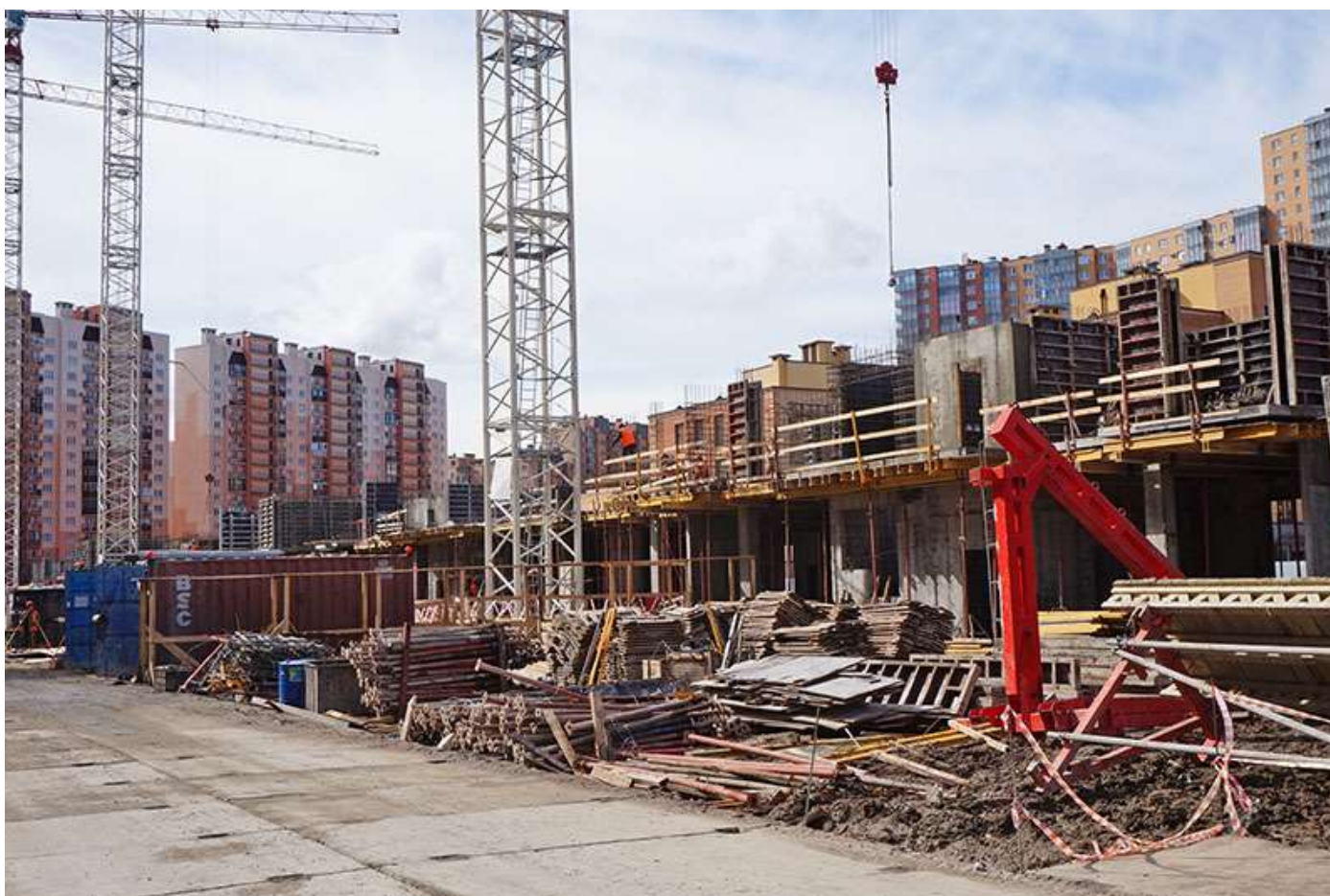
Вид на секции 3-7 со стороны Каштановой ал.