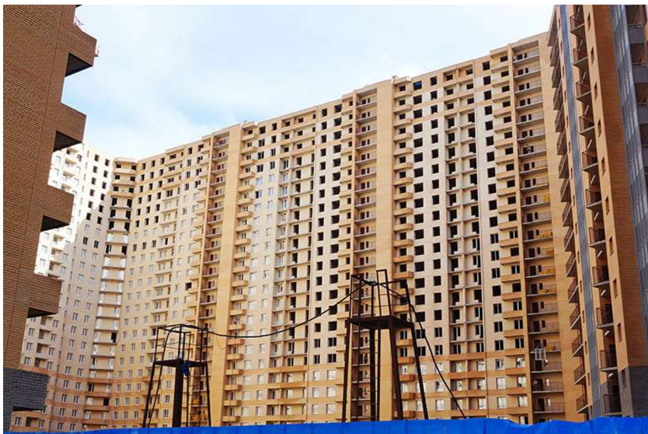
Вид на секции 7-11 с Областной ул.