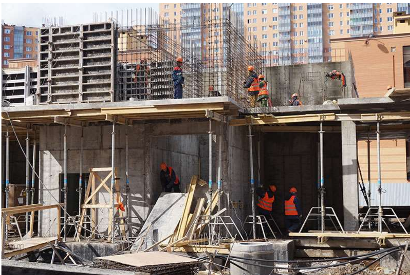
Вид на секцию 7 со стороны Каштановой ал.