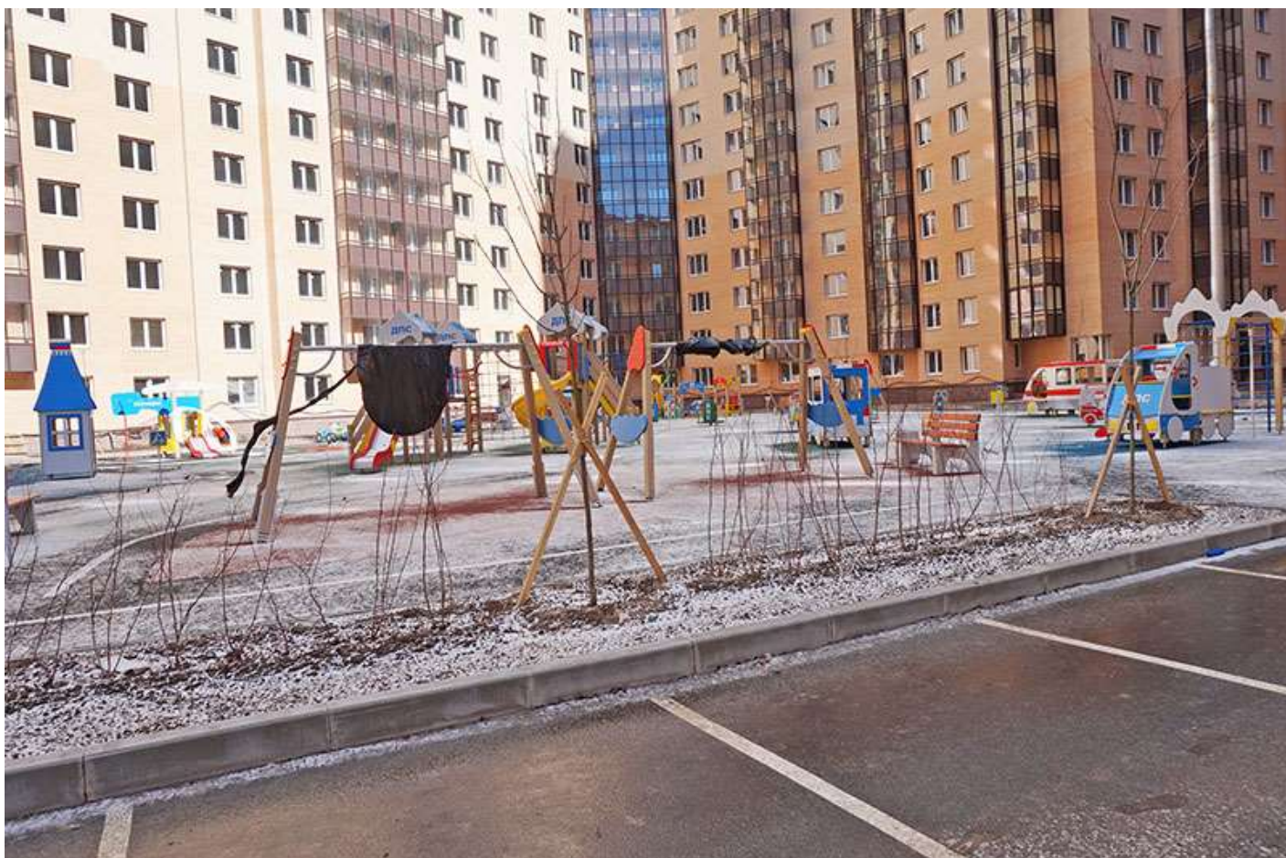
Детская площадка во дворе