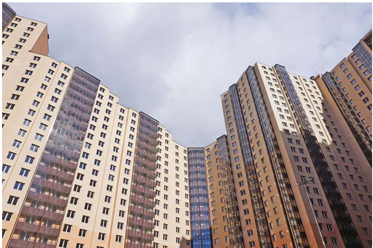
Вид со двора, секции 20-23