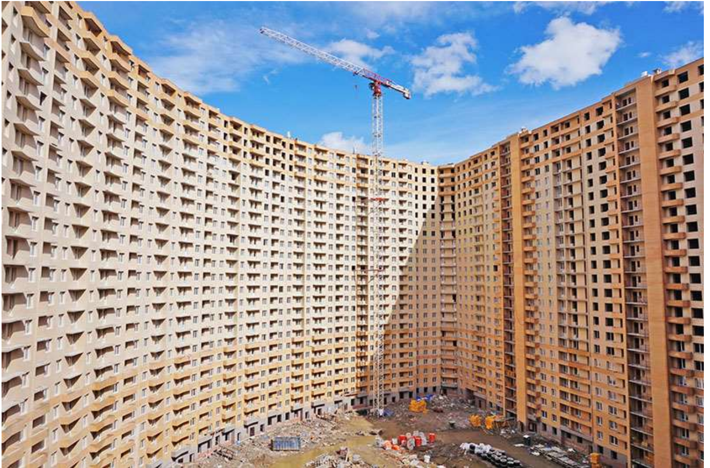
Вид на секции 2-10 со двора