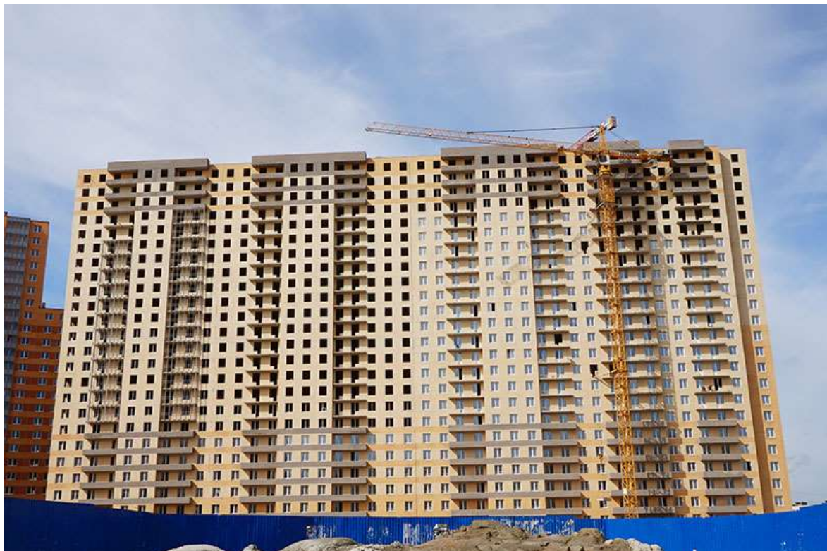
Вид на секции 11-8 со стороны Областной ул.