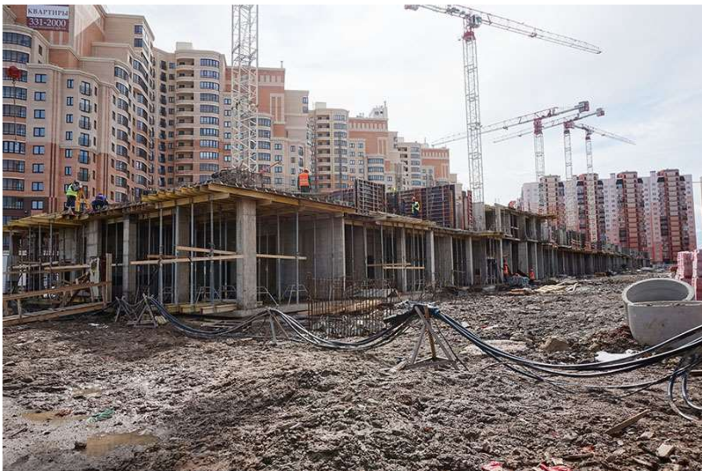
Вид на секции 9-1 со стороны Областной ул.