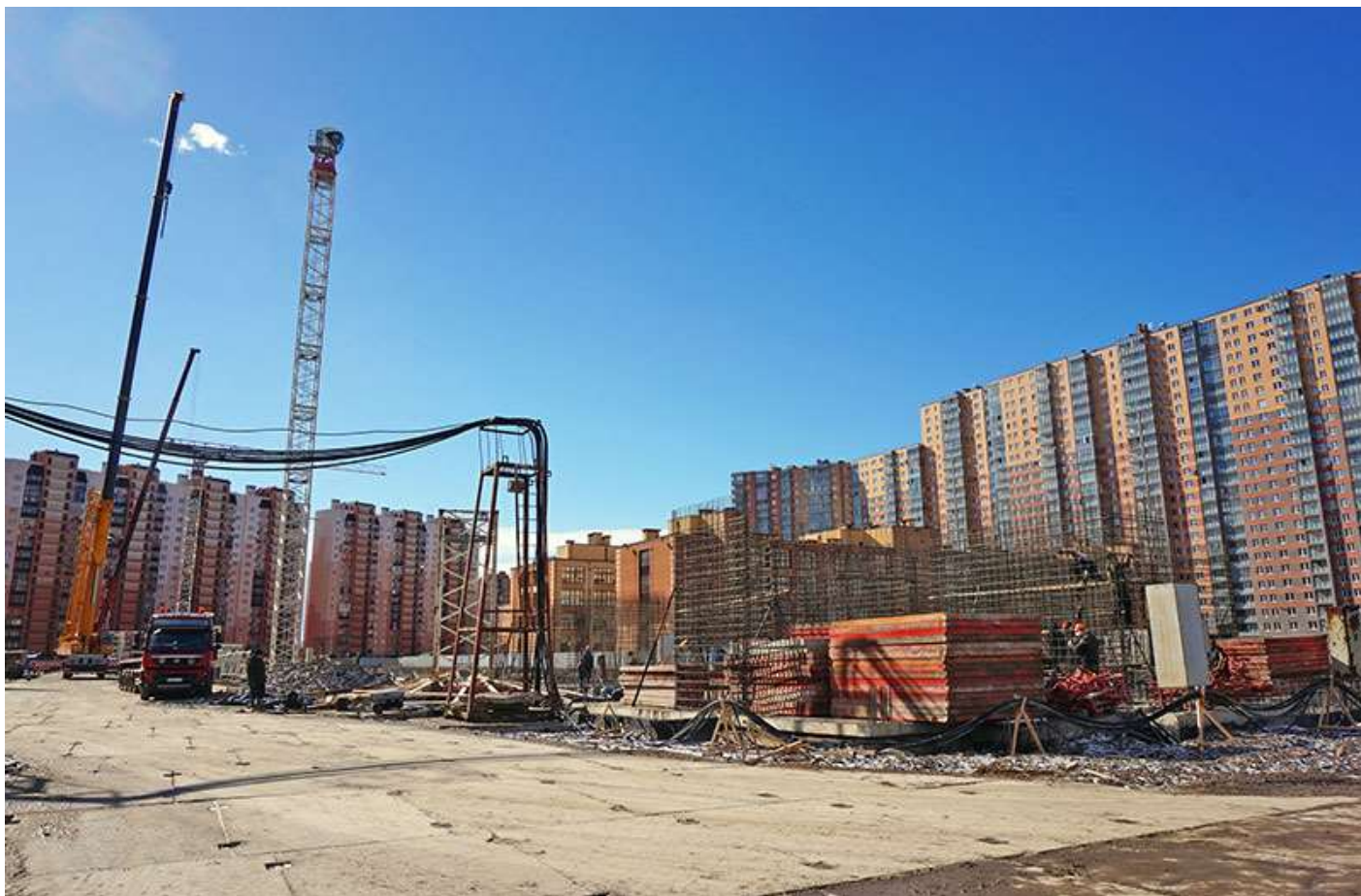
Вид на секции 6-9 со стороны Областной ул.