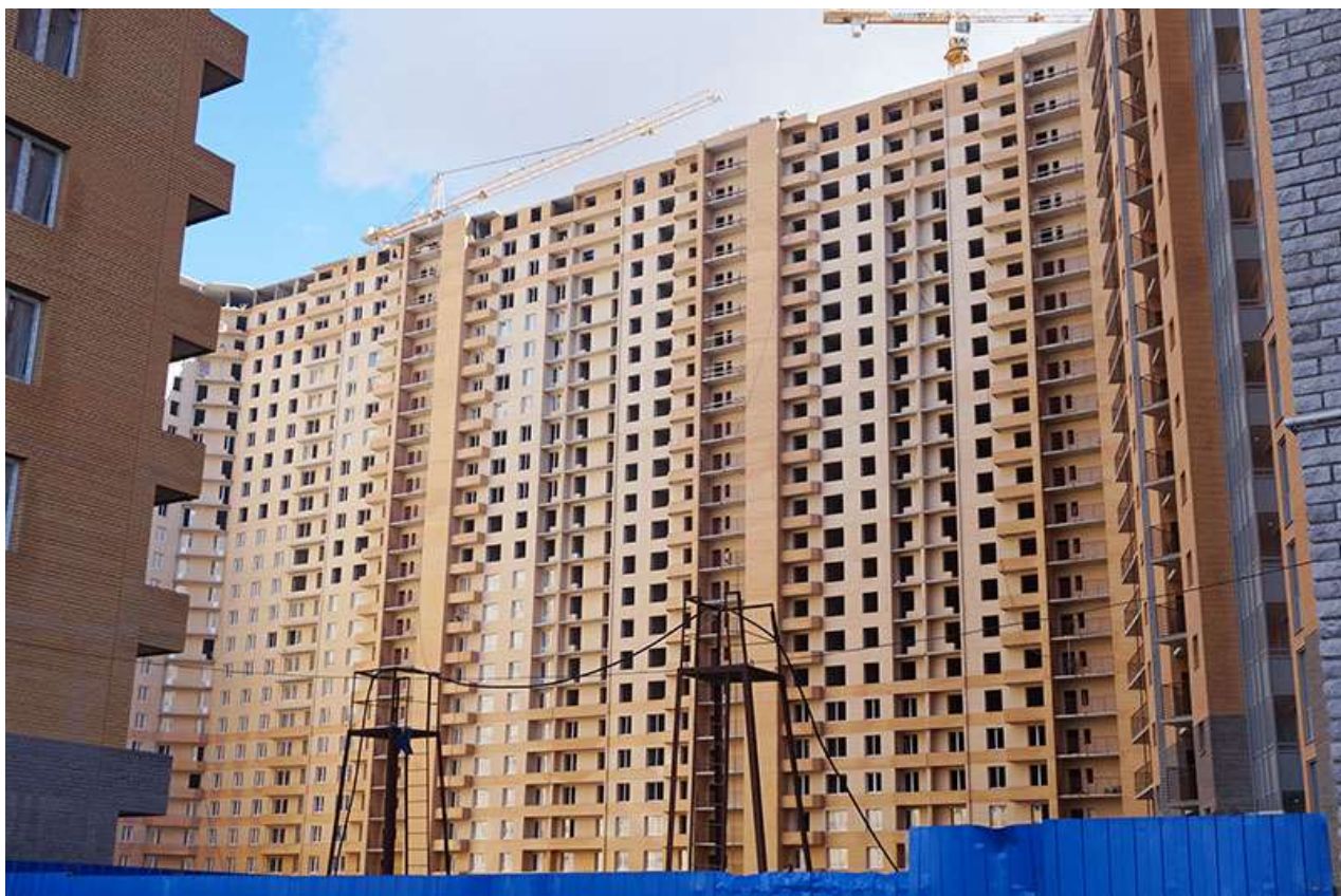
Вид на секции 7-11 с Областной ул.