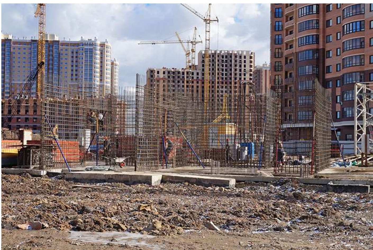
Вид на секции 8-7 со стороны Березовой ул.