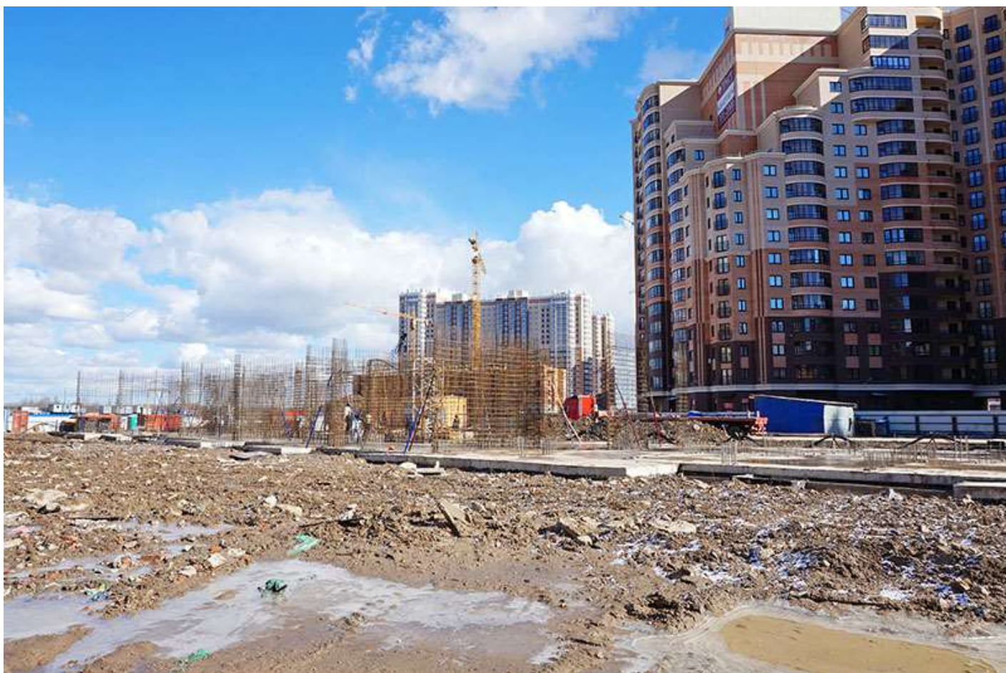
Вид на секции 9-6 со стороны Березовой ул.