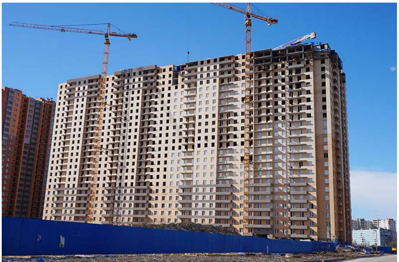
Вид на секции 11-8 со стороны Областной ул.