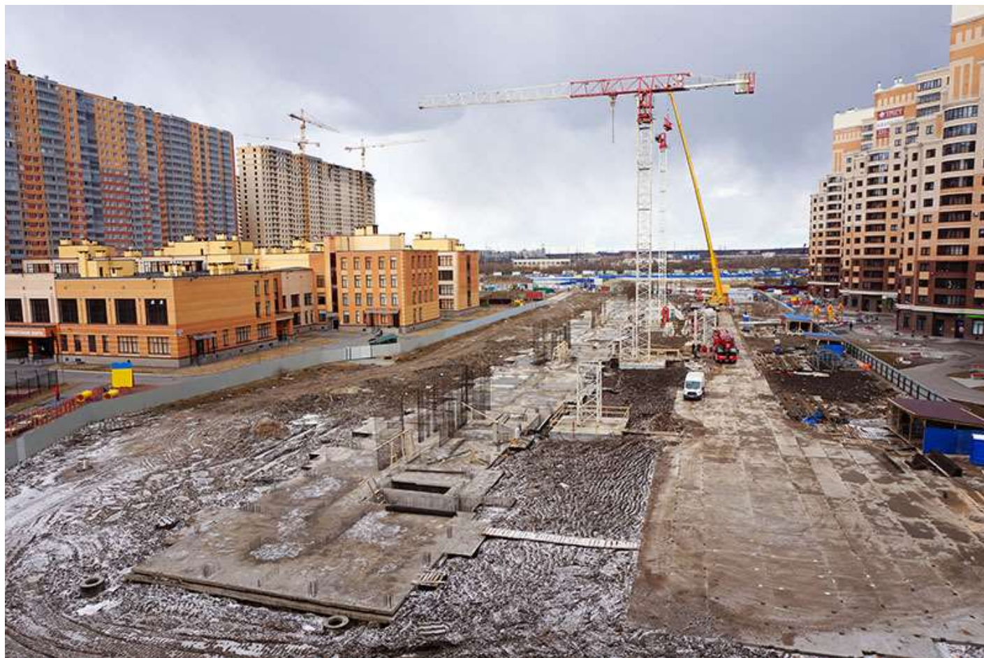
Вид со стороны Ленинградской ул.