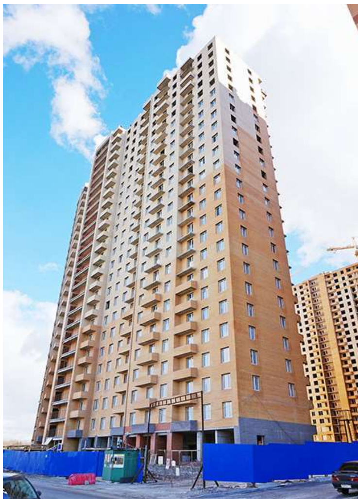
Вид на секции 2-1 и 9-10 с Областной ул.