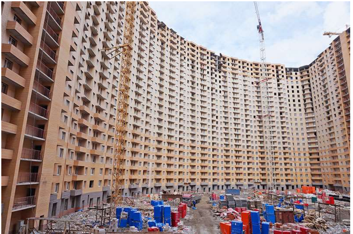
Вид на секции 1-9 со двора