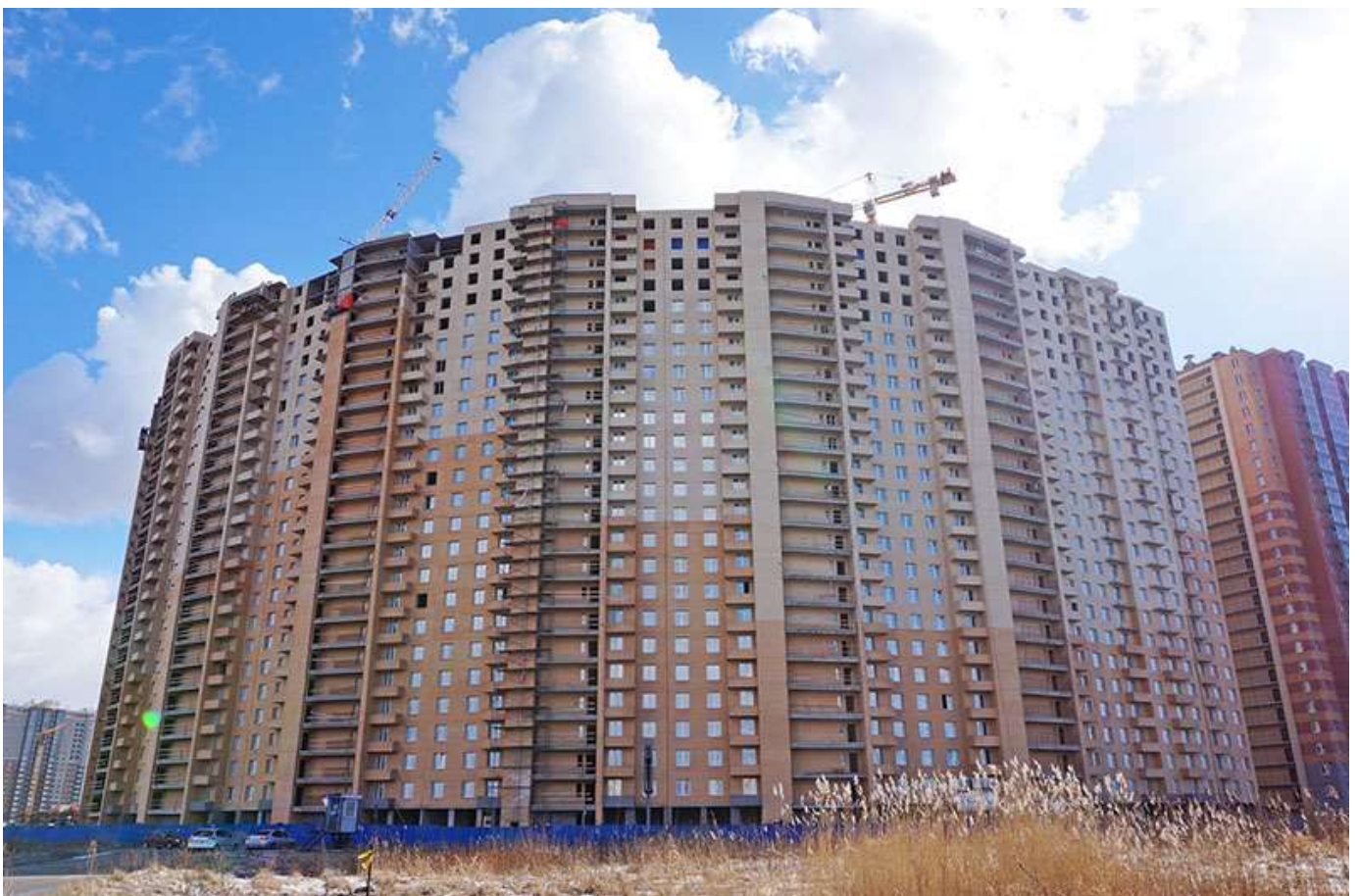
Вид на секции 7-1 с Областной ул.