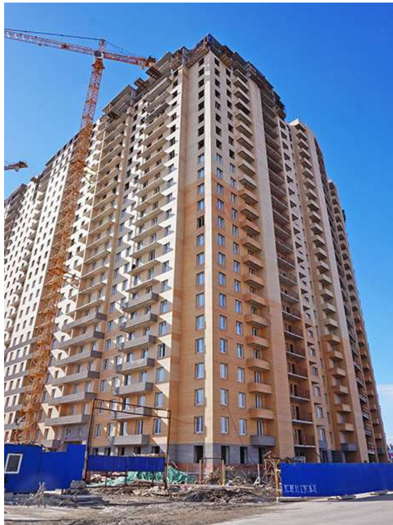
Вид на секции 9-6 с Областной ул.