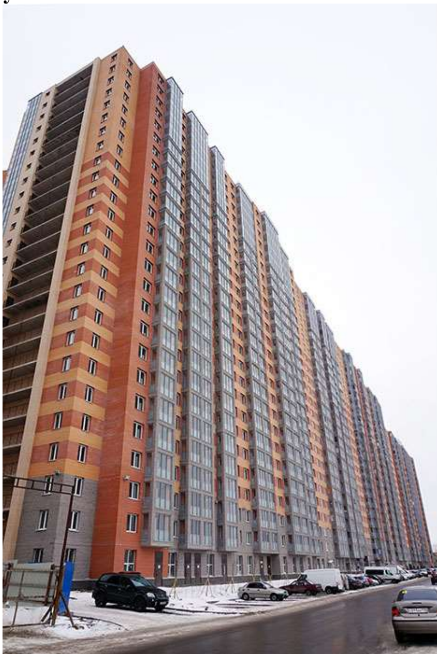
Вид со стороны Областной улицы, секции 20-15