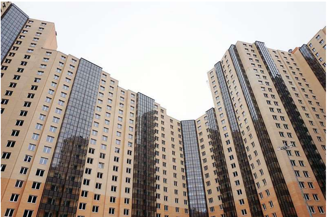
Вид со двора, секции 20-23