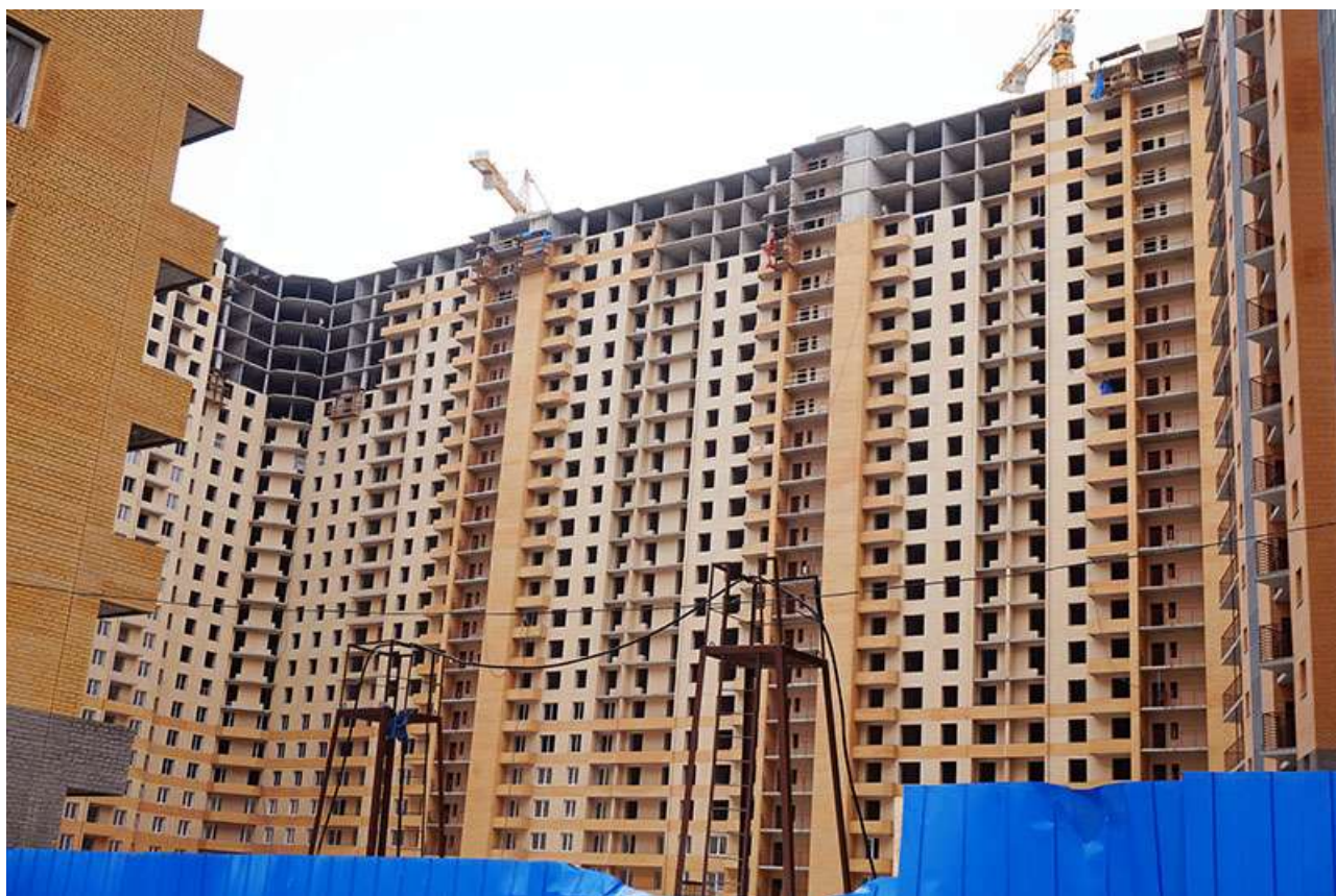
Вид на секции 7-11 с Областной ул.