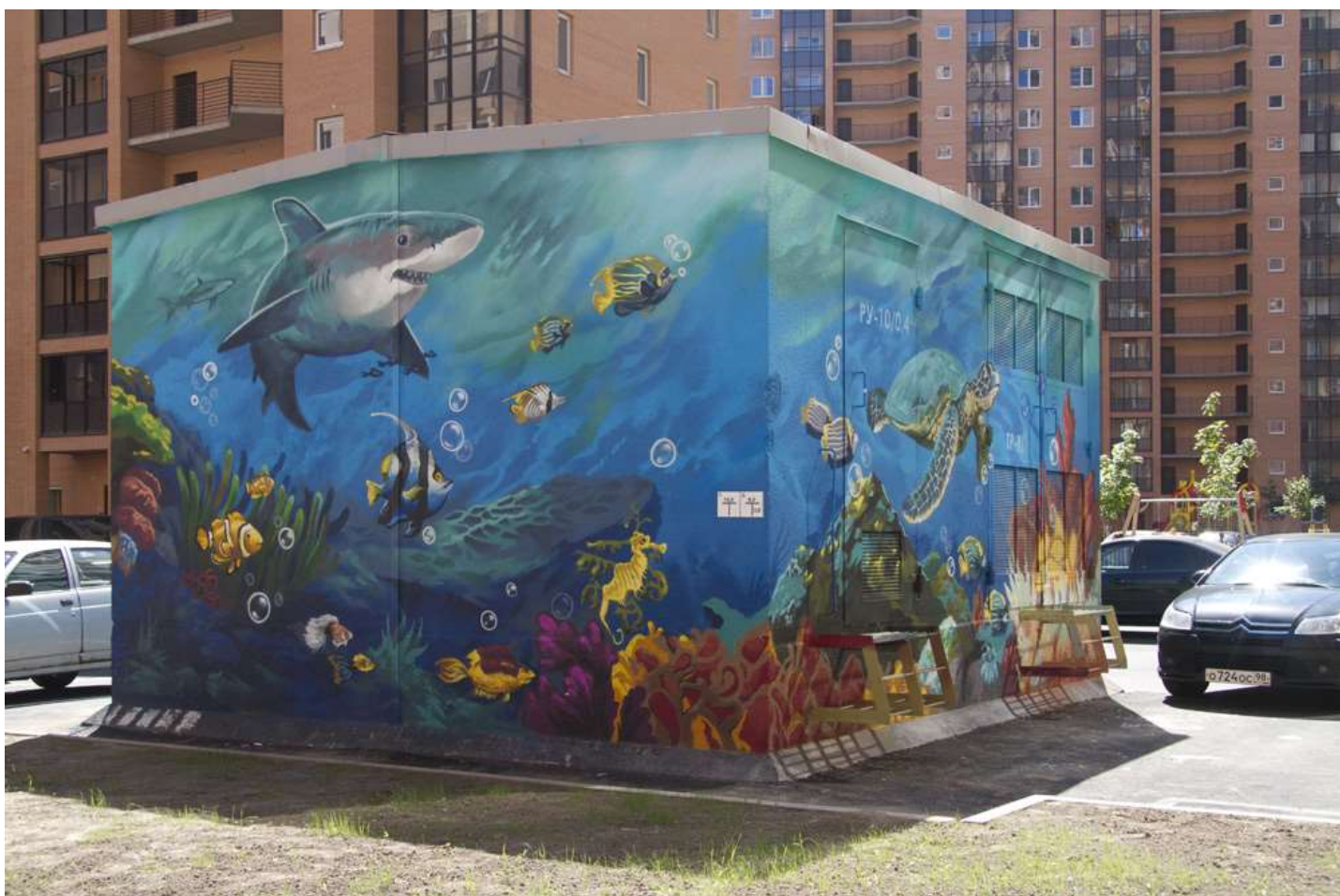
Новые арт-объекты во дворе 3-го пуска 3 очереди