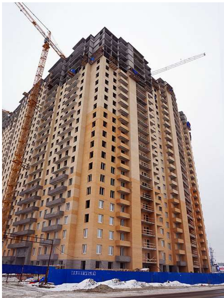
Вид на секции 9-6 с Областной ул.