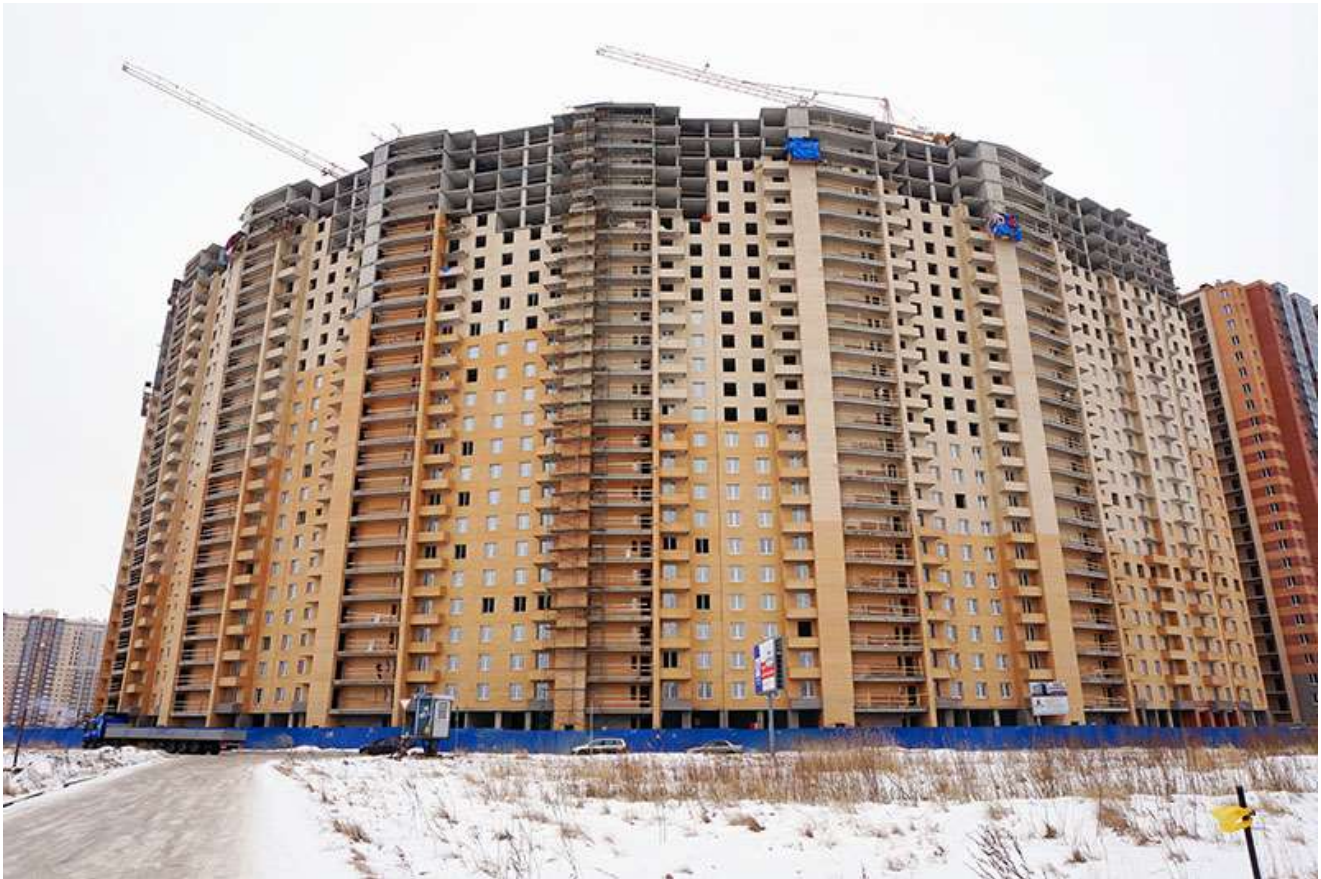
Вид на секции 7-1 с Областной ул.