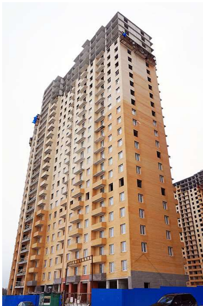
Вид на секции 2-1 и 9-10 с Областной ул.