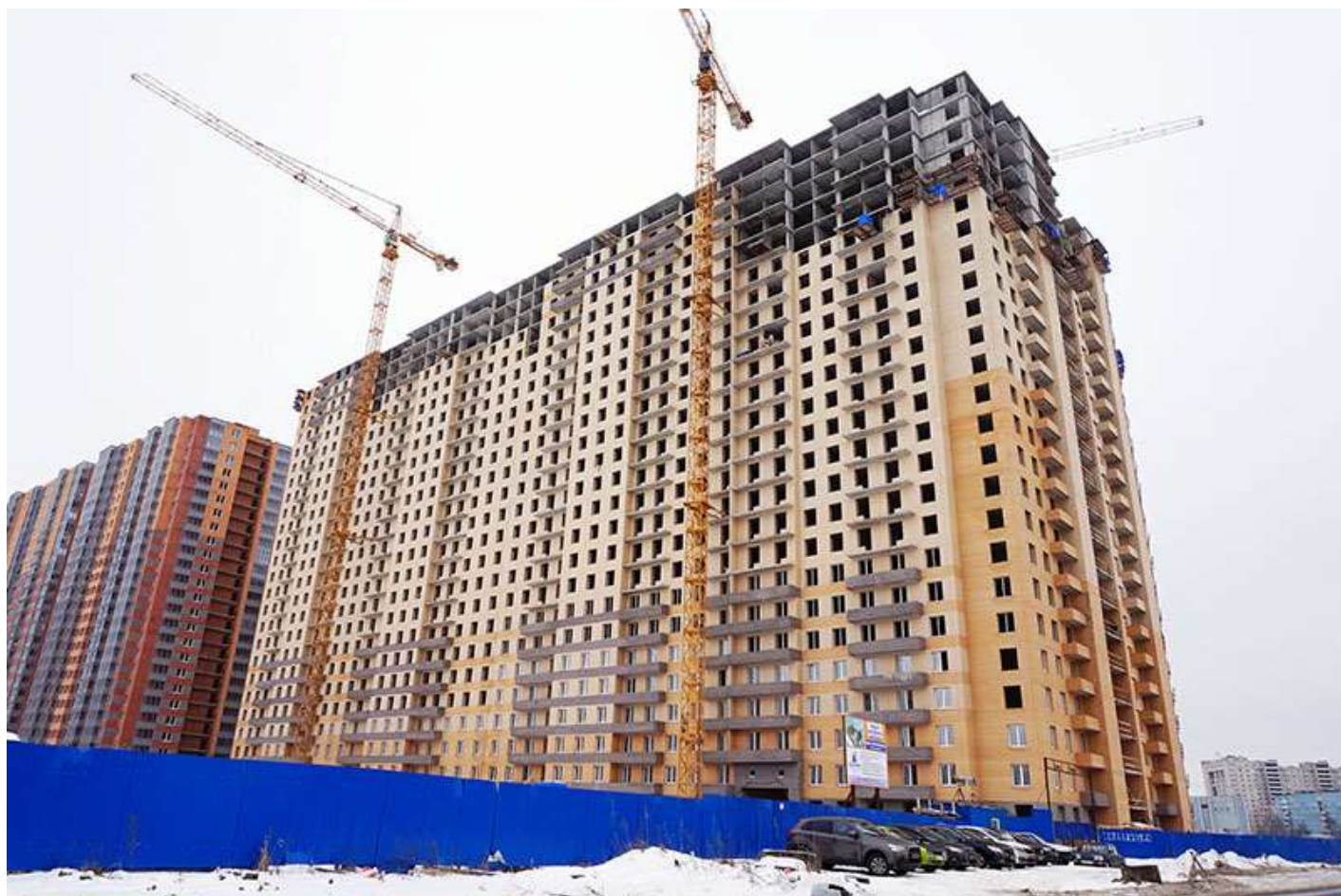
Вид на секции 11-8 со стороны Областной ул.