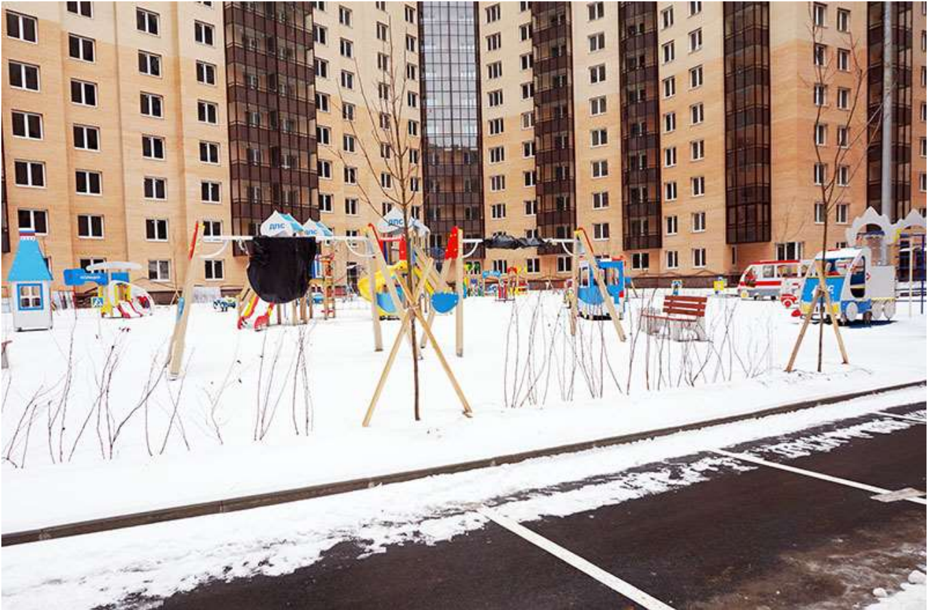
Детская площадка во дворе