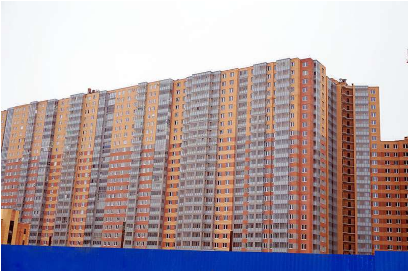
Вид с Областной улицы, секции 25-22