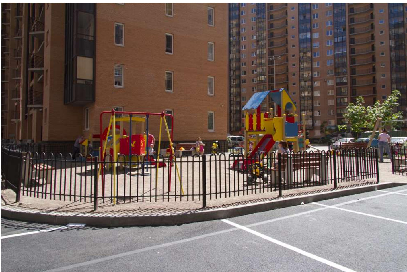
Благоустройство двора в 1-2-м пусках 3 очереди