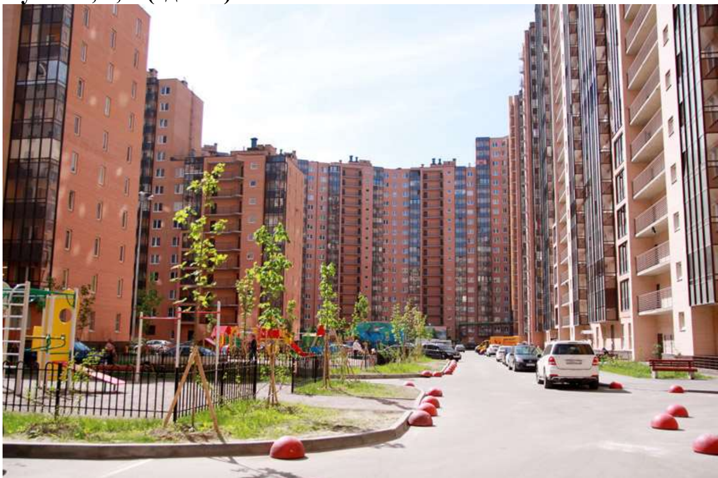
Благоустройство двора в 1-2-3-м пусках 3 очереди