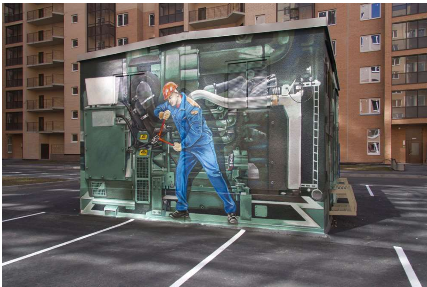
Новые арт-объекты во дворе 3-го пуска 3 очереди