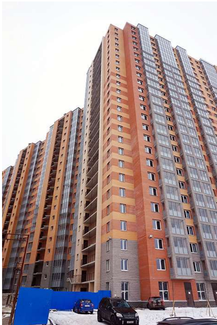
Вид со стороны Областной улицы, секции 22-19