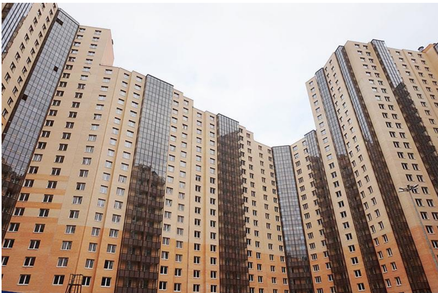
Вид со двора, секции 19-23