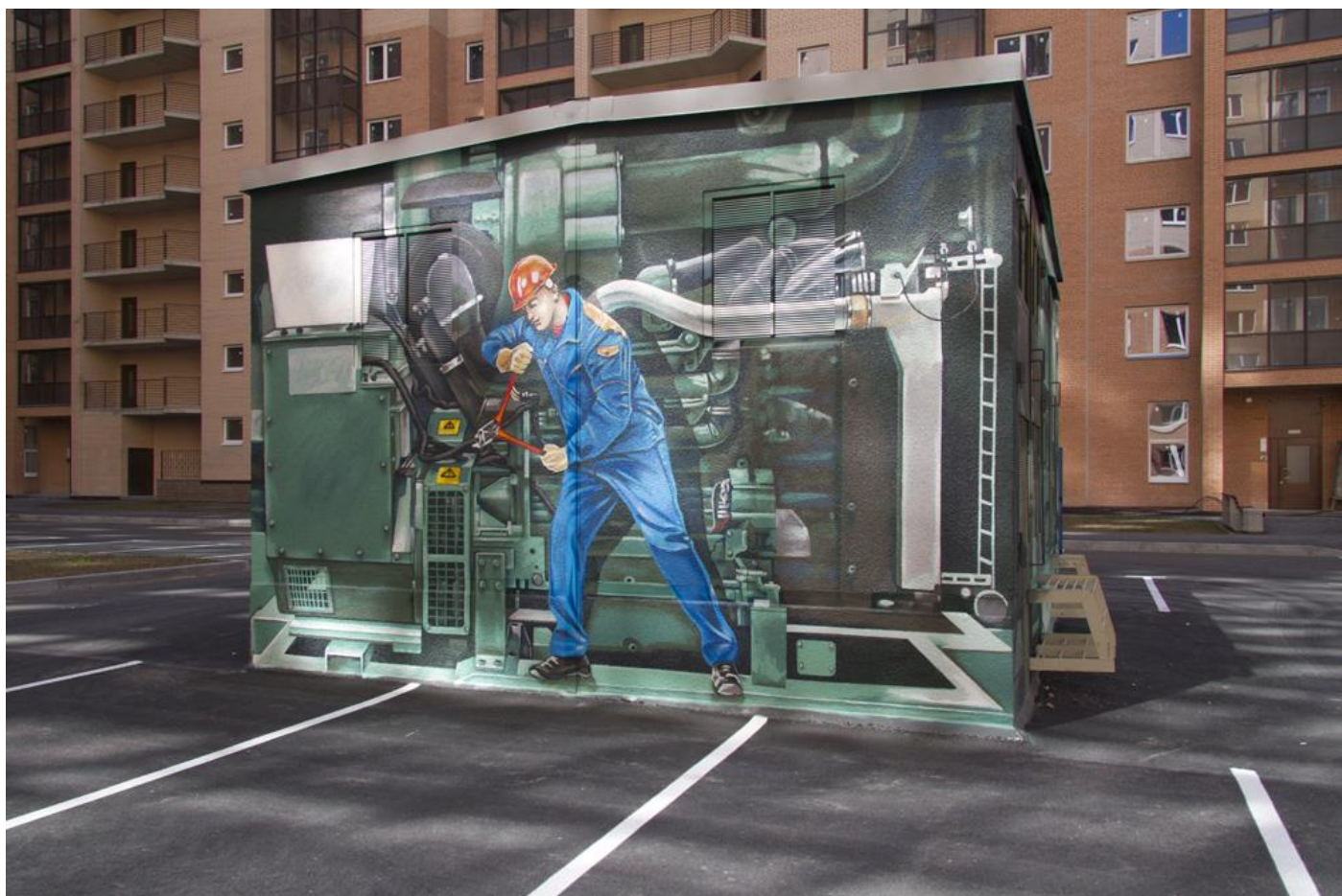
Новые арт-объекты во дворе 3-го пуска 3 очереди