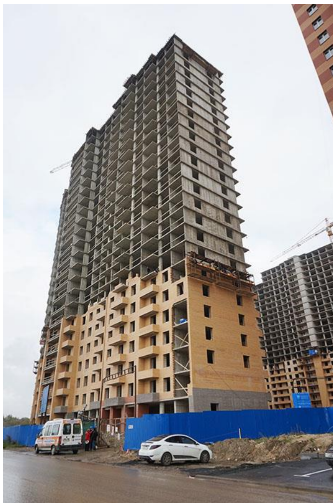
Вид на секции 2-1 и 9-10 с ул. Областная