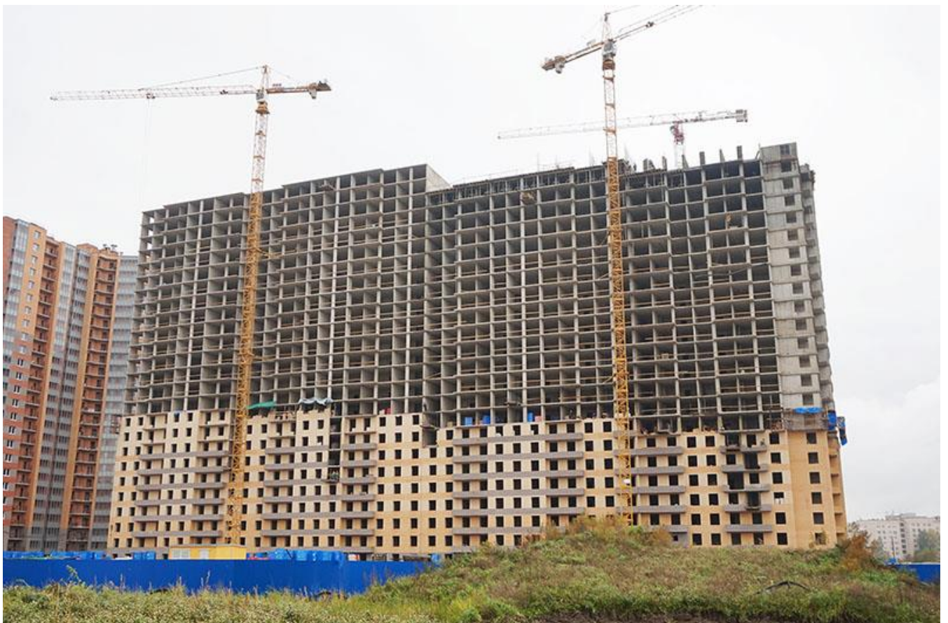
Вид на секции 11-8 со стороны Областной ул.