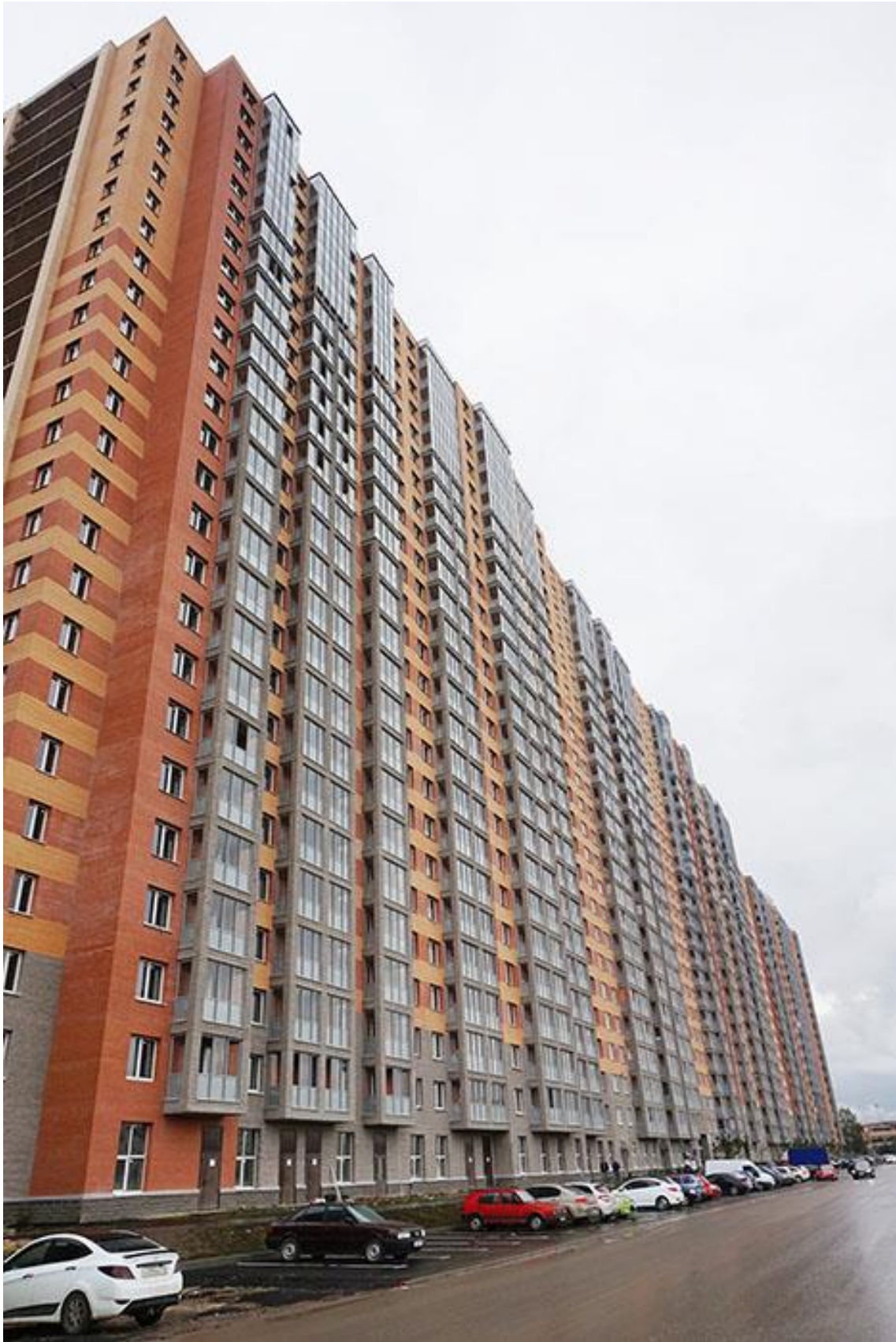
Вид со стороны Областной улицы, секции 19-12