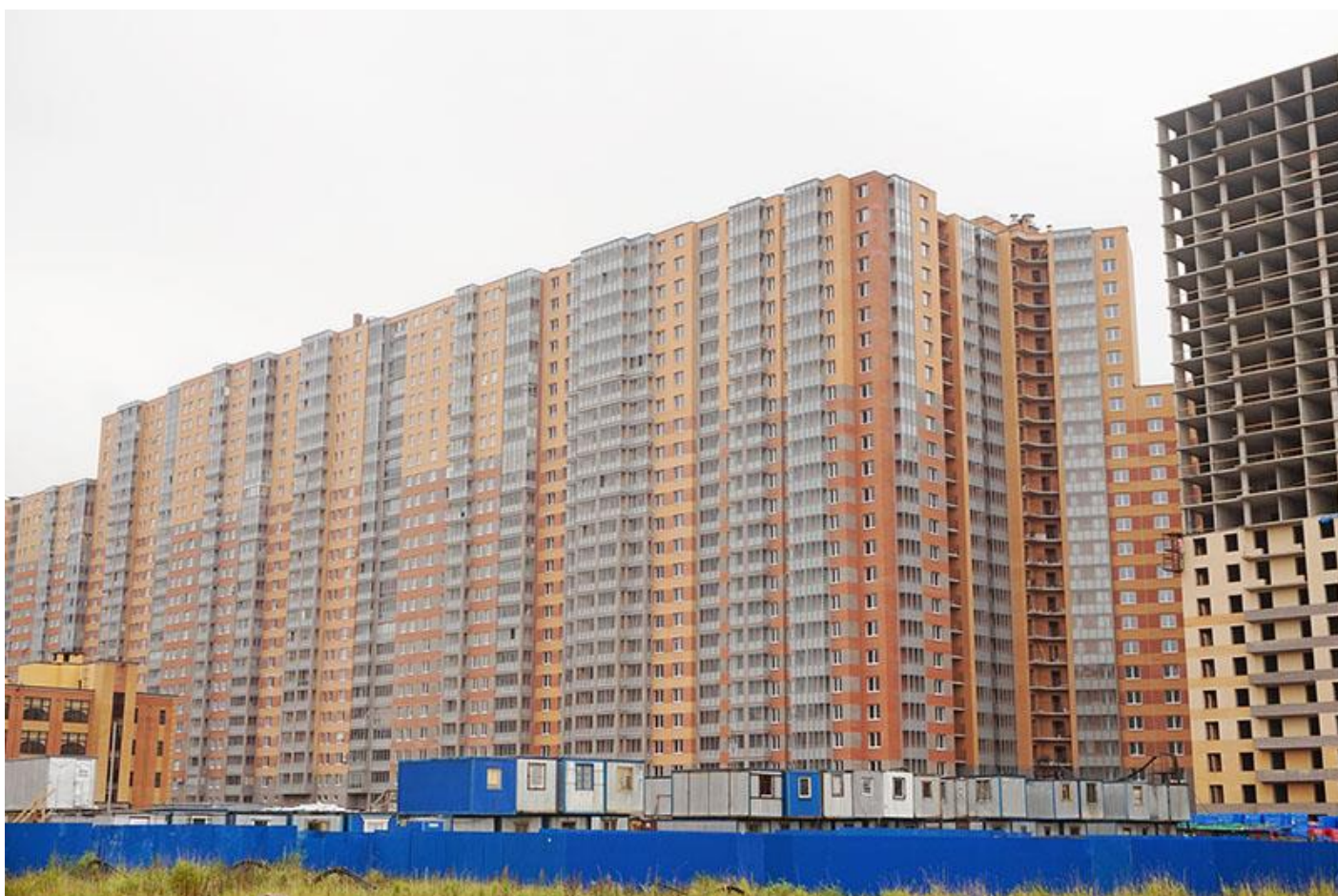
Вид с Областной улицы, секции 25-22