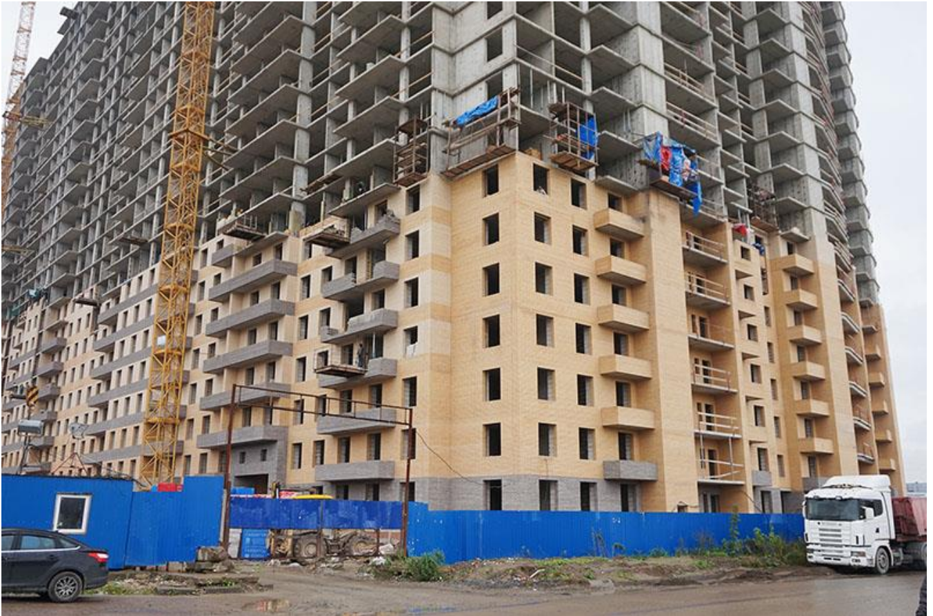
Вид на секции 10-7 со стороны Областной ул.