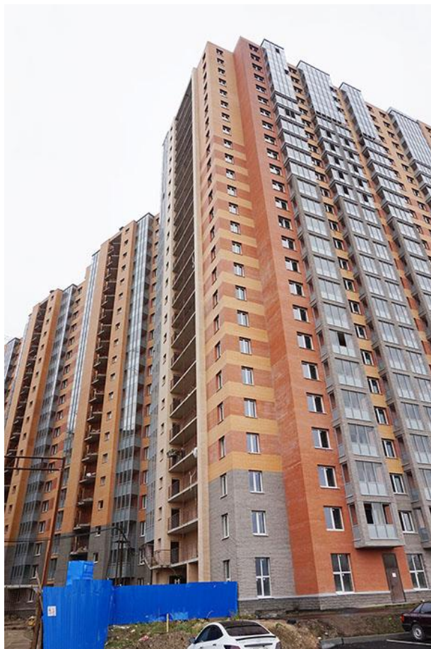
Вид со стороны Областной улицы, секции 21-19