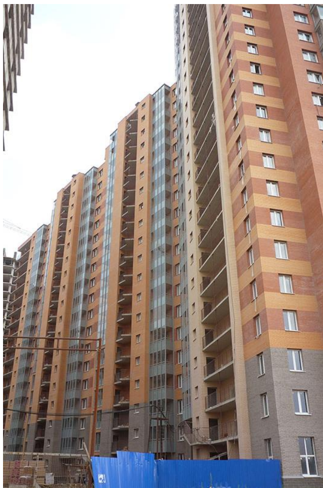
Вид со стороны Областной улицы, секции 22-19