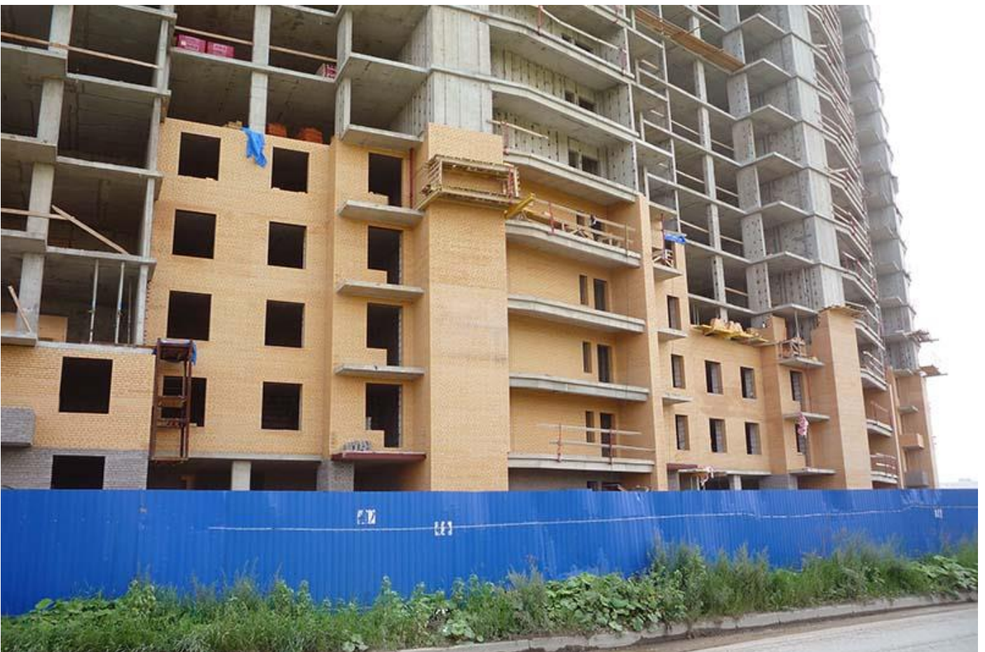
Вид на секции 6-7 со стороны Областной ул.