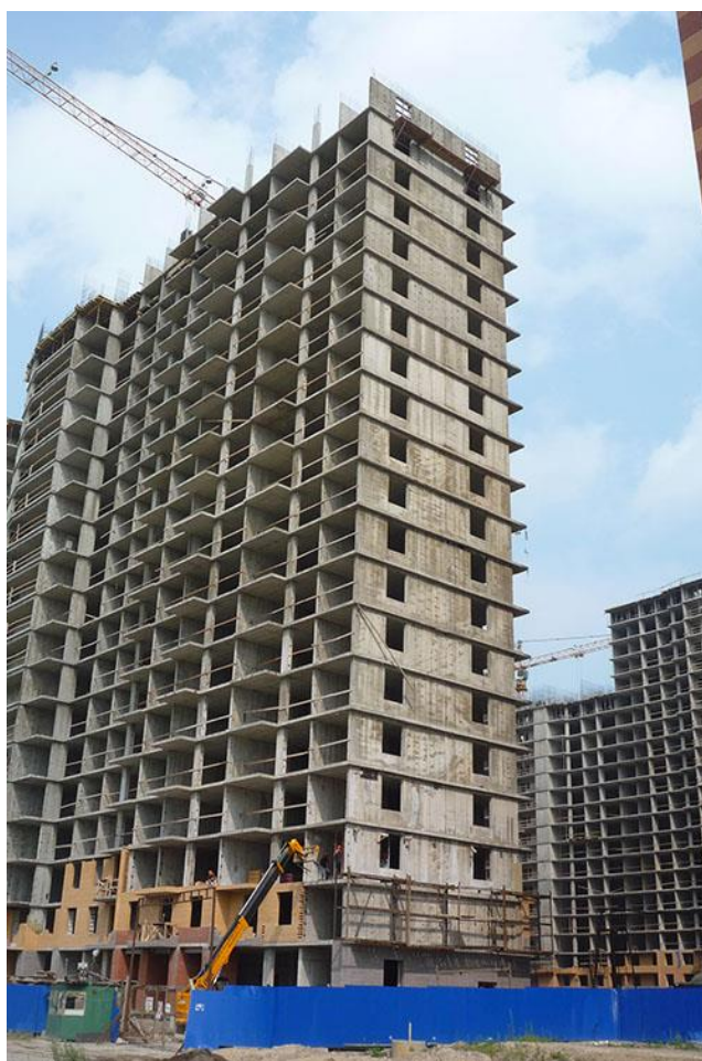
Вид на секции 1-2 и 9-10 с ул. Областная