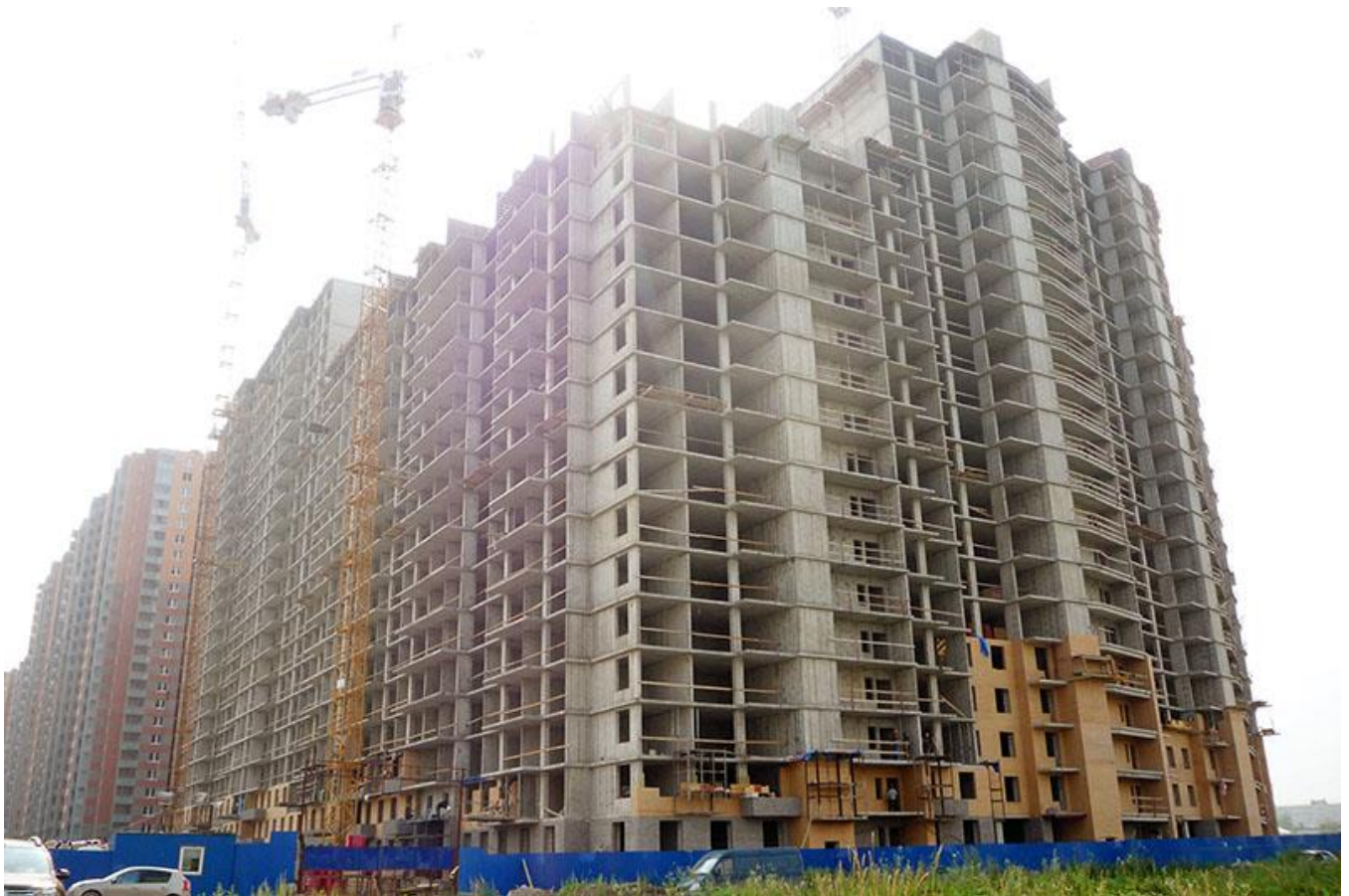
Вид на секции 6-11 со стороны Областной ул.