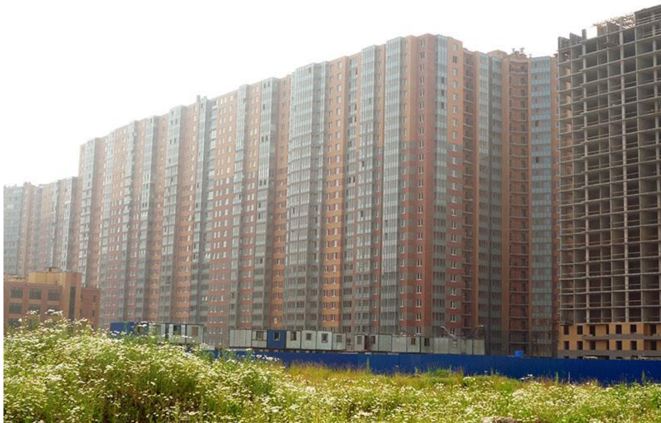
Вид с Областной улицы, секции 22-25