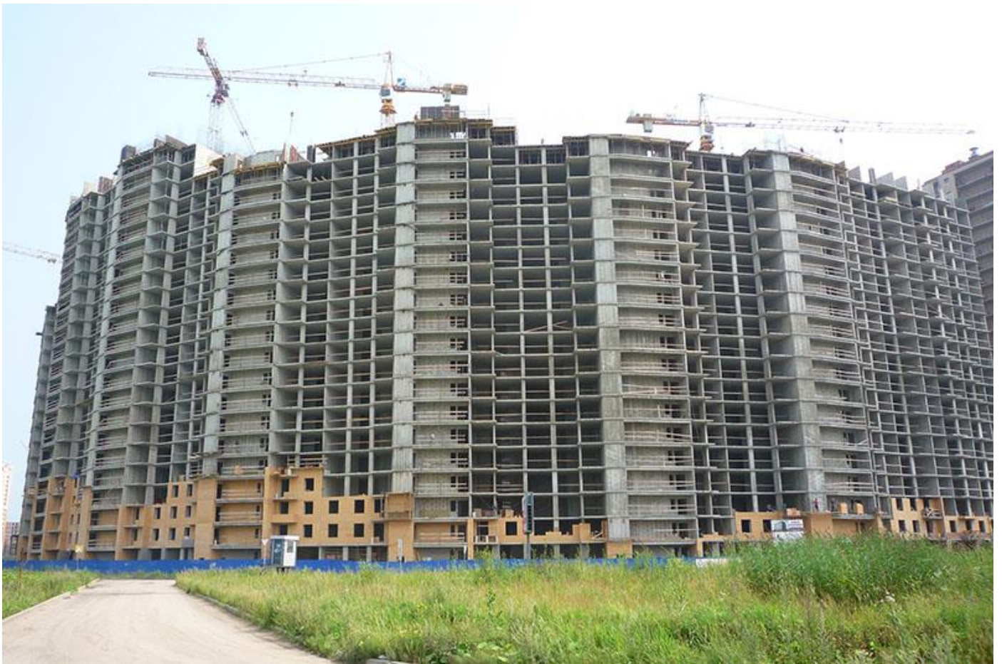
Вид на секции 1-6 с Областной ул.