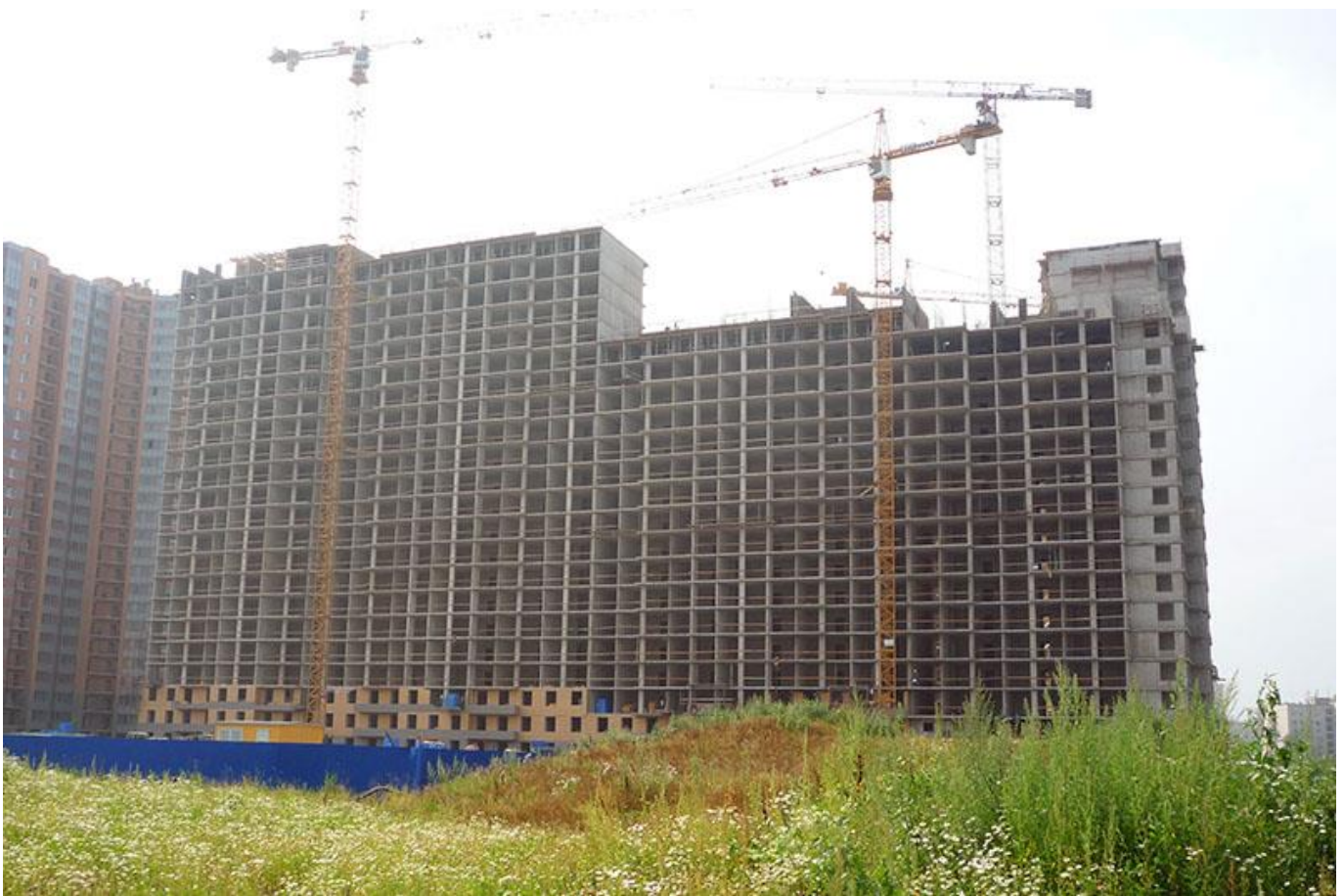
Вид на секции 8-11 со стороны Областной ул.