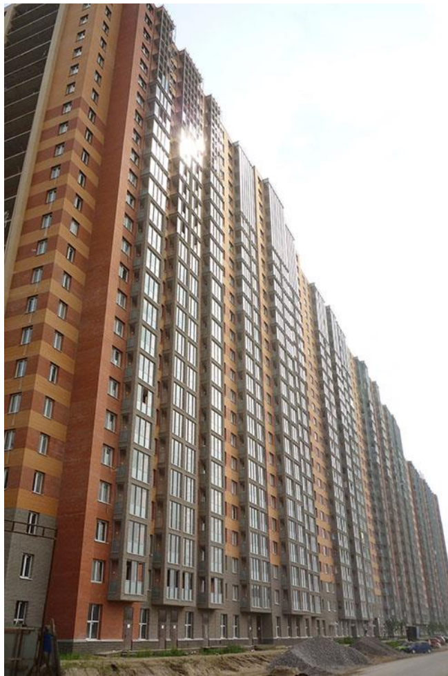
Вид со стороны Областной улицы, секции 19-15