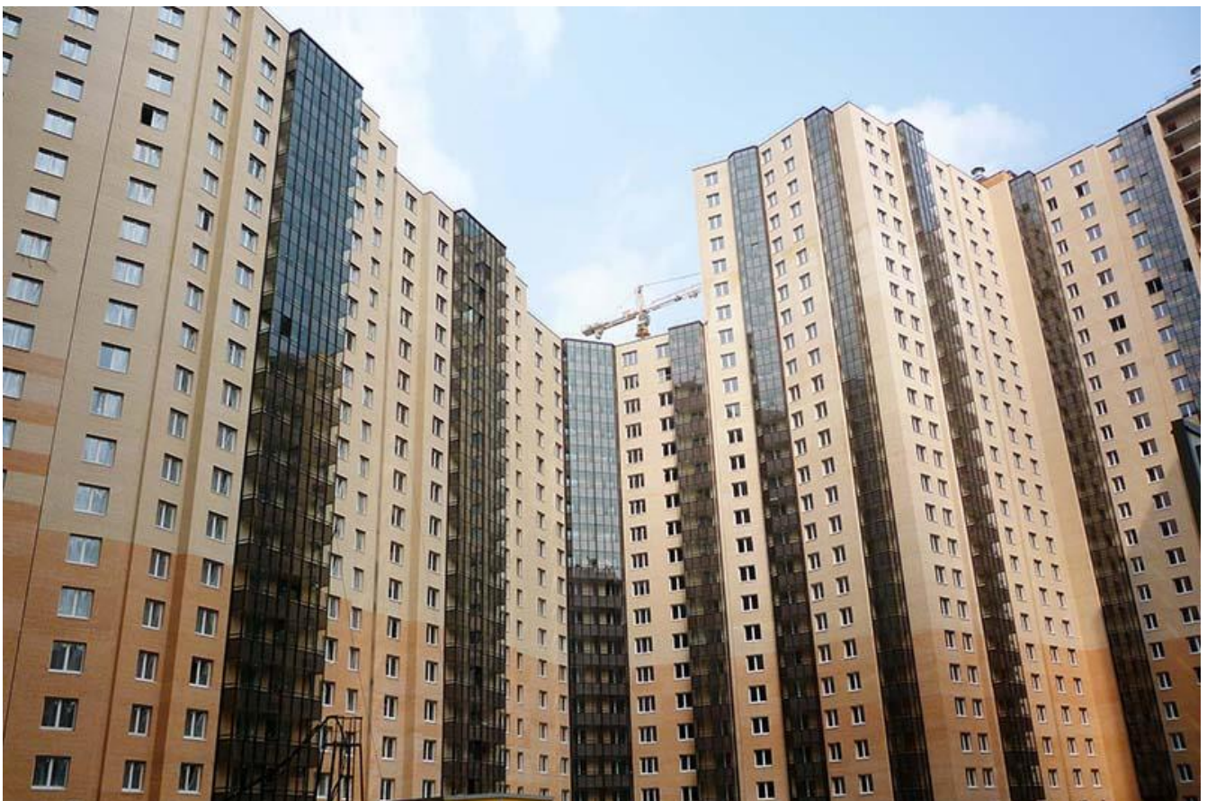
Вид со двора, секции 20-24