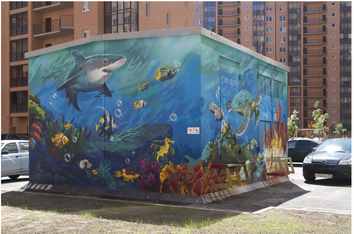
Новые арт-объекты во дворе 3-го пуска 3 очереди