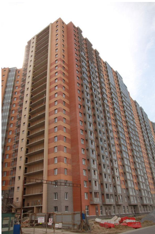
Вид со стороны Областной улицы, секции 19-17