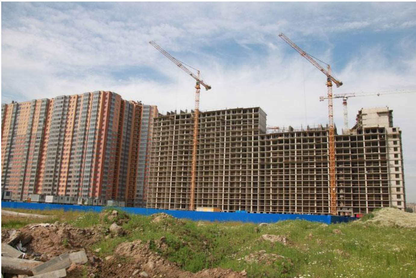
Вид с Областной улицы, секции 22-25