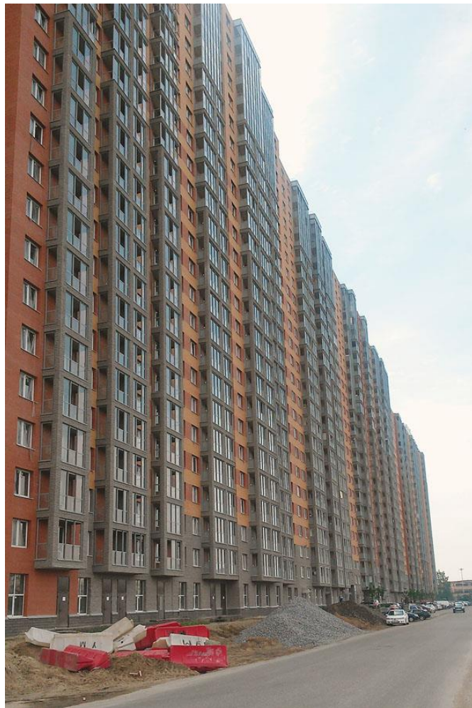
Вид со стороны Областной улицы, секции 18-15