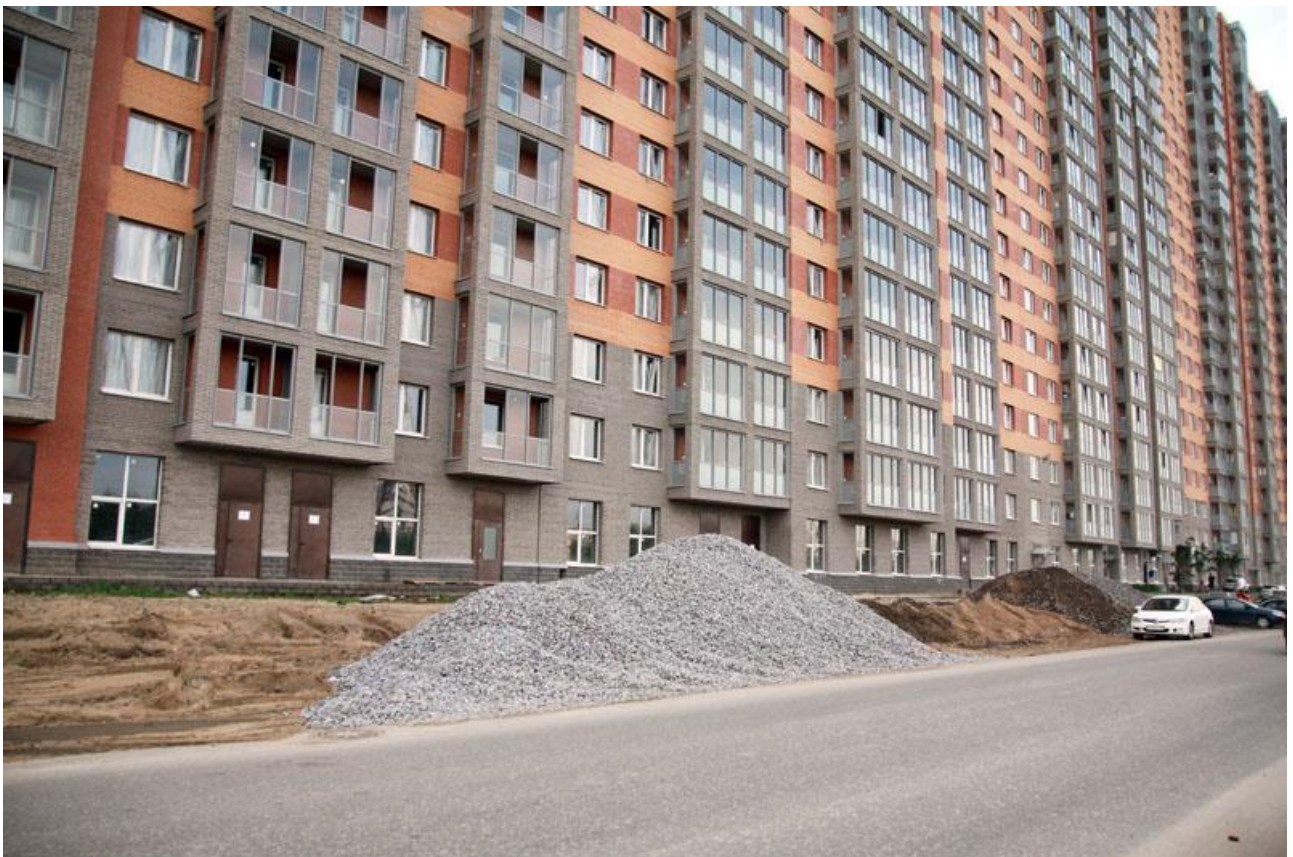
Вид со стороны Областной ул., секции 18-16, начаты работы по благоустройству