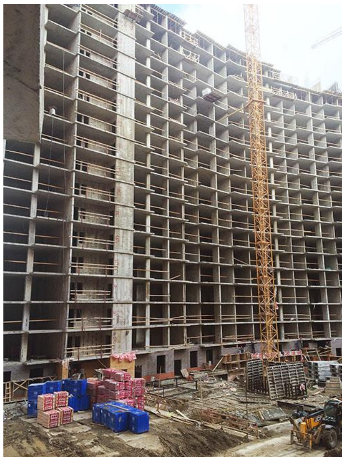
Вид на секции 1-2 со стороны двора