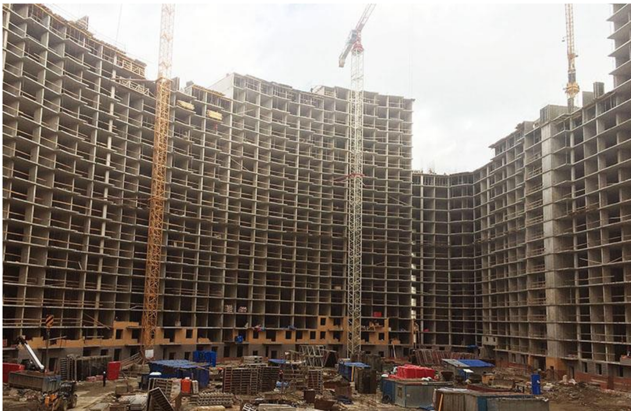
Вид на секции 5-9 со стороны двора