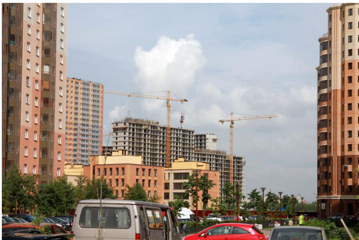
Вид на секции 8-11 со стороны Ленинградской ул.