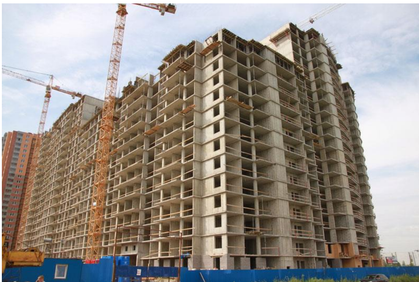
Вид на секции 7-11 со стороны Областной ул.