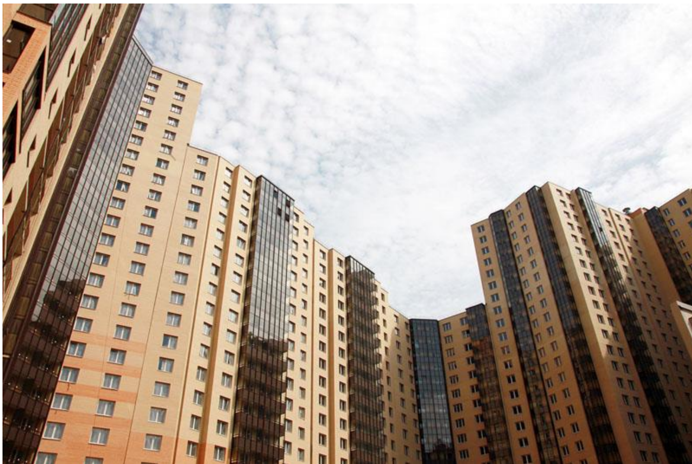
Вид со двора, секции 29-23