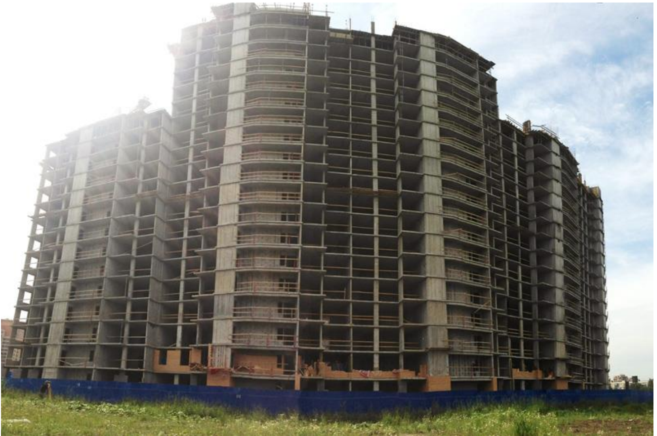
Вид на секции 4-8 с Областной ул.