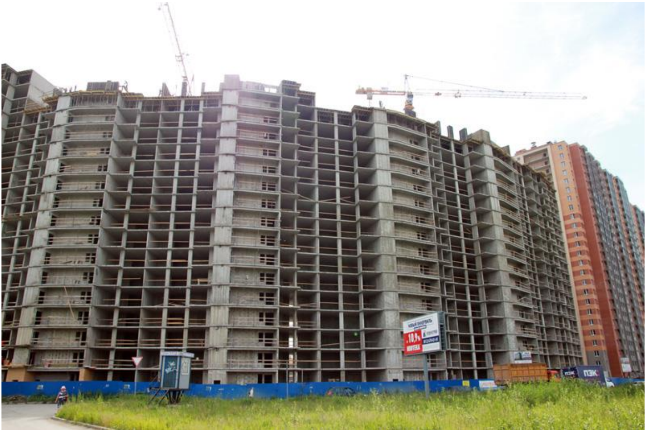
Вид на секции 1-5 с ул. Областная