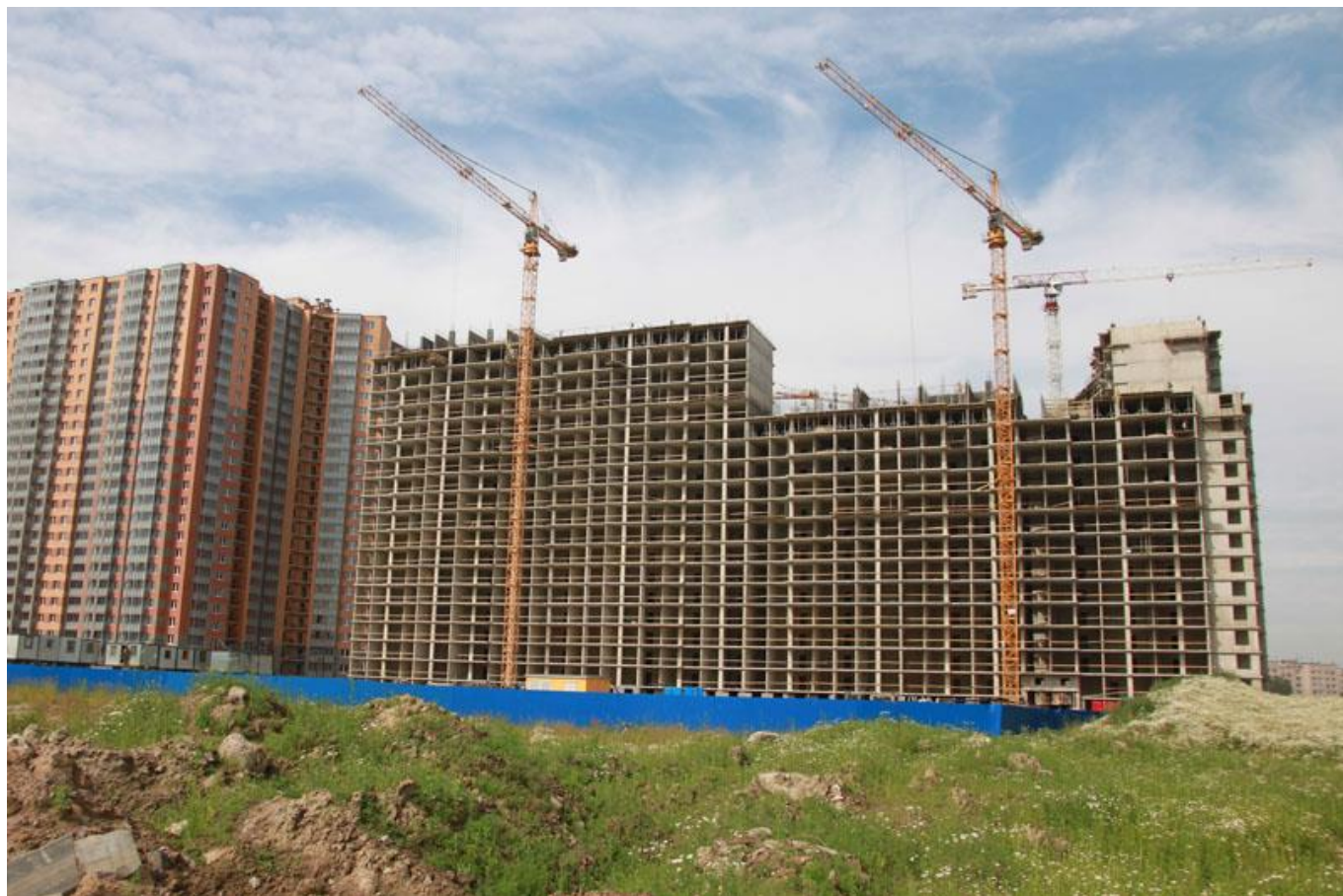
Вид на секции 8-11 со стороны Областной ул.