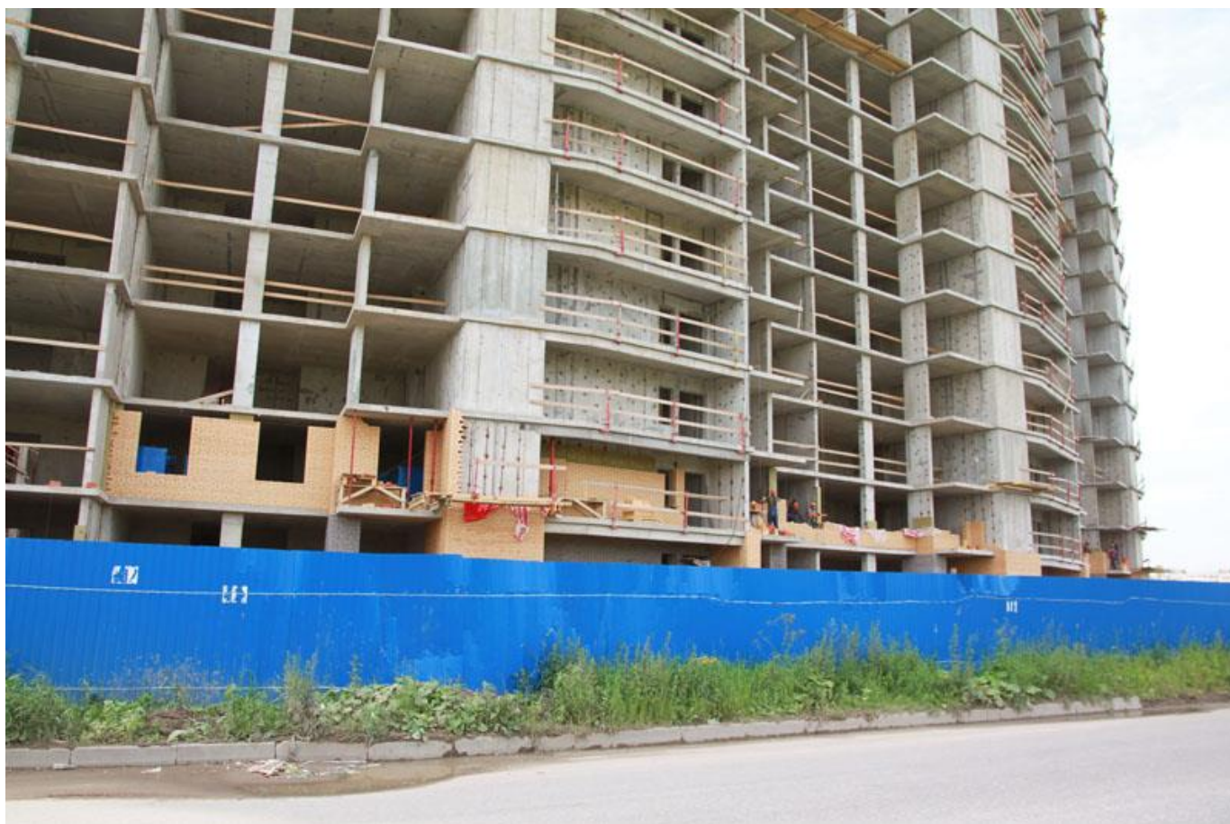
Вид на секции 6-7 со стороны Областной ул.