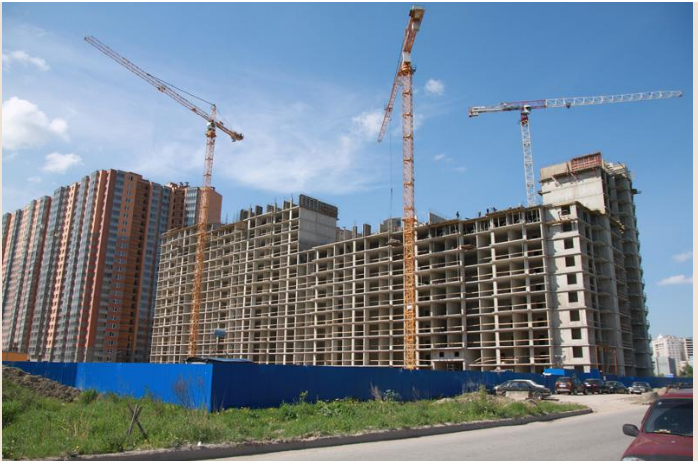
Вид с Областной улицы, секции 22-25