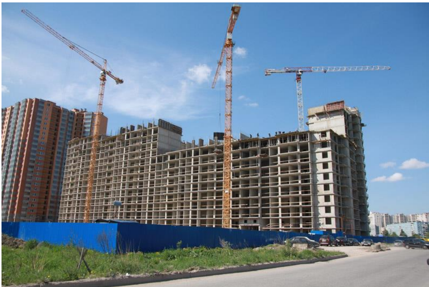
Вид на секции 11-7 со стороны Областной ул.