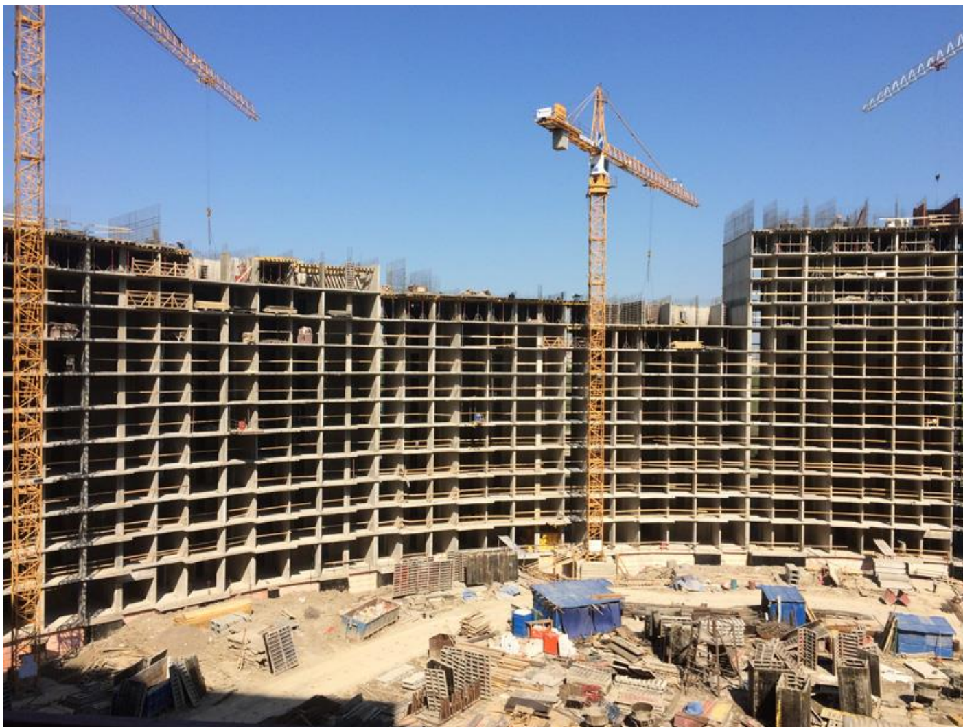
ФОТО ОТ 10.05.2016 (СО СТОРОНЫ ДВОРА)