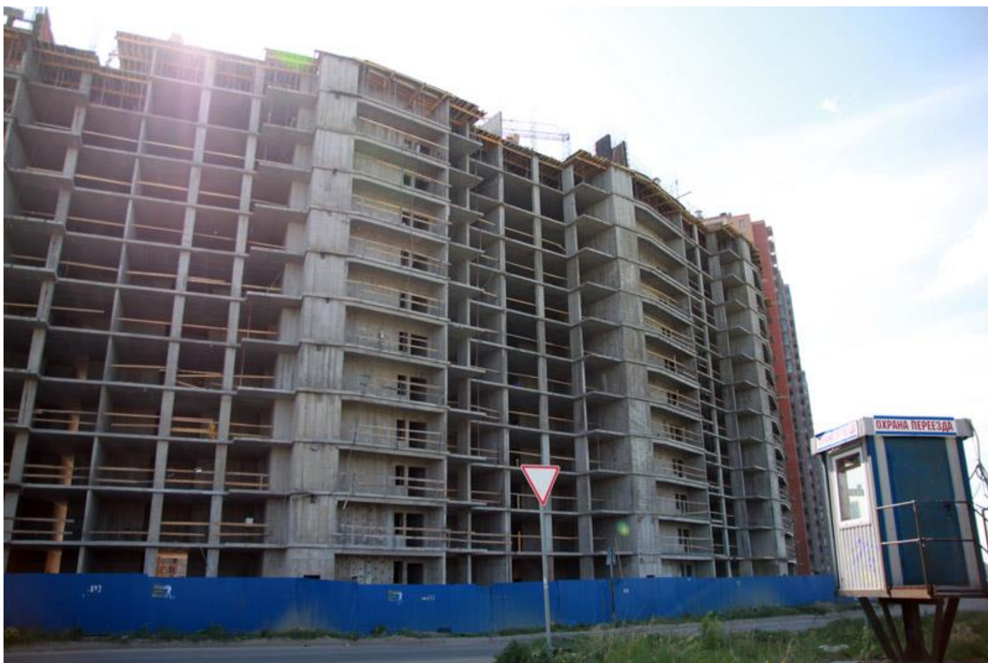
Вид на секции 4-1 с Областной ул.