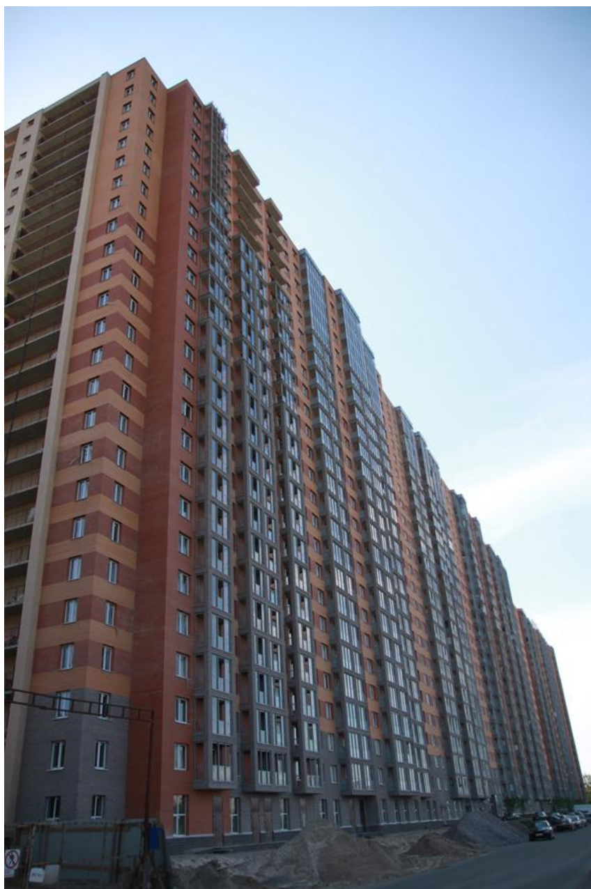
Вид со стороны Областной улицы, секции 17-15