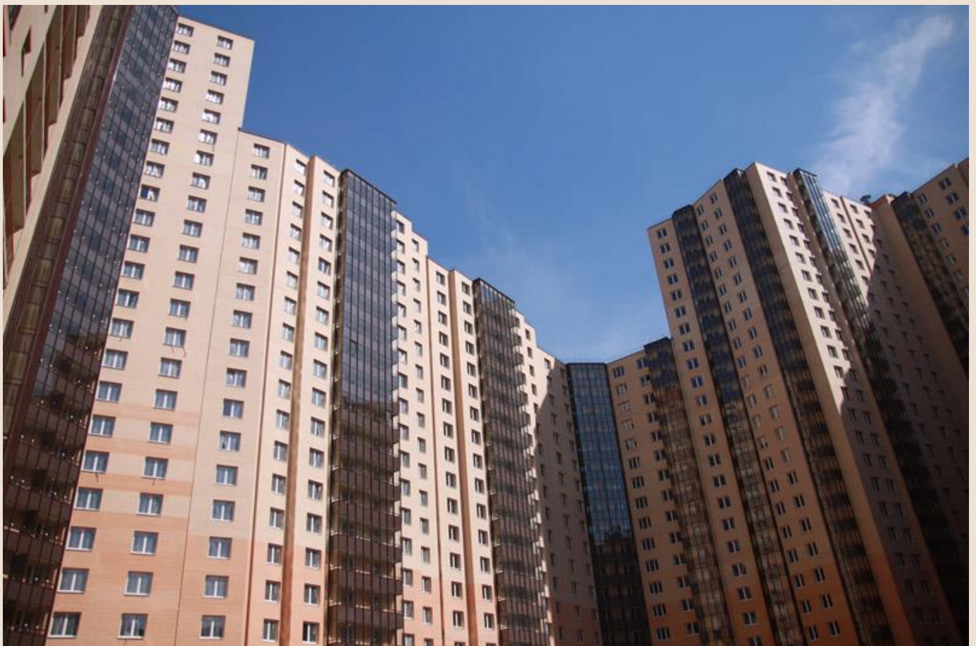
Вид со двора, секции 19-23