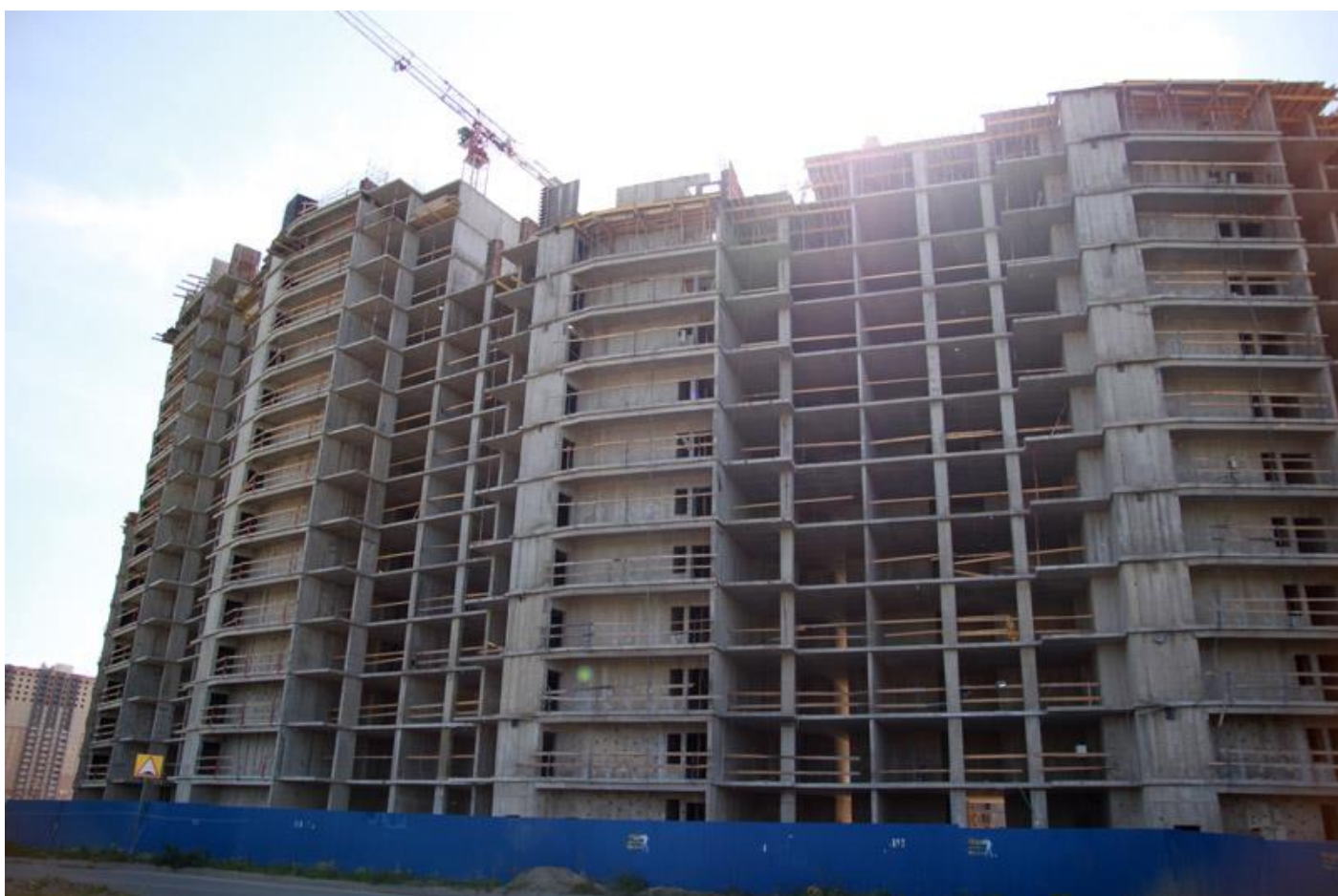
Вид на секции 7-5 со стороны Областной ул.