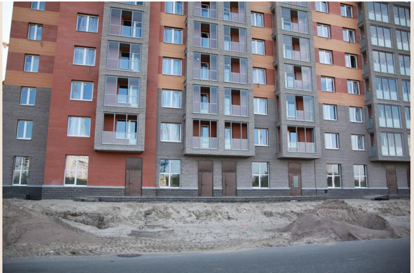
Вид со стороны Областной ул., секции 17-15, начаты работы по благоустройству