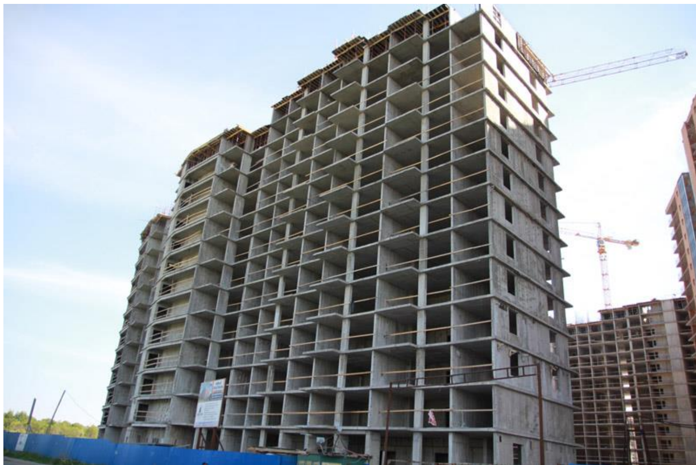
Вид на секции 1-2 с ул. Областная