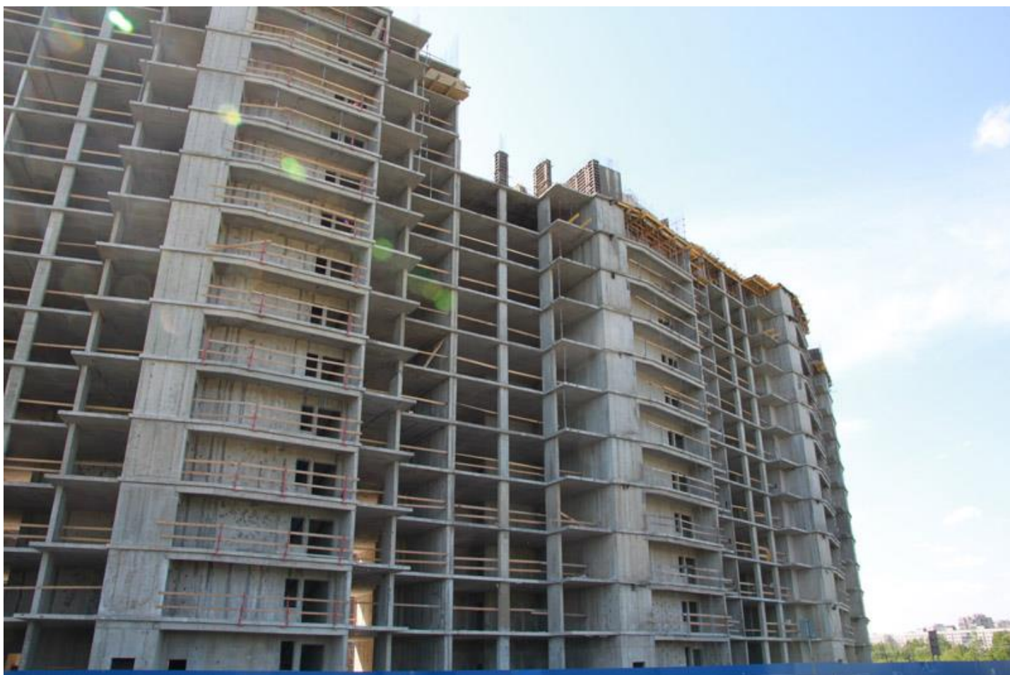
Вид на секции 7-6 со стороны Областной ул.