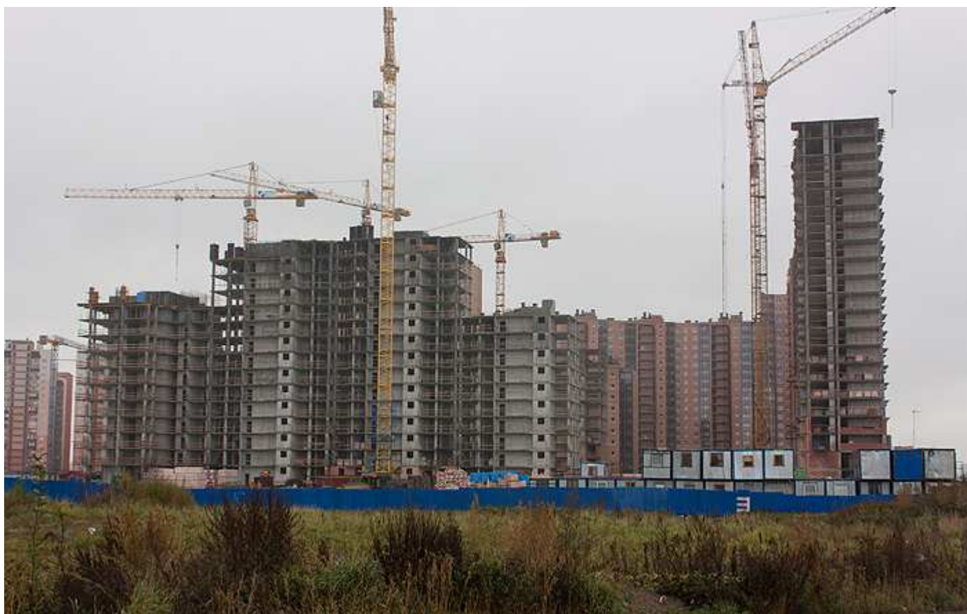
Вид со стороны Областной улицы 29-26, 17