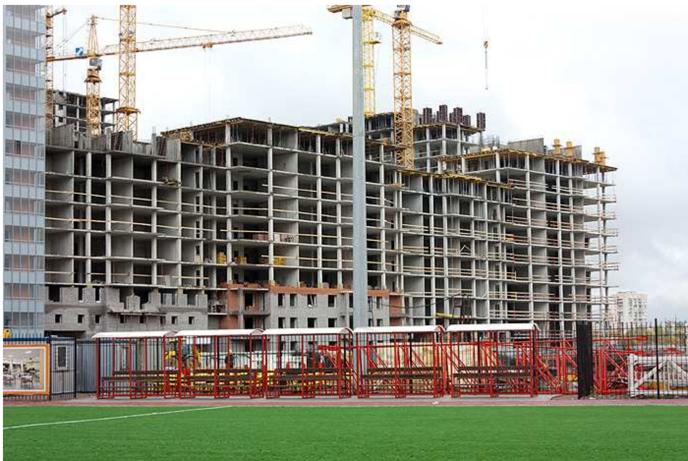
Вид со стороны спортивной площадки школы на секции 35-29