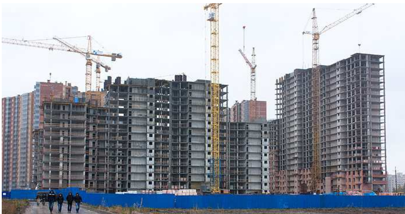
Вид с Областной улицы на секции 29-26, 15-17 со двора