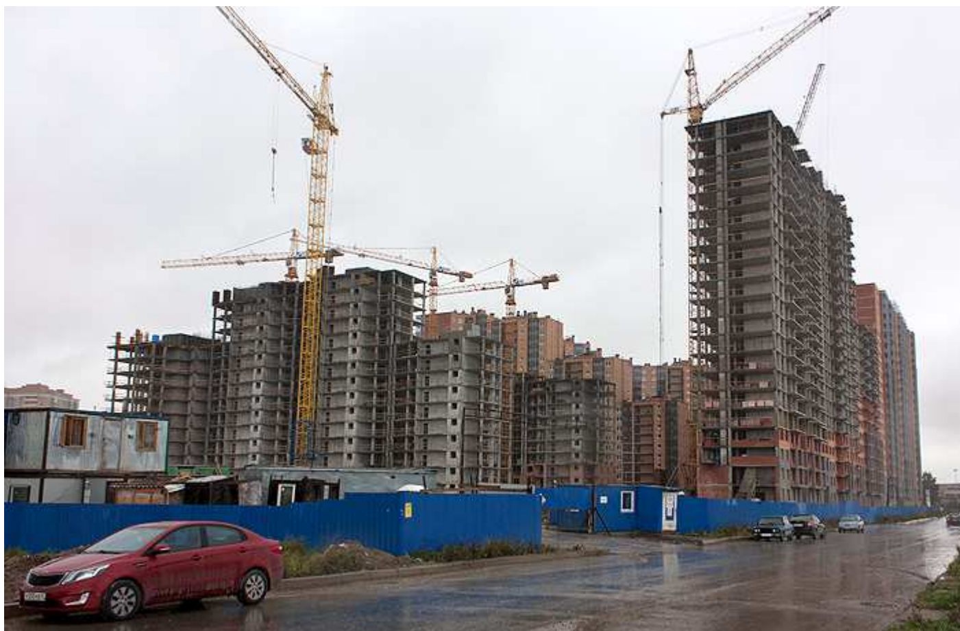
Вид с Областной улицы на секции 29-26, 31, 17-15