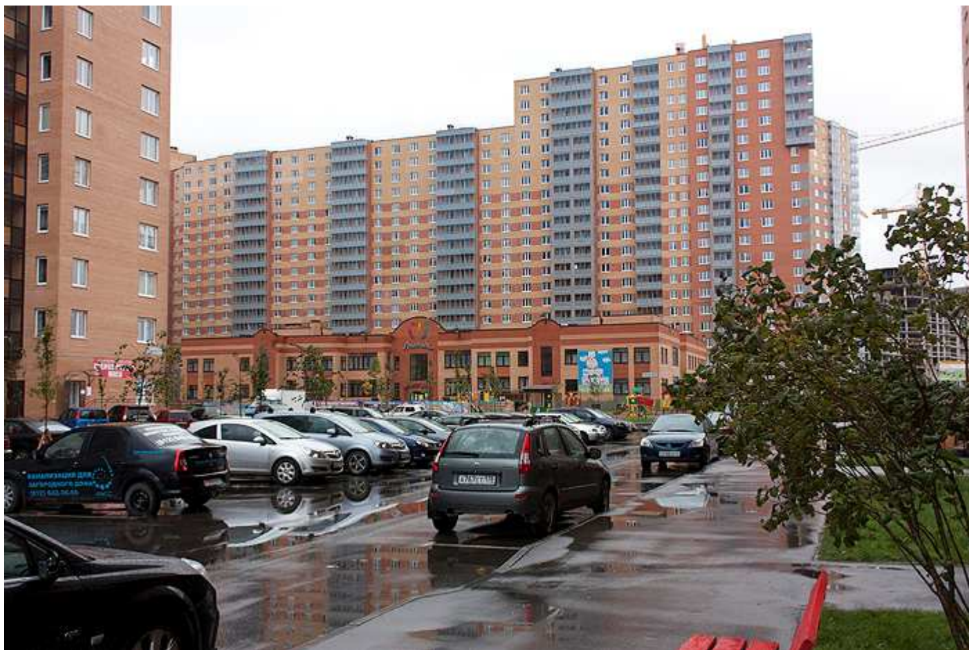
Вид со стороны детского сада на секции 10-6