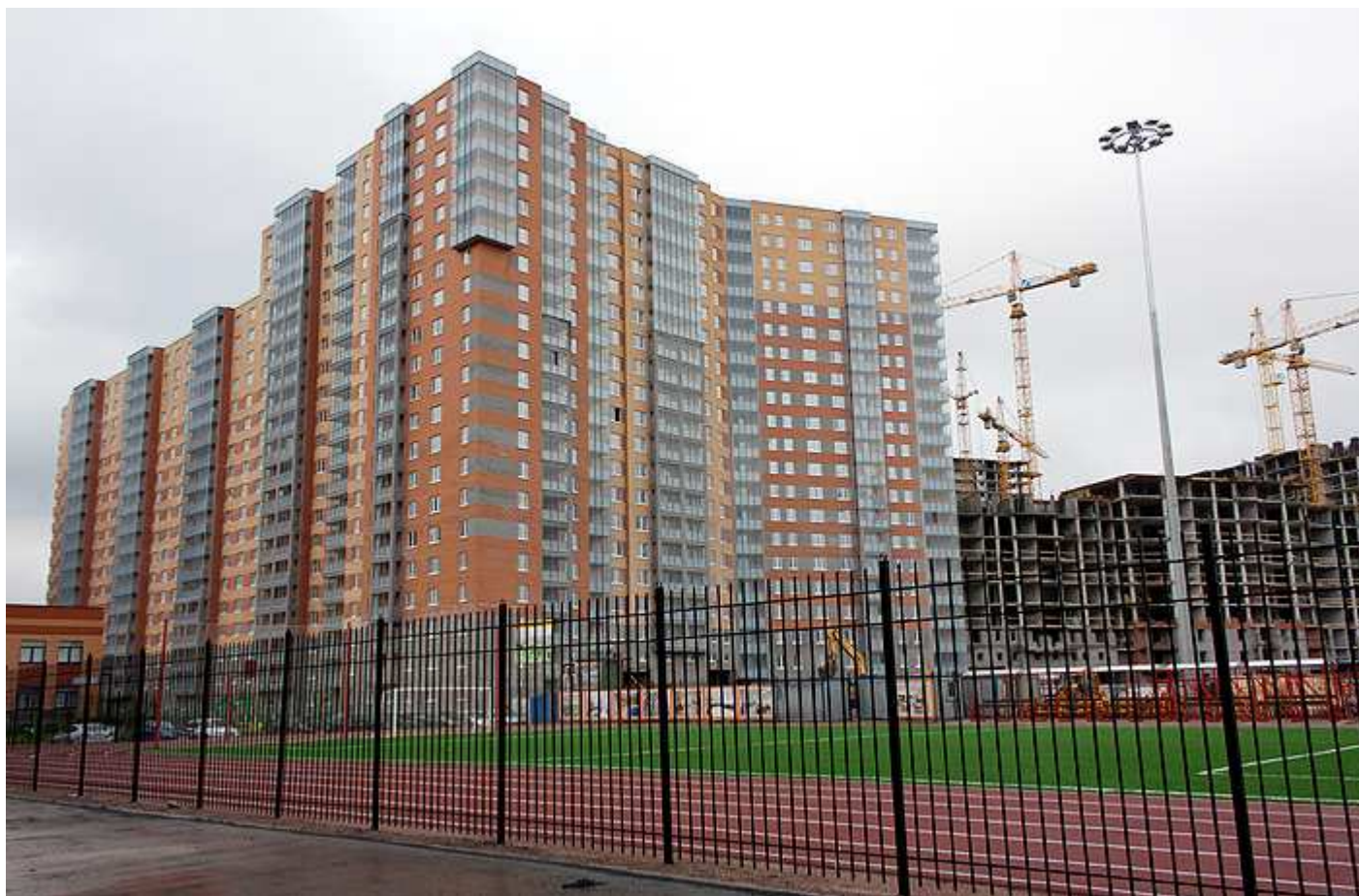
Вид со стороны спортивной площадки школы на секции 10-4