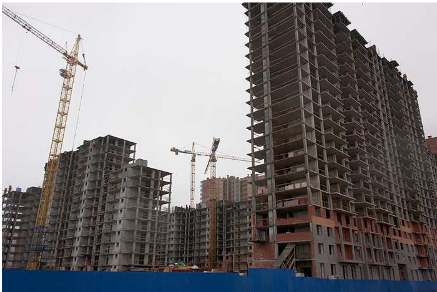
Вид с Областной улицы на секции 29-26, 34-31, 17-16