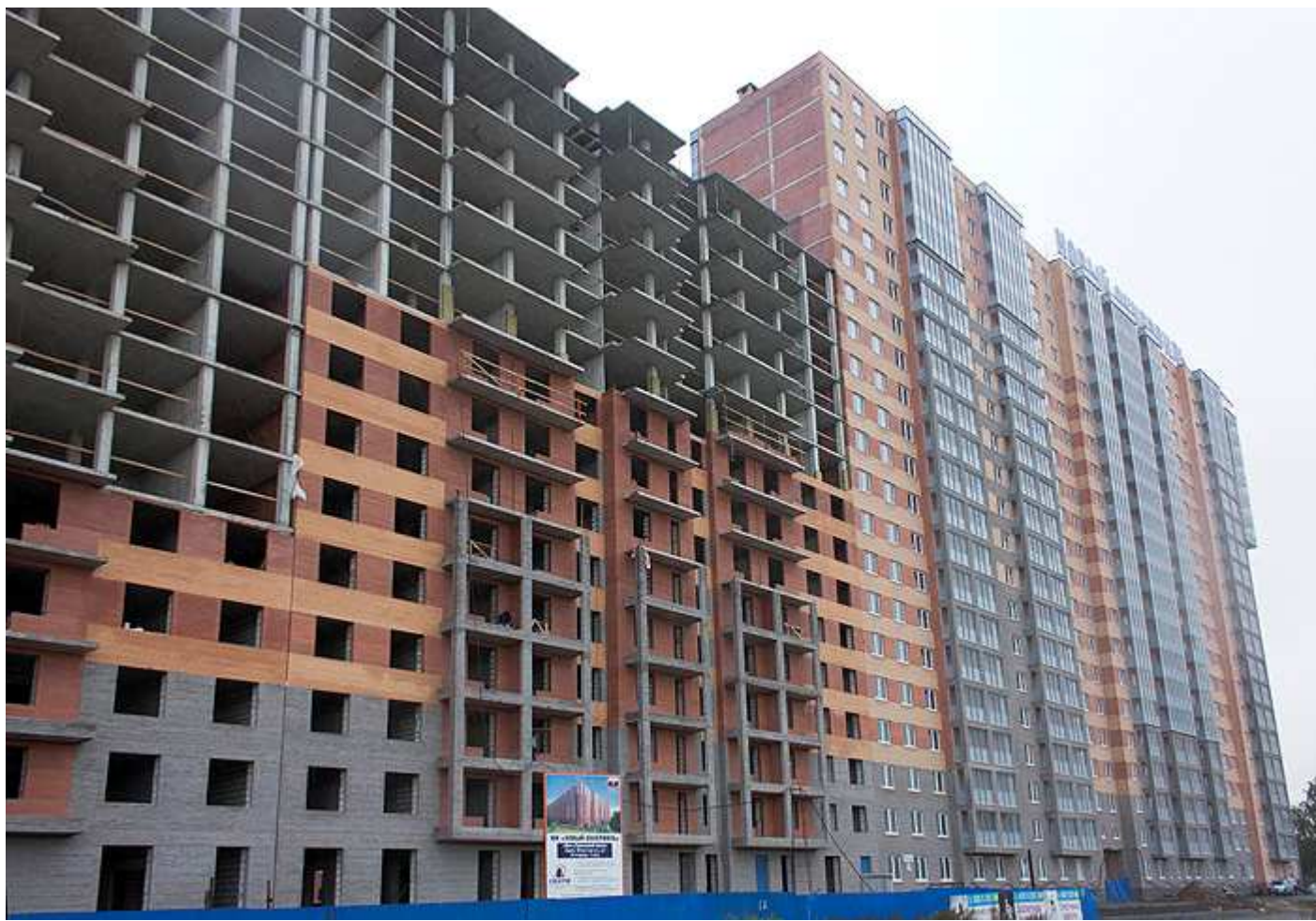
Вид на секции 16-12