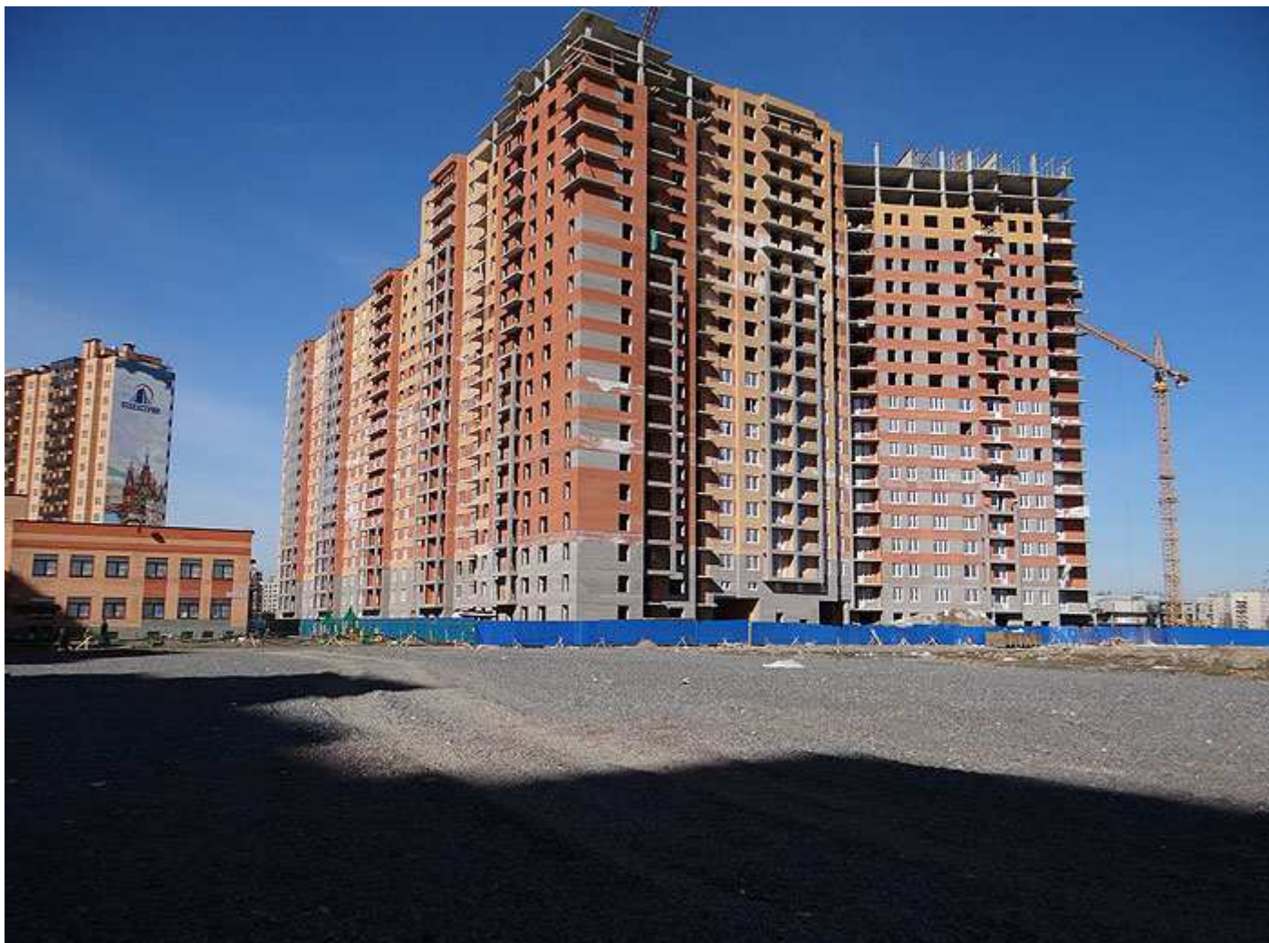
Секции 10-6 (угловая 6), 5 и 4