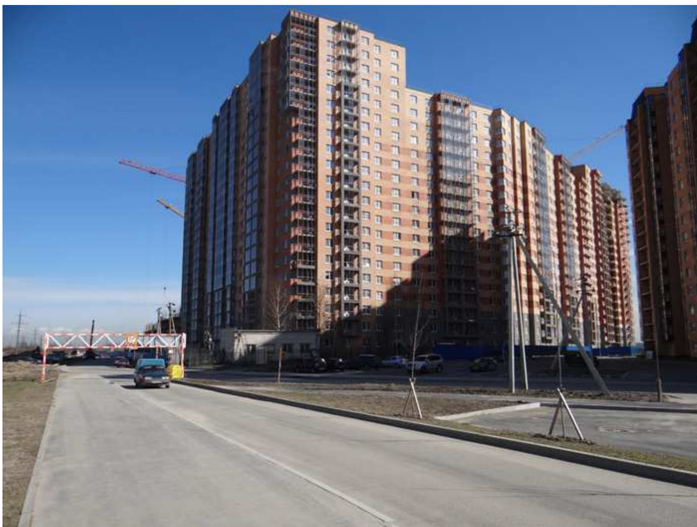
Вид на секции 14-12 (угловая 12), 10-6 секции.