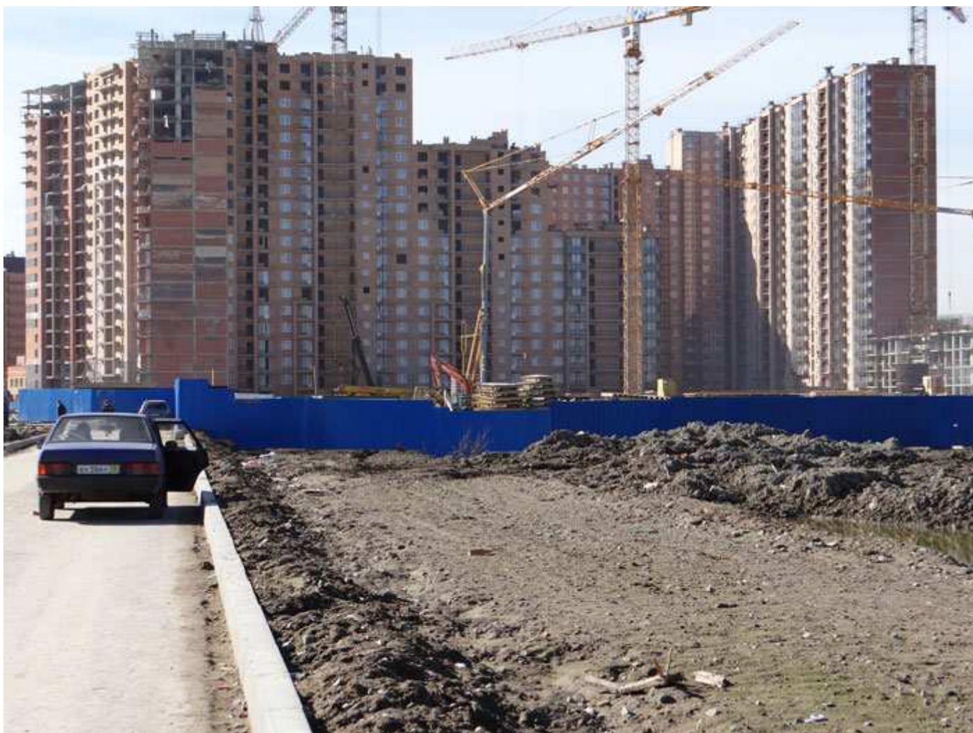
Вид на секции 4-6, 4-1, 11-14 со стороны двора