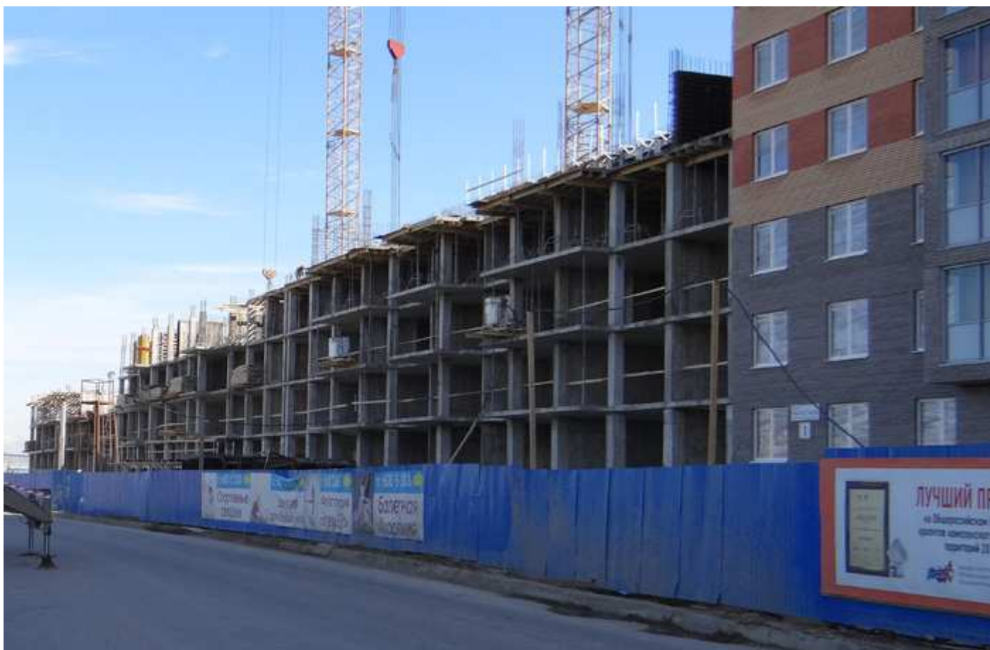
Вид с Областной улицы на секции 17-15