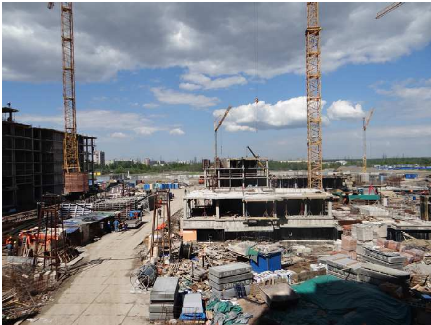
Стройплощадка. Вид на секции 31 и 32 (передний план) и 26-28 (задний план)