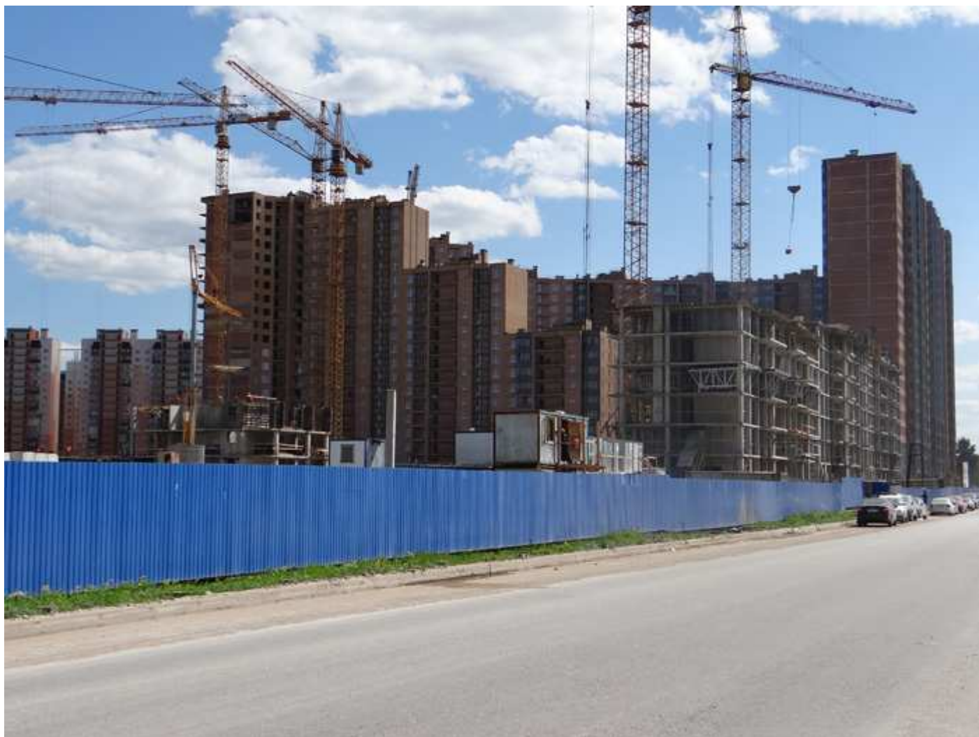
Вид с Областной улицы на секции 4-1, секции 17-15 пуска III и секции 14-12 пусков I-II