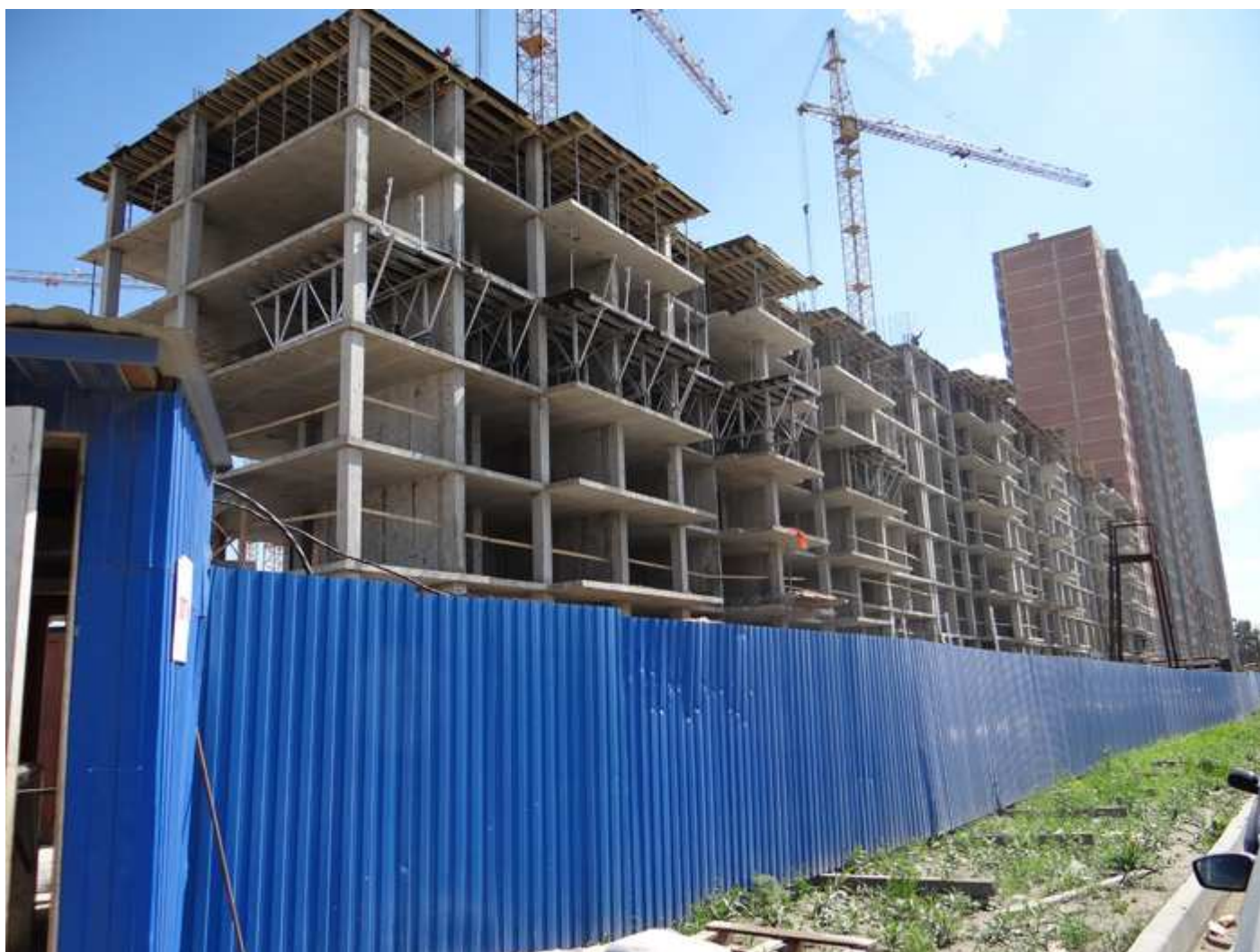
Вид с Областной улицы на секции 17-15