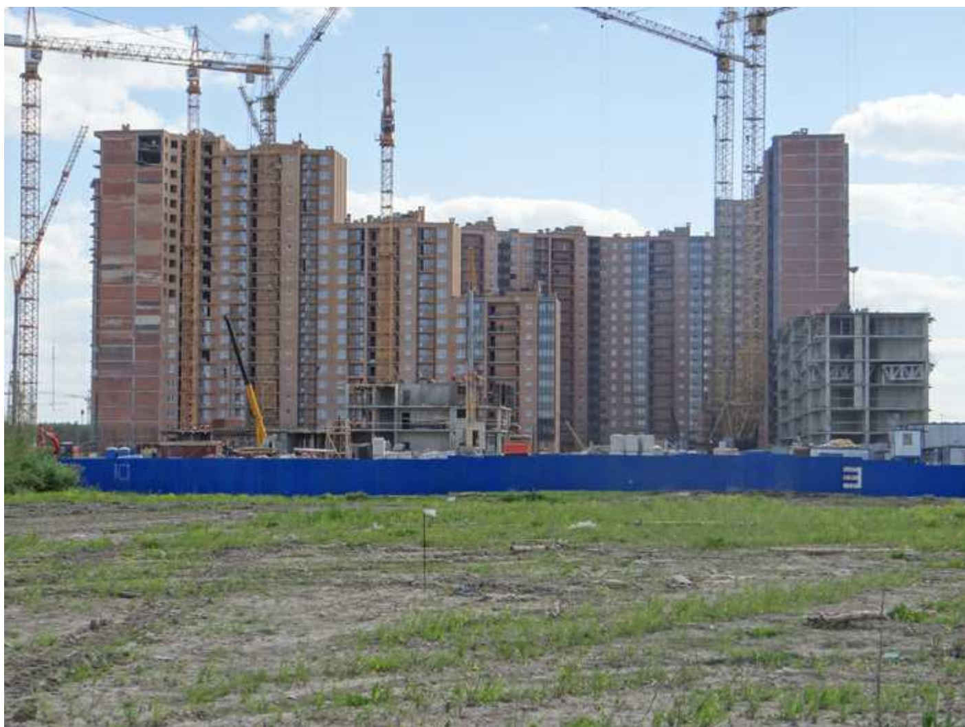
Вид на секции 4-1, 10-14