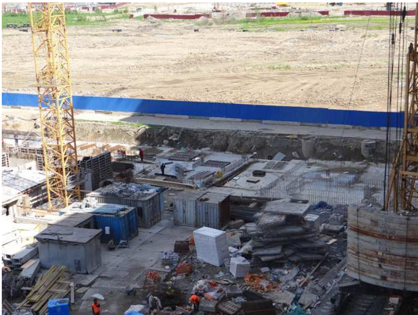
Стройплощадка. Вид на секции 33-35