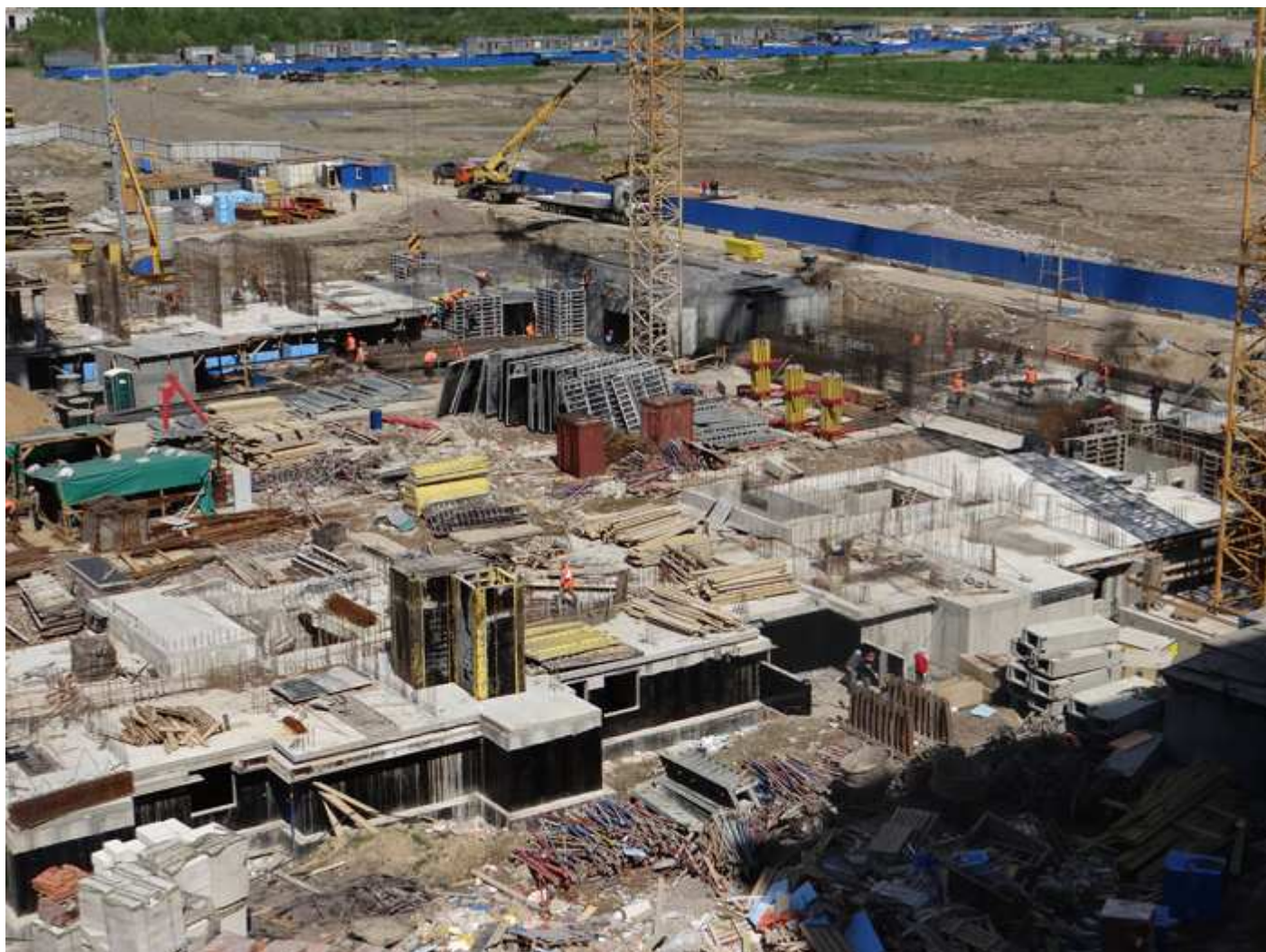
Стройплощадка. Вид на секции 31-34 (передний план) и 27-30 (задний план)