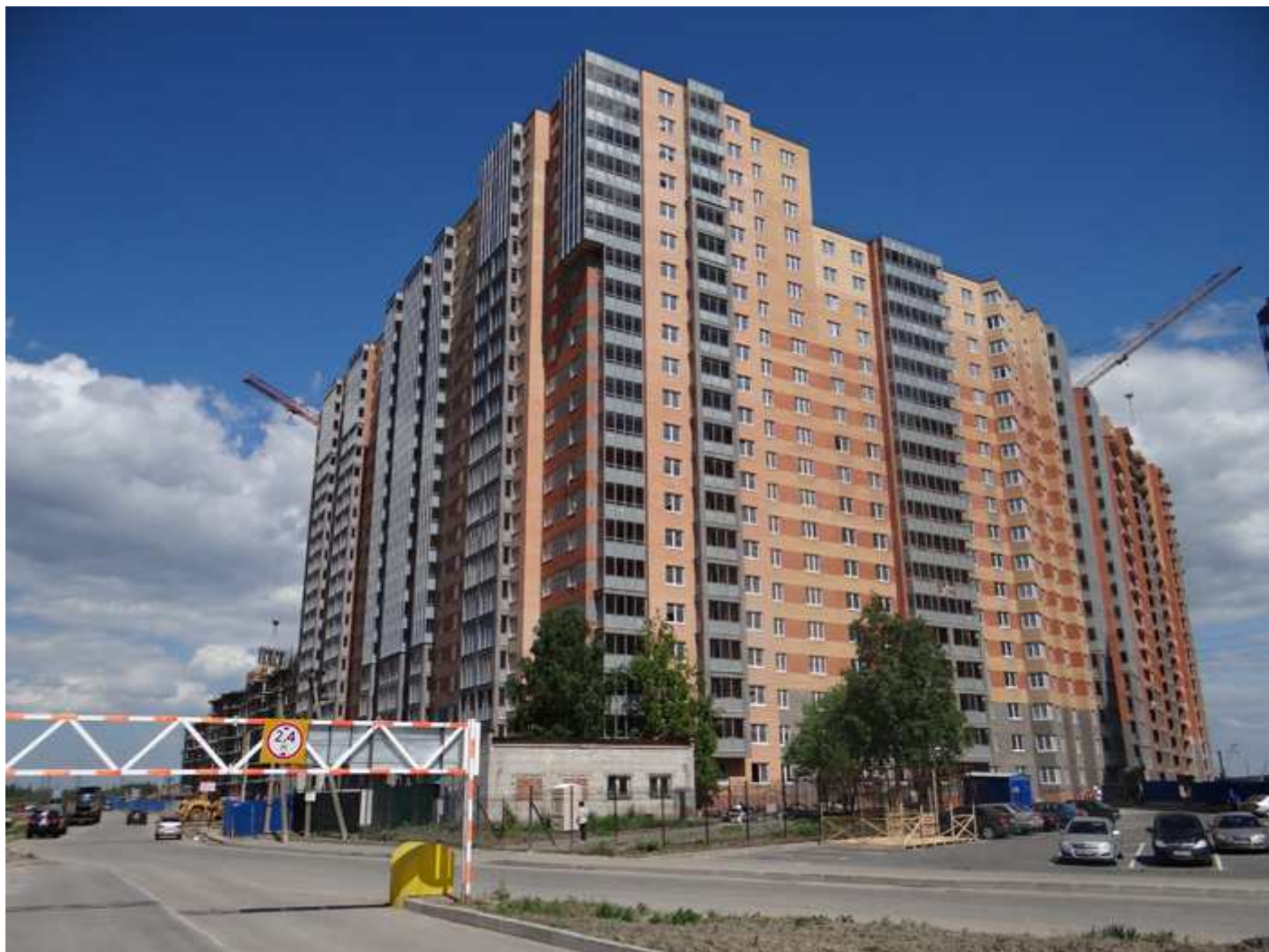
Вид с Областной улицы на секции с 14 по 6 (слева направо)