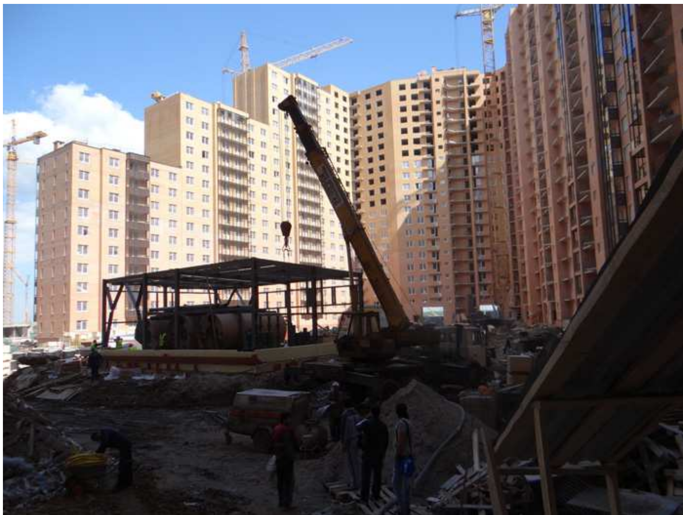
Вид со двора пусков I-II от 12 секции на секции 1-10