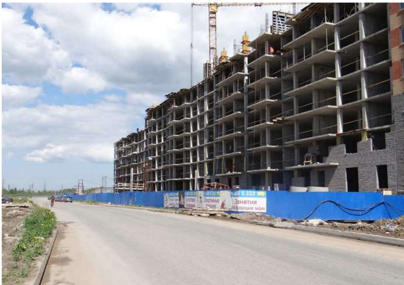
Вид с Областной улицы на секции 17-15