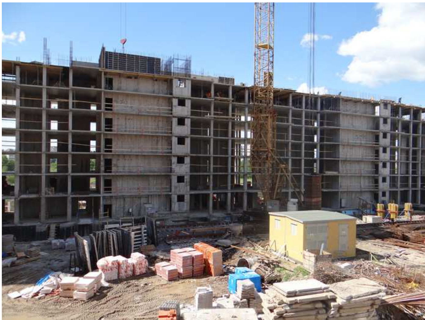
Стройплощадка. Вид на секции 15-17