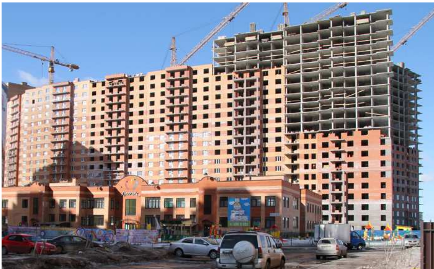
Вид со стороны детского сада на секции 10-6 и 4