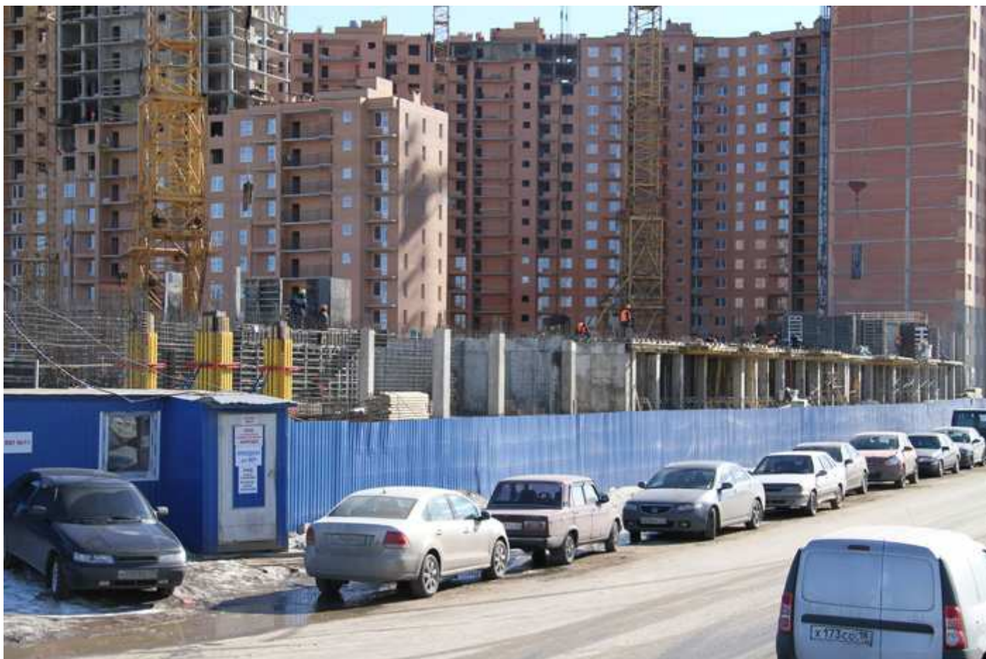
Секции 17-15, крупнее