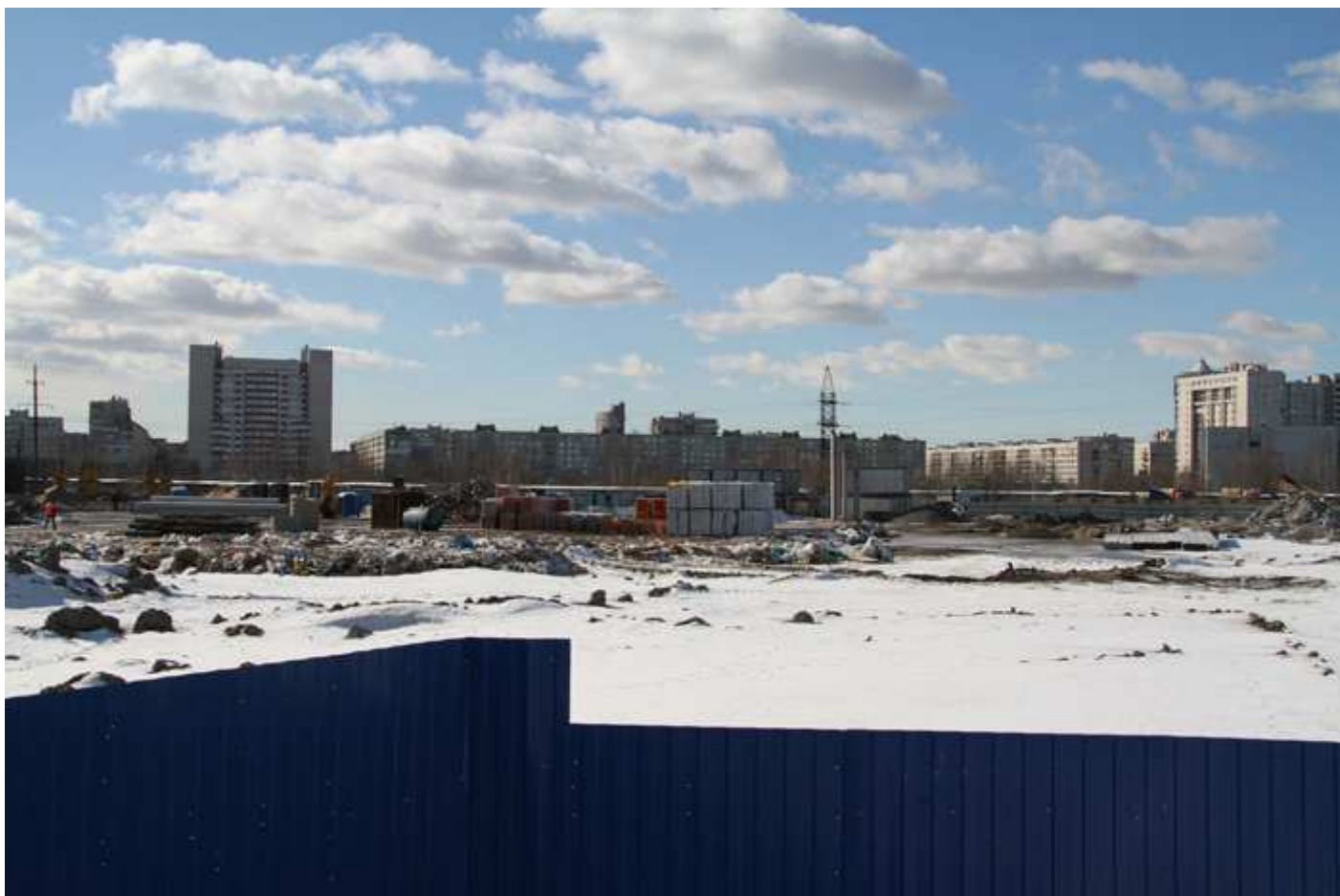
Продолжение (правее) площадки