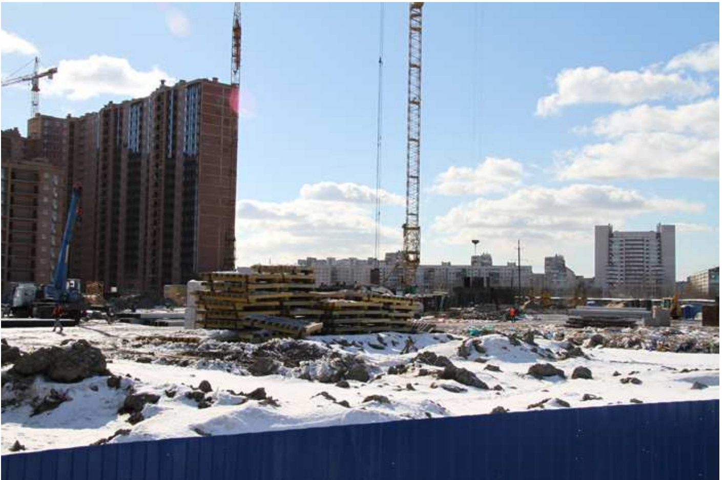
Строительная площадка со стороны двора