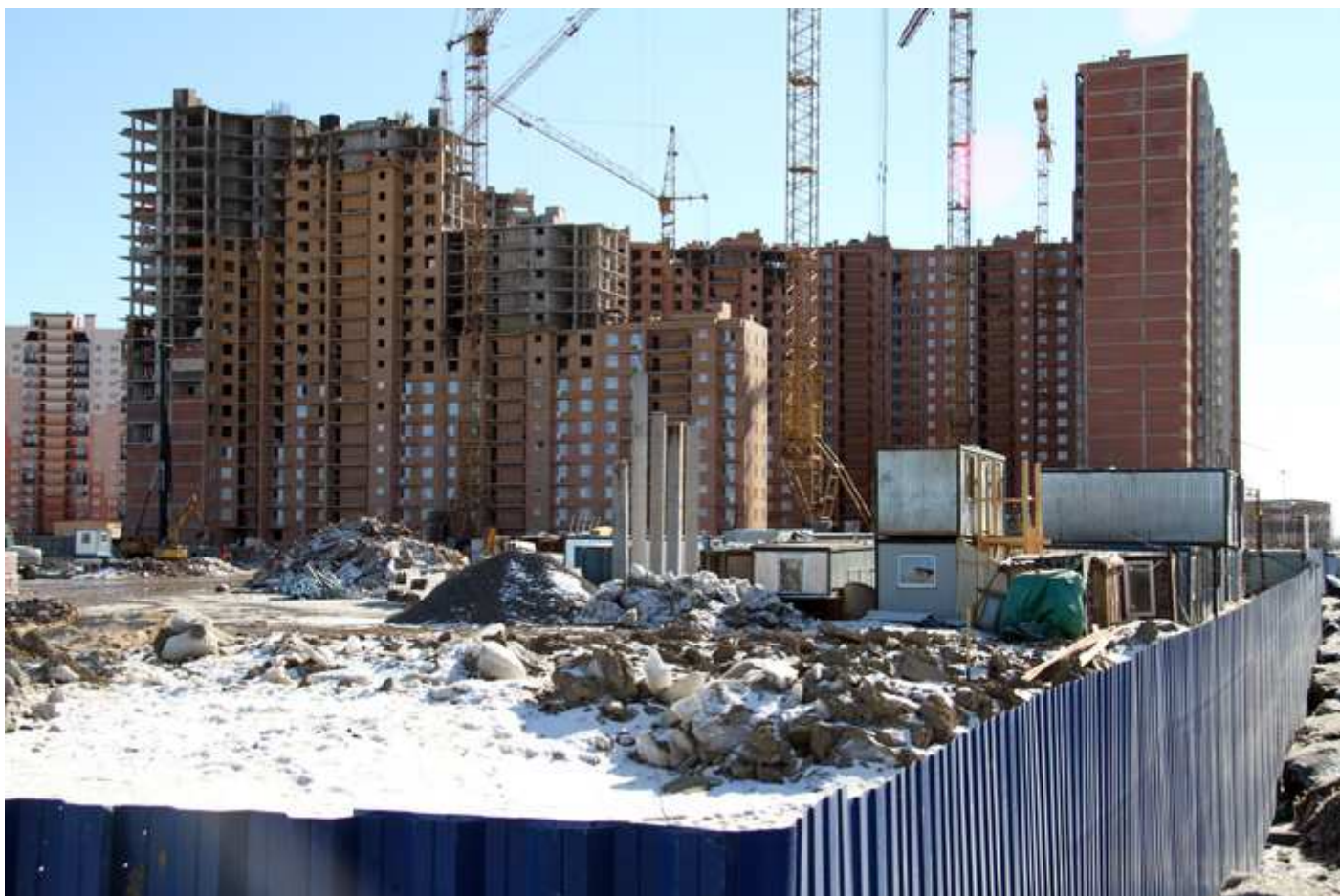
Вид на секции 4-1, 8-10 со двора, 14-12 с Областной ул.