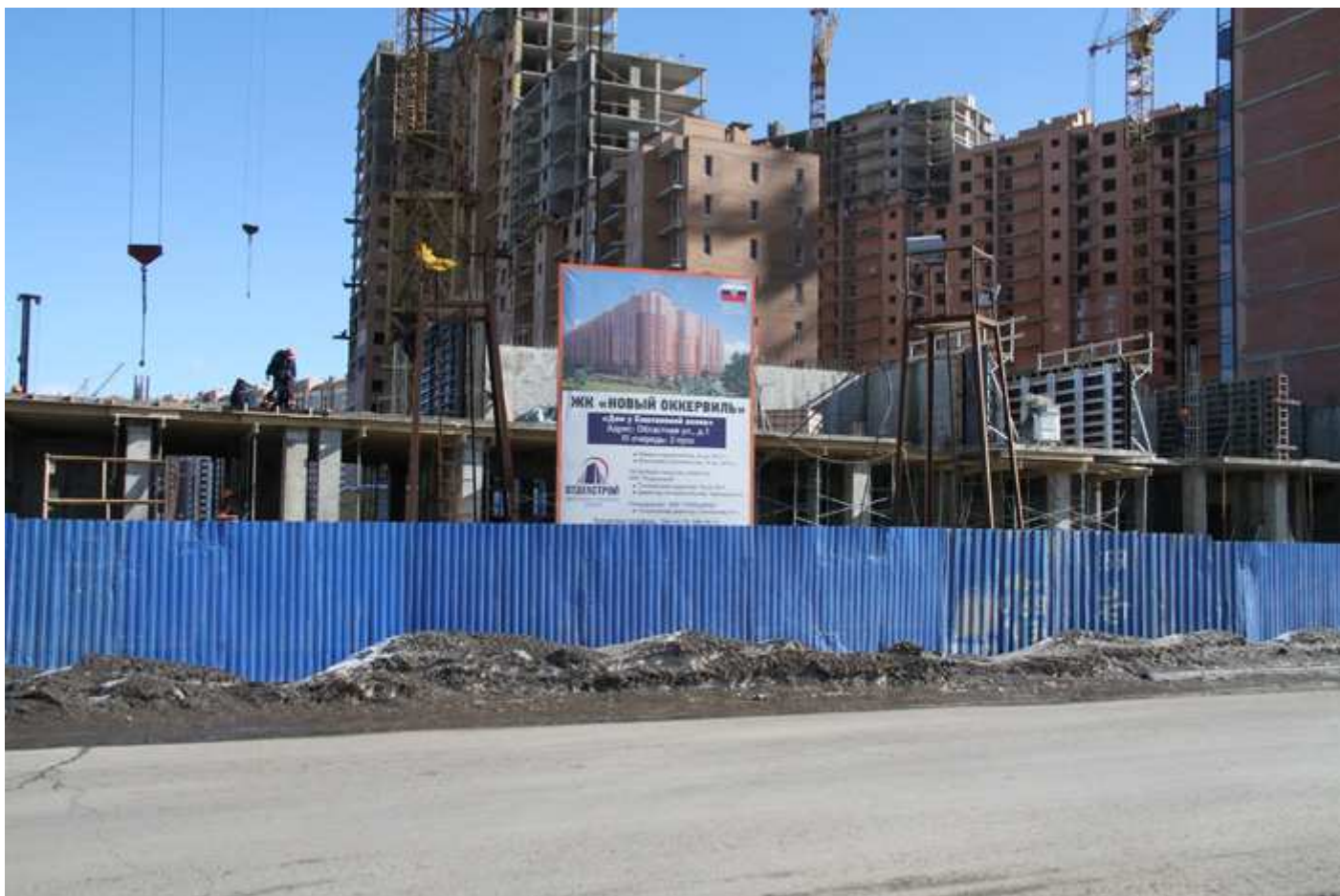
Строительные работы, 15 секция