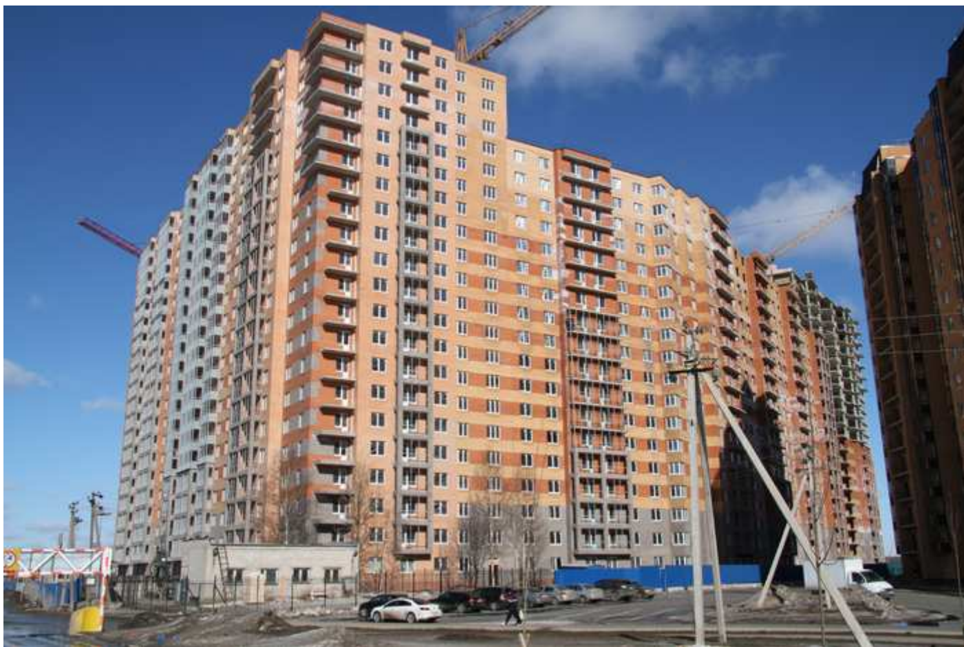
Вид со стороны Областной ул. на 14, 13, 12 (угловая), 11-6 секции