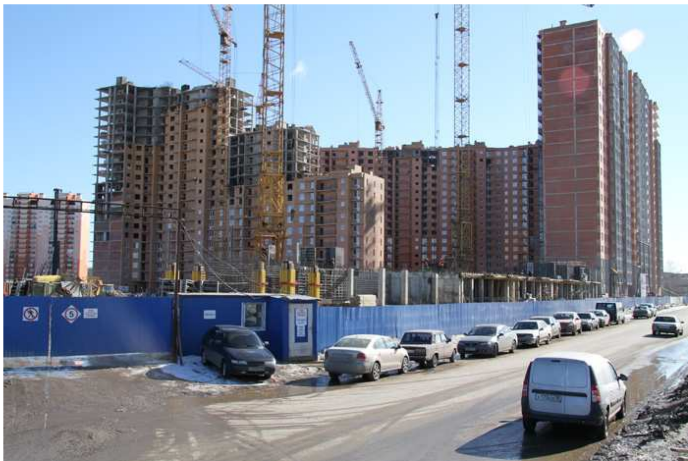
Секции 17-15, вид с Областной улицы