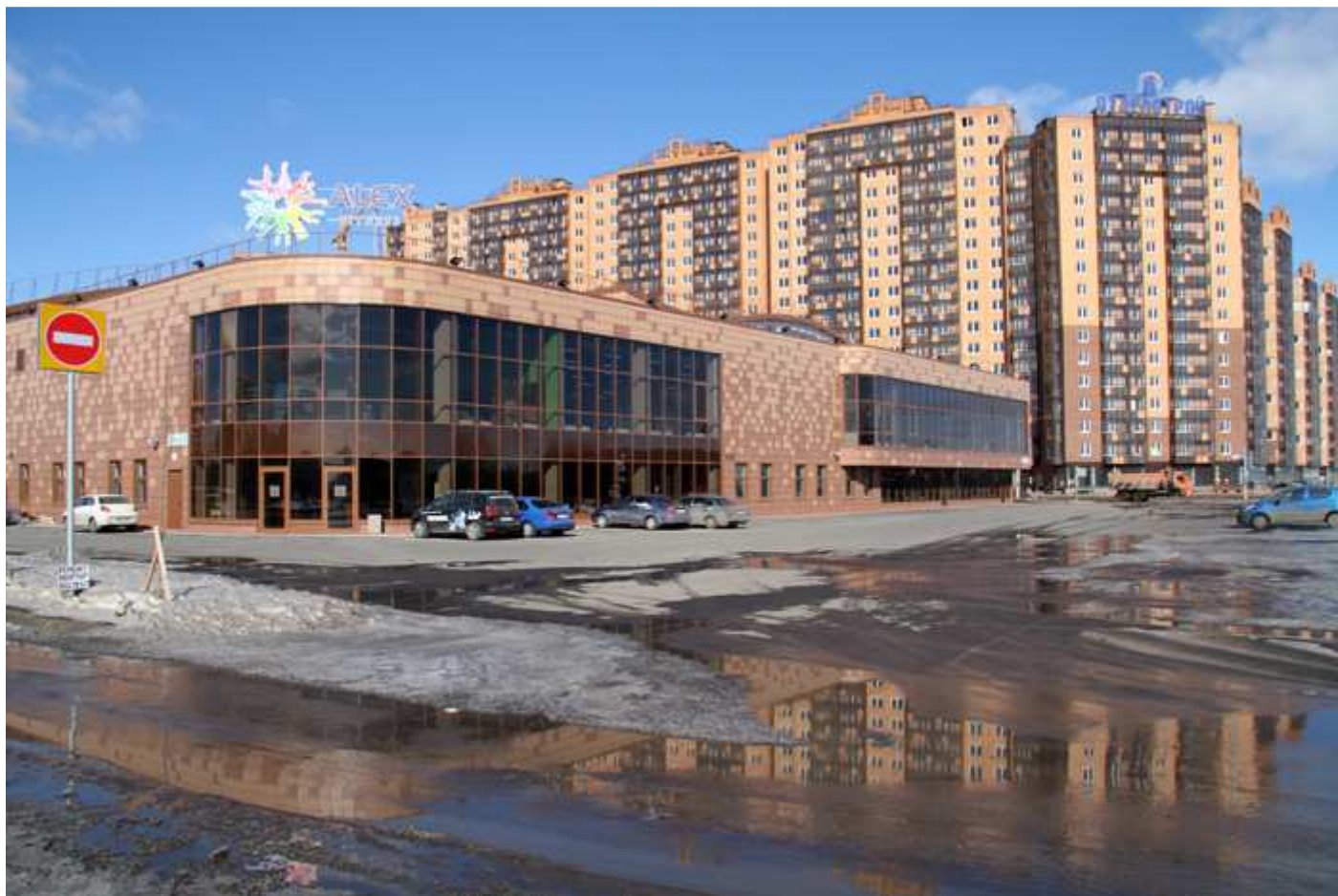
Спортивный комплекс. Фото от 26.12.2012