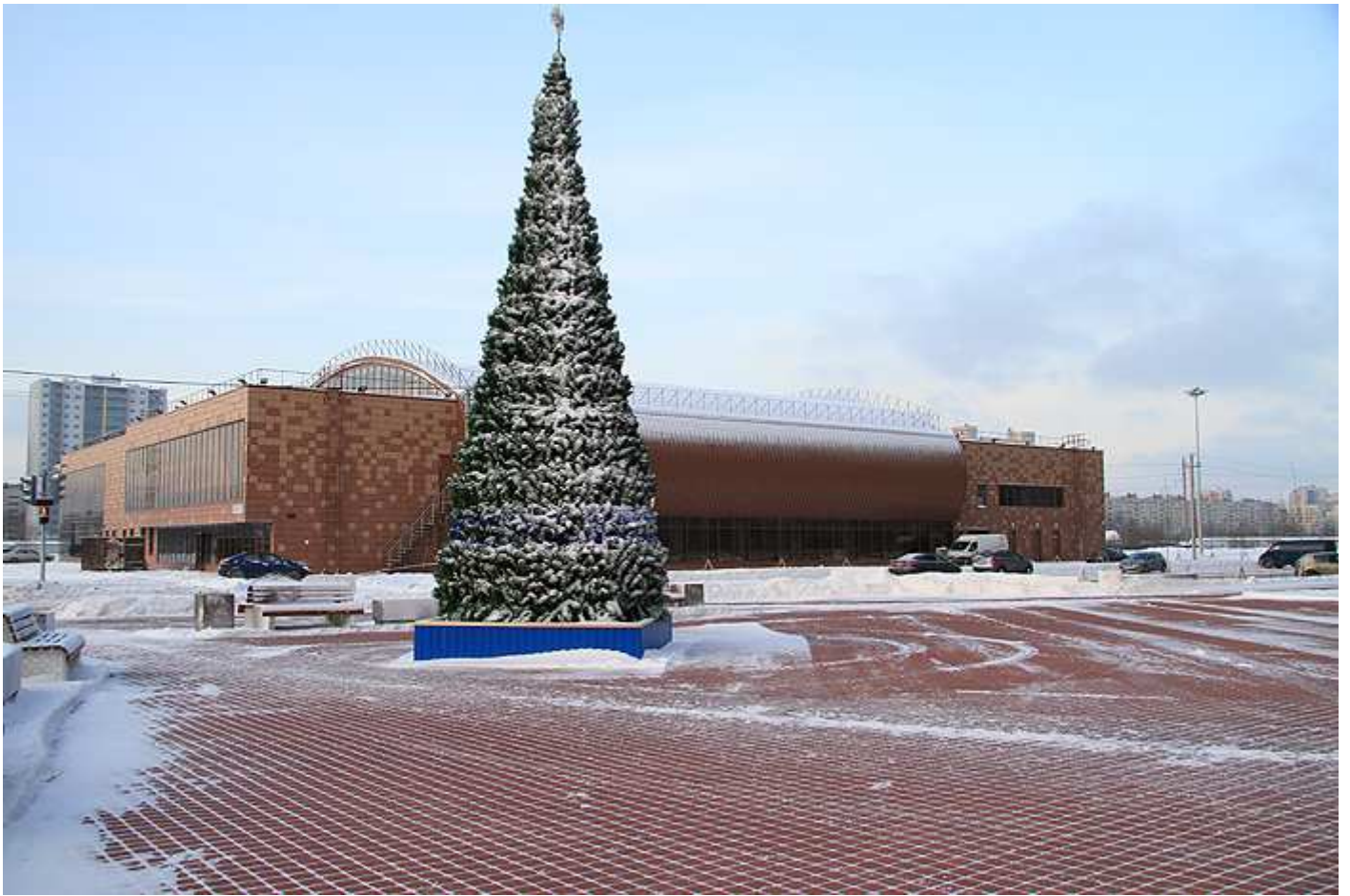
Спортивный комплекс. Фото от 19.11.2012