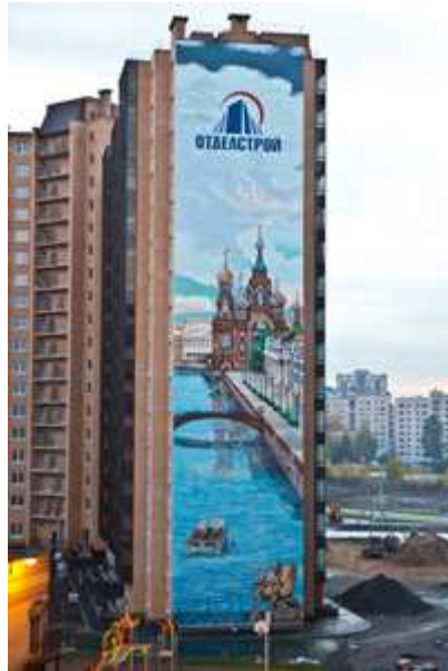
Фото в полном размере (2,26 Мб)