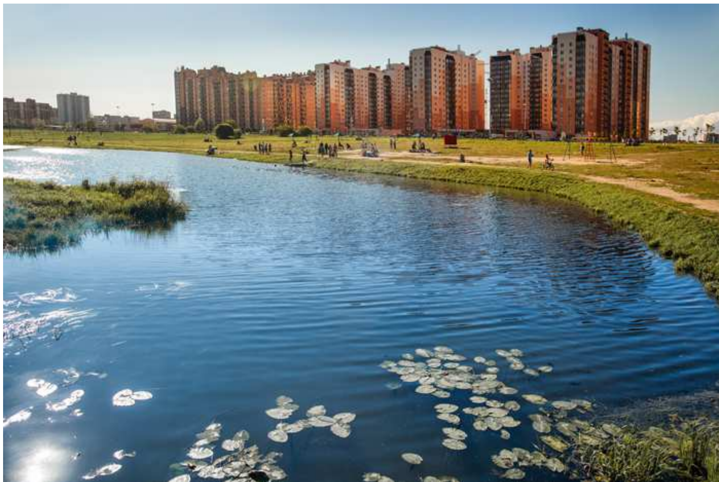
Парк с пешеходными и велодорожками. Фото от 22.07.2012