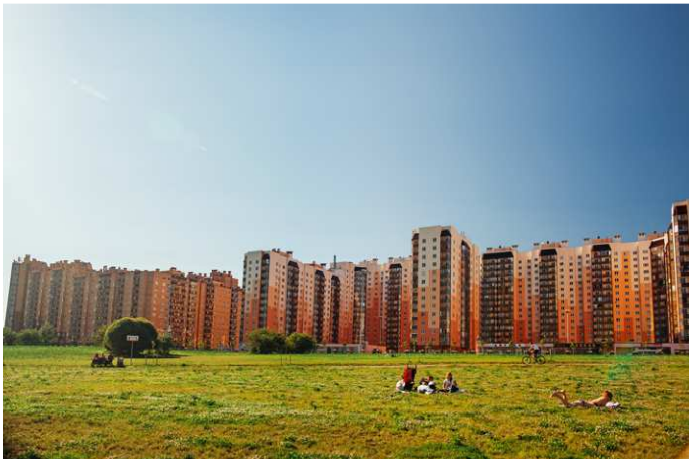
СДАН ДЕТСКИЙ САД. ФОТО ОТ 22.07.2012