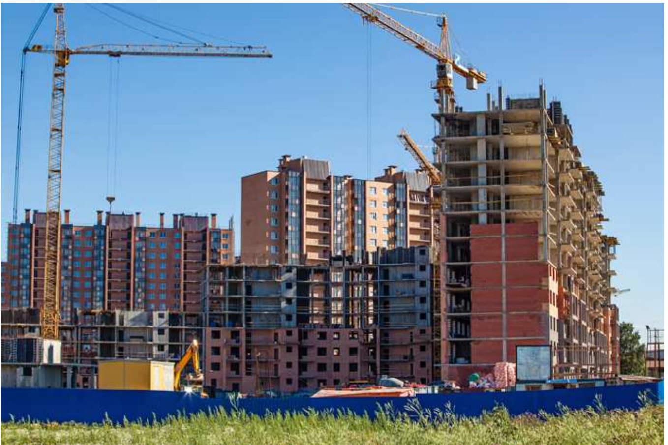
Вид на III очередь с торца 14 секции (ближайшая к нам секция, справа на фотографии)