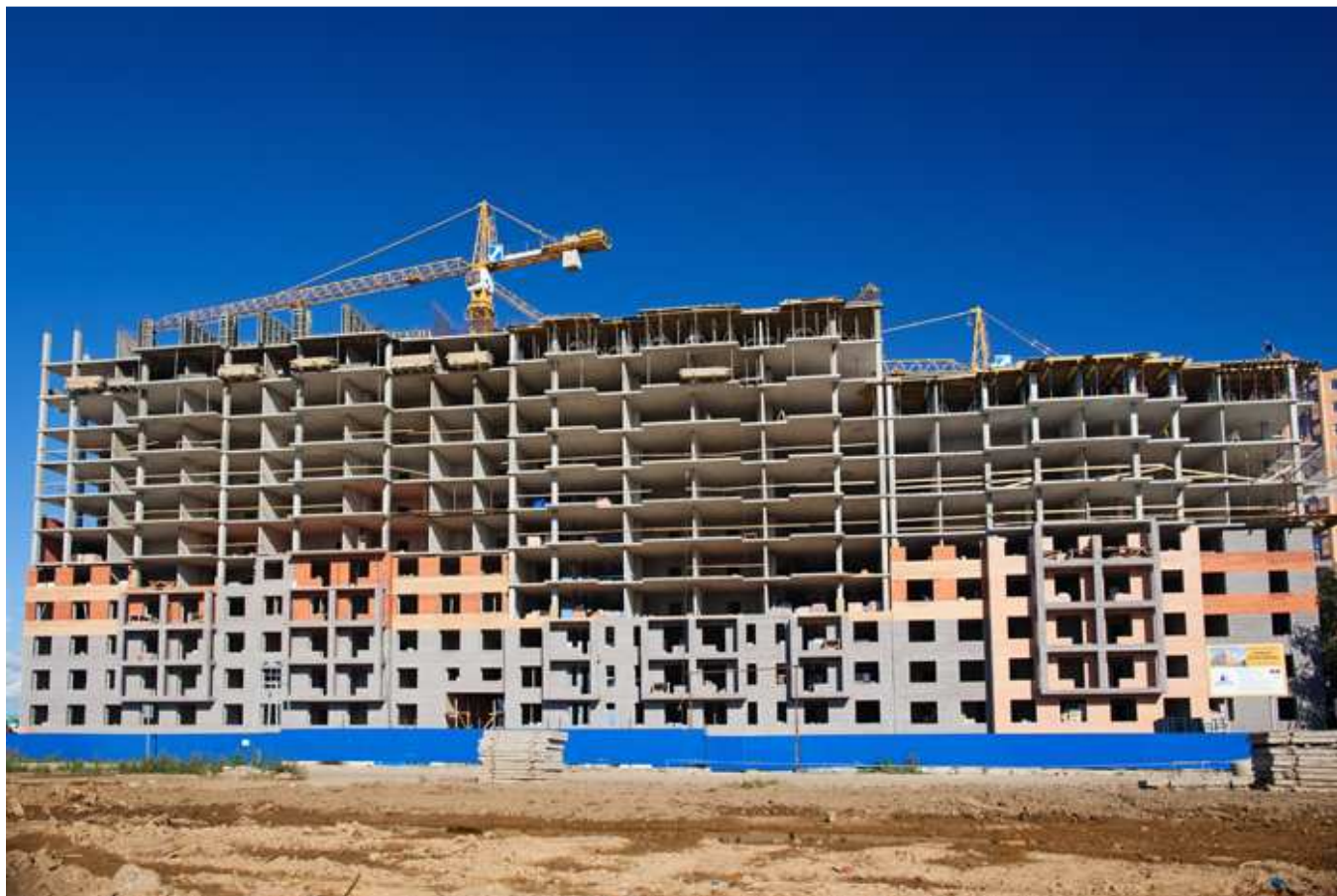
Вид на 14, 13, 12 секции со стороны Областной улицы