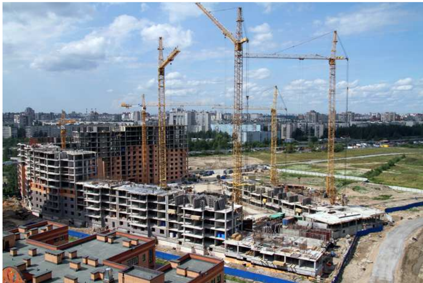
Вид на III очередь и детский сад с I очереди "Нового Оккервиль",