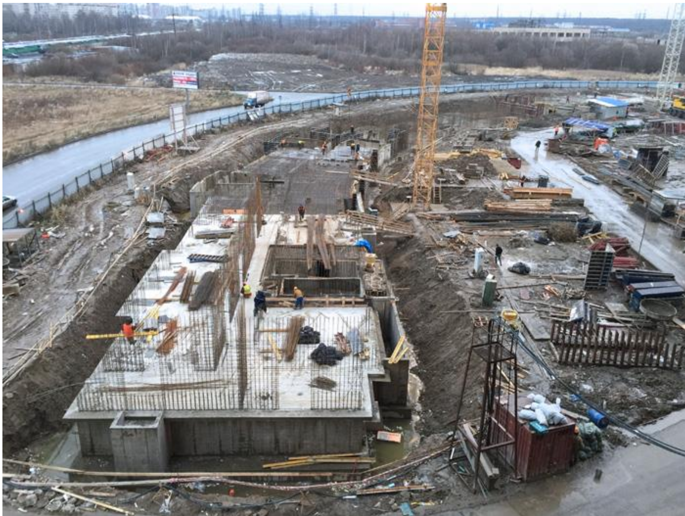
Вид с 4-го пуска 3-й очереди на секции 1-7