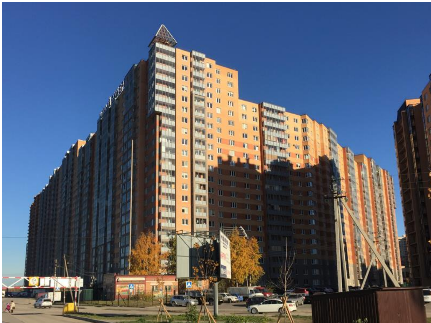
Вид с Областной улицы на секции (слева направо) 17-7