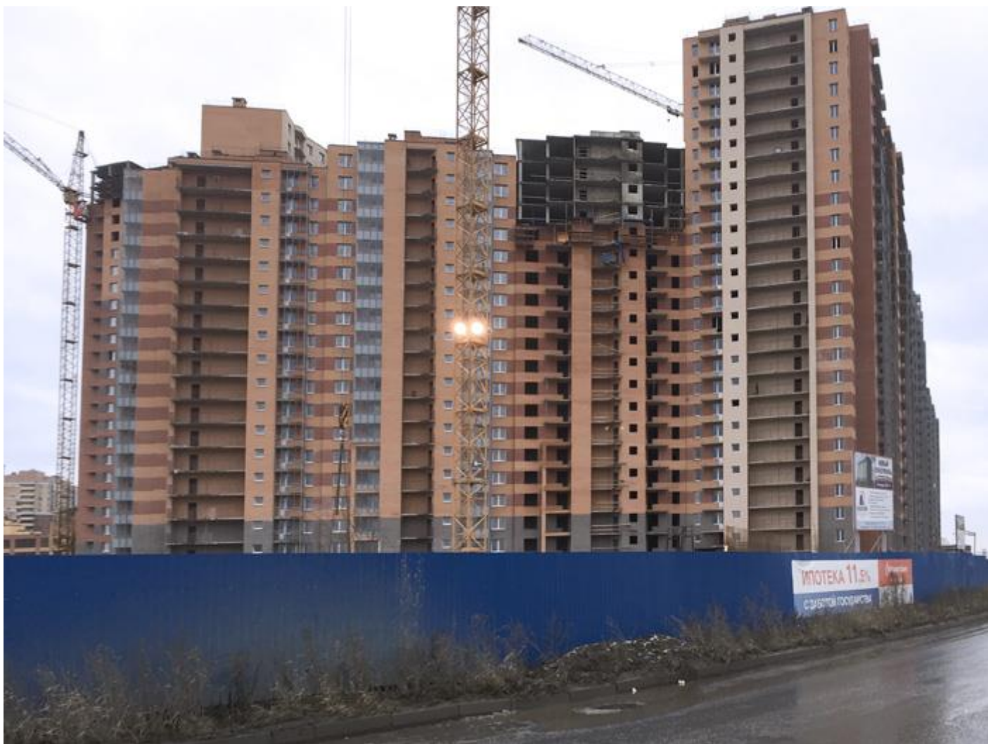
Вид со стороны Областной ул., секции 24-12