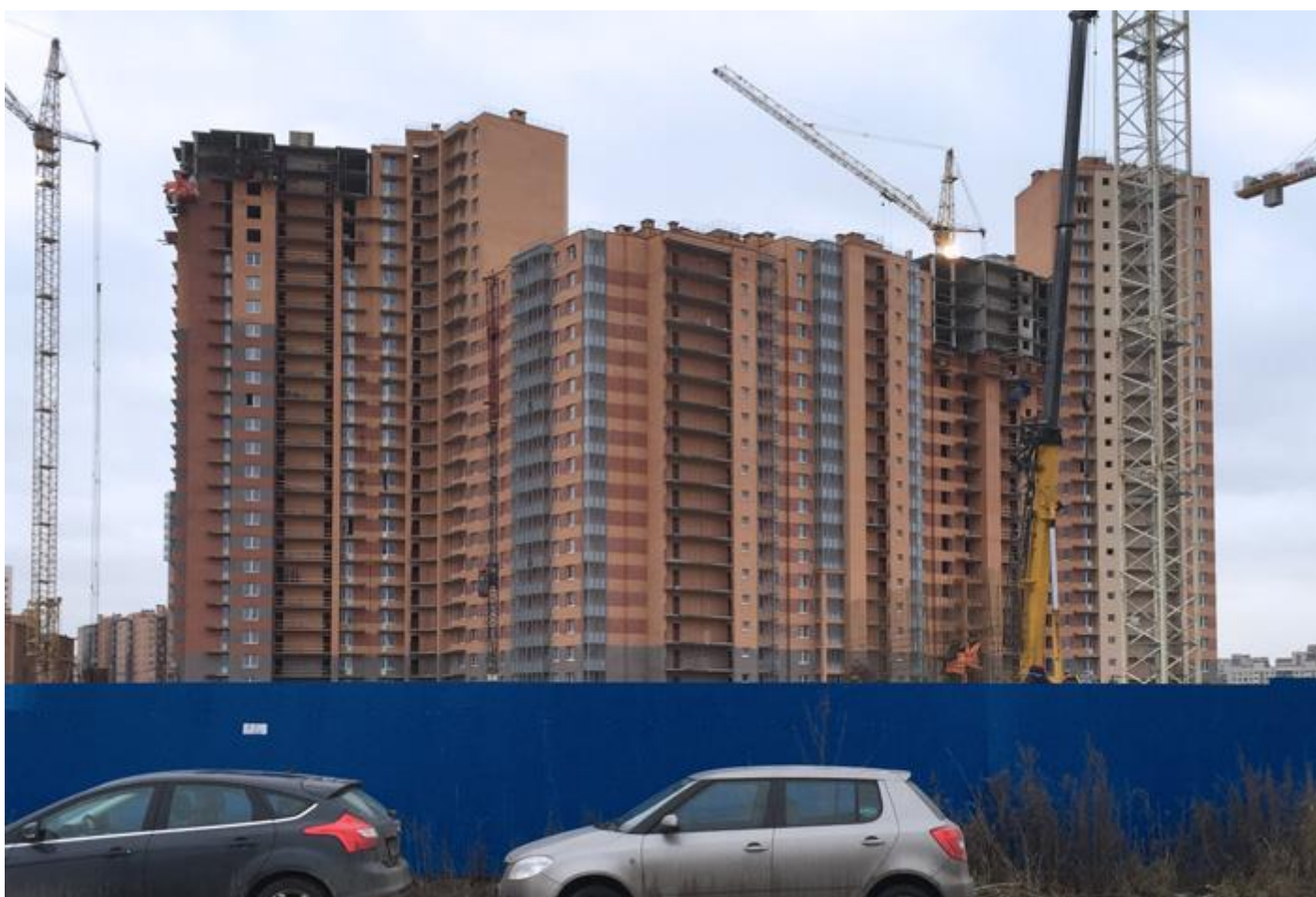
Вид со стороны Областной ул., секции 24-19