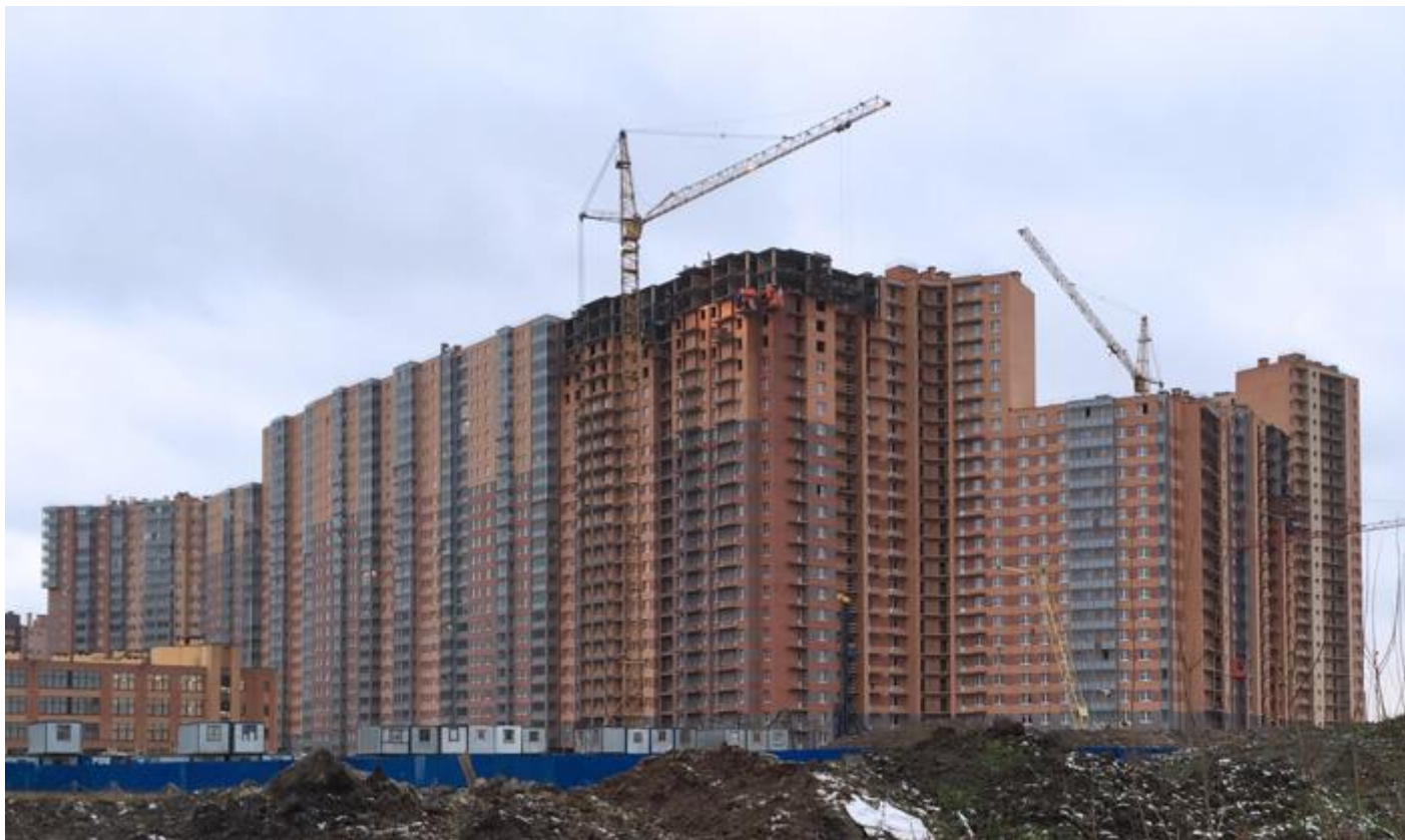
Вид со стороны Областной улицы, секции 6-4, 35-29, 25-19