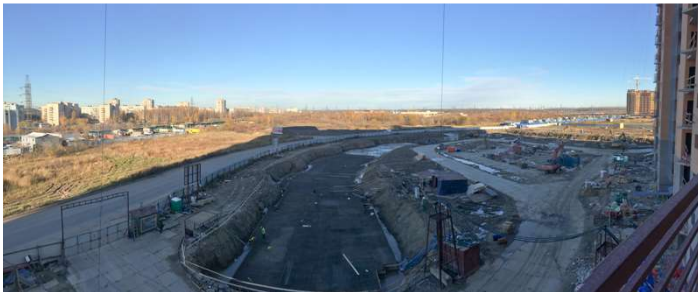
Вид с 4-го пуска 3-й очереди на секции 1-11