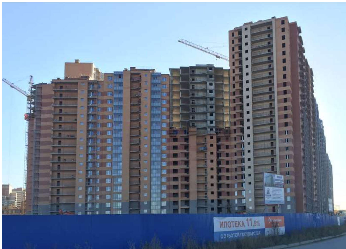
Вид со стороны Областной ул., секции 24-12