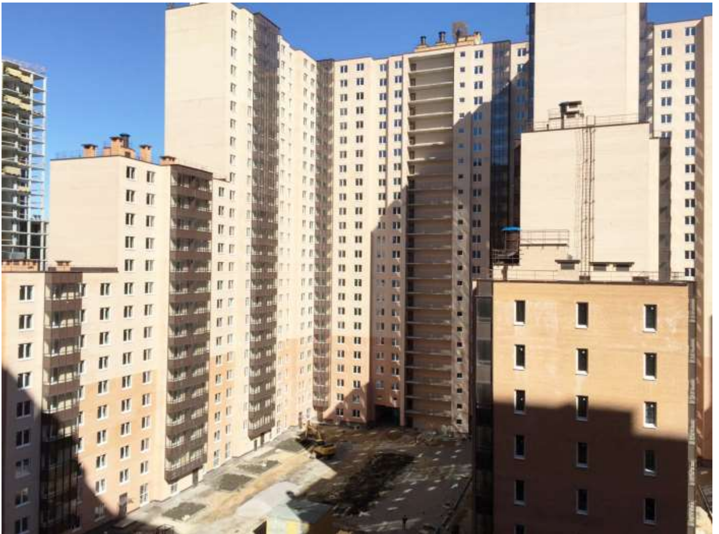
Двор 3-го пускa, секции 26, 27, 28, 29, 30, 31, 32, 33