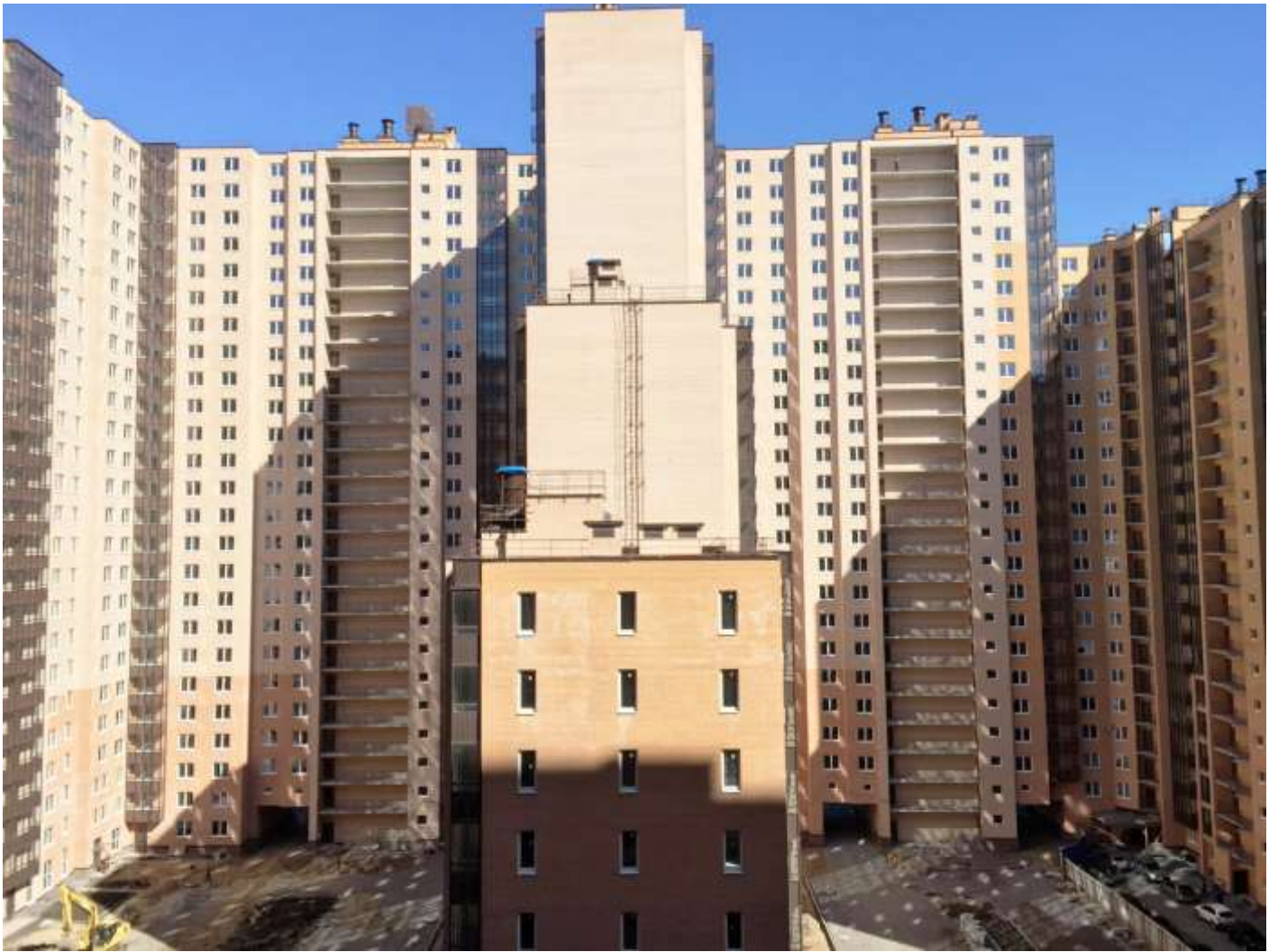
Двор 3-го пуска, секции 28, 29, 30, 31, 32, 33, 35