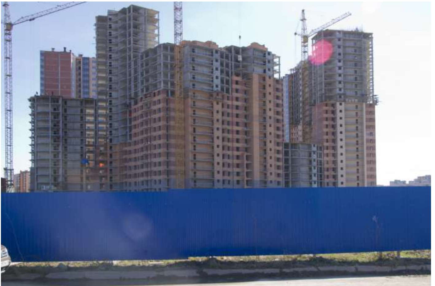
Вид со стороны Областной улицы