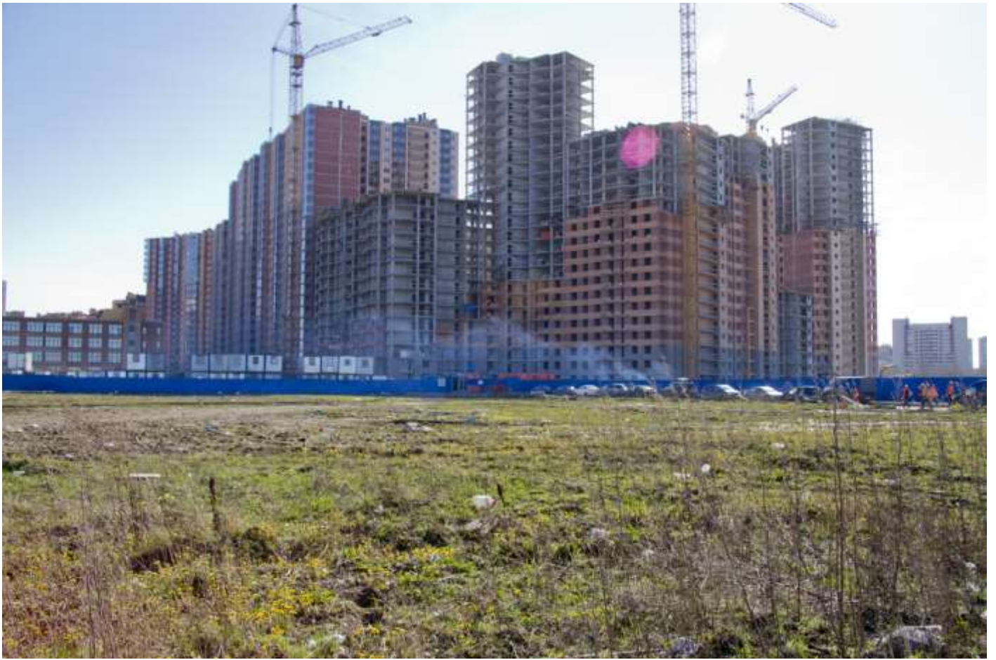
Вид со стороны Областной ул., секции 6-4, 35-34, 30-26, 25-22