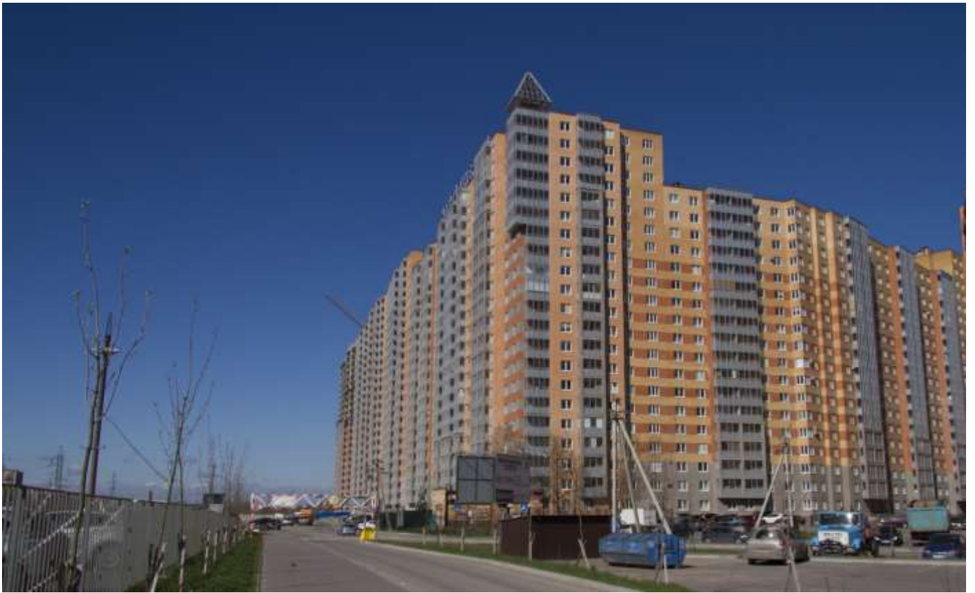
Вид с Областной улицы на секции (слева направо) 17-7