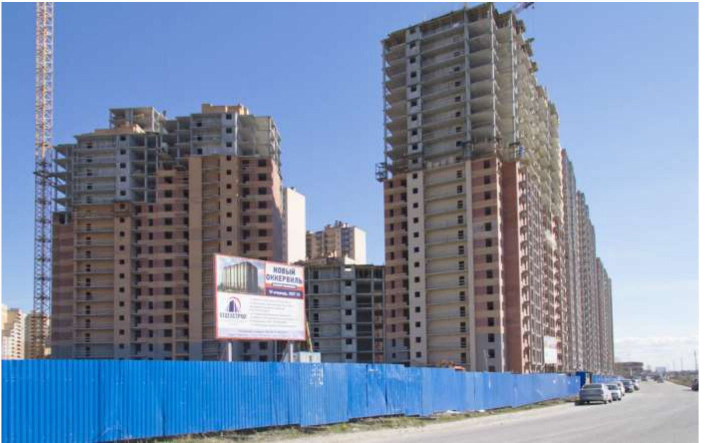
Вид со стороны Областной ул., секции 24-12