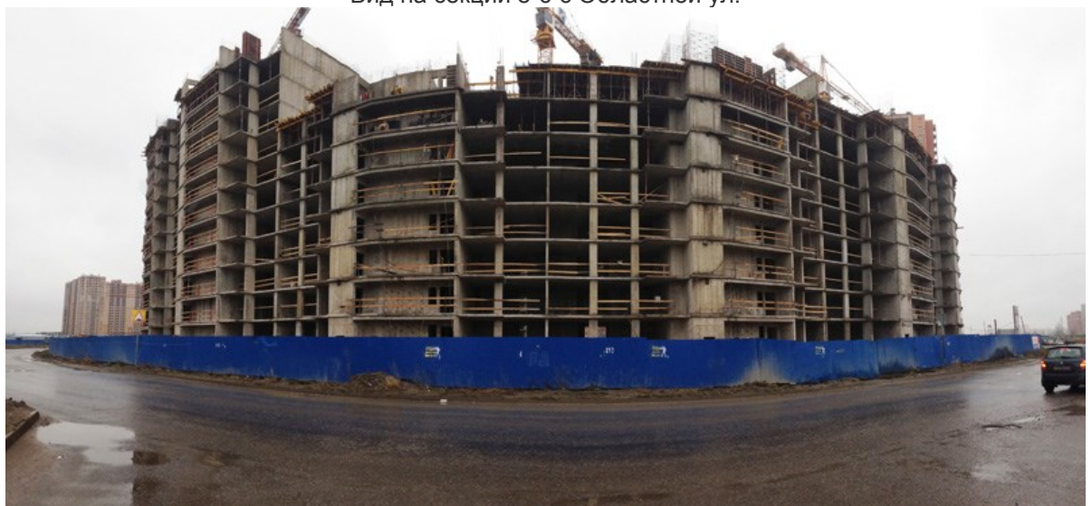
Вид на секции 8-1 (слева направо) со стороны Областной ул.