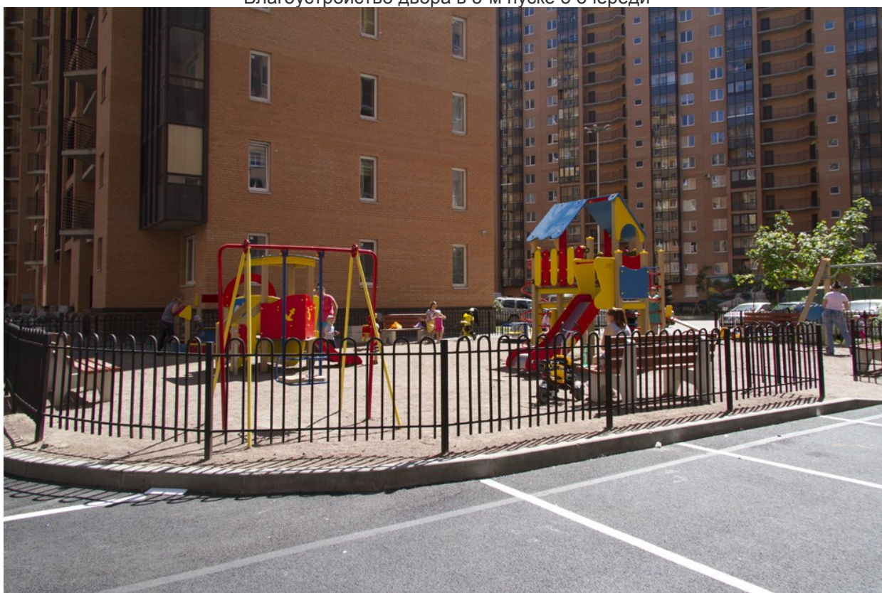
Благоустройство двора в 1-2-м пусках 3 очереди