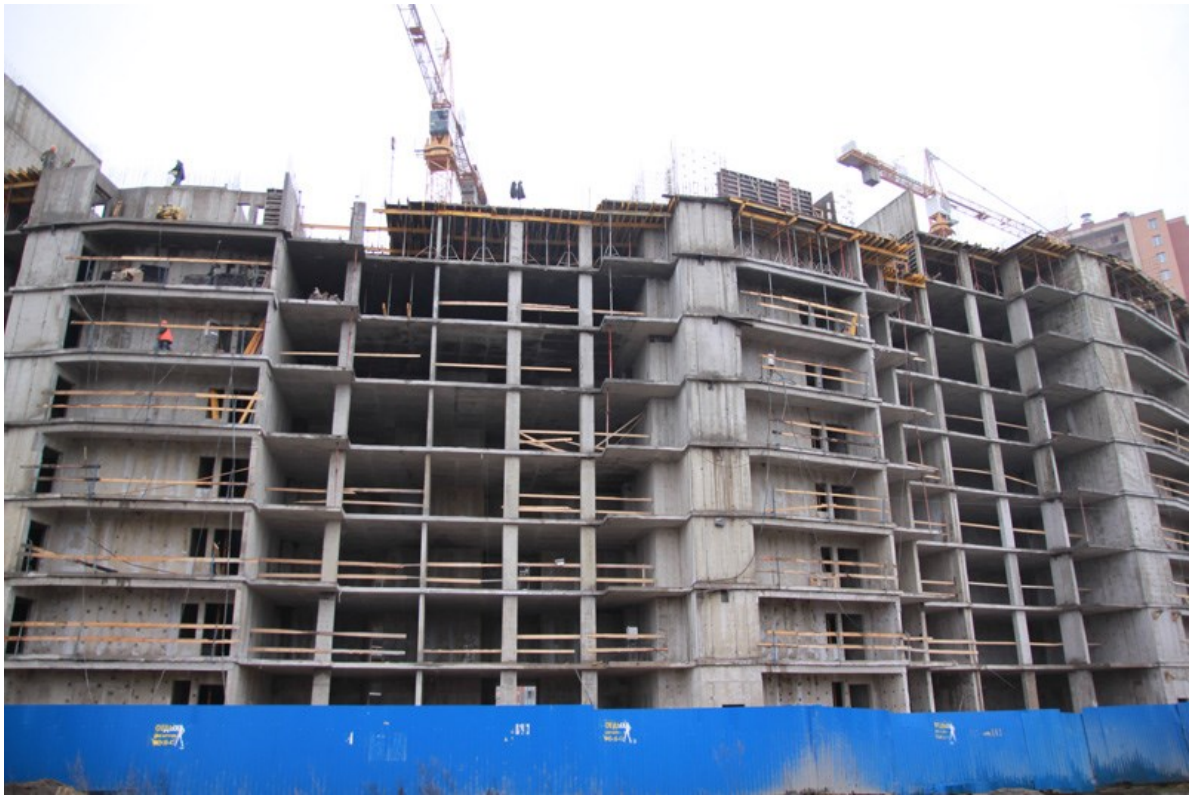
Вид на секции 5-4 со стороны Областной ул.