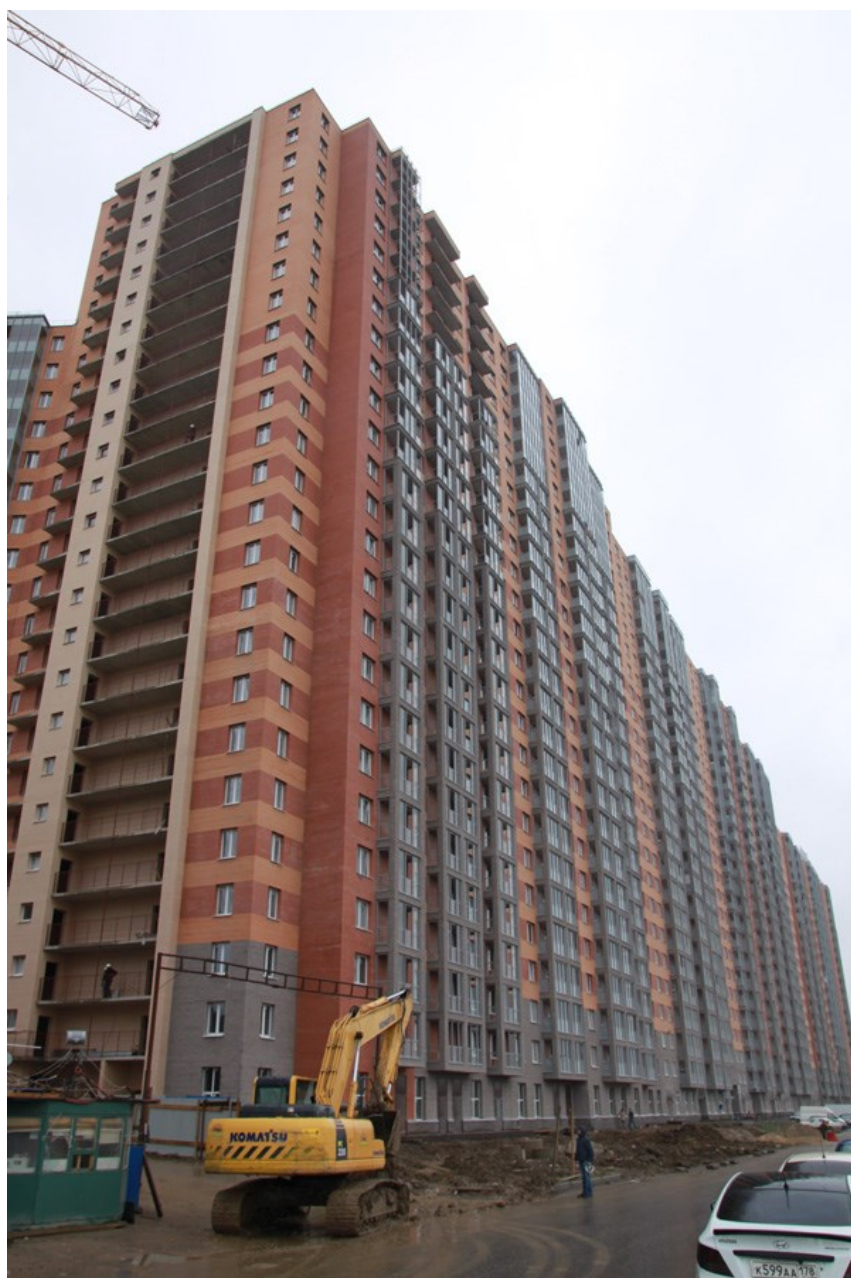
Вид со стороны Областной ул., секции 17-15