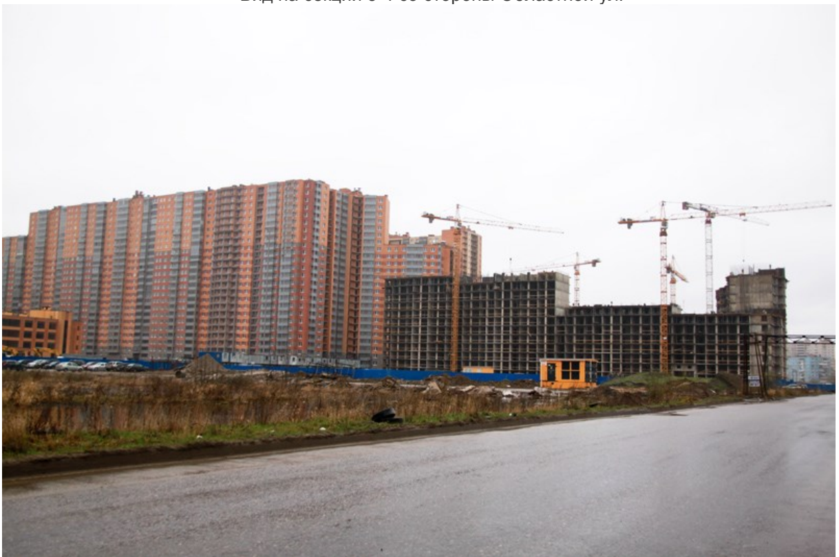
Вид на секции 11-7 со стороны Областной ул.