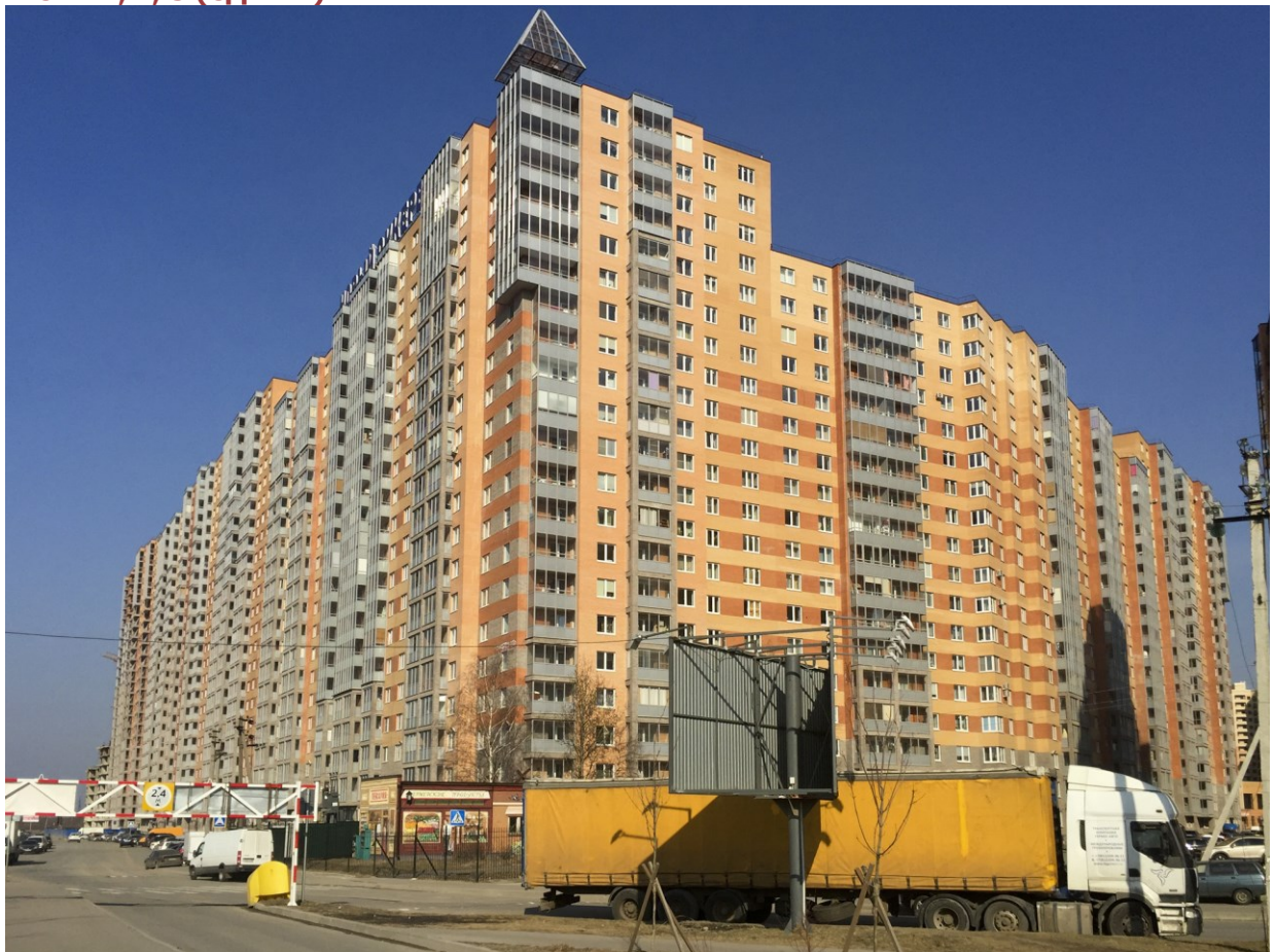
Вид с Областной улицы на секции (слева направо) 17-7