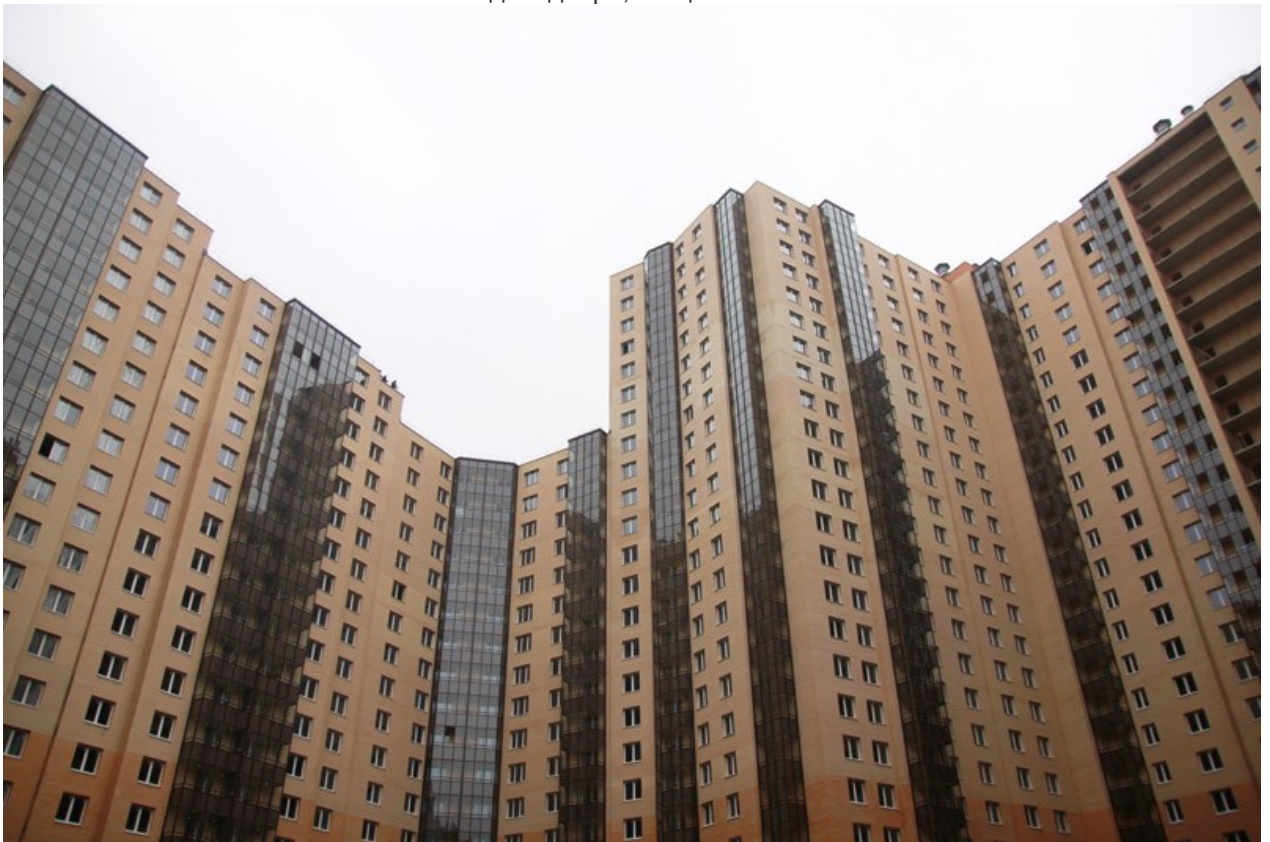
Вид со двора, секции 20-25