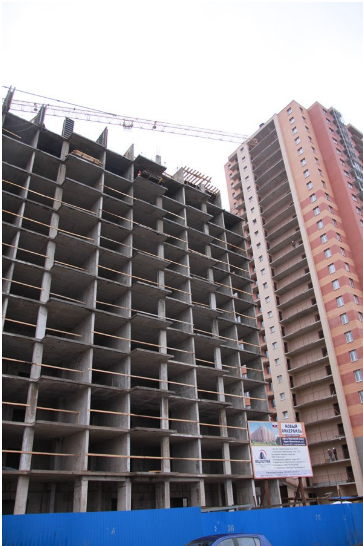
Вид на секции 1-2 с ул. Областная