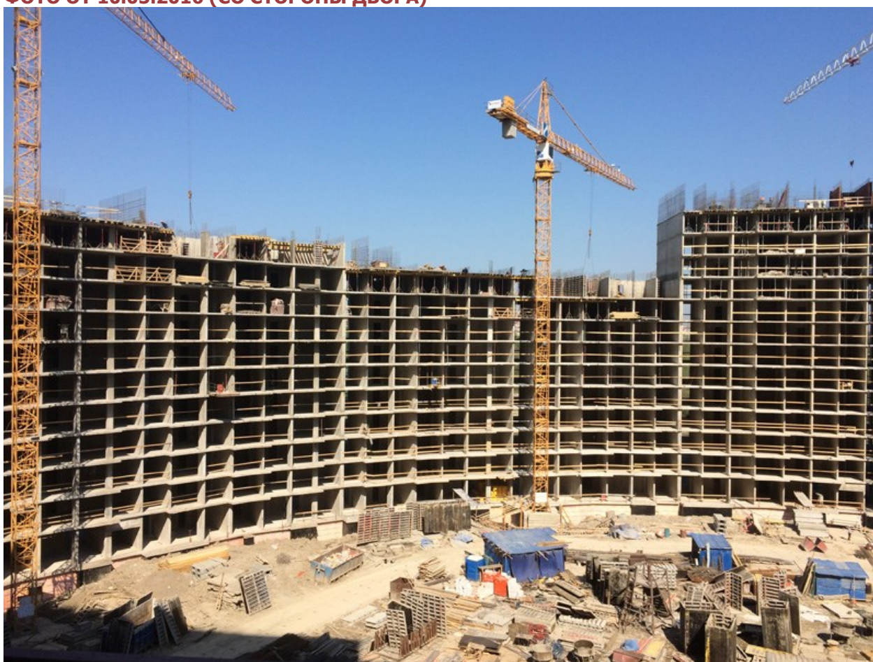
ФОТО ОТ 10.05.2016 (СО СТОРОНЫ ДВОРА)