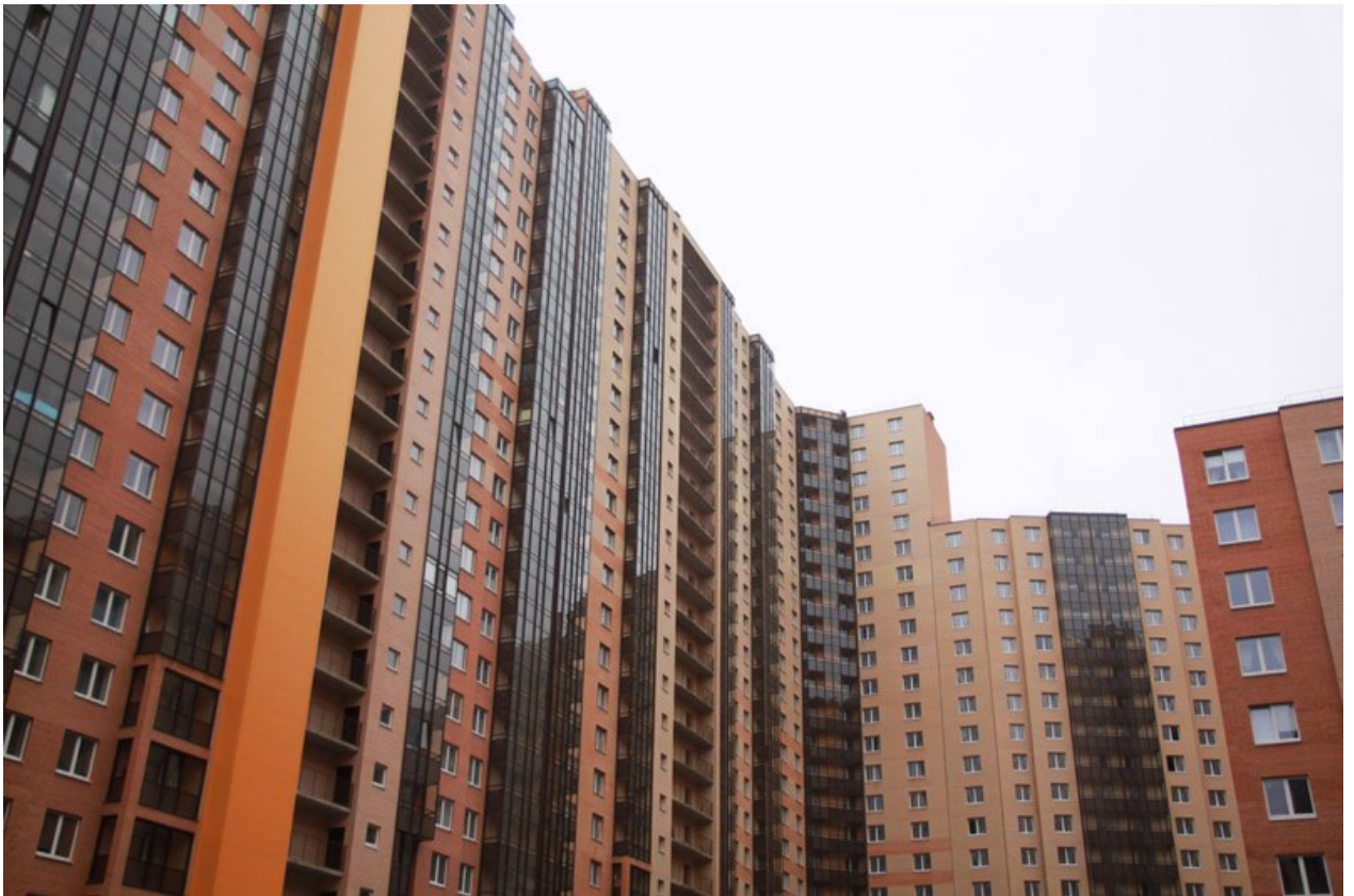
Вид со двора, секции 17-20