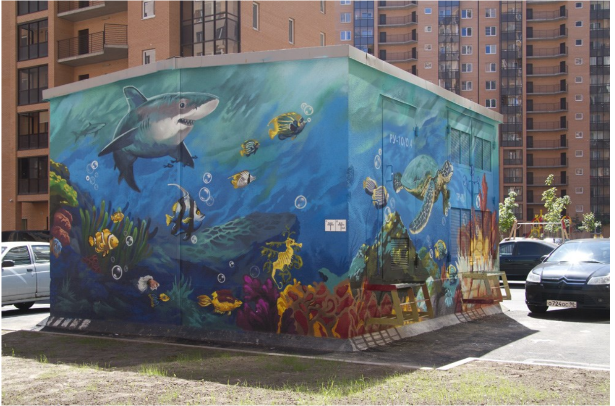
Новые арт-объекты во дворе 3-го пускa 3 очереди