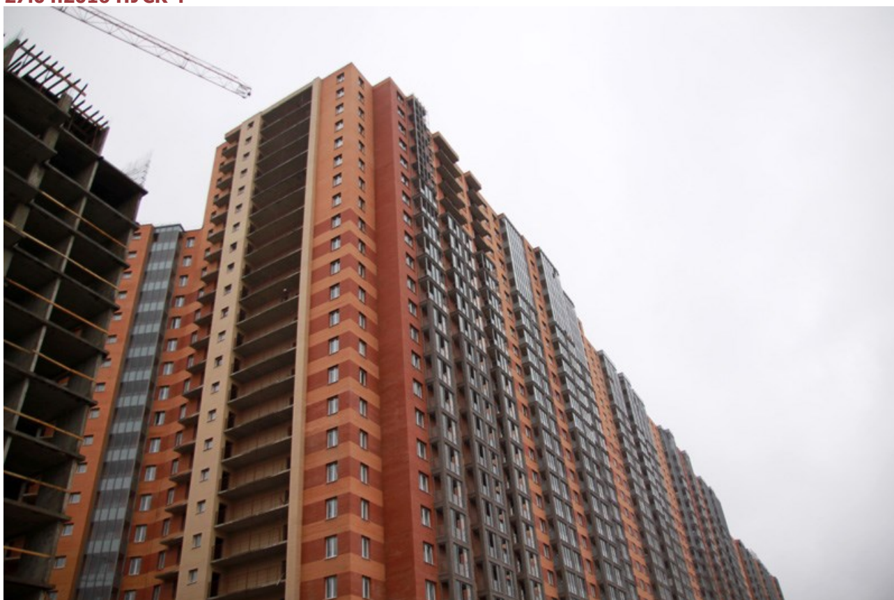
Вид со стороны Областной улицы, секции 17-15