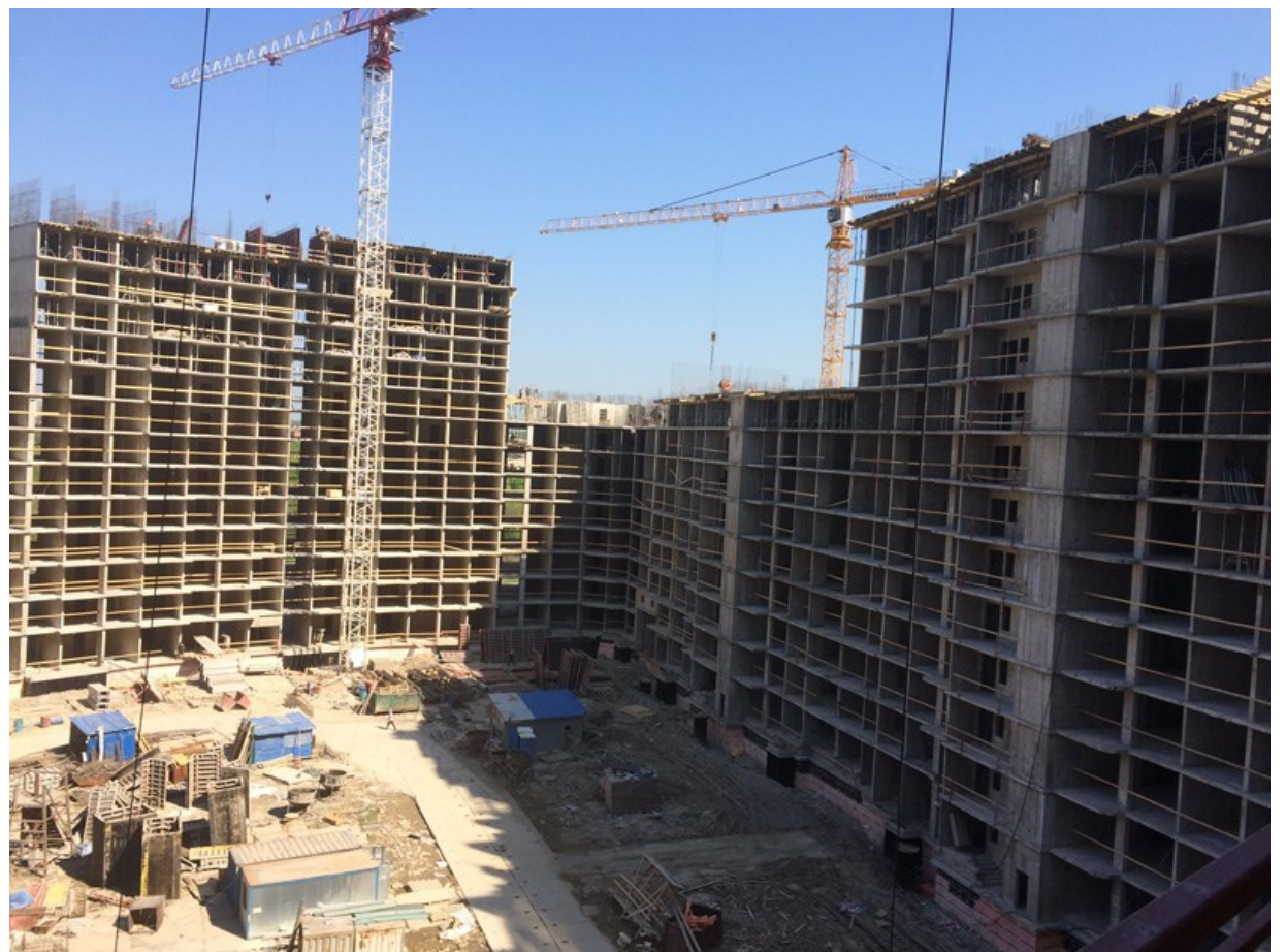
ФОТО ОТ 27.04.2016