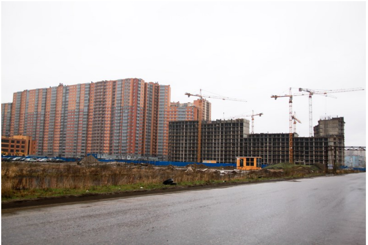
Вид с Областной улицы, секции 21-25