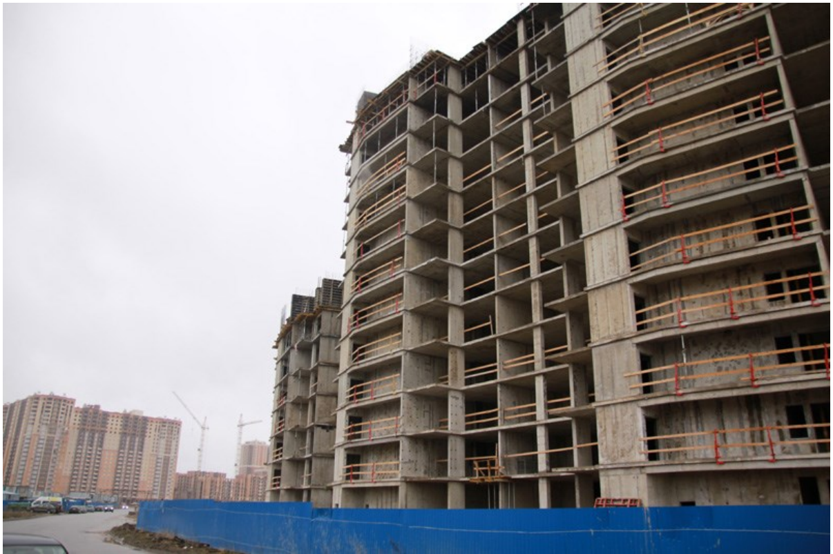
Вид на секции 8-6 с Областной ул.