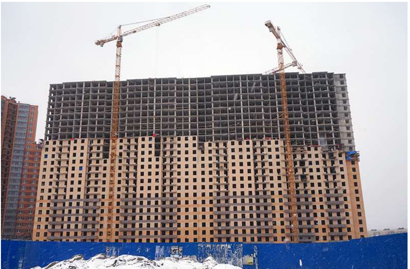
Вид на секции 11-8 со стороны Областной ул.