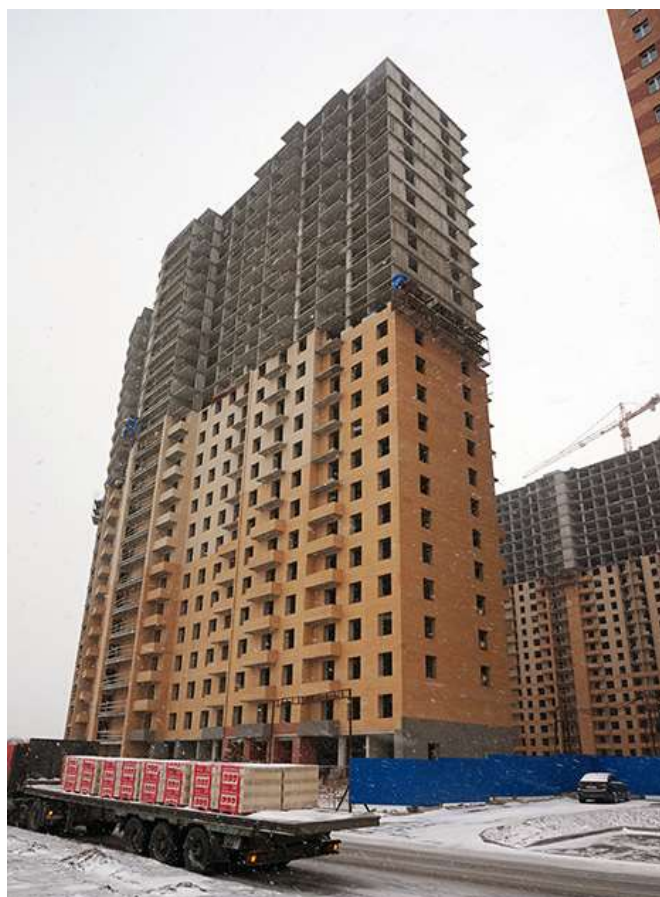
Вид на секции 2-1 и 9-10 с ул. Областная