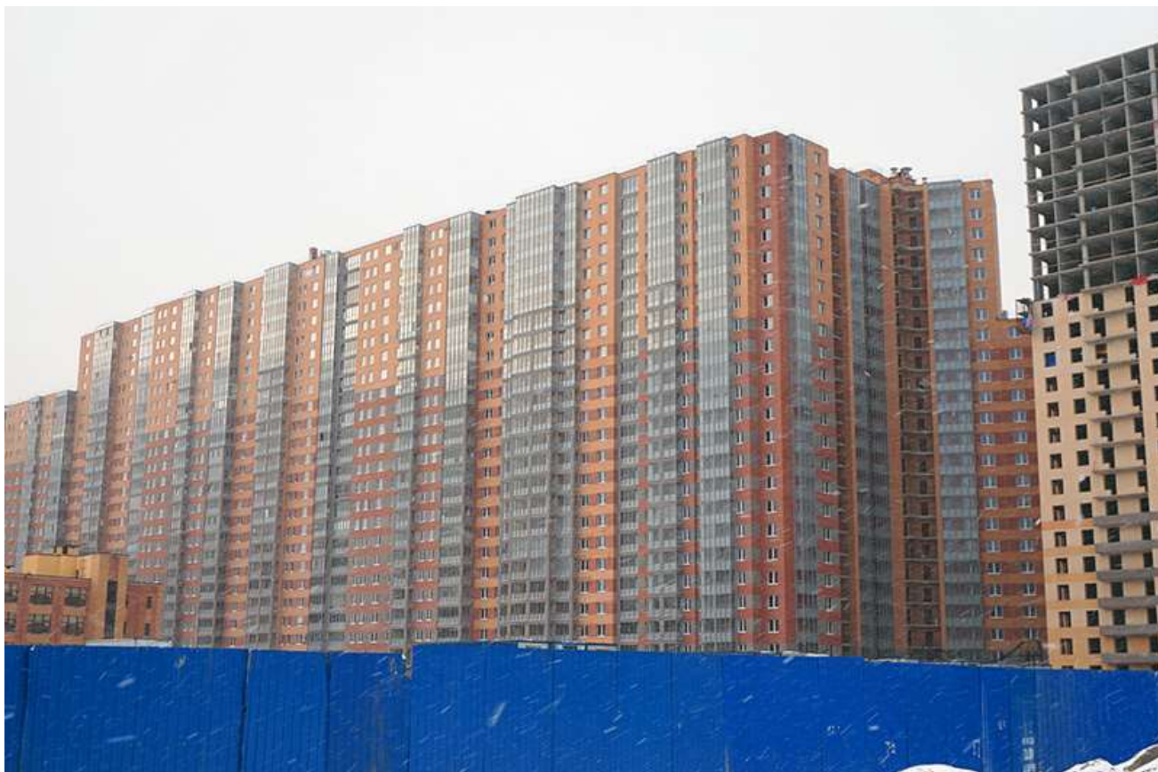
Вид с Областной улицы, секции 25-22