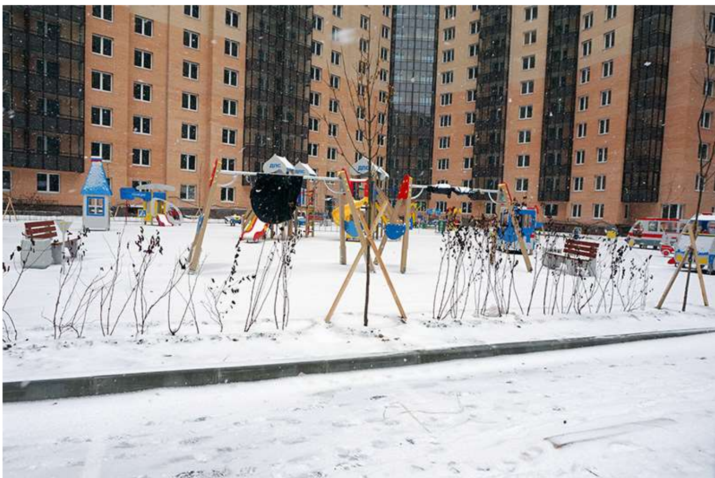
Детская площадка во дворе