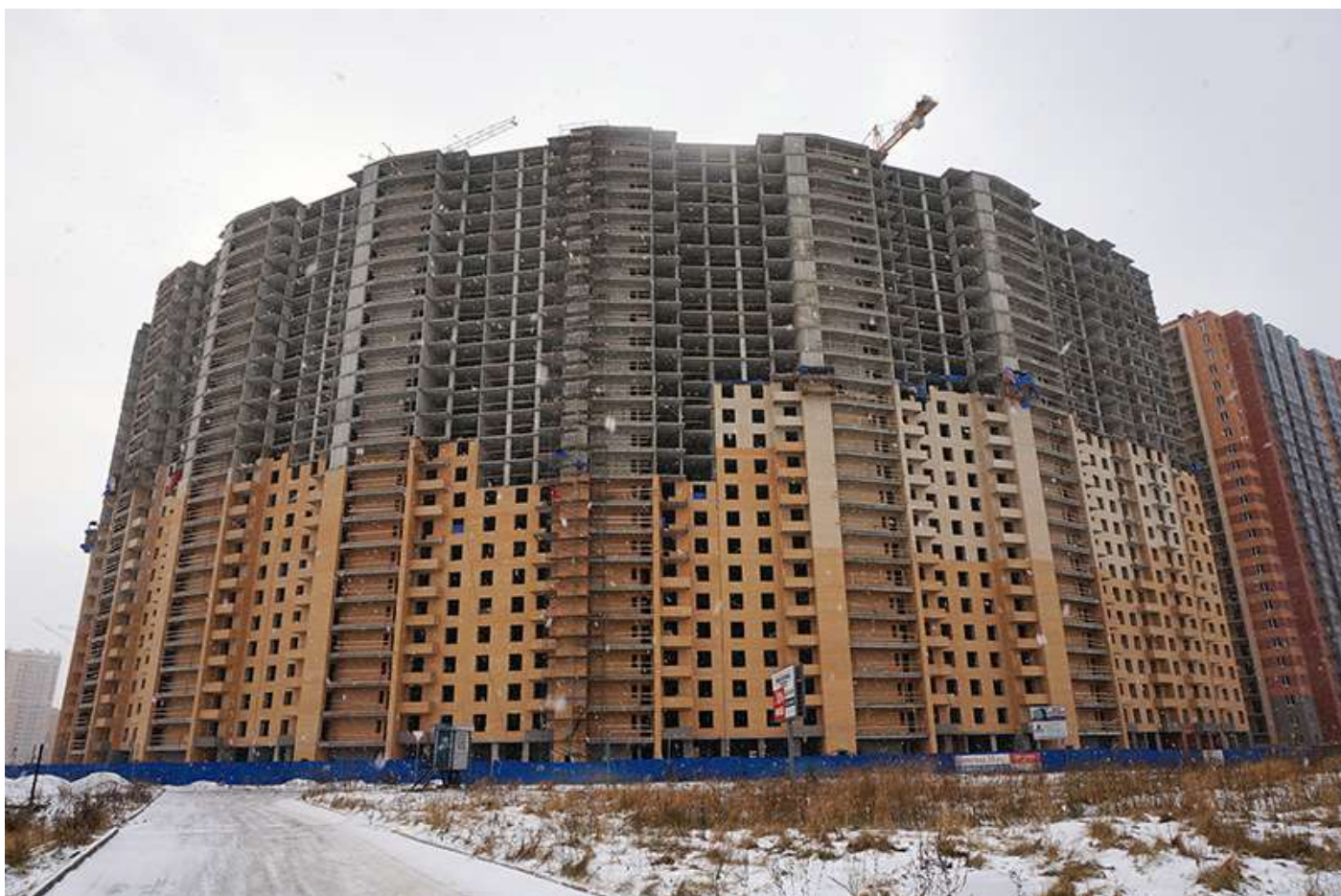
Вид на секции 7-1 с Областной ул.