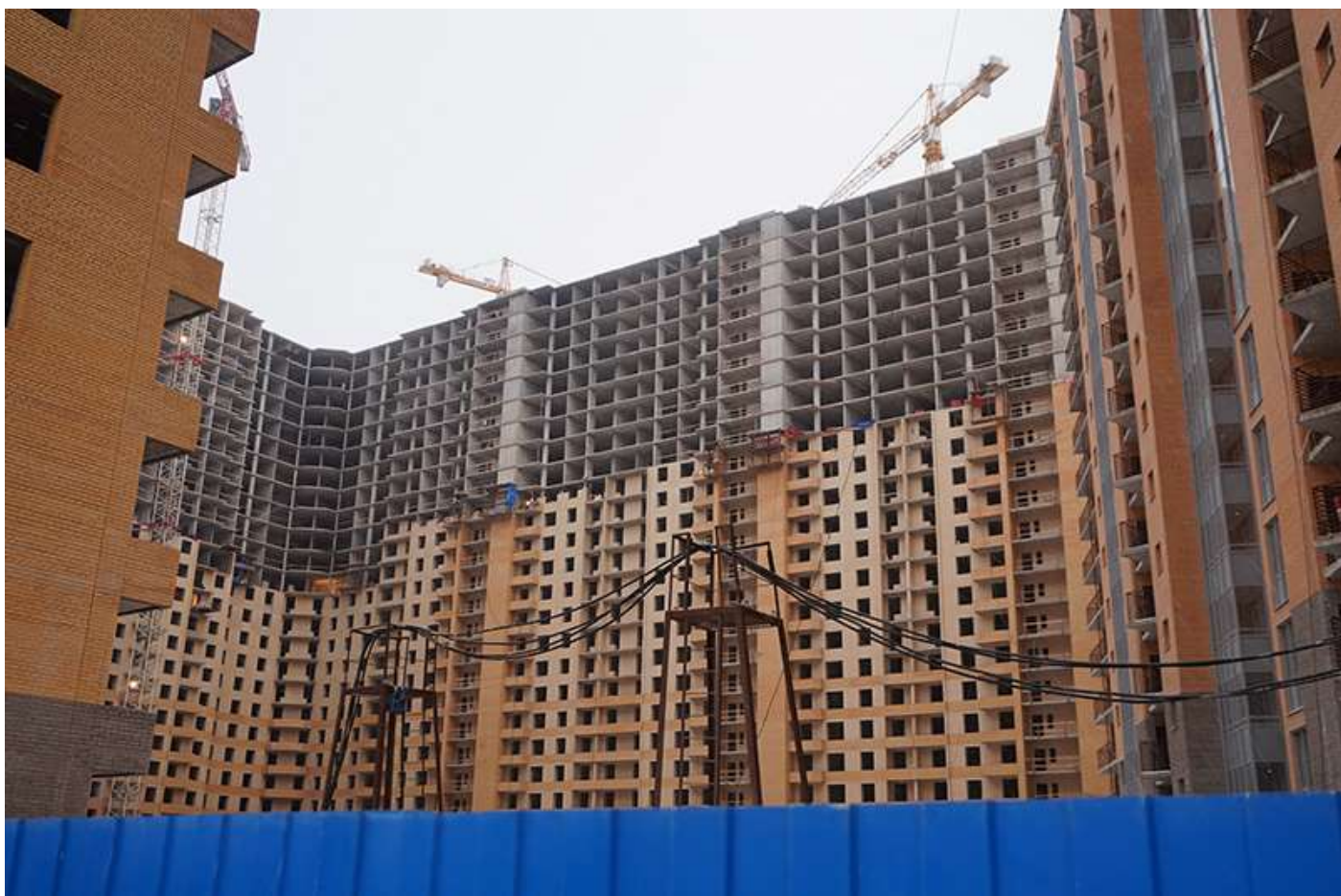
Вид на секции 7-11 с Областной ул.