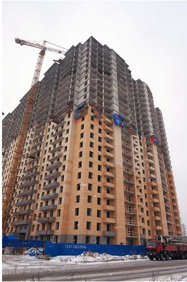
Вид на секции 9-6 с ул. Областная