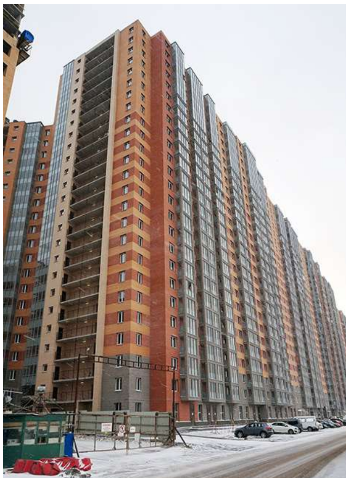
Вид со стороны Областной улицы, секции 20-15