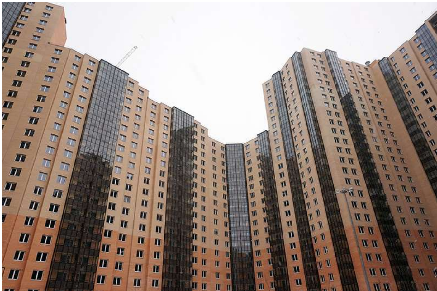
Вид со двора, секции 20-23