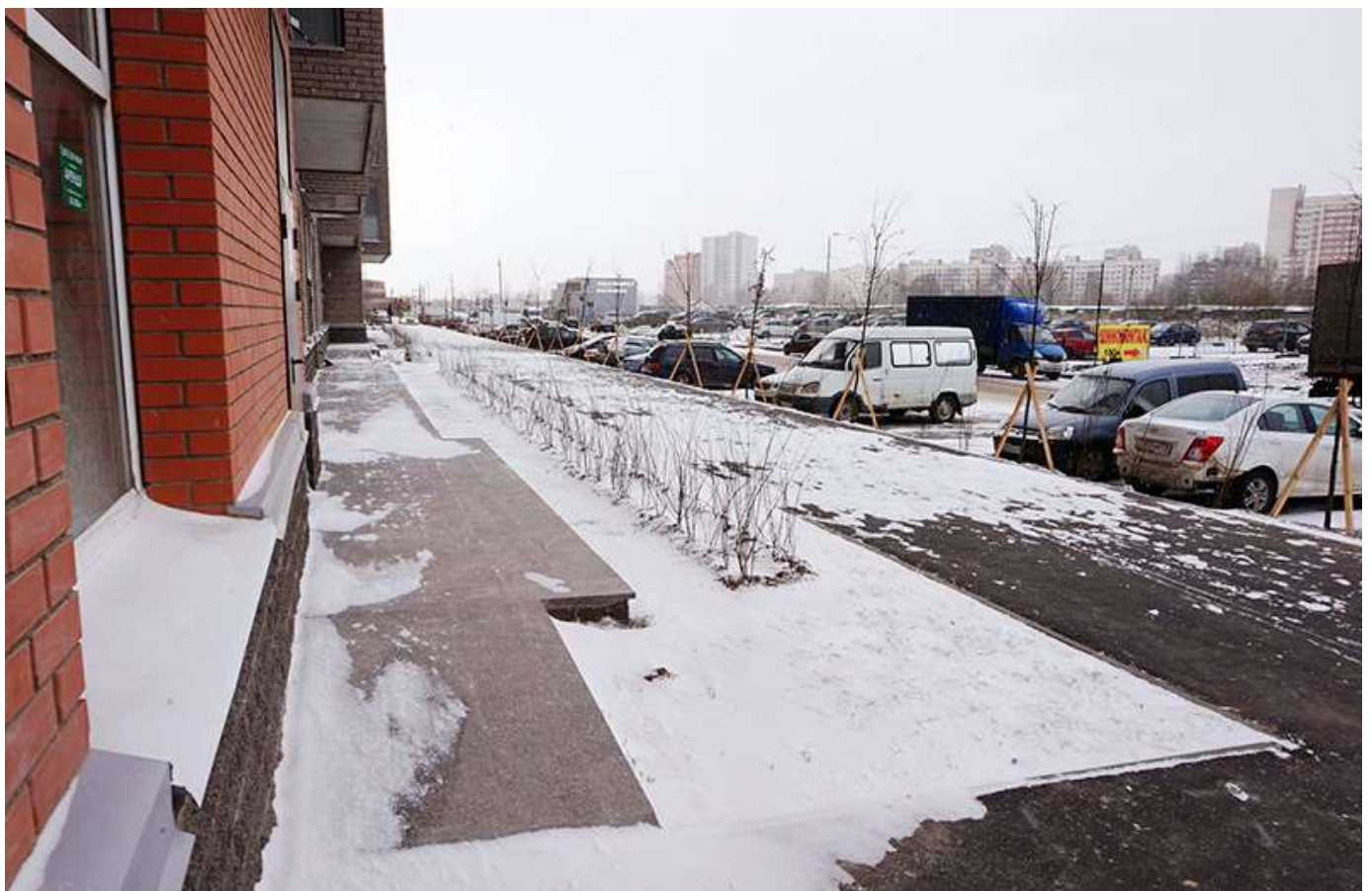
Вид со стороны Областной улицы, секции 19-18