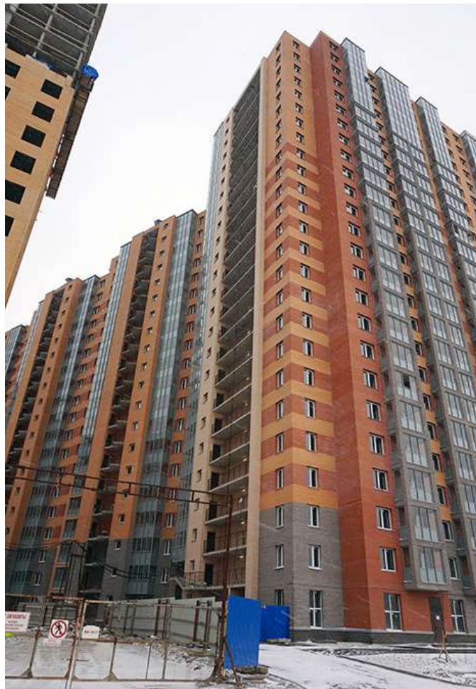
Вид со стороны Областной улицы, секции 22-19