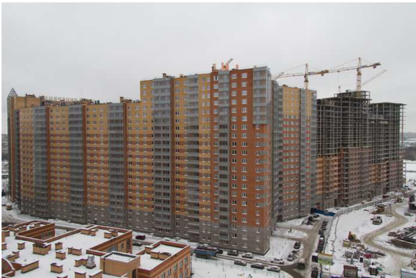
Вид со стороны школы, детского сада, спортивной площадки на секции 35-29 и секции 1-2 пусков