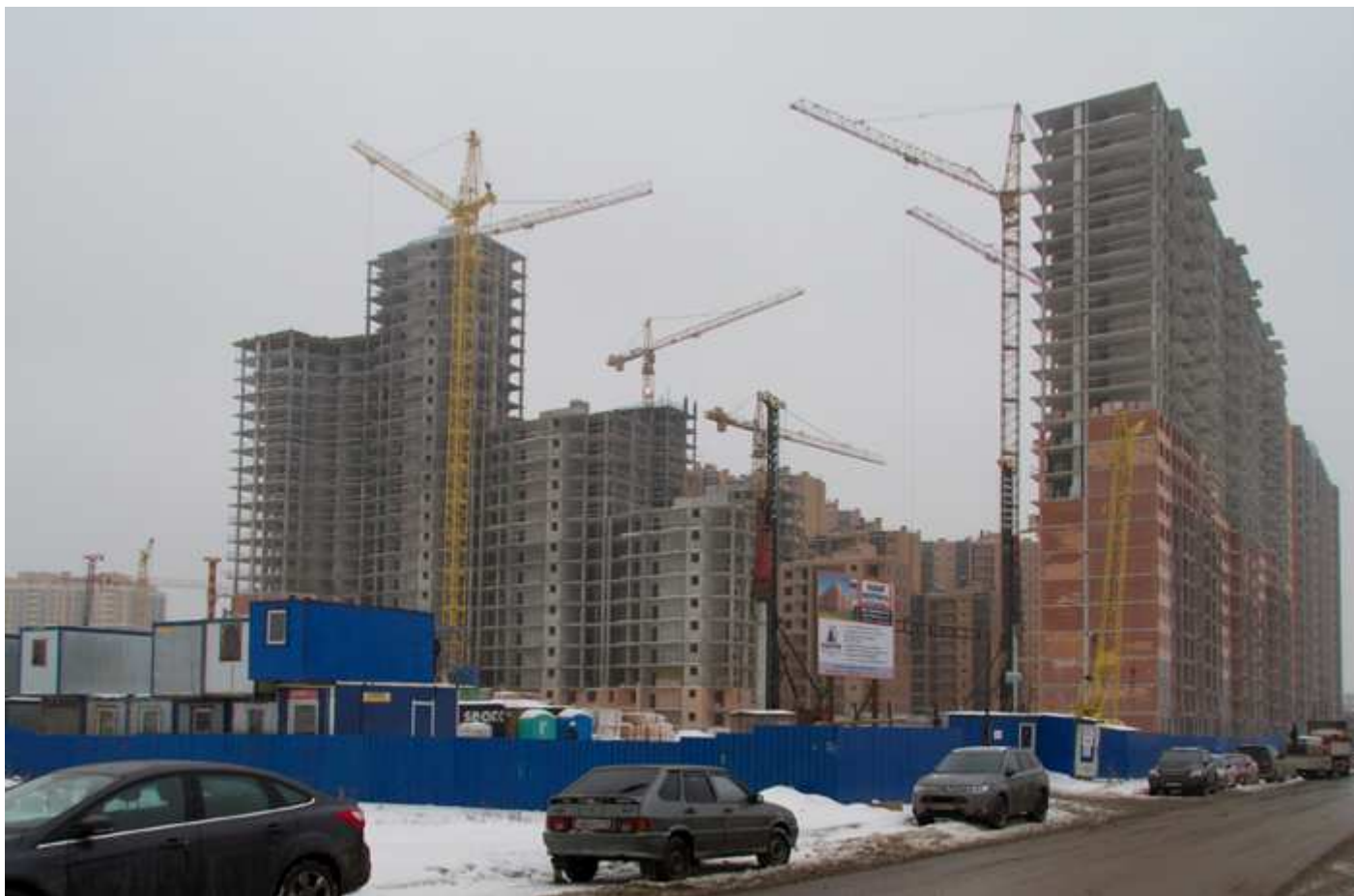
Вид со стороны Областной улицы 29-26, 31, 17-15