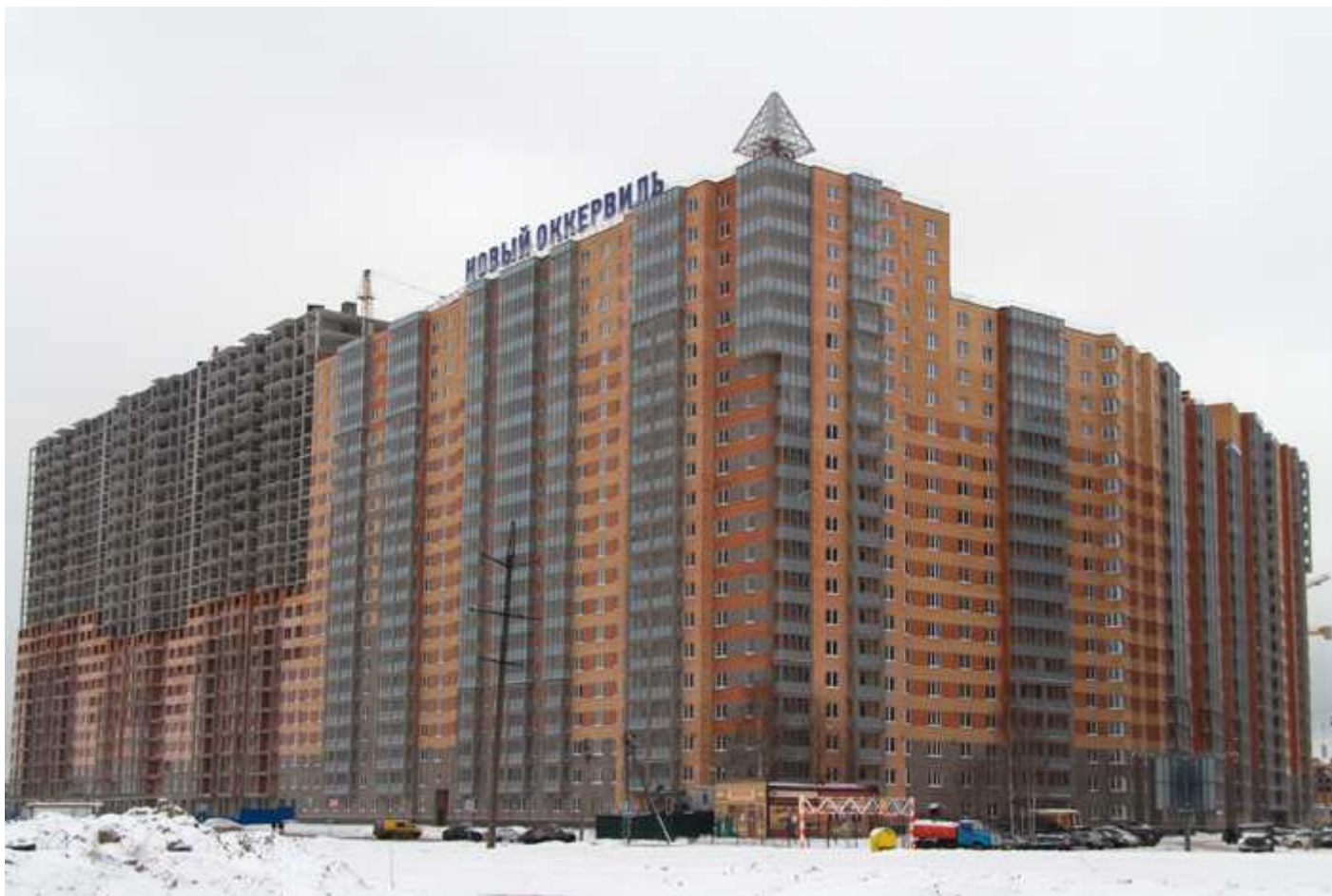
Вид с Областной улицы на секции (слева направо) 17-7