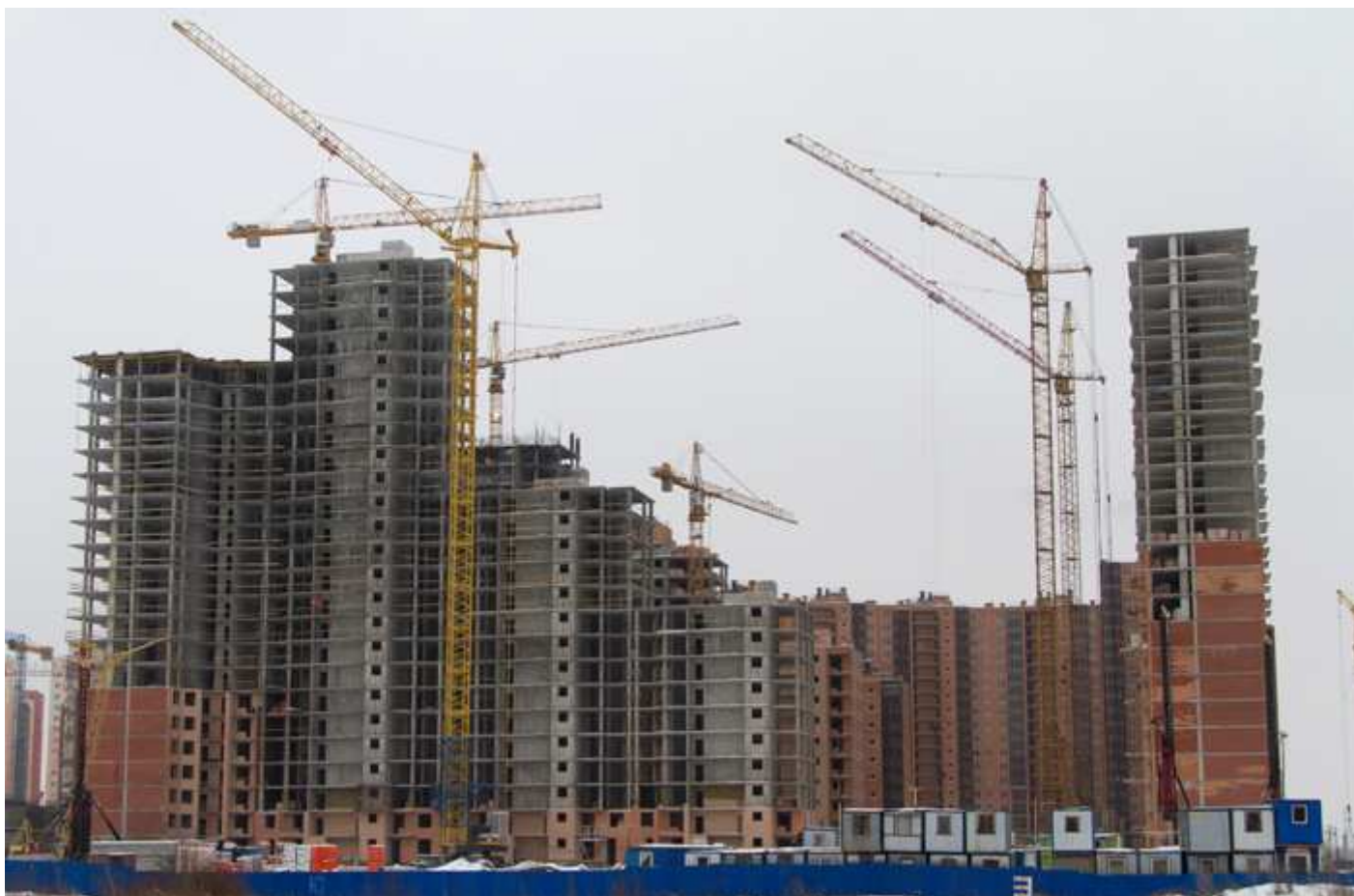
Вид с Областной улицы на секции 29-26, 15-17 со двора