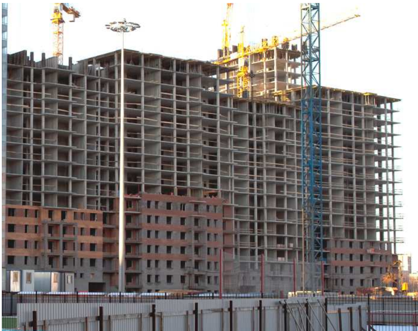
Вид со стороны школы и спортивной площадки на секции 35-29