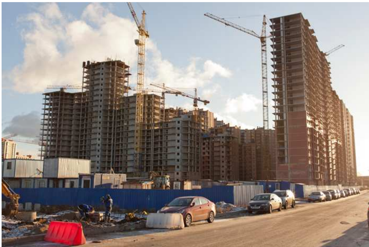
Вид со стороны Областной улицы 29-26, 31, 17-15