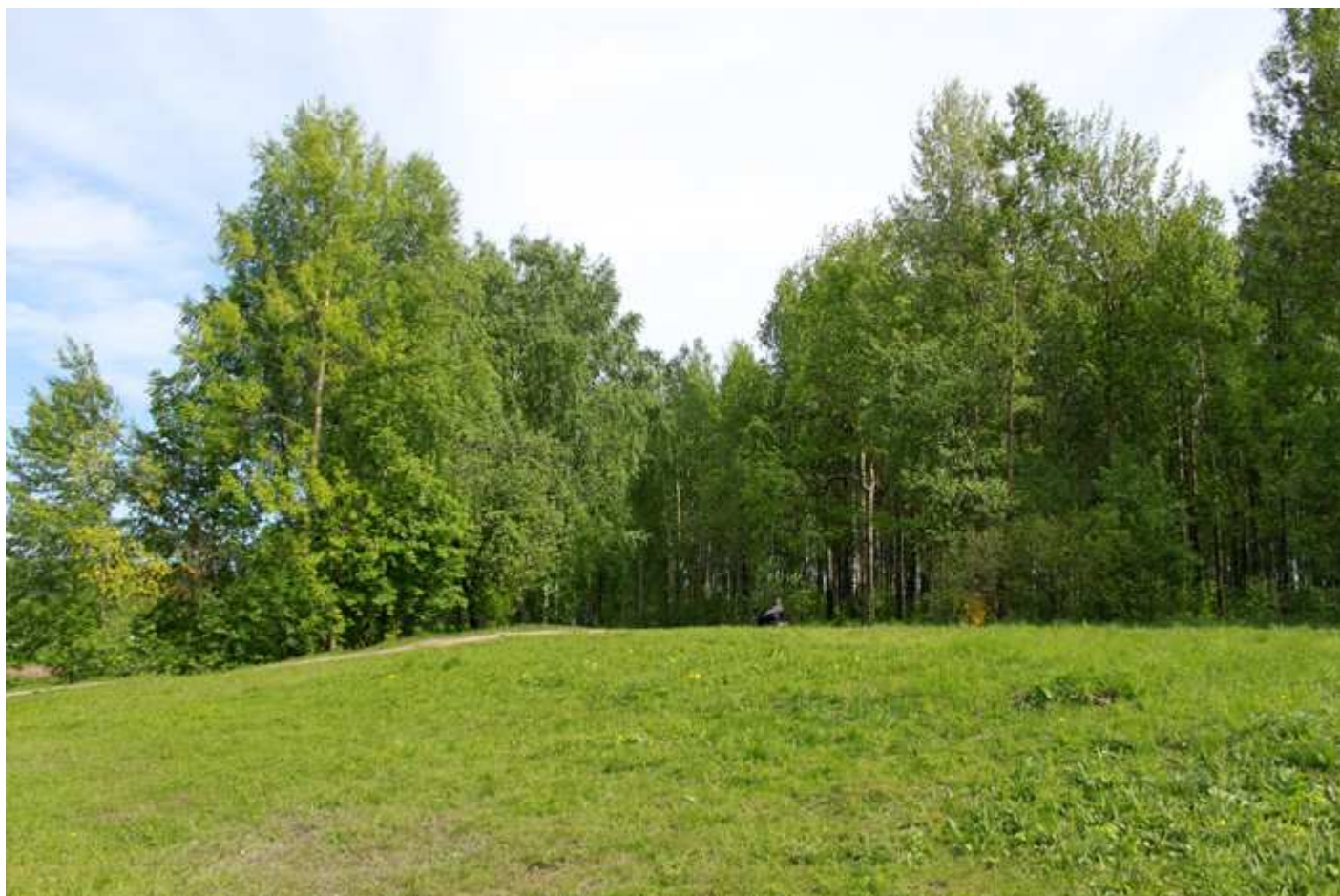
Парк Оккервиль зимой