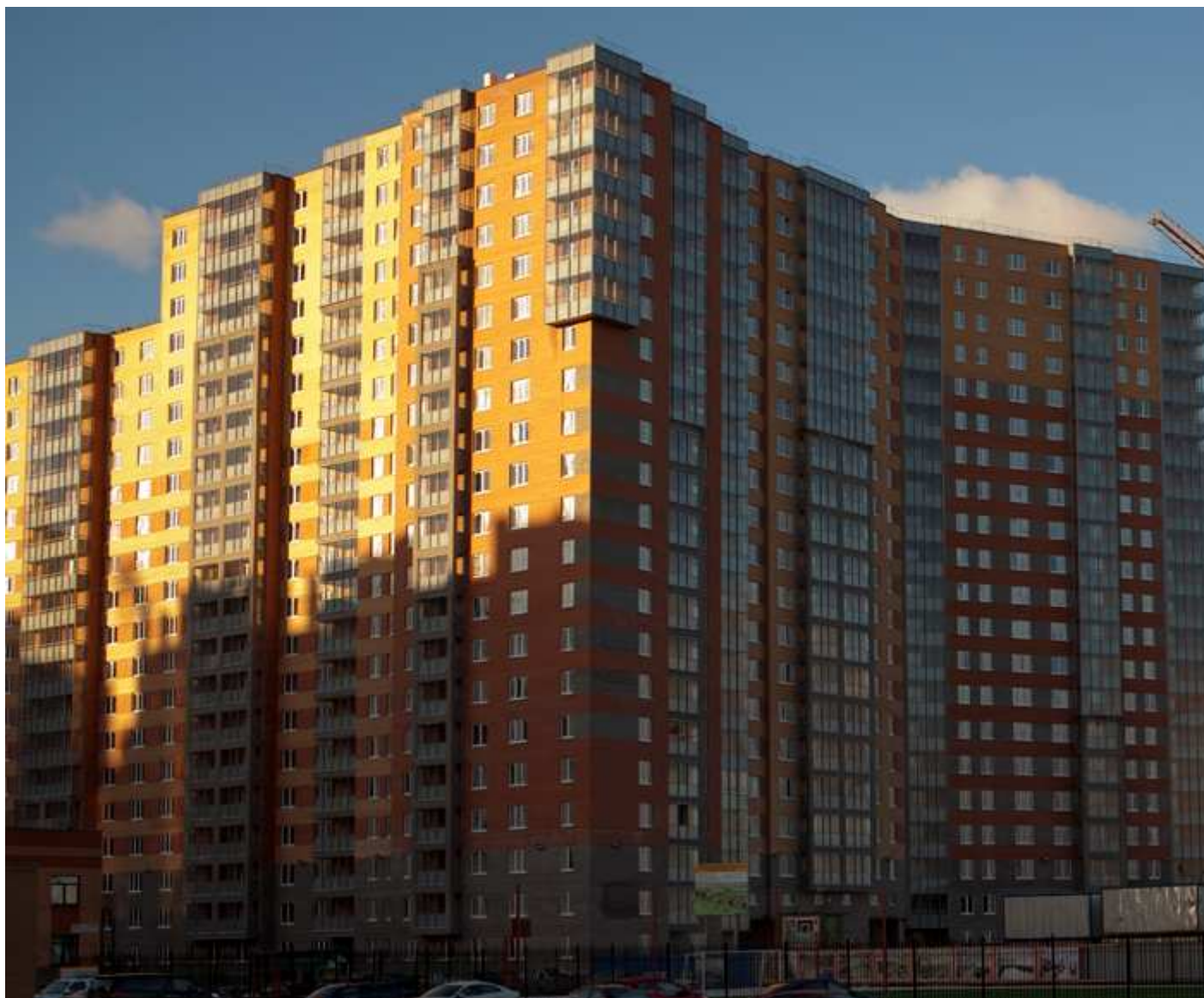
Вид со стороны детского сада на секции 10-4