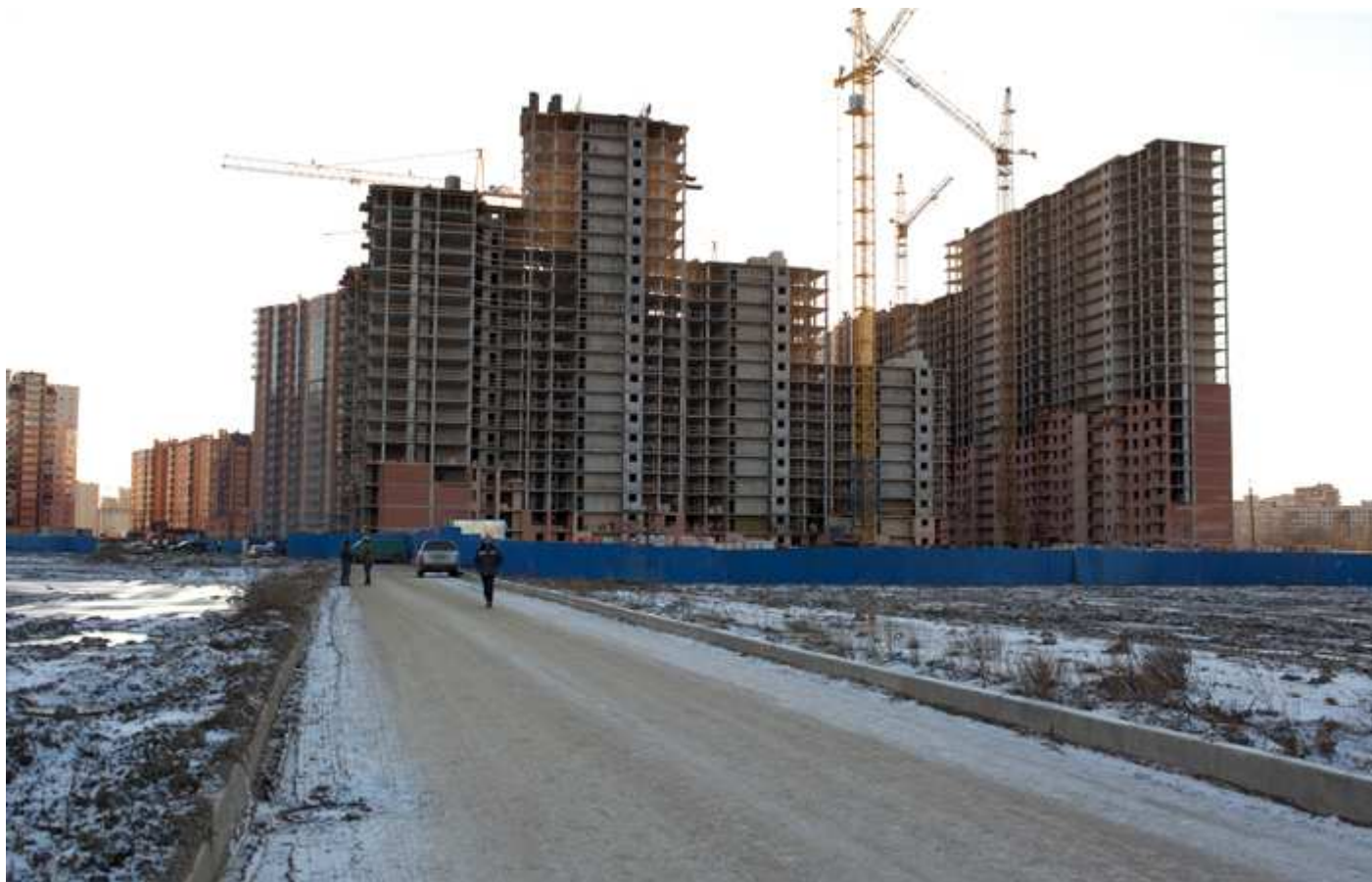
Вид с Областной улицы на секции 29-26, 15-17 со двора