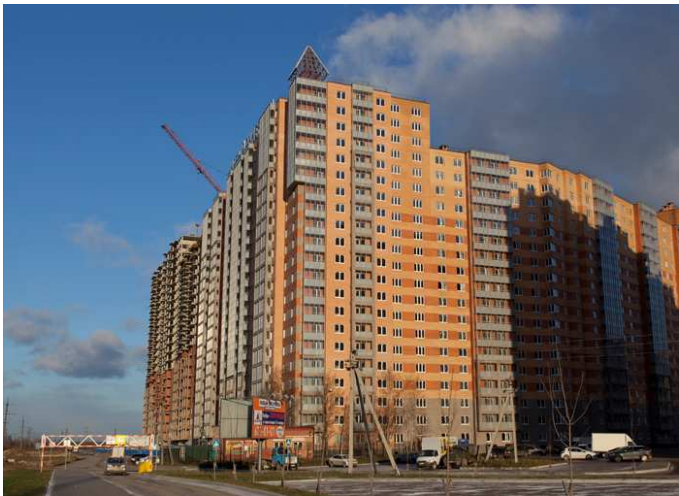
Вид с Областной улицы на секции (слева направо) 17-7