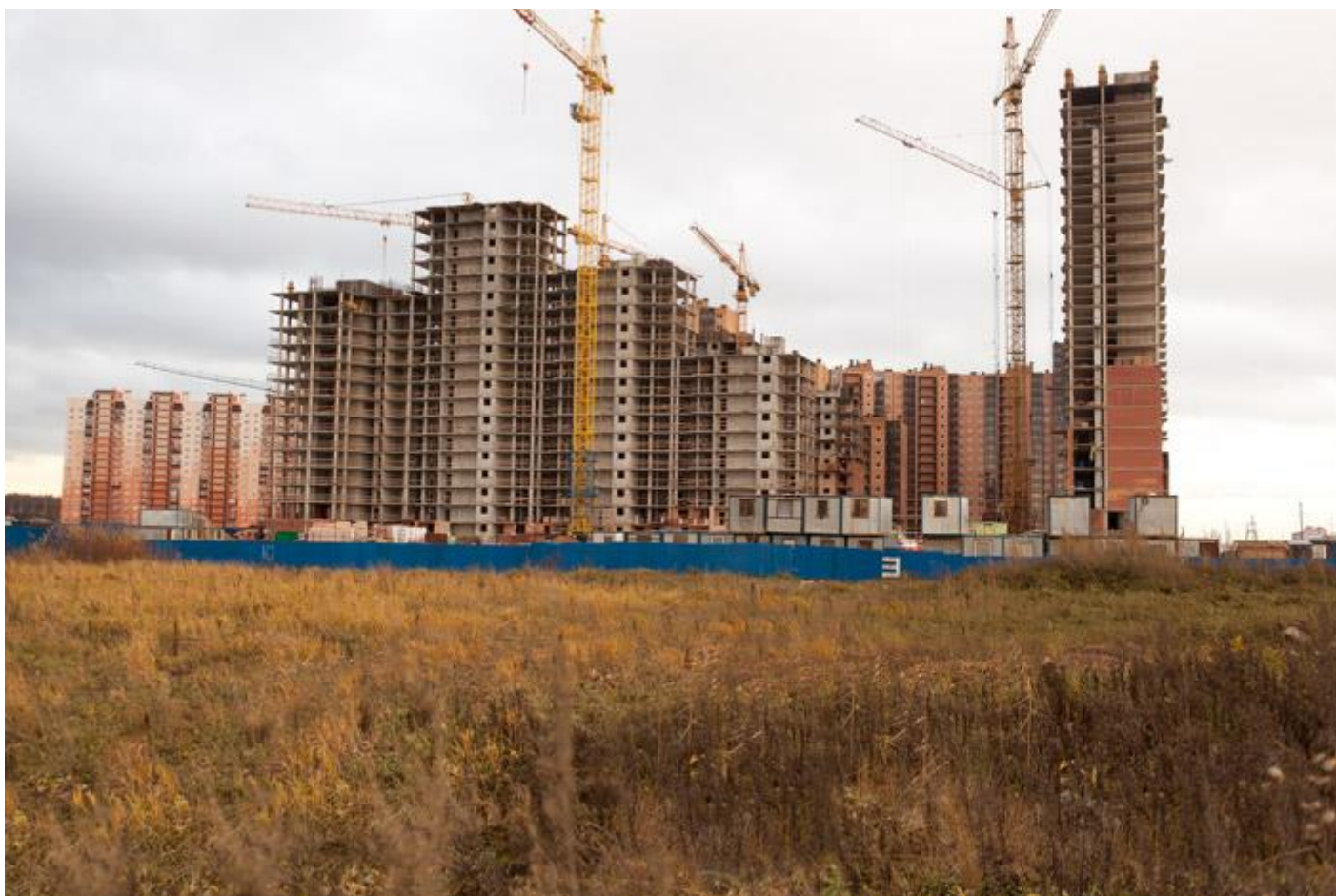
Вид с Областной улицы на секции 29-26, 31, 17