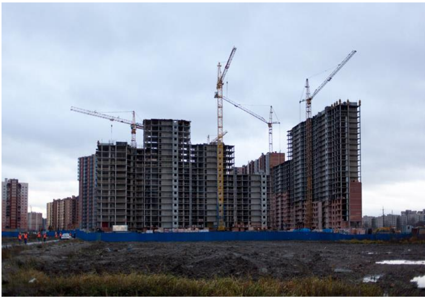
Вид с Областной улицы на секции 29-26, 15-17 со двора