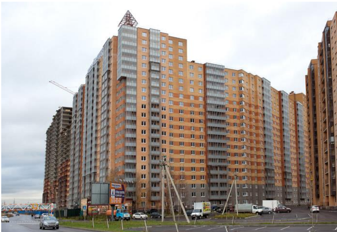
Вид с Областной улицы на секции (слева направо) 17-7