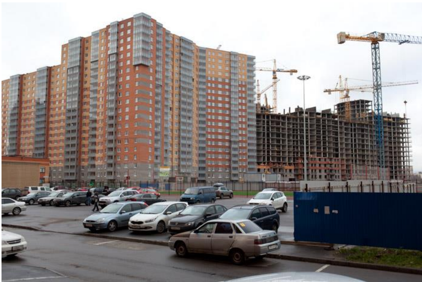
Вид со стороны школы и спортивной площадки на секции 10-4, 35-29