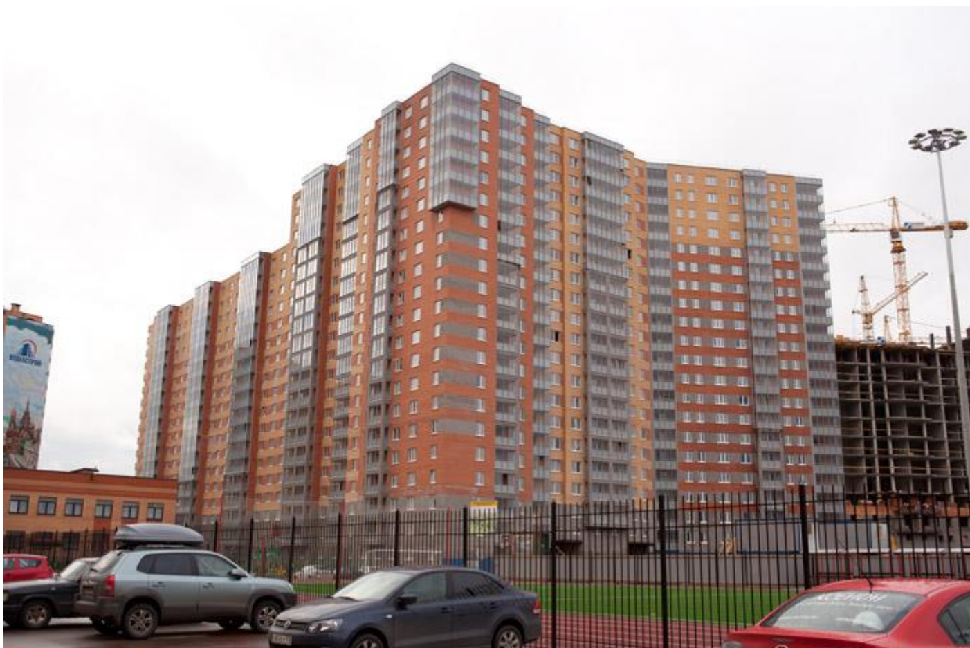
Вид со стороны детского сада на секции 10-6, 35