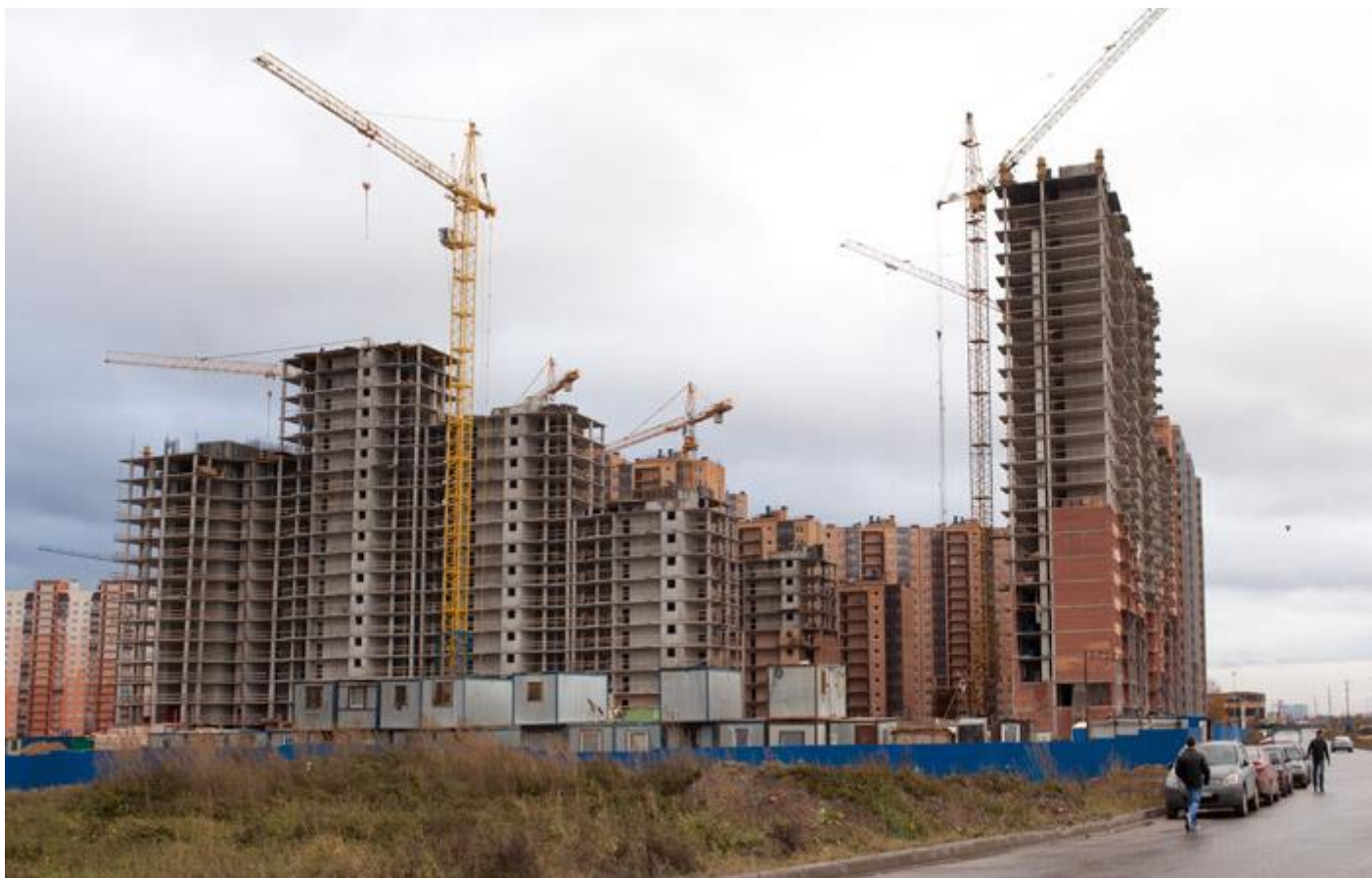
Вид со стороны Областной улицы 29-26, 31, 17-15