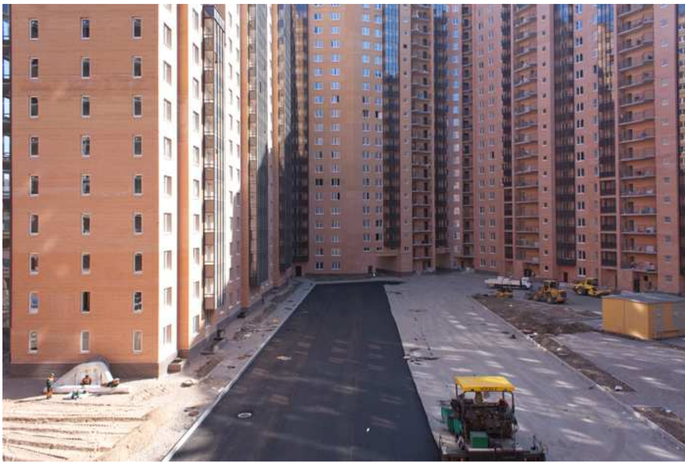
Вид со двора на секции 1-8, ведутся работы по благоустройству