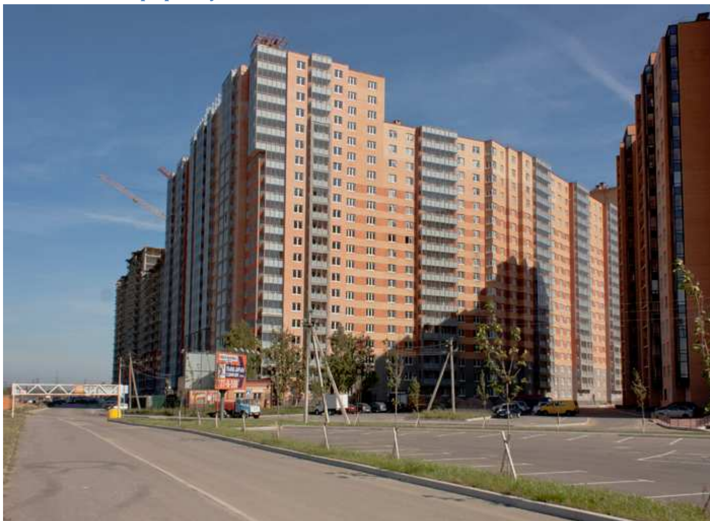
Вид с Областной улицы на секции с 14 по 8 (слева направо)