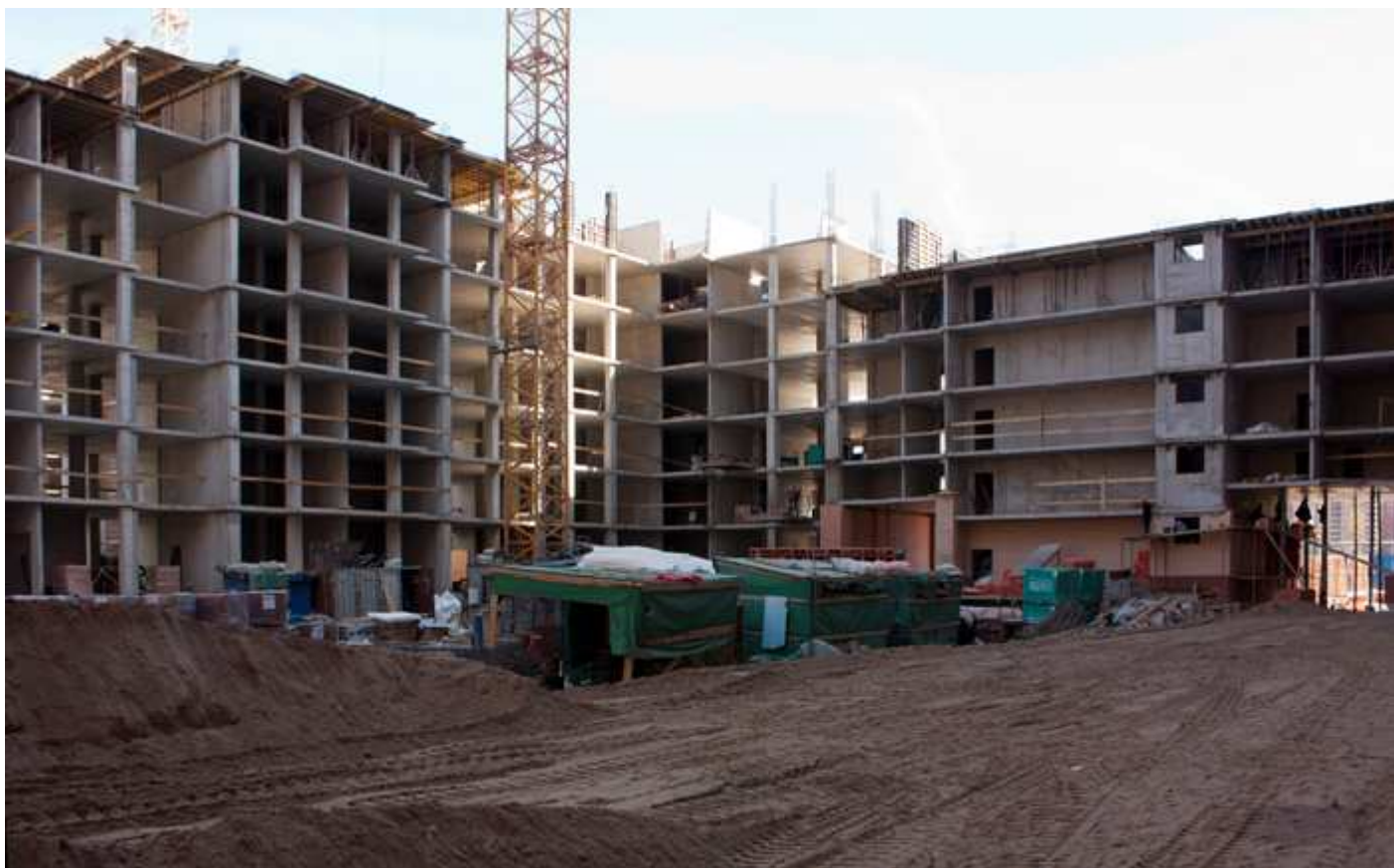
Секции 33-35 со двора