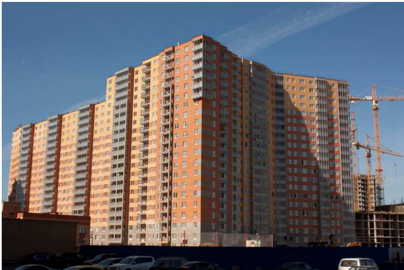
Вид на секции 10-4 со стороны первой очереди "Нового Оккервиля"