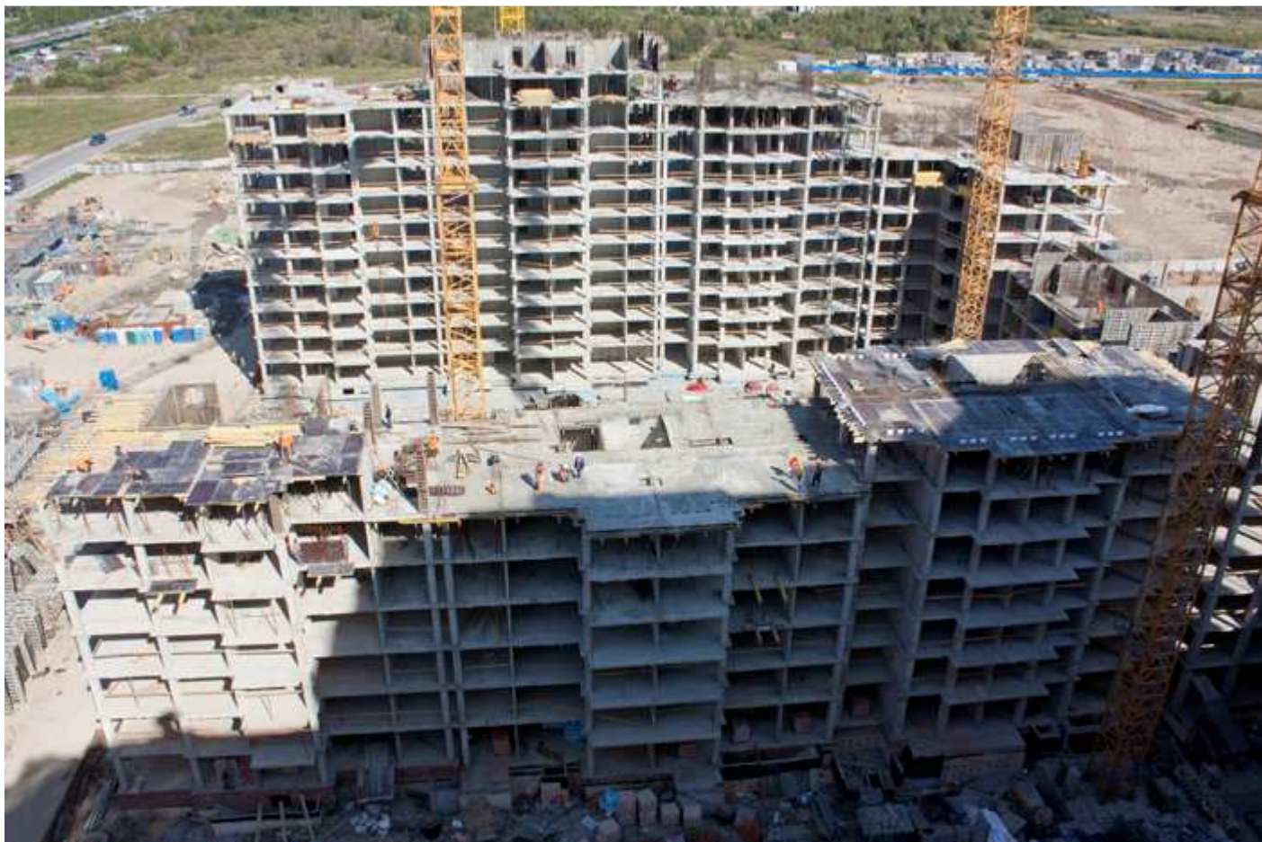
Секции 26-33 со двора