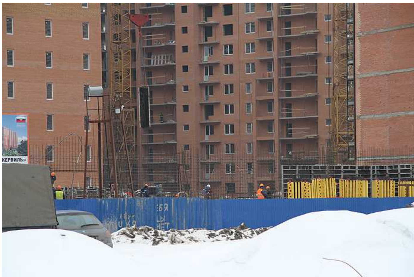
Вид со стороны Областной ул., секция 15