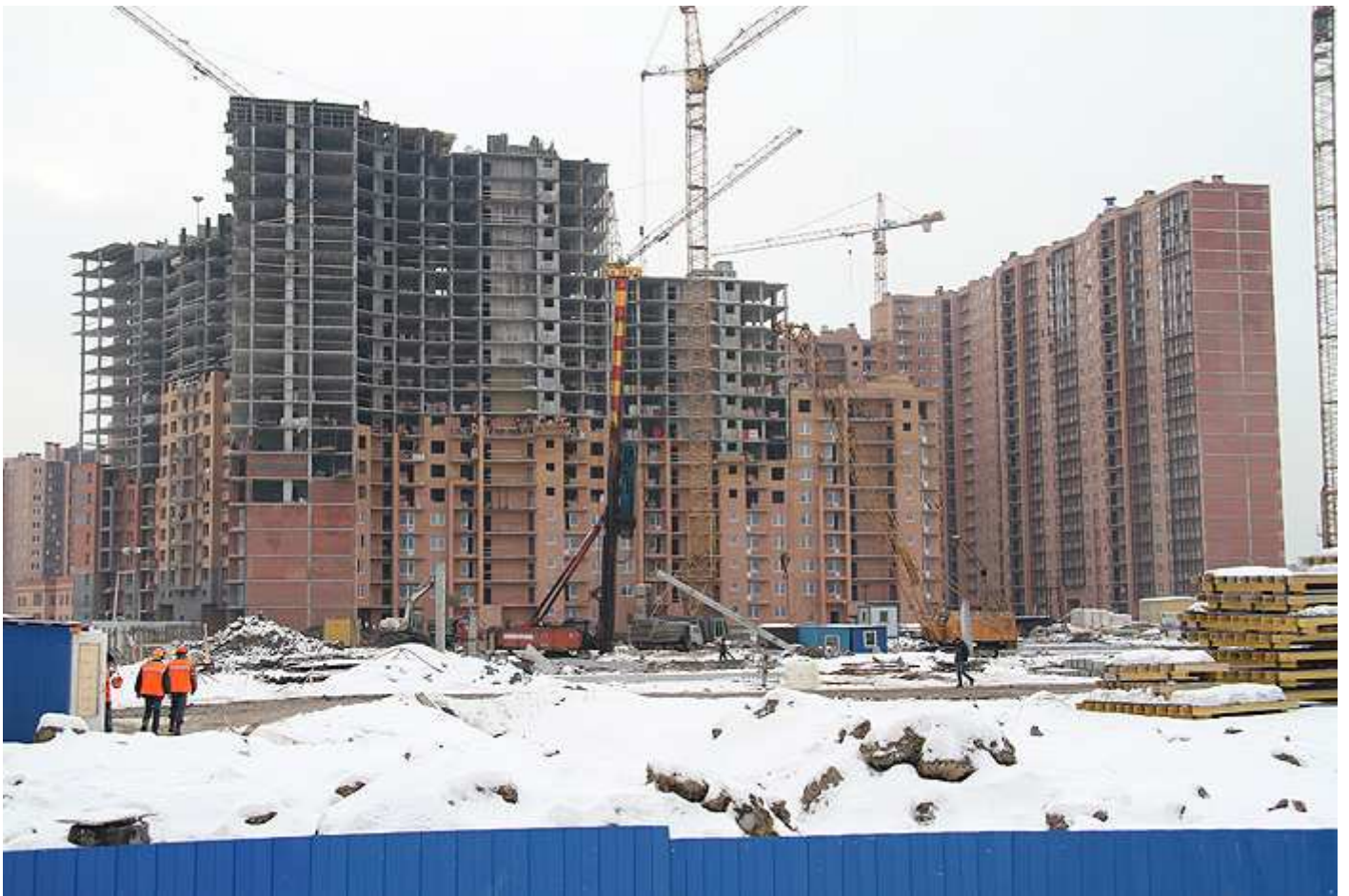
Вид на секции (слева направо) 6, 5, 4 (угловая), 3, 2, 1, 12, 13 и 14 со двора