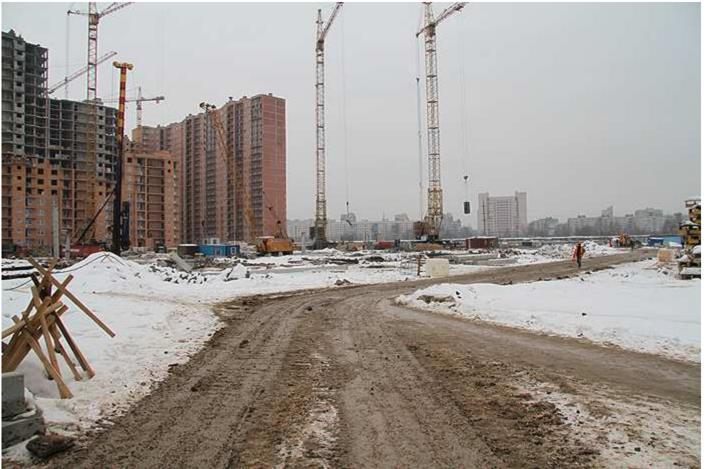
Строительная площадка III пуска, краны работают на 15-17 секциях, сваезабивочные машины на 31-35 секциях