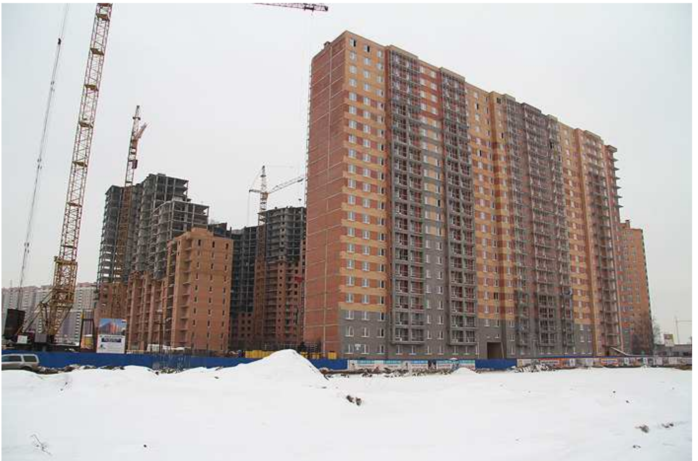
Вид на секции 4-1, 6-7 со двора, 14-12 с Областной ул.