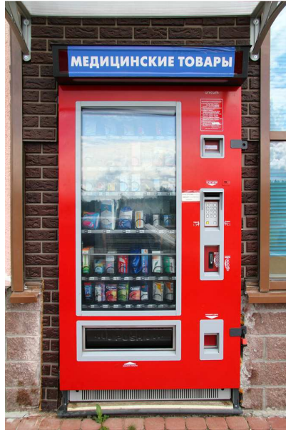
27.02.2013 Фотографии парка Оккервиль