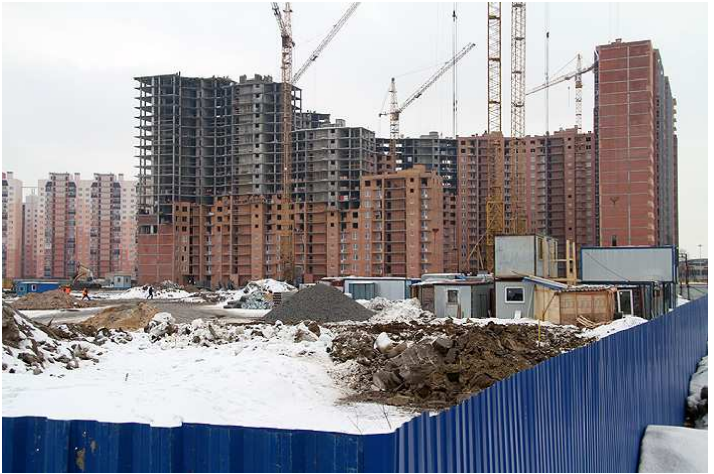
Вид на секции (слева направо) 4 , 3, 2, 1, 9, 10, 11, со двора и 14 с торца