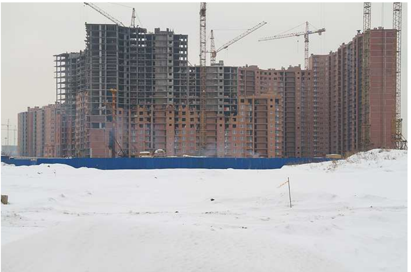
Вид на секции (слева направо) 6, 5, 4 (угловая), 3, 2, 1, 11, 12, 13 и 14 со двора