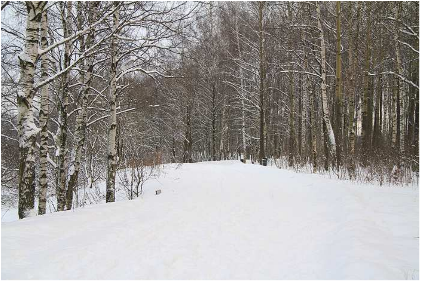
22.12.2011 Фотографии парка Оккервиль