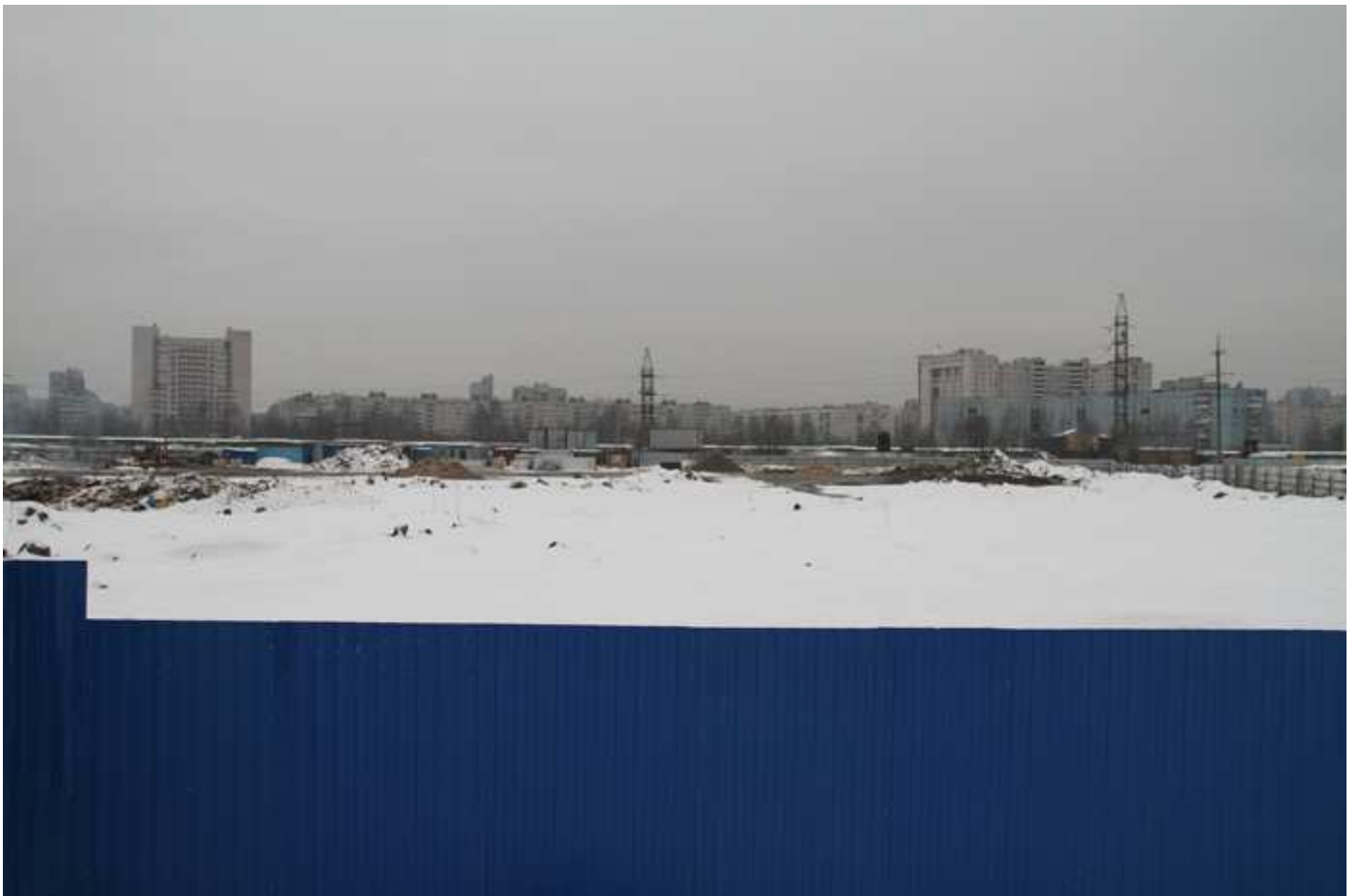
Территория строительной площадки III пуска, секции 26-30