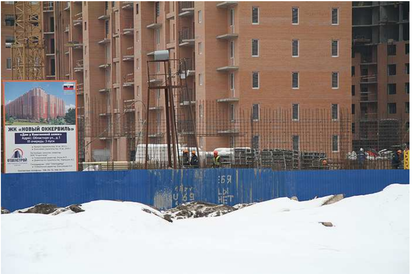
Вид со стороны Областной ул., секция 15