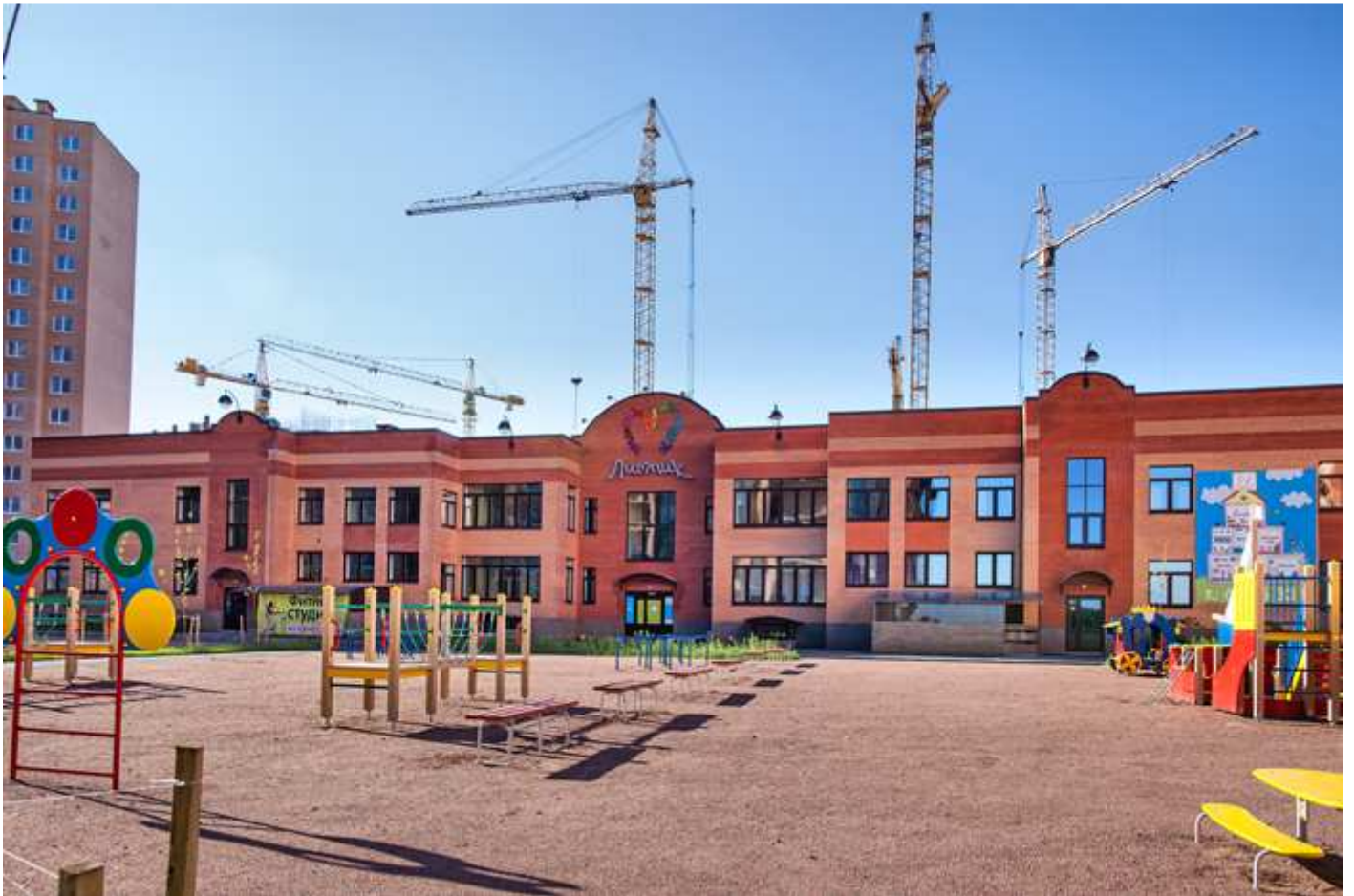
Спортивный комплекс. Фото от 26.12.2012