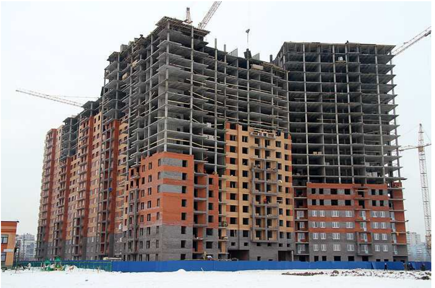
Вид на секции с 10 по 4 (посередине угловая 6 секция)