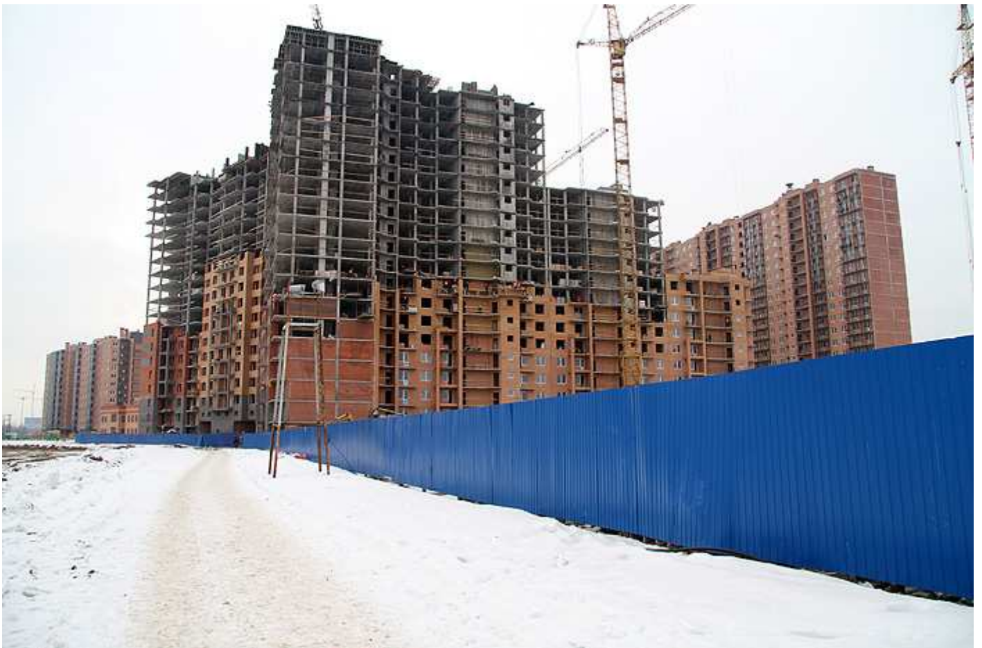
Вид на секции (слева направо) 6, 5, 4 (угловая), 3, 2, 1, 13 и 14 со двора