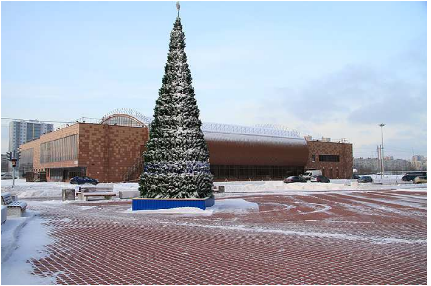
Спортивный комплекс. Фото от 19.11.2012