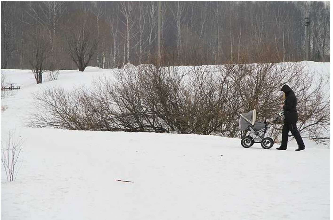
26.12.2012 Фотографии парка Оккервиль