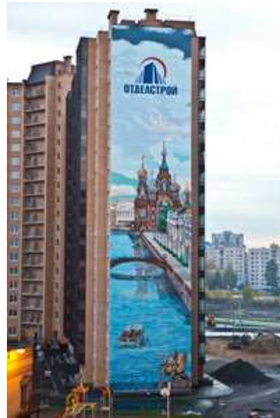
Фото в полном размере (2,26 Мб)