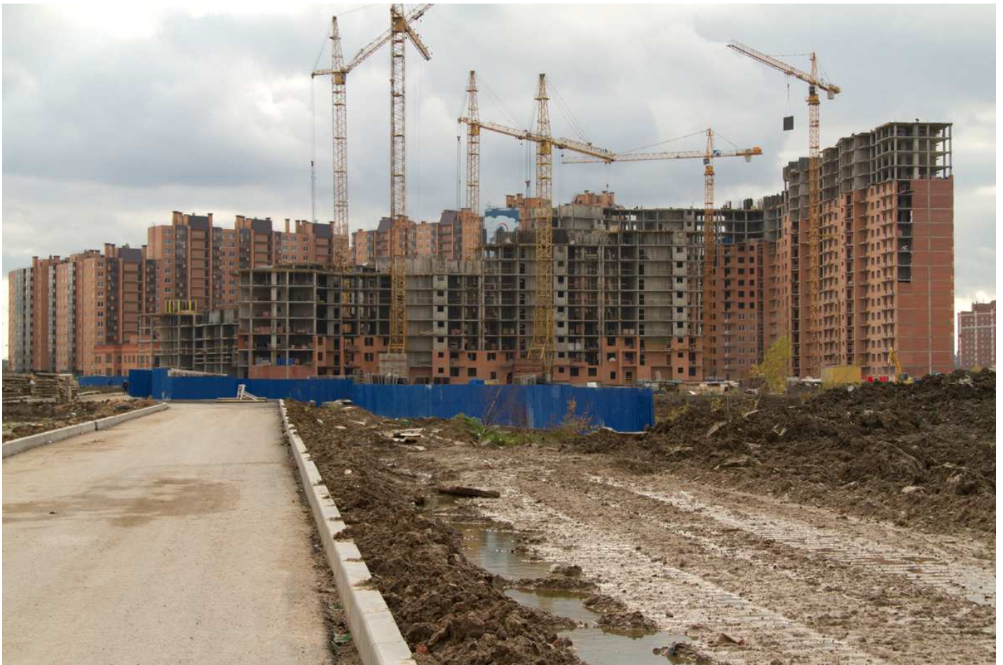
секции 4-1, 11-14