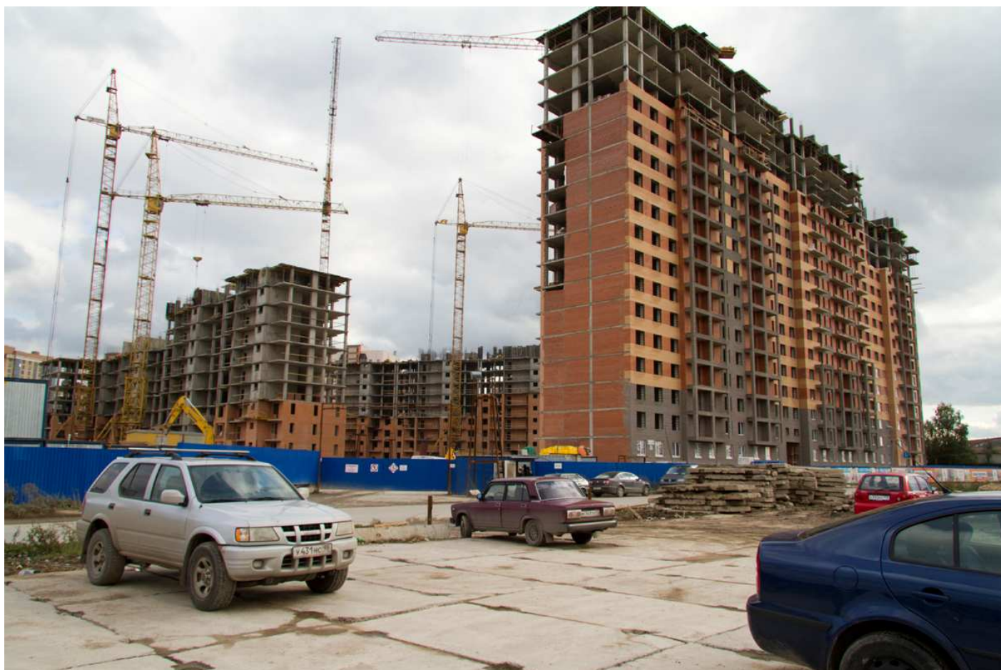
секции 4-1, 7-9, 14-12