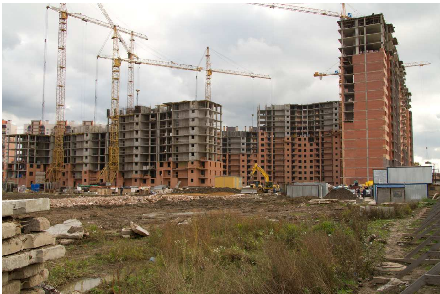
секции 4-1, 9-14