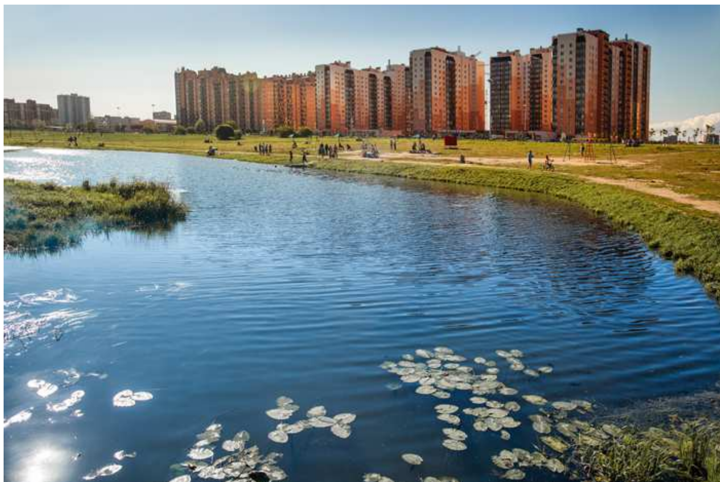
Парк с пешеходными и велодорожками. Фото от 22.07.2012