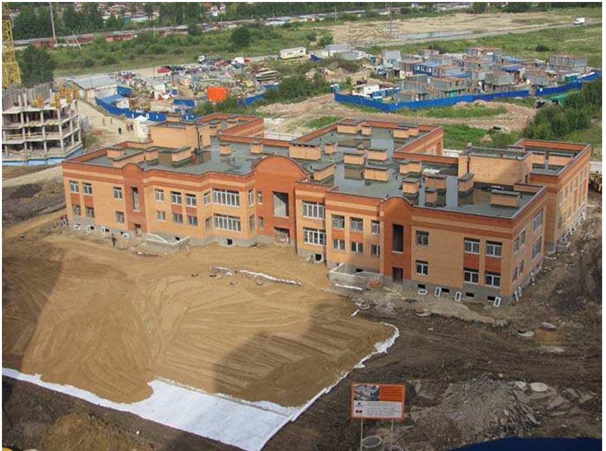
СПОРТИВНЫЙ КОМПЛЕКС 26.04.2011