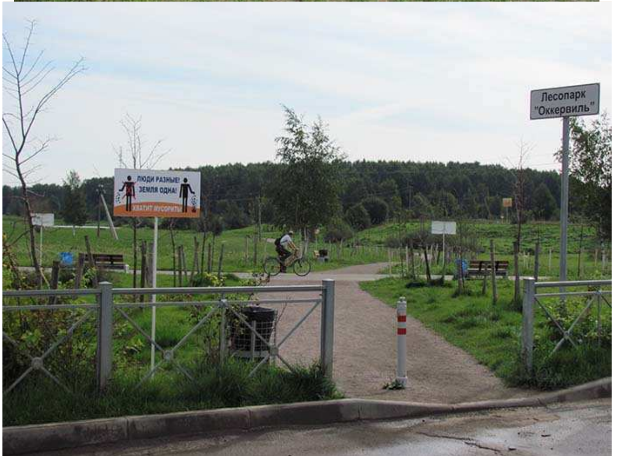
ДЕТСКИЙ САД 23.08.2011