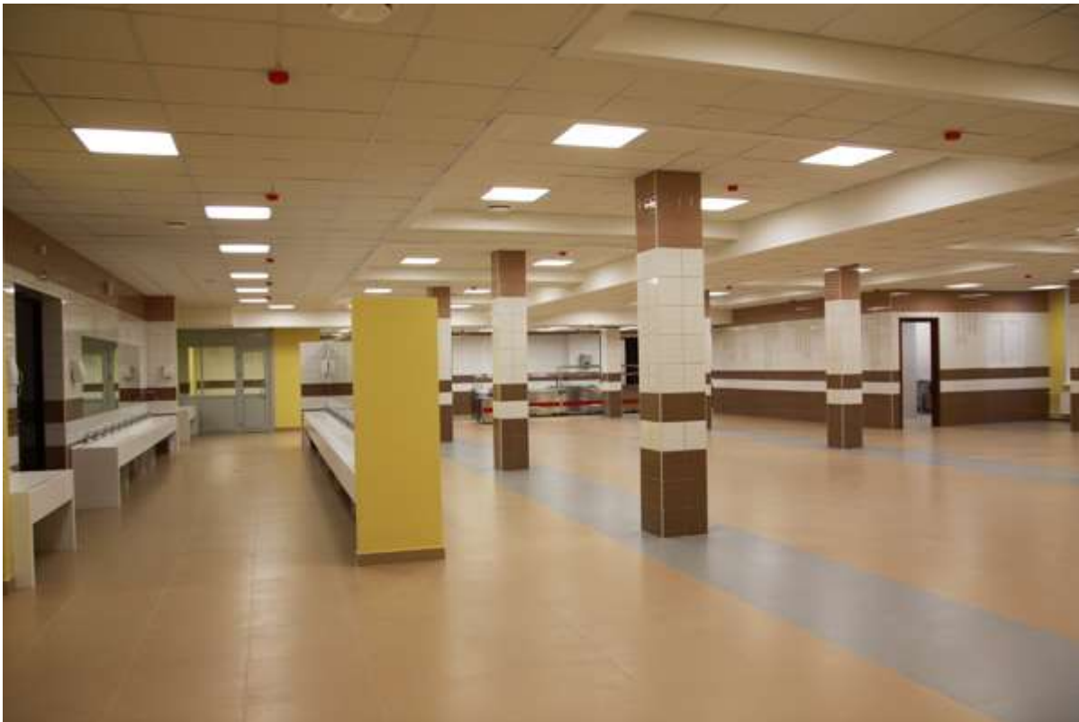
Столовая для старших классов