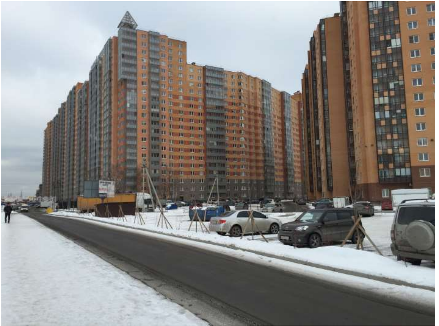
Вид с Областной улицы на секции (слева направо) 17-7