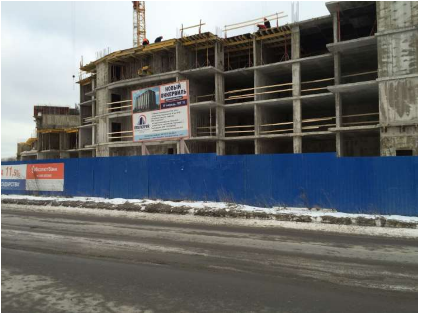
Вид на секции 2-3 с Областной ул.