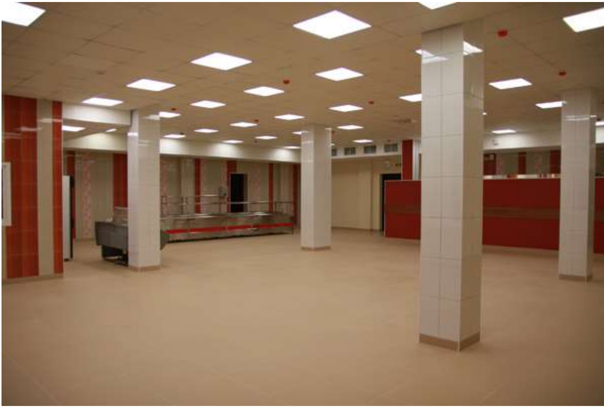
Столовая для младших классов