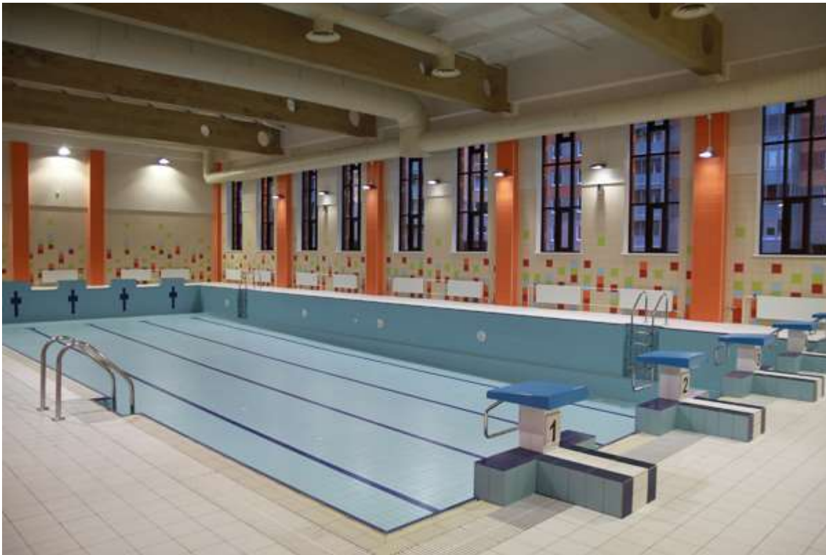
25-метровый бассейн на 5 дорожек