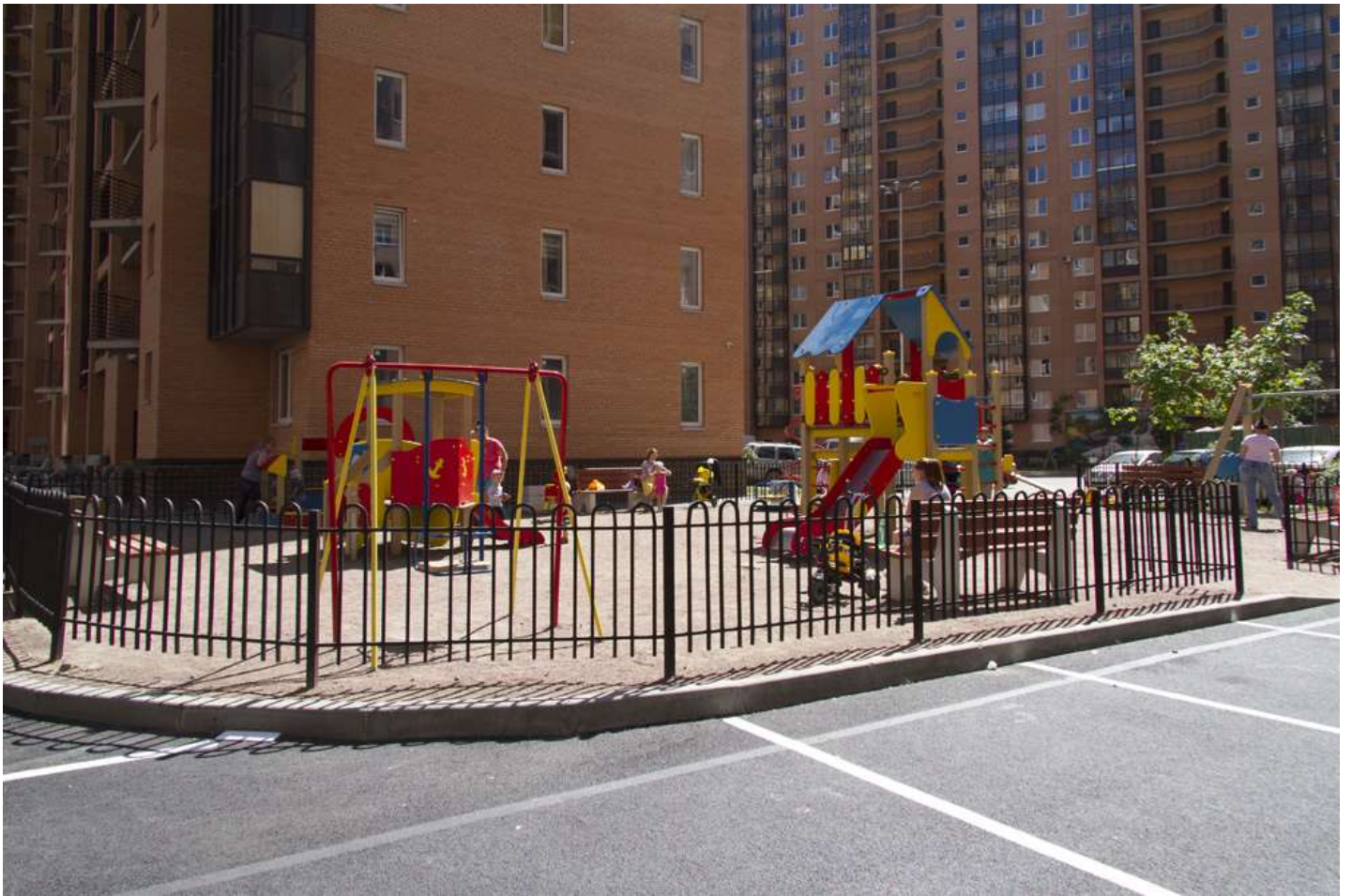
Благоустройство двора в 1-2-м пусках 3 очереди