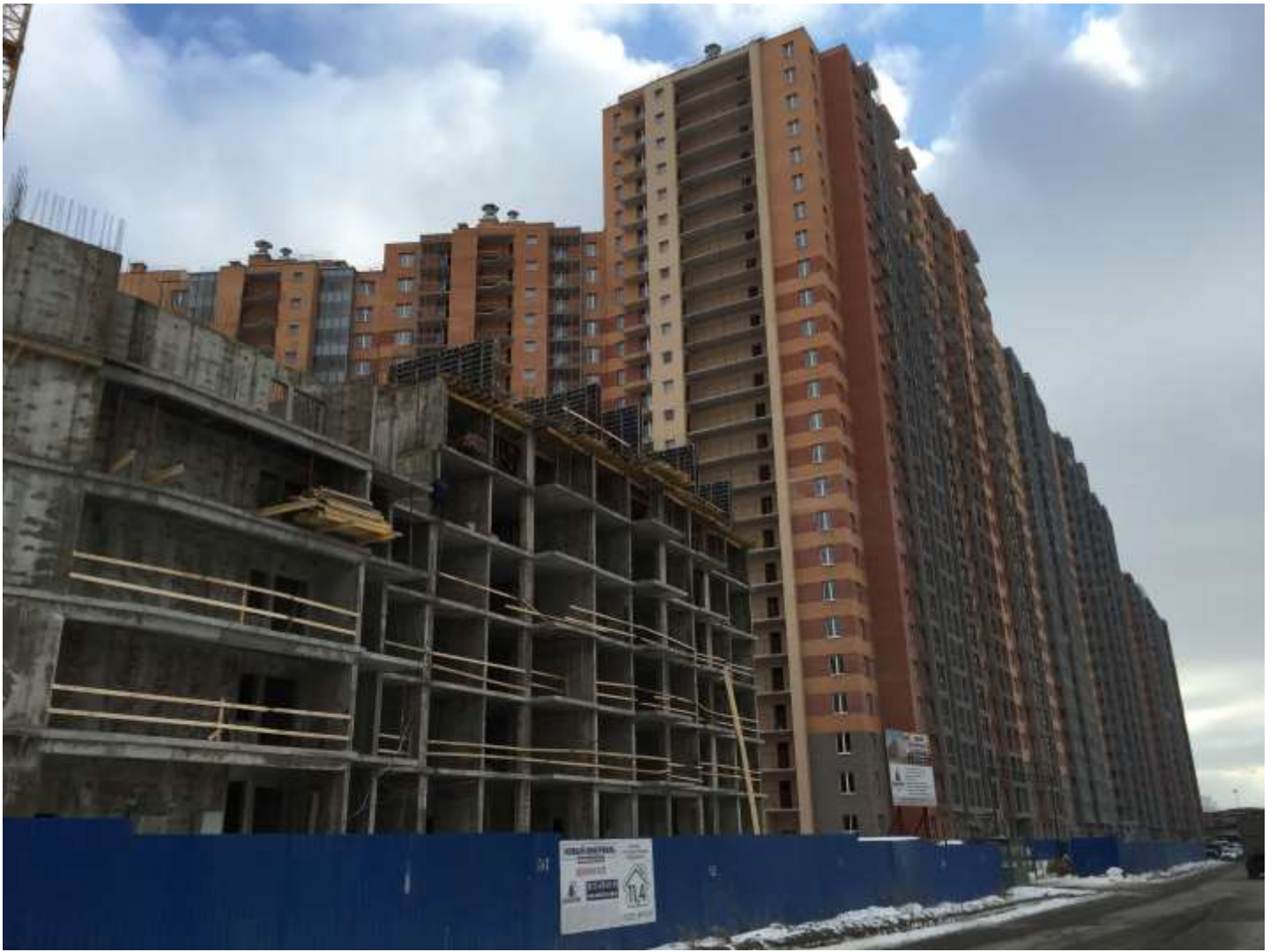
Вид на секции 1-2 с Областной ул.