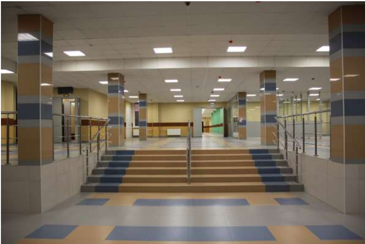
Вход для старших классов