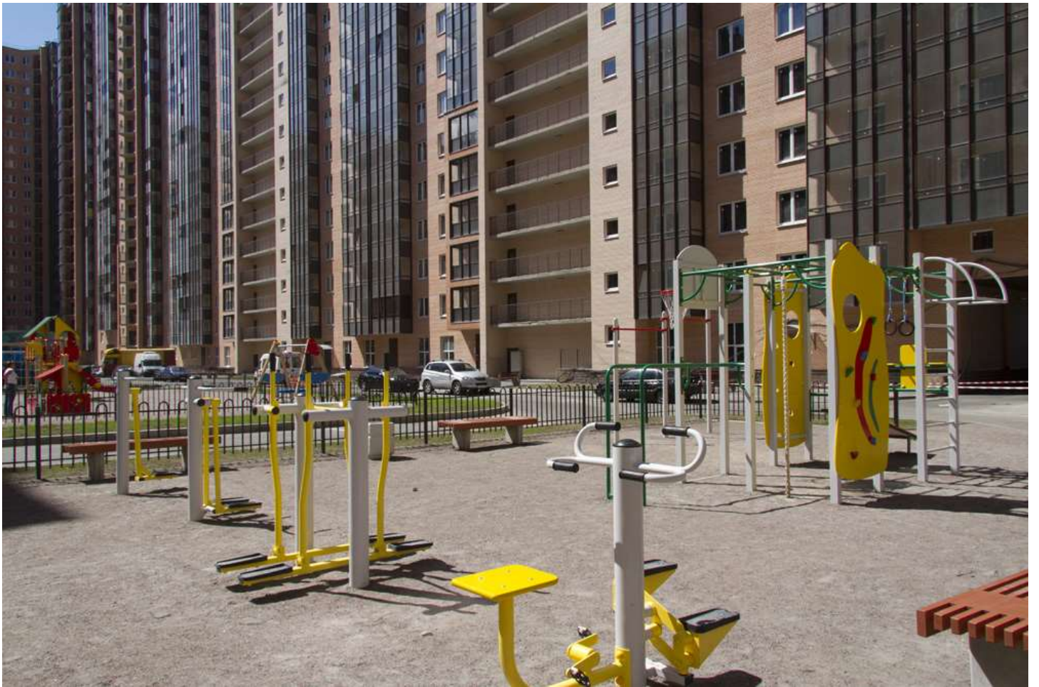
Благоустройство двора в 3-м пуске 3 очереди