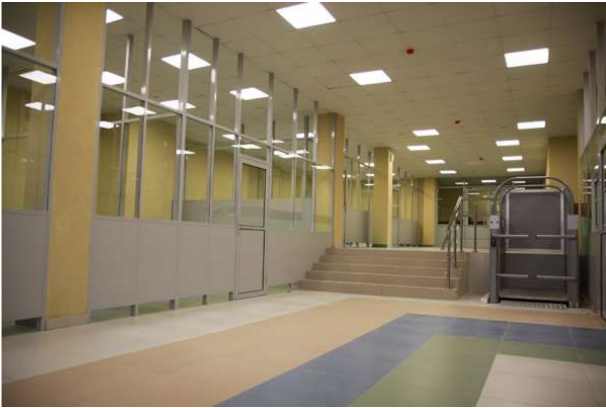
Вход для младших классов классов