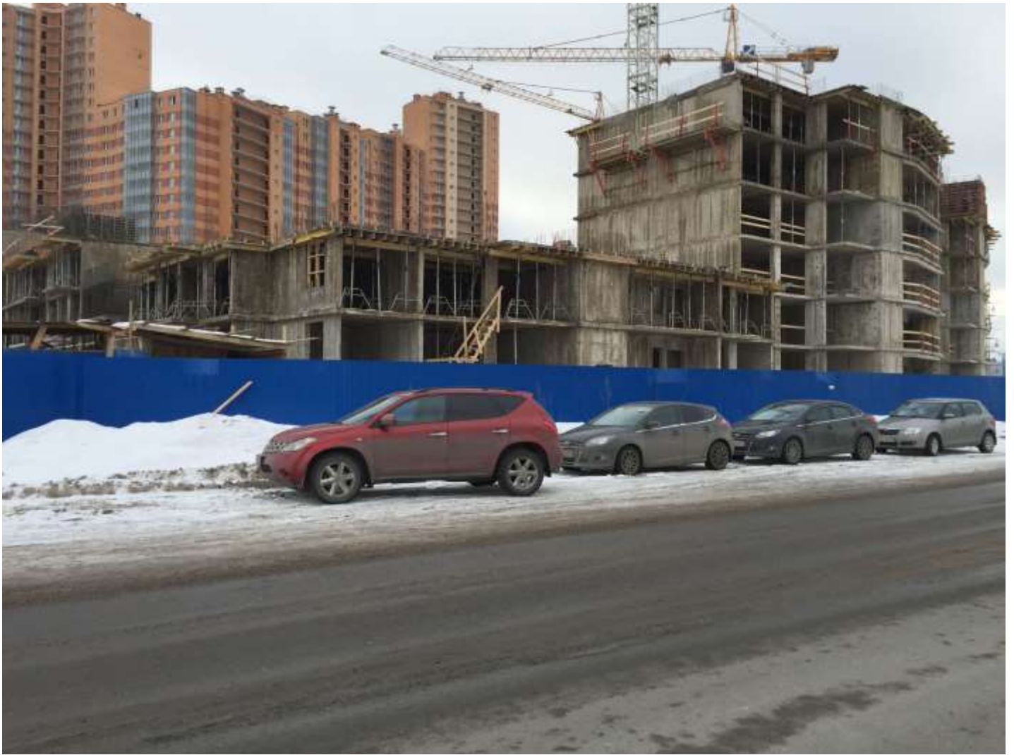
Вид на секции 9-7 со стороны Областной ул.