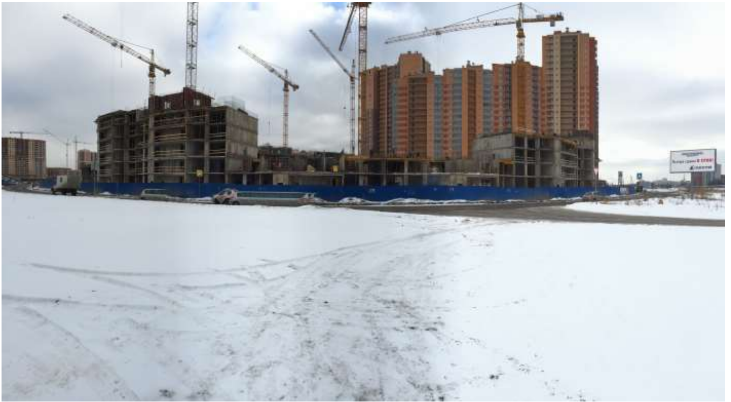
Вид на секции 8-1 (слева направо) со стороны Областной ул.