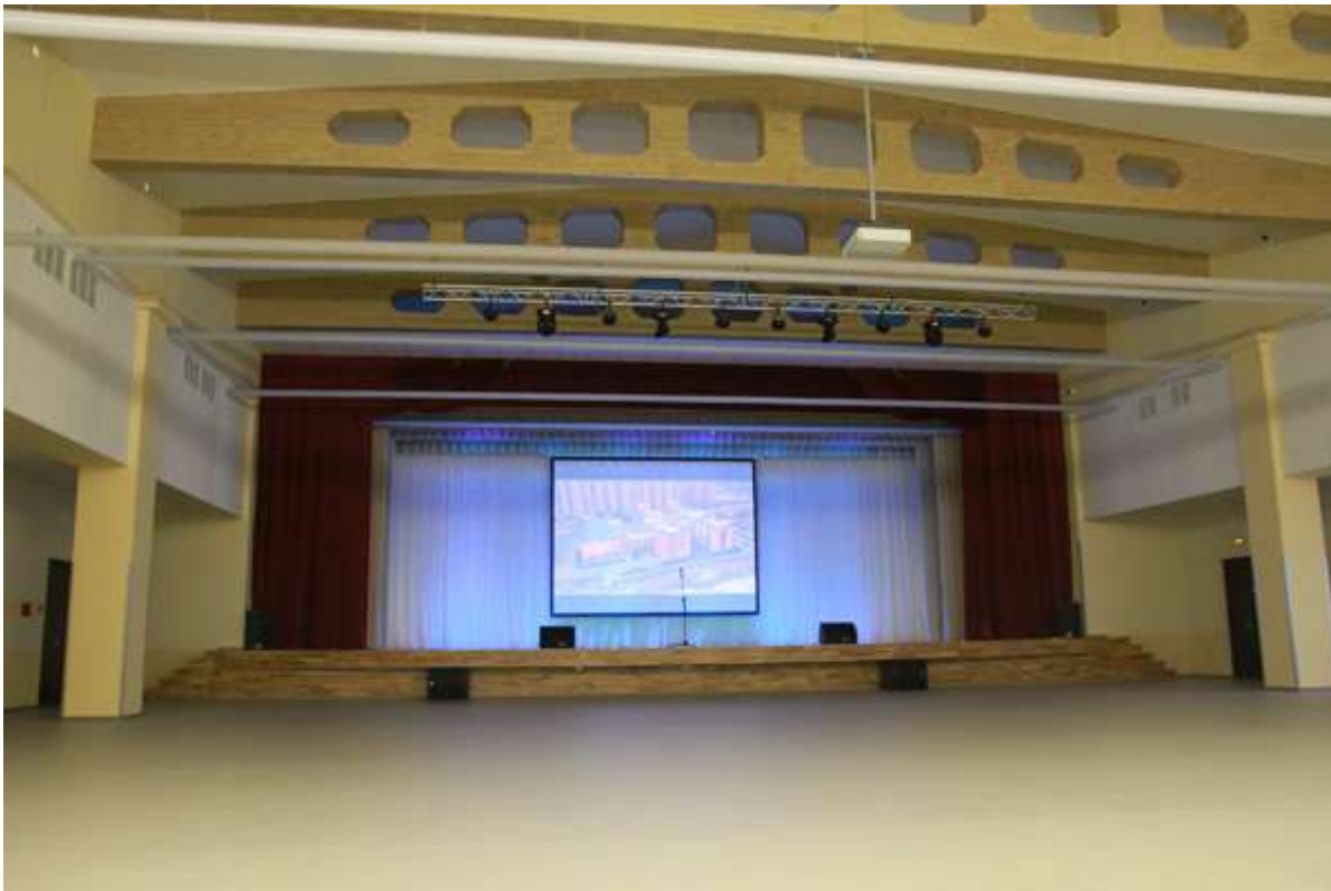
Актовый зал на 600 мест