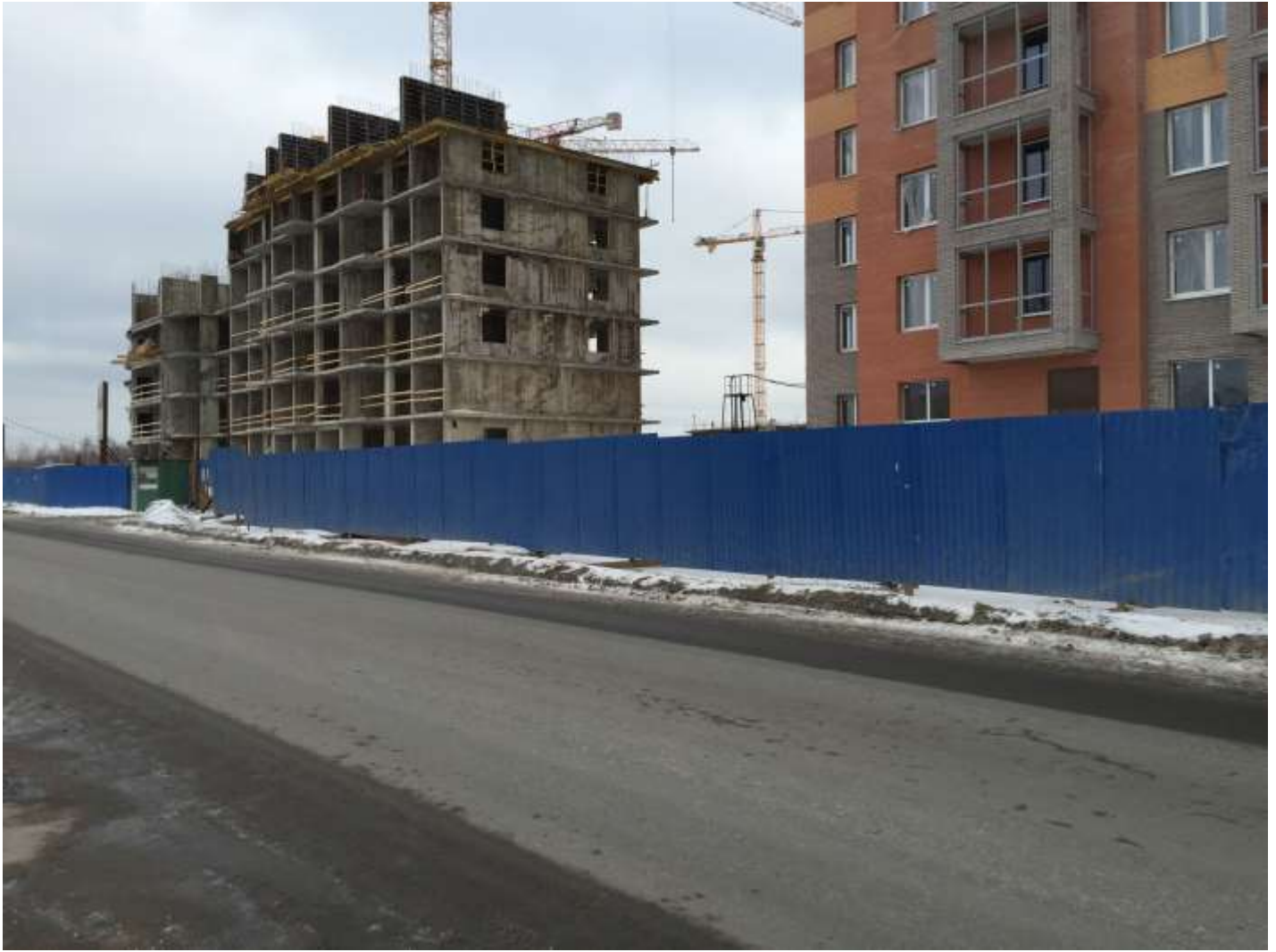
Вид на секции 1-2 с ул. Областная