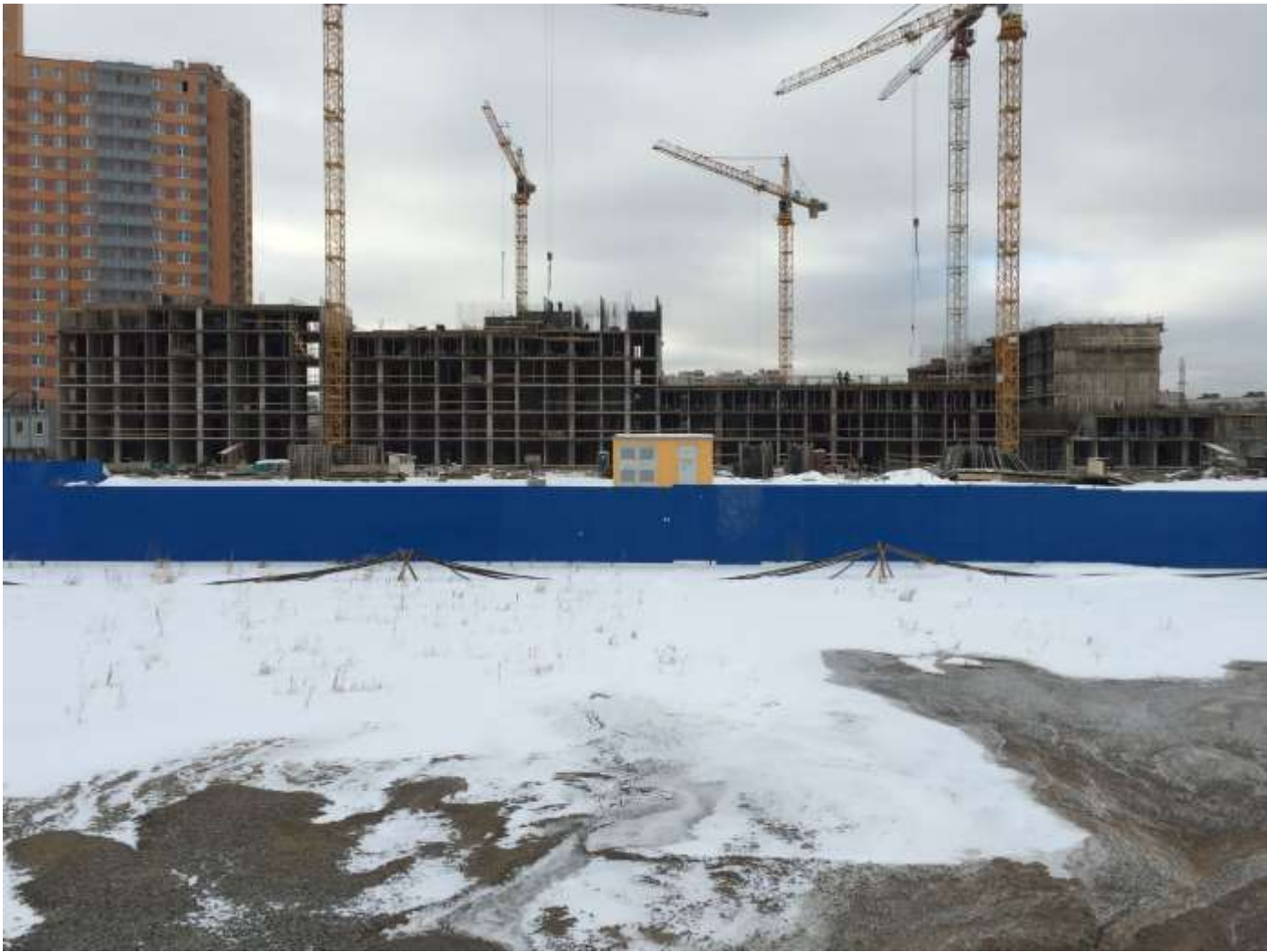
Вид на секции 11-7 со стороны Областной ул.