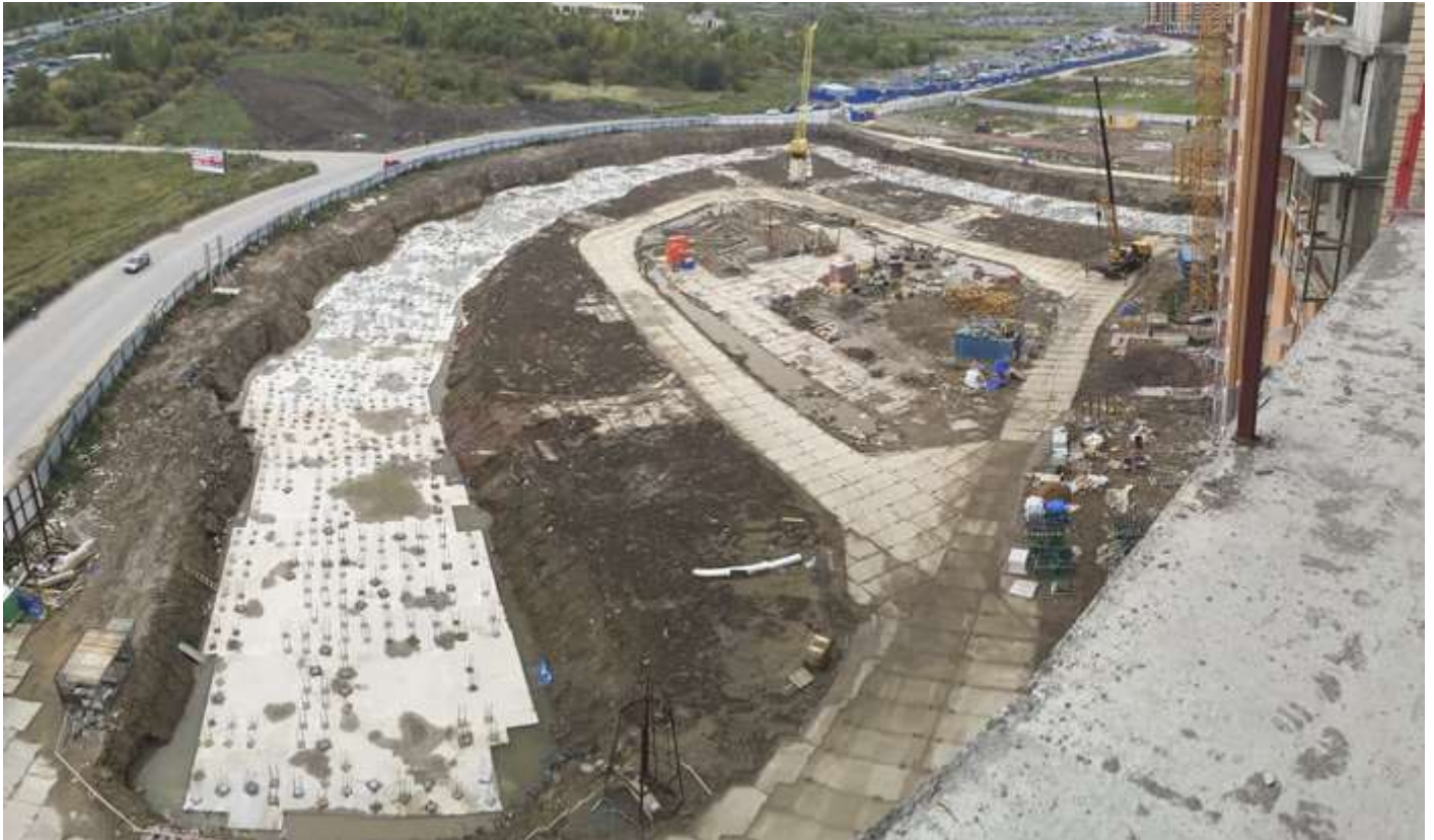
Фото от 30.09.2015

Закончены работы по забивке свай. Завершена разработка котлована и основание под фундаментную плиту.