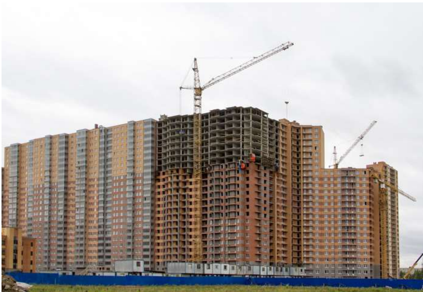
Вид со стороны Областной улицы, секции 6-4, 35-29, 25-19