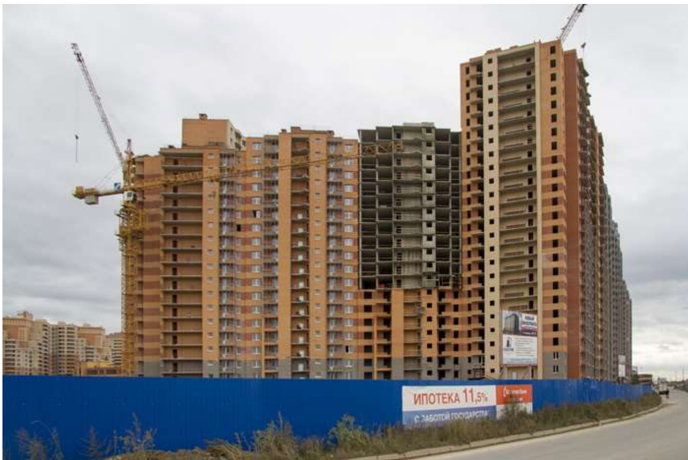
Вид со стороны Областной ул., секции 24-12