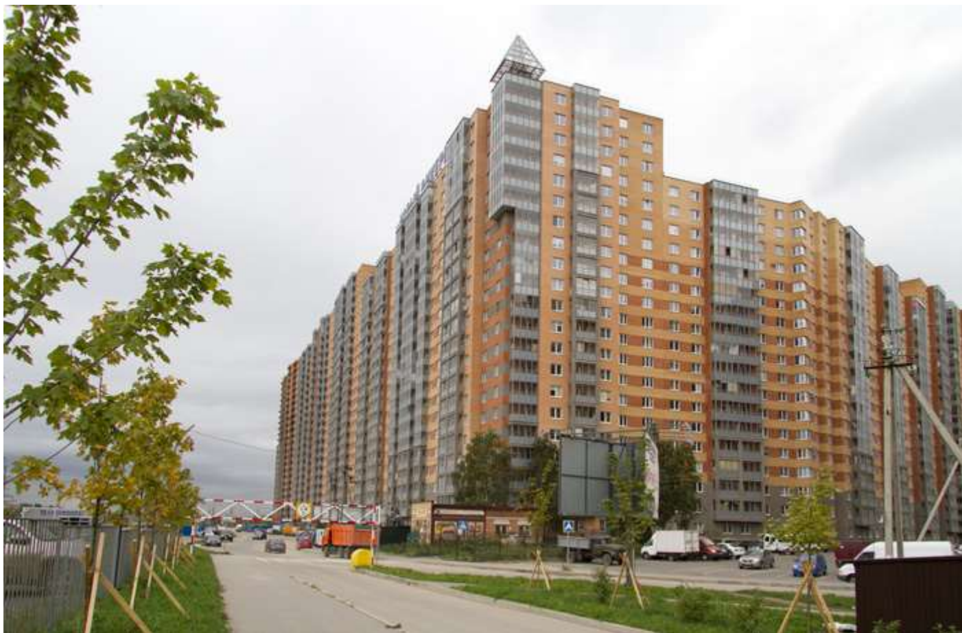
Вид с Областной улицы на секции (слева направо) 17-7