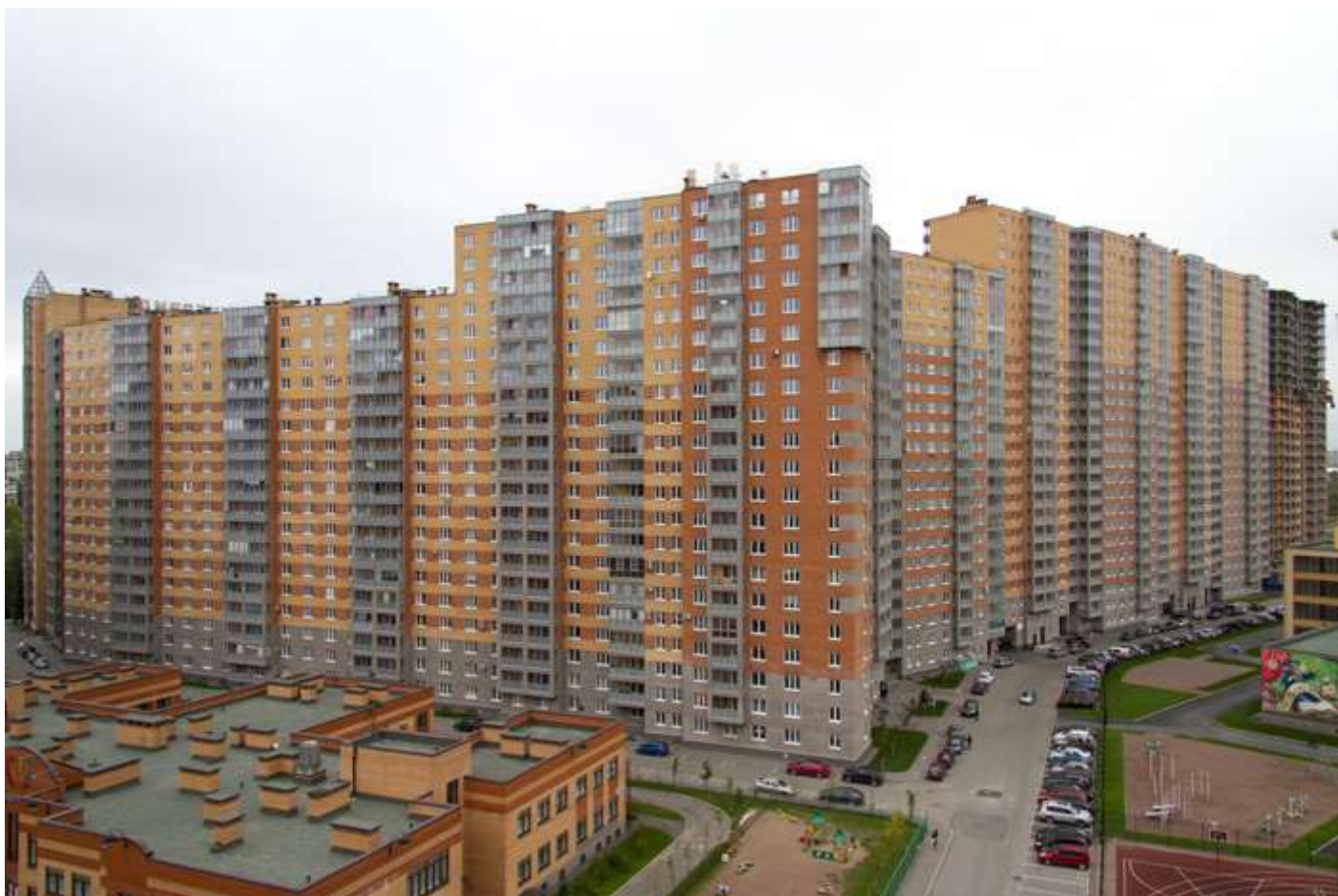
Вид со стороны 1-ой очереди на секции 12-4, 35-24