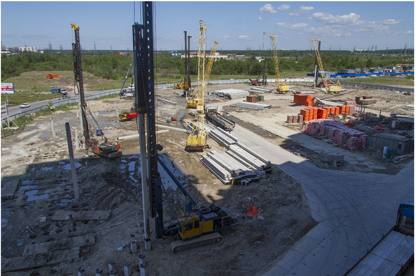
Секции 1-11, вид с 4-го пуск 3-й очереди