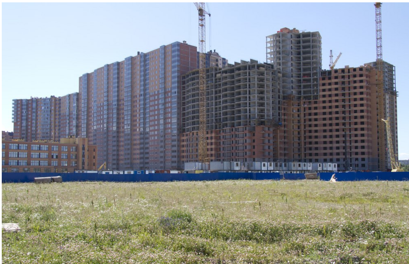
Вид со стороны Областной улицы, секции 6-4, 35-29, 25-19