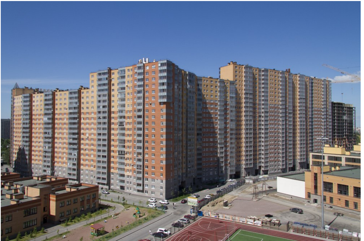
Вид со стороны 1-ой очереди на секции 12-4, 35-24