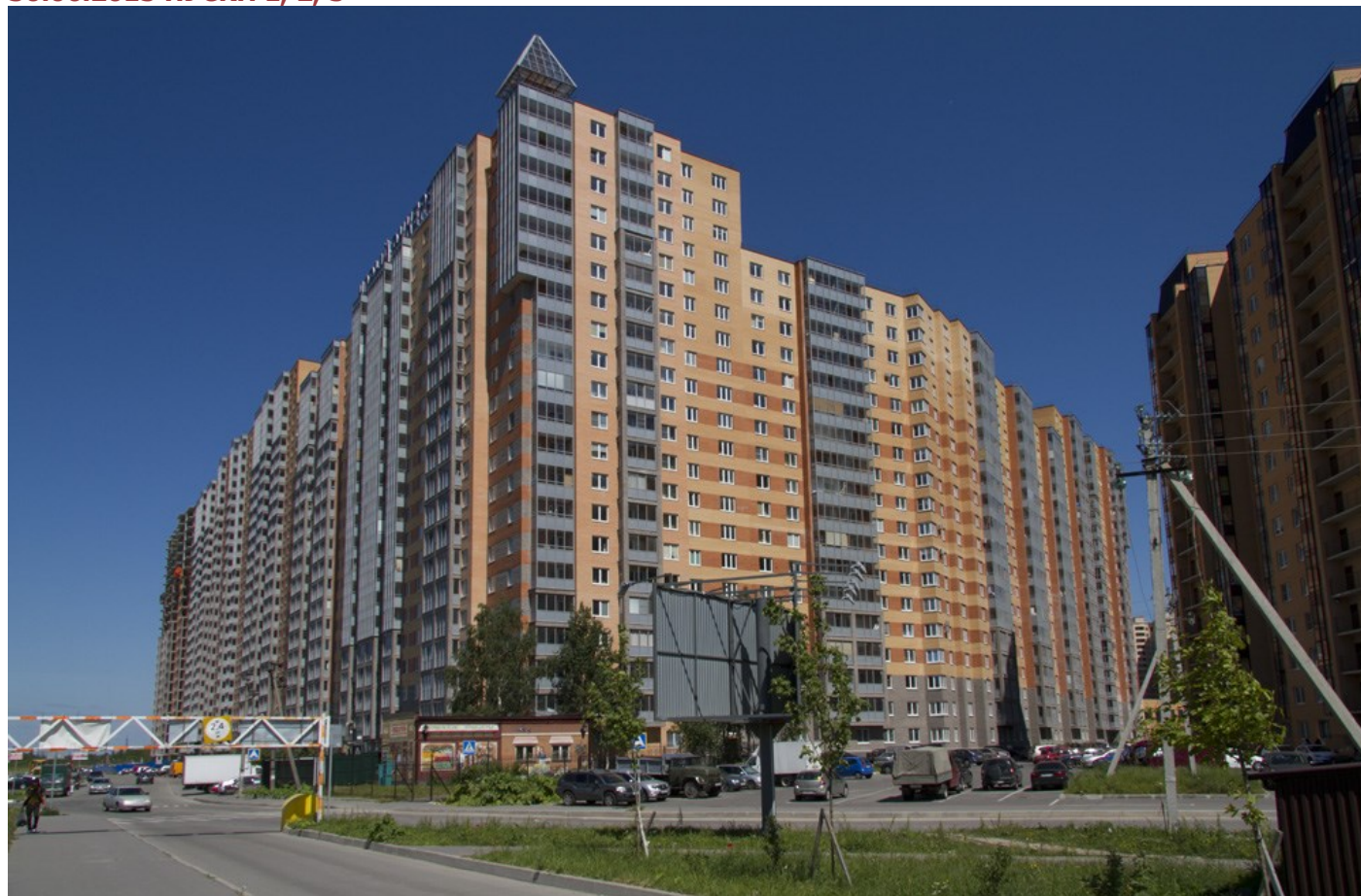
Вид с Областной улицы на секции (слева направо) 17-7