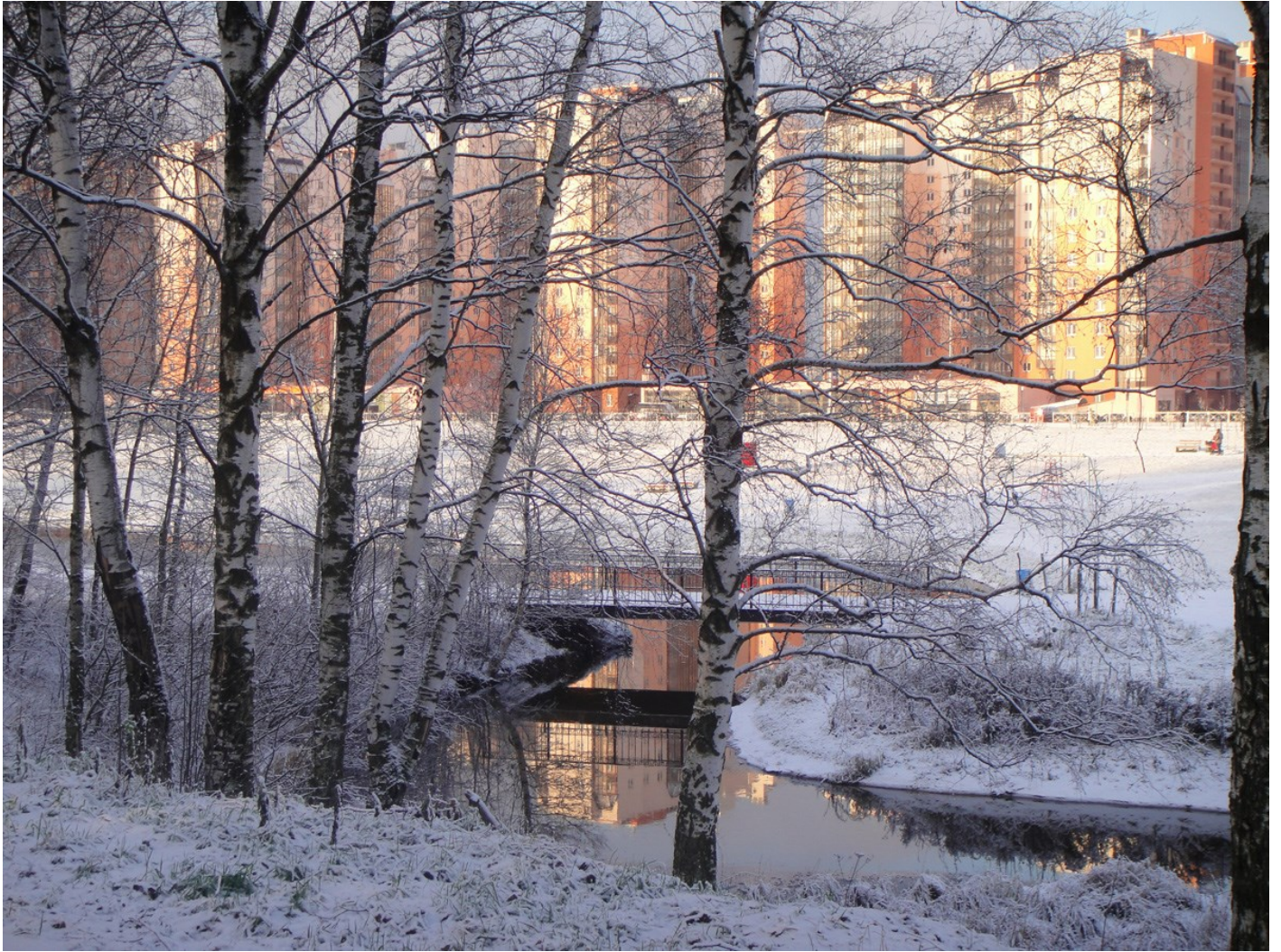
ВО ДВОРЕ - ДЕЙСТВУЮЩИЙ ДЕТСКИЙ САД С НАЧАЛЬНОЙ ШКОЛОЙ