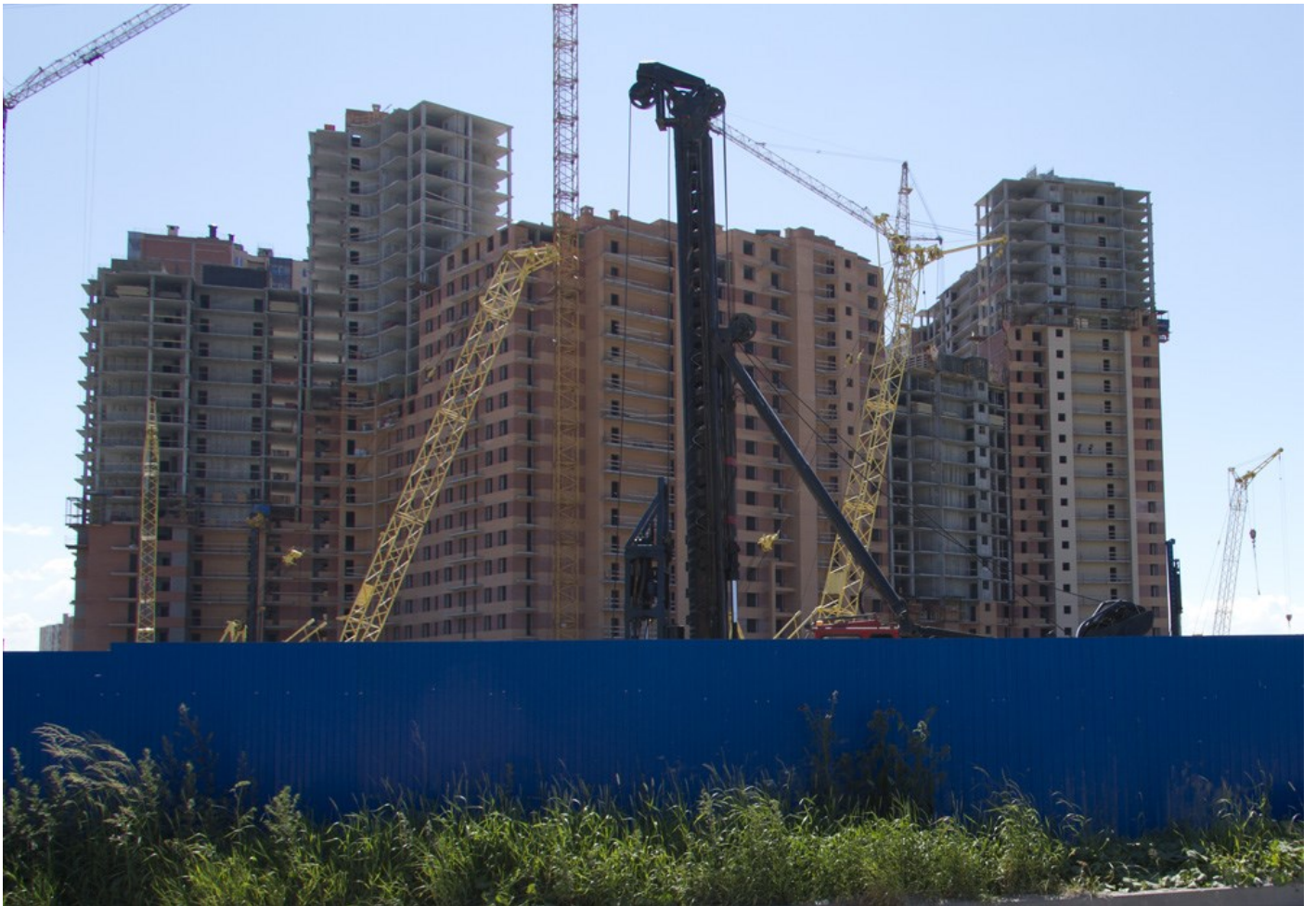
Вид с Областной ул., секции 24-19