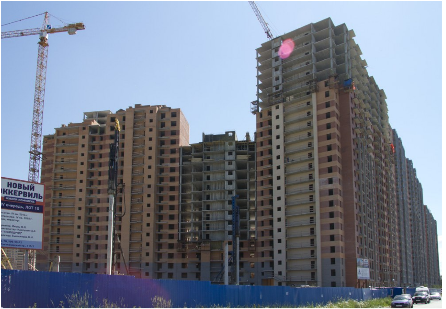
Вид со стороны Областной ул., секции 24-12