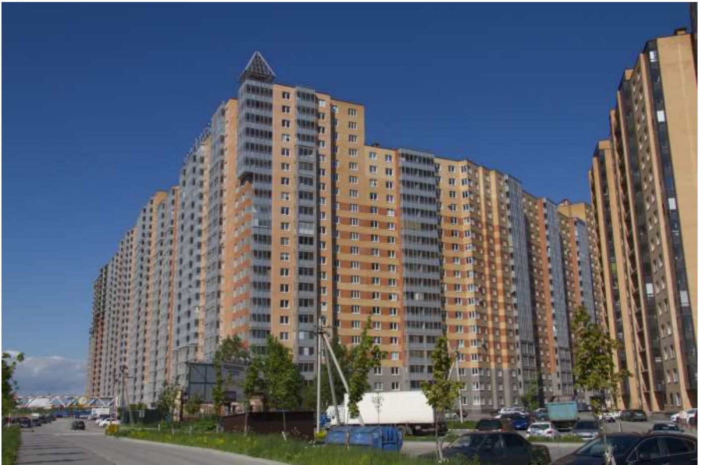
Вид с Областной улицы на секции (слева направо) 17-7