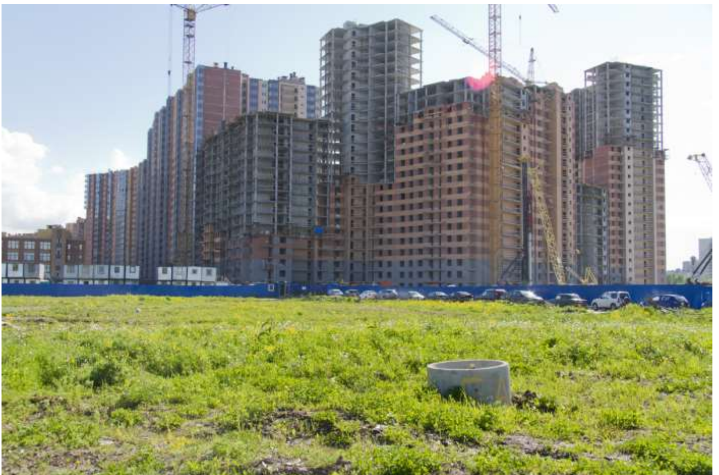
Вид со стороны Областной ул., секции 6-4, 35-34, 30-26, 25-22