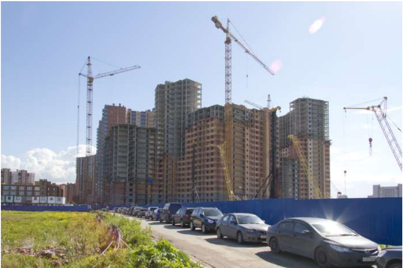
Вид со стороны Областной улицы