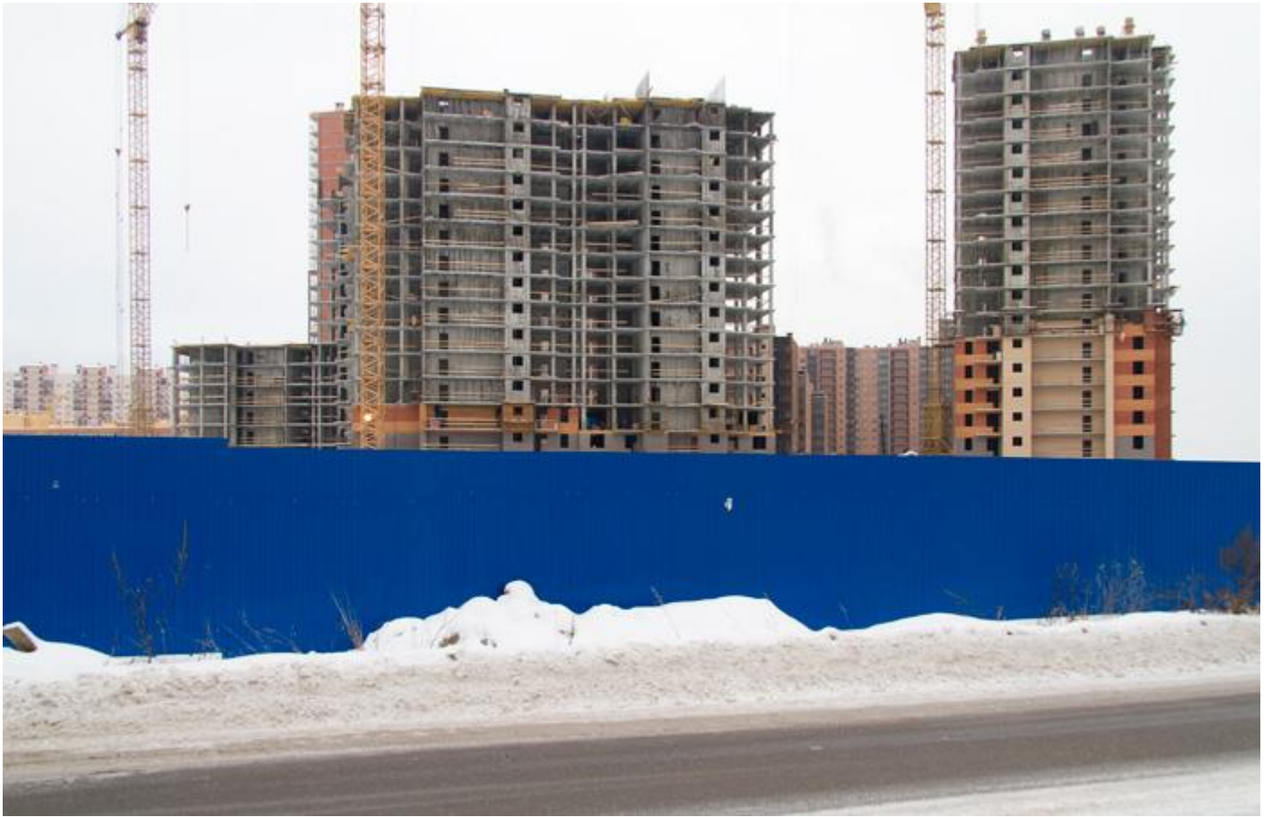
Вид с Областной ул. на секции 25-22, 18-19