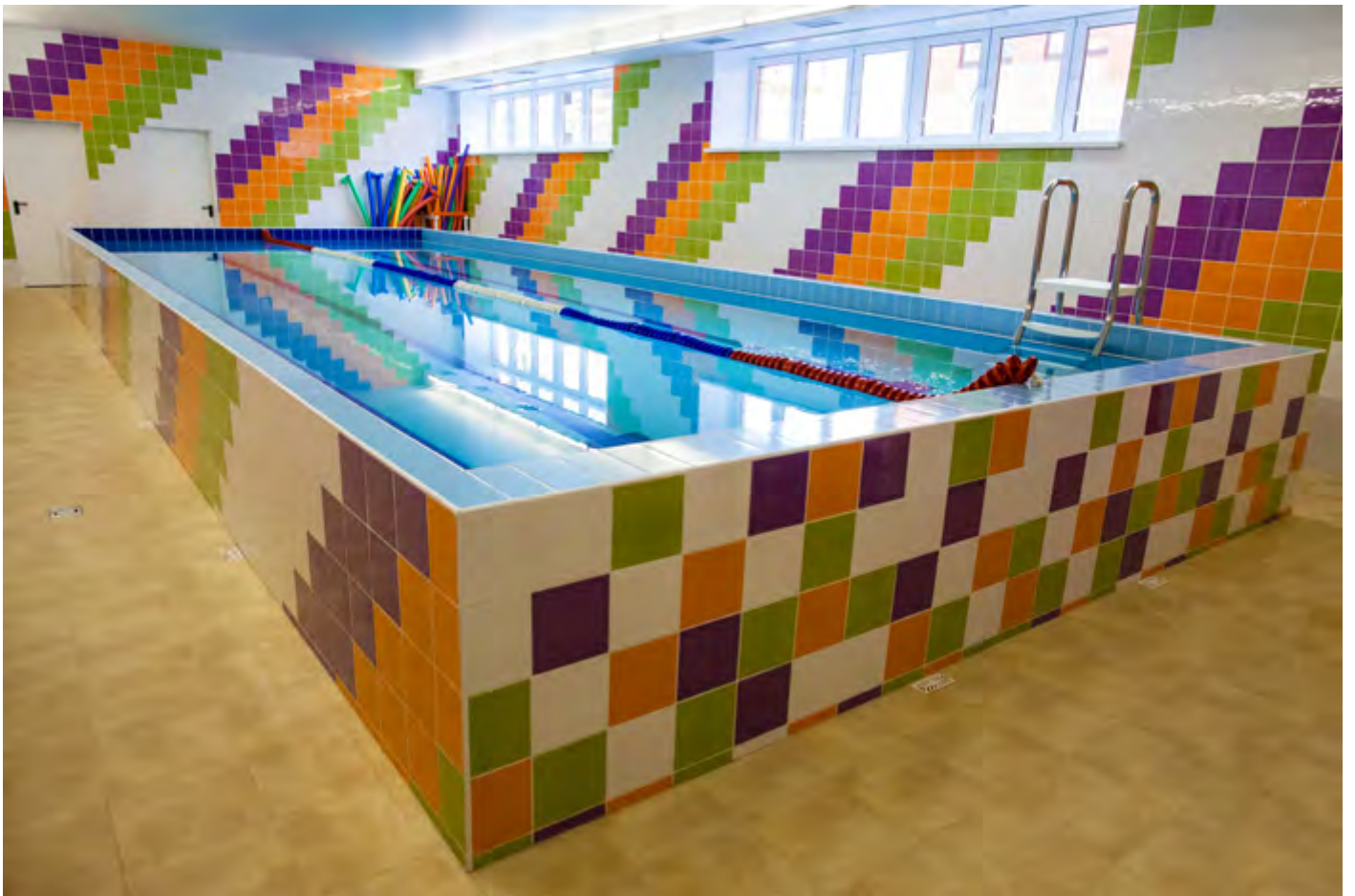
Под окнами - действующий спортивный комплекс с бассейном и ледовой ареной