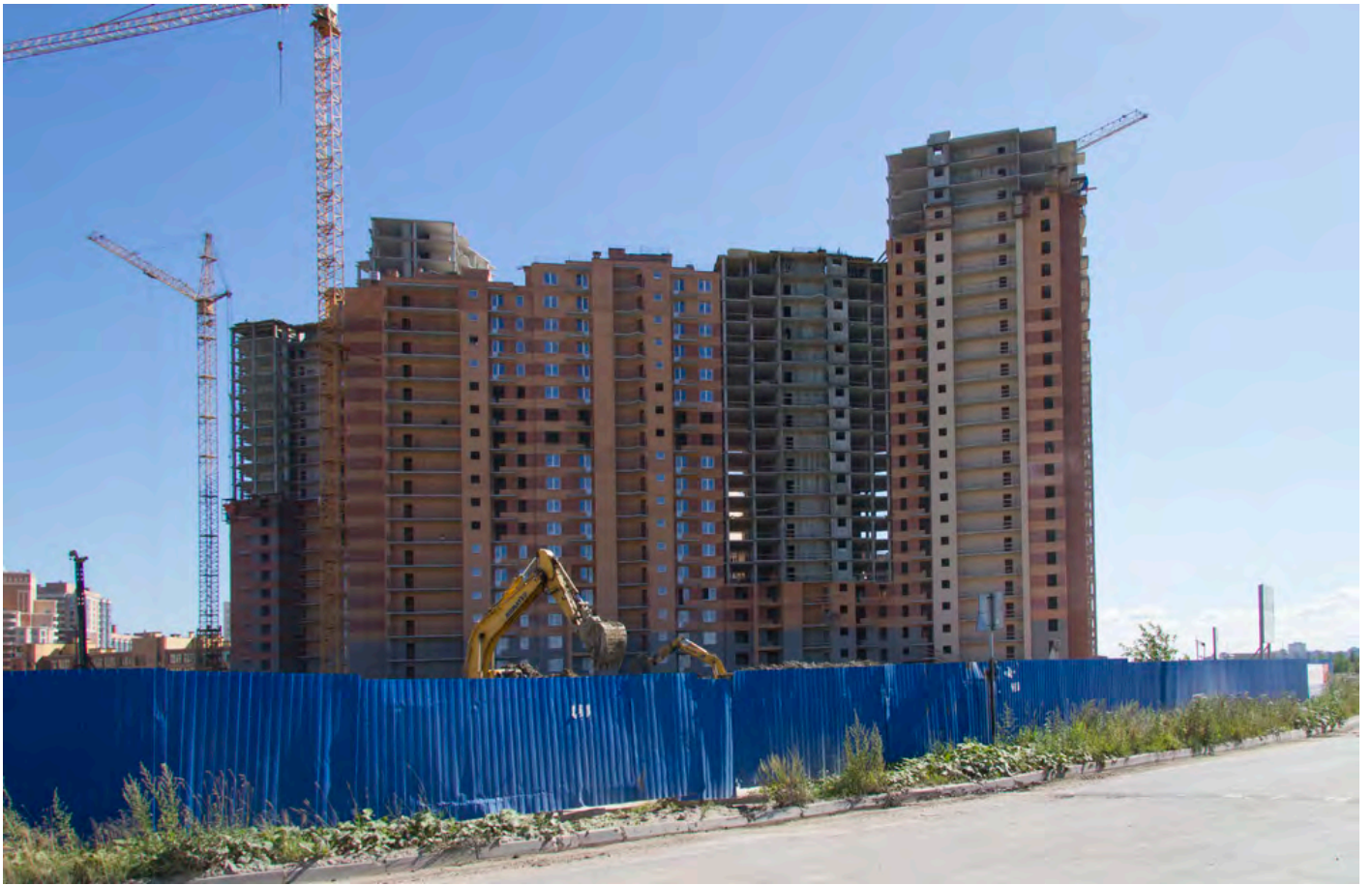
Вид с Областной ул., секции 24-19