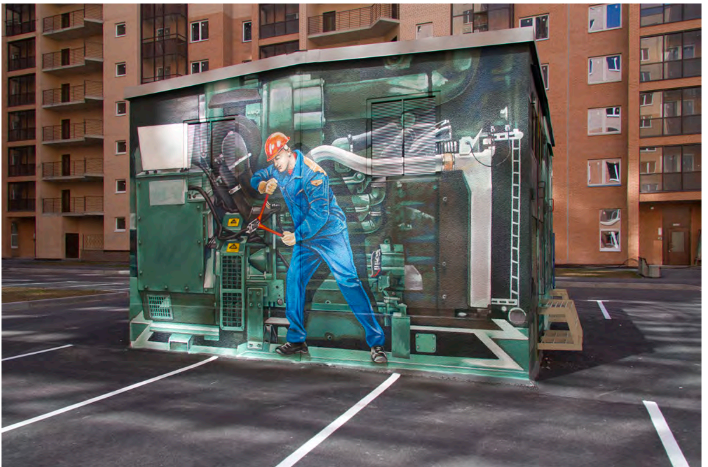
Новые арт-объекты во дворе 3-го пуск 3 очереди