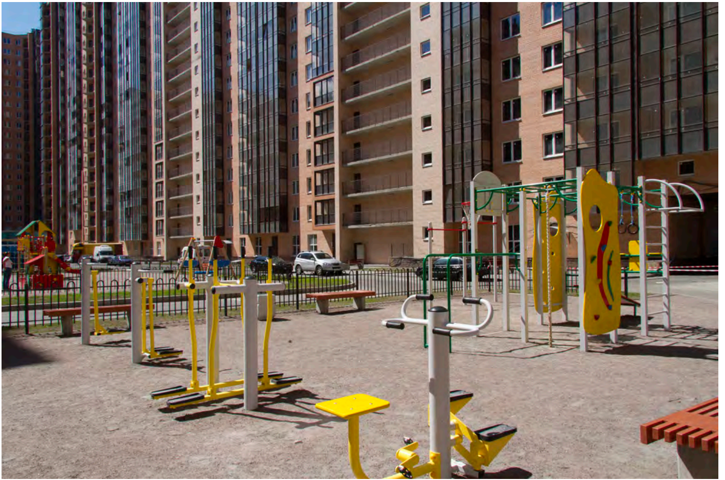
Благоустройство двора в 3-м пуске 3 очереди