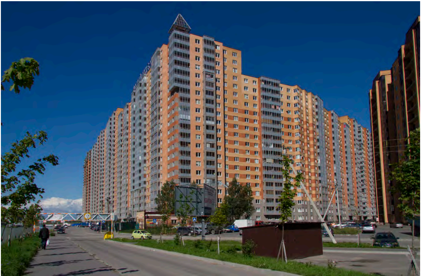
Вид с Областной улицы на секции (слева направо) 17-7