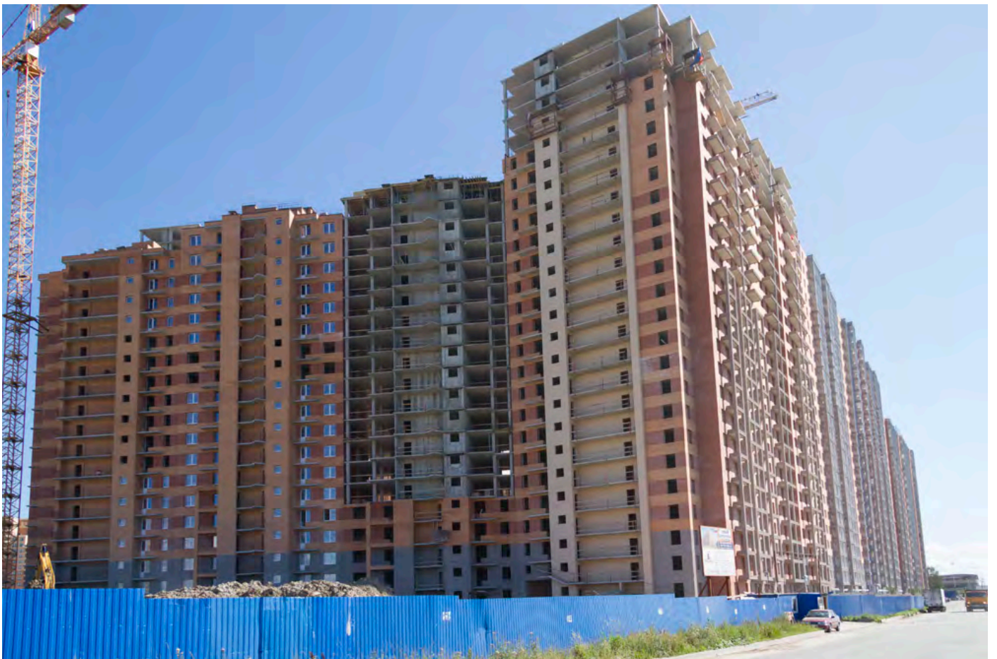
Вид со стороны Областной ул., секции 24-12