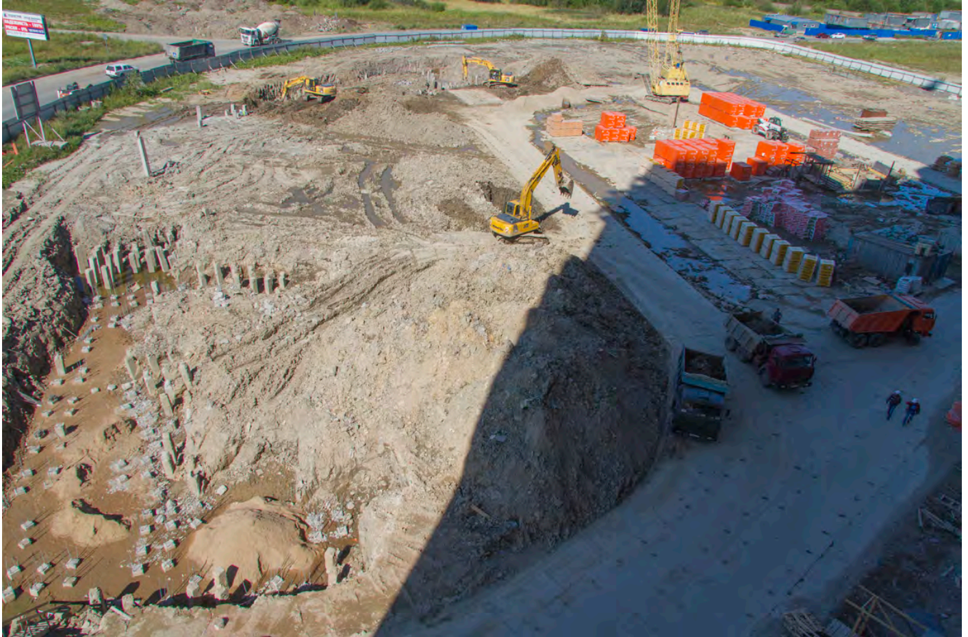
Фото от 04.08.2015

Закончены работы по забивке свай. Приступили к испытаниям свай и разработке котлована. Выполняется забивка свай под башенные краны.