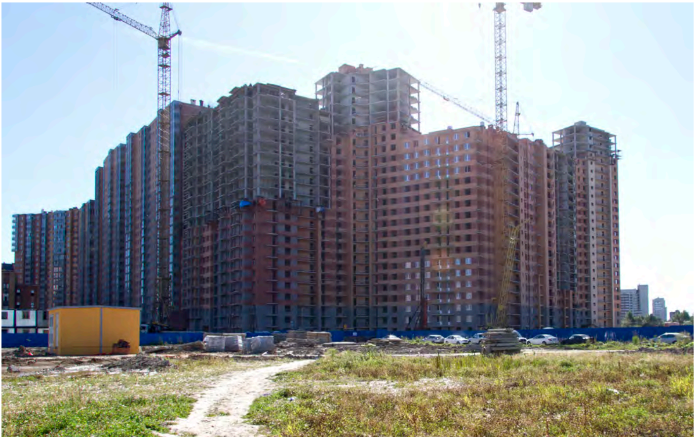
Вид со стороны Областной улицы, секции 6-4, 35-29, 25-19