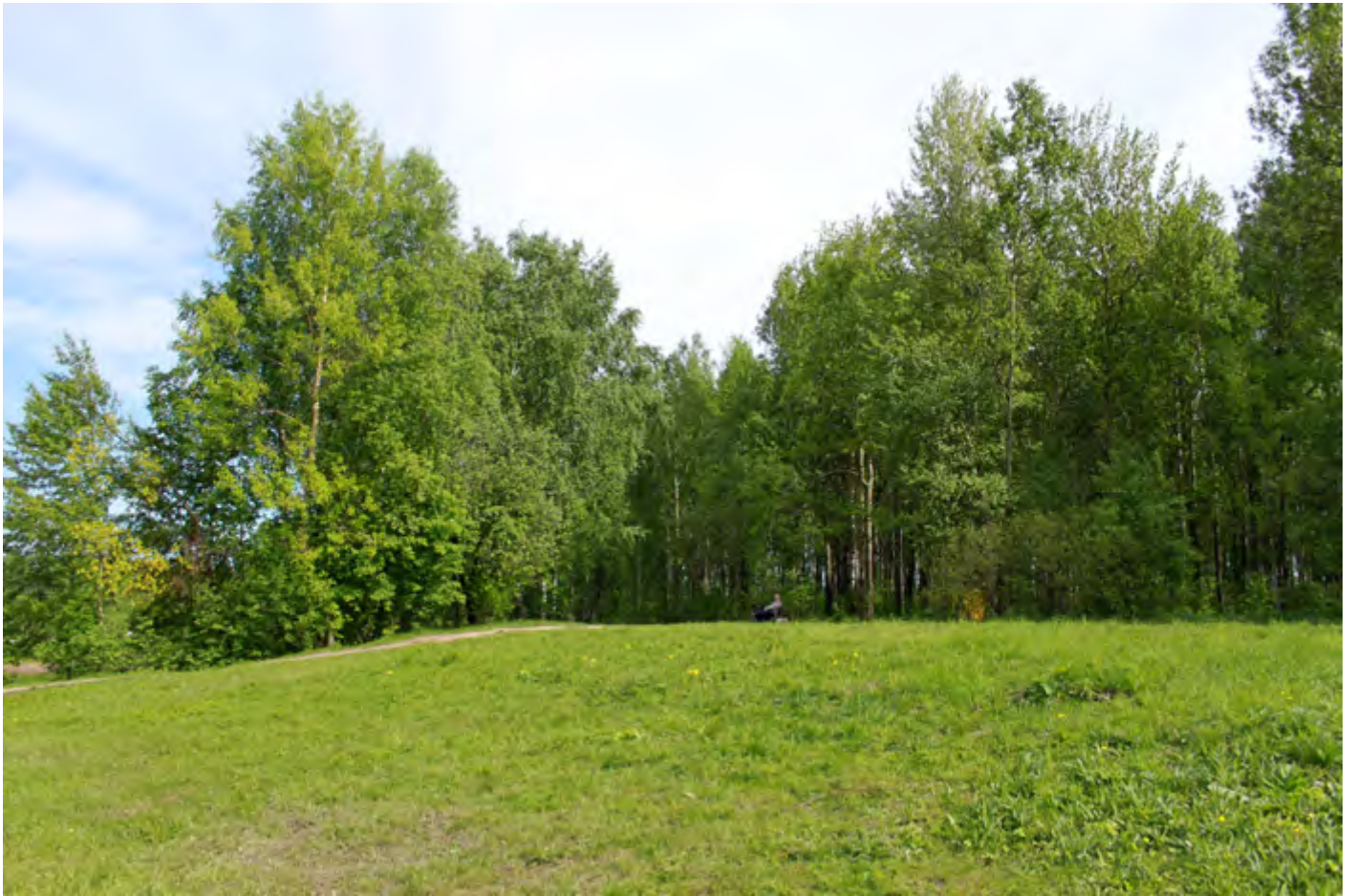
Парк Оккервиль зимой