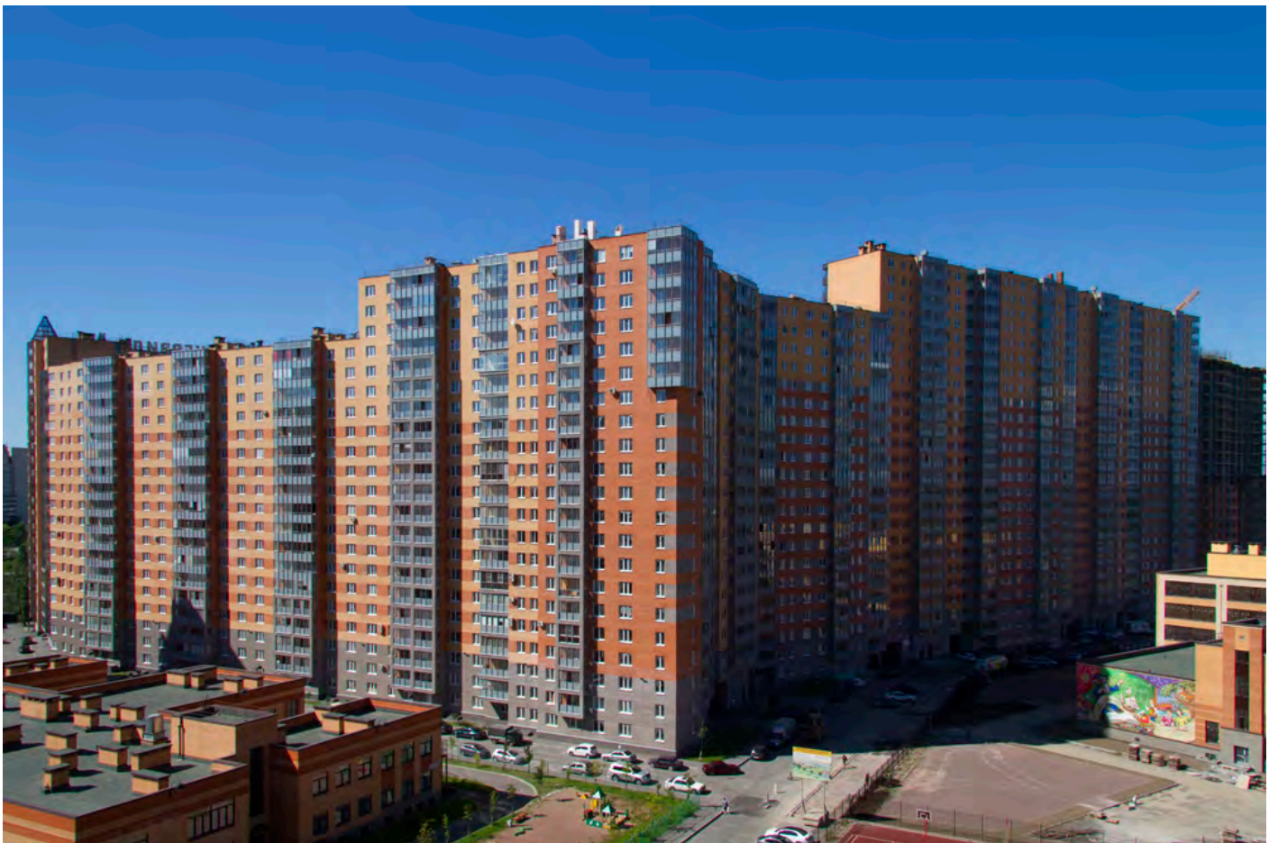
Вид со стороны 1-ой очереди на секции 12-4, 35-24