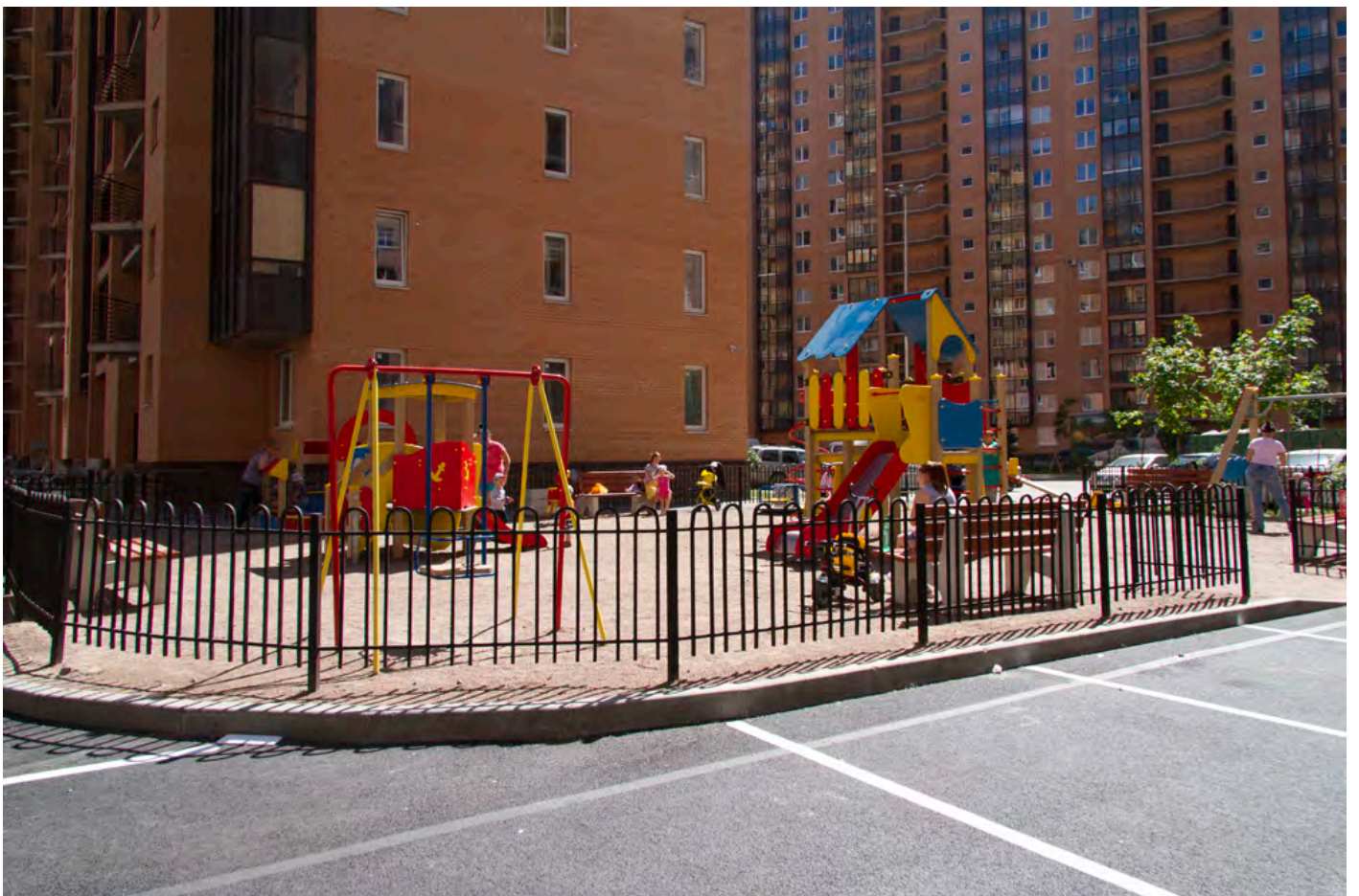
Благоустройство двора в 1-2-м пусках 3 очереди